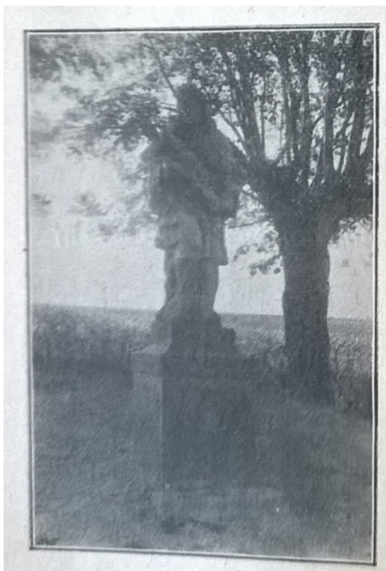
6. Petrovice , sv. Jan Nepomucký, 1723, vápenec, na cestě k Měcholupům