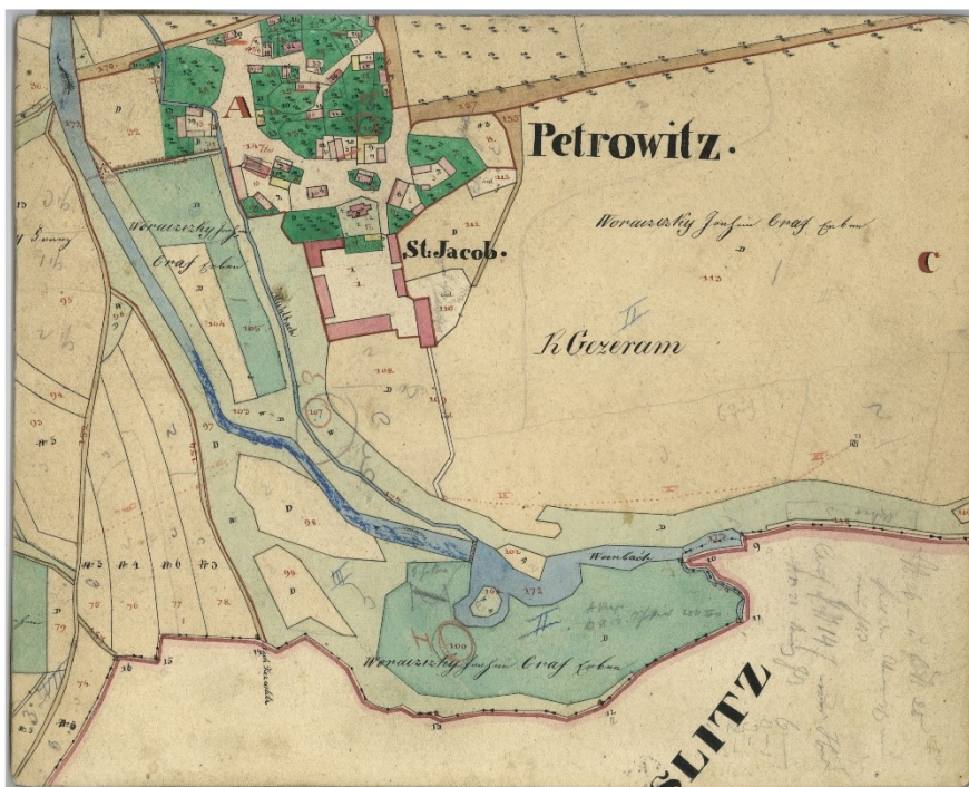
1. Petrovice, sakrální centrum se zámečkem, indikační skizzy, 1841