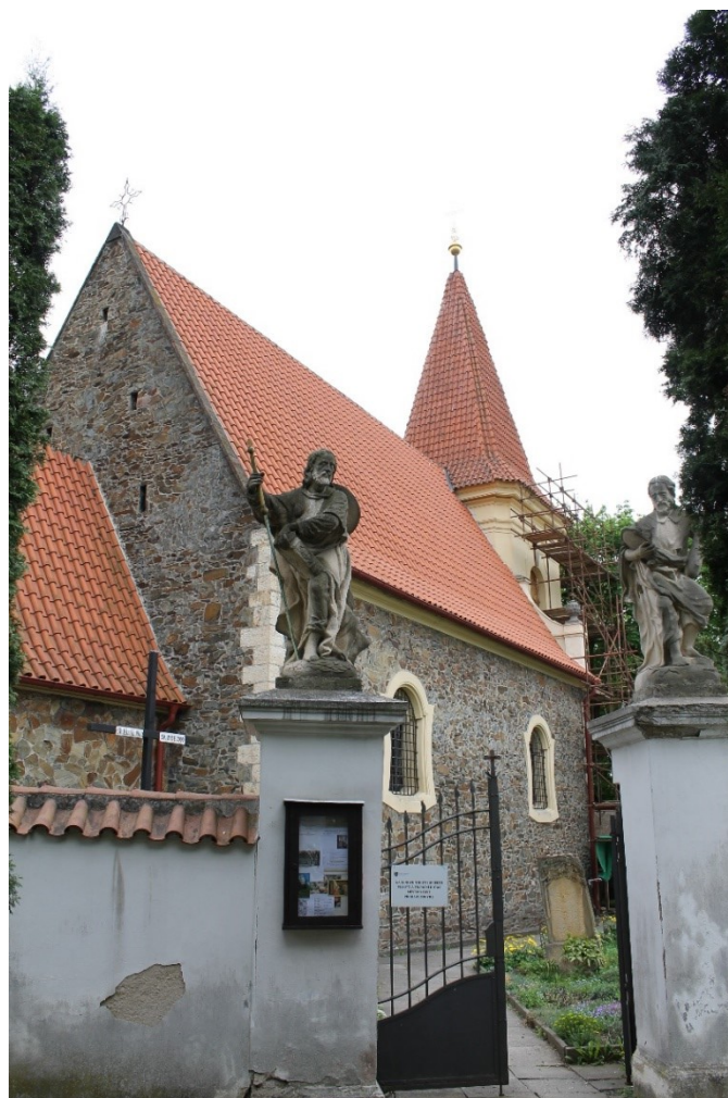
9. Petrovice , kostel sv. Jakuba, druhá polovina 13. stol., pohled ze severovýchodu