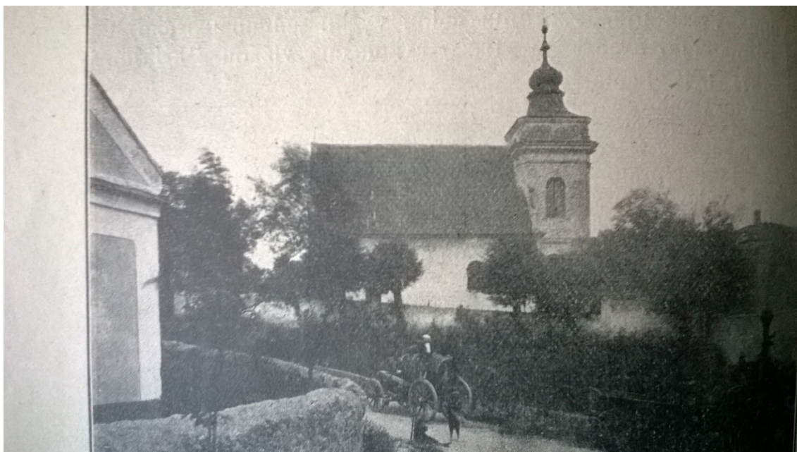
8. Petrovice , kostel sv. Jakuba, před regotizací v roce 1910, pohled ze severu