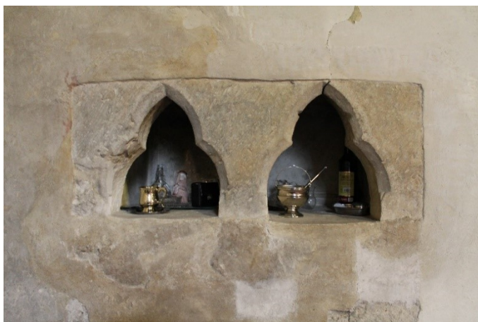
3. Petrovice, kostel sv. Jakuba, foto otvorů výklenku