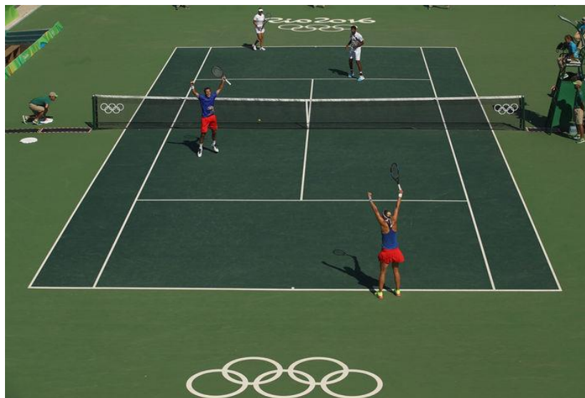
Obrázek 14 - Radek Štěpánek a Lucie Hradecká na OH 2016

Letní olympijské hry v Rio de Janeiru 2016 byly pro české tenisty rovněž vydařené. Již zmíněnou bronzovou medaili ze smíšené čtyřhry Radka Štěpánek a Lucie Hradecké, doplnila ženská dvojka Lucie Šafářová a Barbora Strýcová další bronzovou medailí z ženské čtyřhry. Třetí a zároveň poslední bronz získala Petra Kvitová z ženské dvouhry.