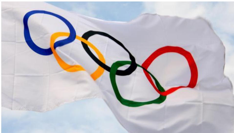
Obrázek 8 - olympijská vlajka 99

Novodobé Olympijské hry jsou nejvýznamnější mezinárodní sportovní slavností současnosti a významnou kulturní událostí. Je to místo mezinárodního setkání mládeže, kde všichni mají společný cíl a sdílejí společné nadšení. Olympijské hry jsou ojedinelé svou politickou neutralitou, výchovným a kulturním pojetím, zásadou čestného soutěžení, přátelstvím mezi národy a světovým mírem. Vítězství na olympijských hrách je největším snem každého sportovce. Pokud se sportovci podaří zvítězit na olympijských hrách, považuje se to za jeden z největších vrcholů jeho kariéry, který nezdárka přinese popularitu jemu i konkrétnímu sportu v dané zemi. Mnoha sportovcům se povedlo zviditelnit jejich sport právě díky vítězství či účasti na olympijských hrách. 98