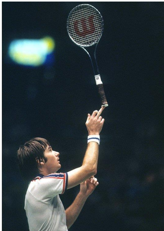
Obrázek 2 - Jimmy Connors se svou raketou Wilson T2000 32

Vedle materiálu na jejich výrobu se začal dále proměňovat i tvar tenisových raket. V roce 1976 vytvořil známý výrobce lyží a tenisový nadšenec Howard Head revoluční raketu Prince. Ta byla charakteristická svou výjimečně velkou hlavou a rozlehlou úderovou plochou. Tato inovace znamenala další zrychlení samotné hry. Rakety obdobné konstrukce vydržely na trhu až do začátku osmdesátých let, kdy se na trhu objevily nové, lehčí a silnější materiály – grafit, boron, skelná vlákna a další kompozitní materiály.