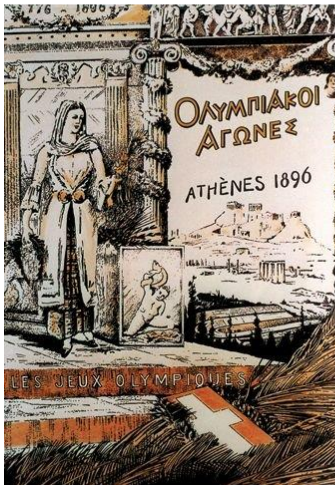
Obrázek 10 - Plakát k první novodobé olympiádě v Athénách 1896 128

pouze člen mezinárodního olympijského výboru Jiří Guth Jarkovský. 127 Hry skončily 15. dubna 1896 a byly považovány za nenadálý úspěch.