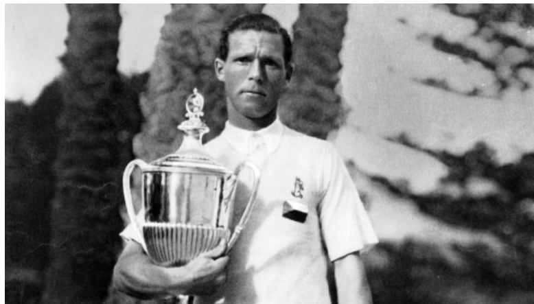
Obrázek 5 - Karel Koželuh 76

amatérských turnajů, a to včetně Grandslamů. Ve světě získával stále větší obdiv a stal se celebritou. Za svou tenisovou kariéru dokázal třikrát vyhrát profesionální mistrovství USA (1929, 1932 a 1937) i obdobný turnaj ve Francii (1930). Proslul dokonalým defenzivním stylem, při němž těžil ze své vytrvalosti, houževnatosti, skvělého pohybu po dvorci a neobyčejně přesné ruky. Osudnou se mu stala jedna cesta zpět do Klánovic, kdy zemřel při autonehodě. V roce 2006 byl uveden do mezinárodní tenisové Síně slávy. 75