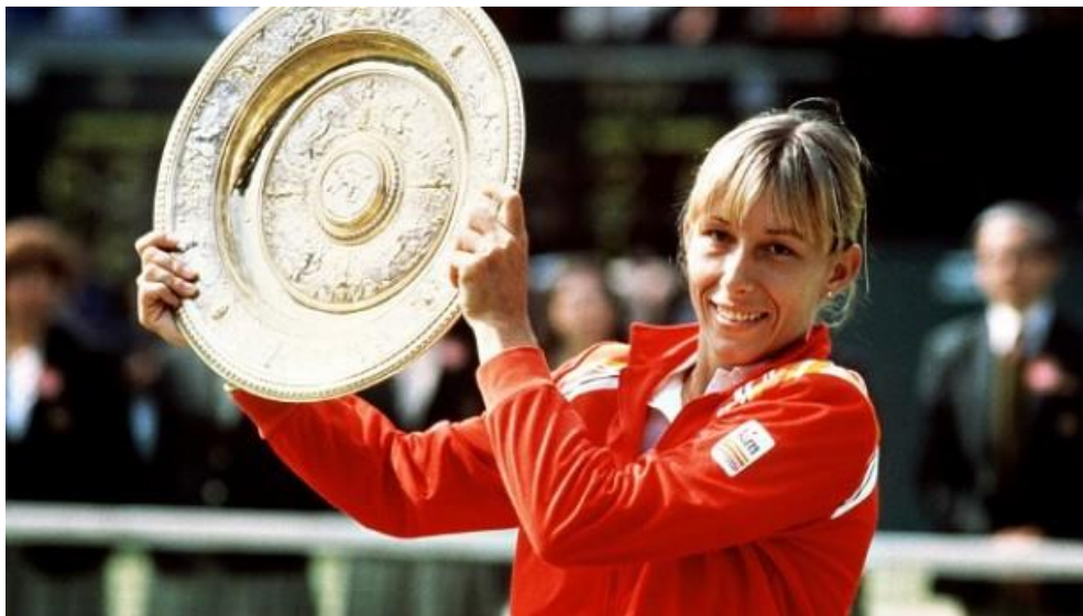
Obrázek 7 - Martina Navrátilová na Wimbledonu 84

Další stránka, ve které je Martina Navrátilová vyniká, je její sportovní dlouhověkost. Ještě v roce 2003 se radovala z vítězství z mixu s indickým tenistou Leanderem Paesem na Australian Open. Svou kariéru završila v roce 2006, kdy ve svých necelých padesáti letech vyhrála s Bobem Bryanem smíšenou čtyřhru na US Open. 83