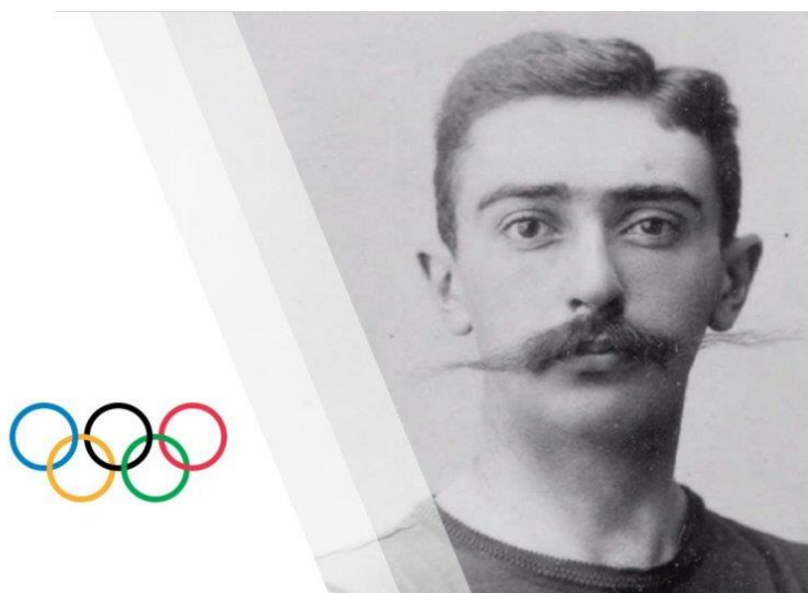
Obrázek 9 - Pierre de Coubertin 112

hledat inspiraci po celém světě. Nejprve zakotvil v Británii, kde pozoroval sportovce na univerzitách. Poté odcestoval do Švédska a Spojených států. Ve všech těchto zemích byla tělovýchova nezbytnou součástí každodenní výuky. Po návratu z cest sepsal tři knihy o pedagogice, ale příliš s nimi neprorazil. 110 Jako zapálený historik svou životní misi nevzdával a přemýšlel dál. V té době prováděl německý archeolog Ernest Curtius výzkum, při kterém se mu podařilo odhalit starověkou Olympii spolu s dalšími poznatky o její historii. Výzkum Pierra inspiroval natolik, že se rozhodl vydat se na cestu obnovy olympijských her, jež byly zakázány v roce 393 n.l. císařem Theodosiusem. Jeho slovy: "Jestliže Německo vyneslo na světlo trosky Olympie, proč by pak Francie nemohla vzkřísit její starou slávu?". 111