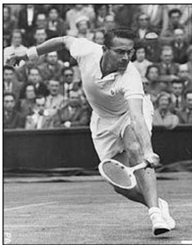
Obrázek 6 - Jaroslav Drobny 79

soustředit na hokej. Díky pilnému tréninku se dostal do národního týmu, jemuž se povedlo vyhrát jak mistrovství světa roku 1947, tak i mistrovství Evropy v tomtéž roce. Jako reprezentační útočník startoval také na prvních poválečných olympijských hrách roku 1948 ve Svatém Mořici, odkud si československé mužstvo přivezlo stříbrnou medaili. V témže roce vyhrál Drobny svůj první grandslamový titul, a to v Paříži ve čtyřře, kde byl jeho spoluhráčem Švéd Lennhart Bergelin (pozdější trenér superhvězdy Björna Borga). Po několika konfliktech s tehdejším režimem se rozhodl emigrovat, načež se stal občanem Egypta. Jako egyptskému reprezentantovi se mu povedlo také vyhrát svůj první Wimbledon a dostat se mezi špičku světového tenisu. 77 V té době se mohl pyšnit již dvěma tituly z French Open, ale vyhrát v Anglii se mu do té doby stále nedařilo. Díky jeho výborné technice a rychlému podání se mu v jeho už třetím wimbledonském finále povedlo udolat australského mladíčka Kena Rosewalla. Jaroslav Drobny byl jedním z nejlepších a nejvšestrannějších sportovců Českých dějin. Zemřel v roce 2001 v Londýně a za své zásluhy v obou jeho sportech byl zařazen do mezinárodních síní slávy. 78