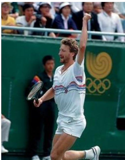
Obrázek 13 - Miloslav Mečíř na olympiádě v Soulu 148

Na OH v Atlantě roku 1996 se čeští tenisté zasloužili o dvě medaile. Byla to olympiáda výroční, jelikož to bylo přesně sto let od prvních novodobých olympijských her v Aténách roku 1896. 149 O stříbrnou medaili se postarala známá dvojice Jana Novotná – Helena Suková, které prohrály ve finále proti americké dvojici Mary Joe Fernandezová a Gigi Fernandezová. Novotná navíc přidala bronz ze ženské dvouhry, oplatila porážku Američance Mary Joe Fernandezové. 150