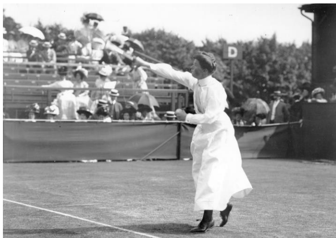
Obrázek 12 - První olympijská vítězka Charlotte Cooper 133

vybojovala trojnásobná wimbledonská vítězka Charlotte Cooperová, která ve dvojici s dalším wimbledonským šampionem R. F. Dohertym získala zlatou medaili i v mixu. 132