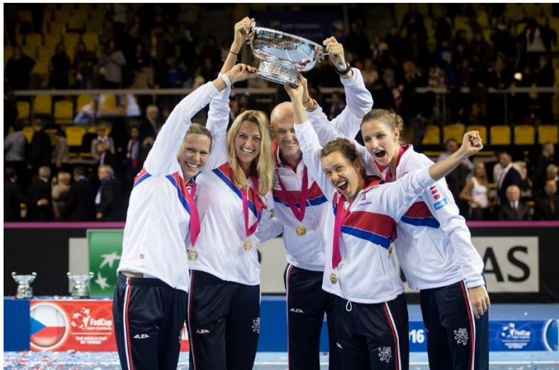
Obrázek 4 - Český fedcupový tým oslavující vítězství roku 2016 64

Mandlíková. Druhou generaci představuje Petra Kvitová, Lucie Hradecká, Karolína Plíšková a Barbora Strýcová. Svůj poslední fedcupový titul získala Česká Republika právě v roce 2016, po vítězství ve finálové sérii s Francií s celkovým skóre 3:2. Rozhodující zápas vyhrála Barbora Strýcová.