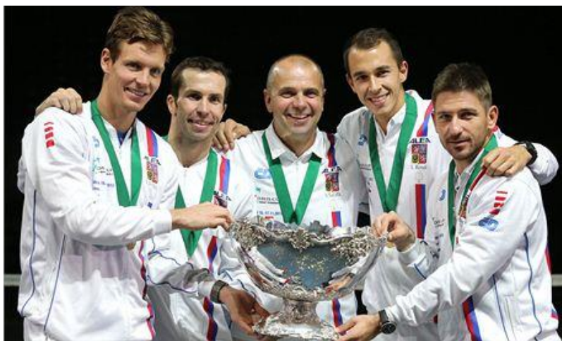
Obrázek 3 - Český daviscupový tým slaví vítězství roku 2013 57

Česká republika v současné době drží spolu s Německem sedmou příčku, za tři vítězství v letech 1980, 2012 a 2013. Dvěma tituly se může pyšnit Rusko a po jednom titulu mají Argentina, Chorvatsko, Itálie, Jihoafrická republika Srbsko a Švýcarsko. 55 Aktuálním držitelem titulu (za rok 2017) je Francie. 56