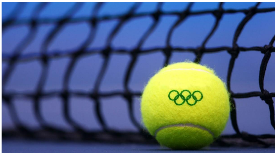
Obrázek 11 - Olympijský míček 129

Tenis se poprvé představil hned na historicky prvních novodobých olympijských hrách v Aténách roku 1896. Byl zastoupen hned ve dvou disciplínách – dvouhře a čtyřhře. Stejně jako ostatních sportů se i tenisového turnaje účastnili pouze muži. Kurty se nacházeli uprostřed dráhy cyklistického velodromu. Prvním historickým vítězem olympijských her ve dvouhře byl Irský tenista John Boland. 130 Ten přijel na hry pouze jako divák. Jeho řecký kamarád se ale rozhodl ho zapsat na soupisku hráčů tenisového turnaje, což se ukázalo jako výborný nápad. Čtyřhru vyhrál opět Boland spolu s Němcem Friedrichem Traunem. 131