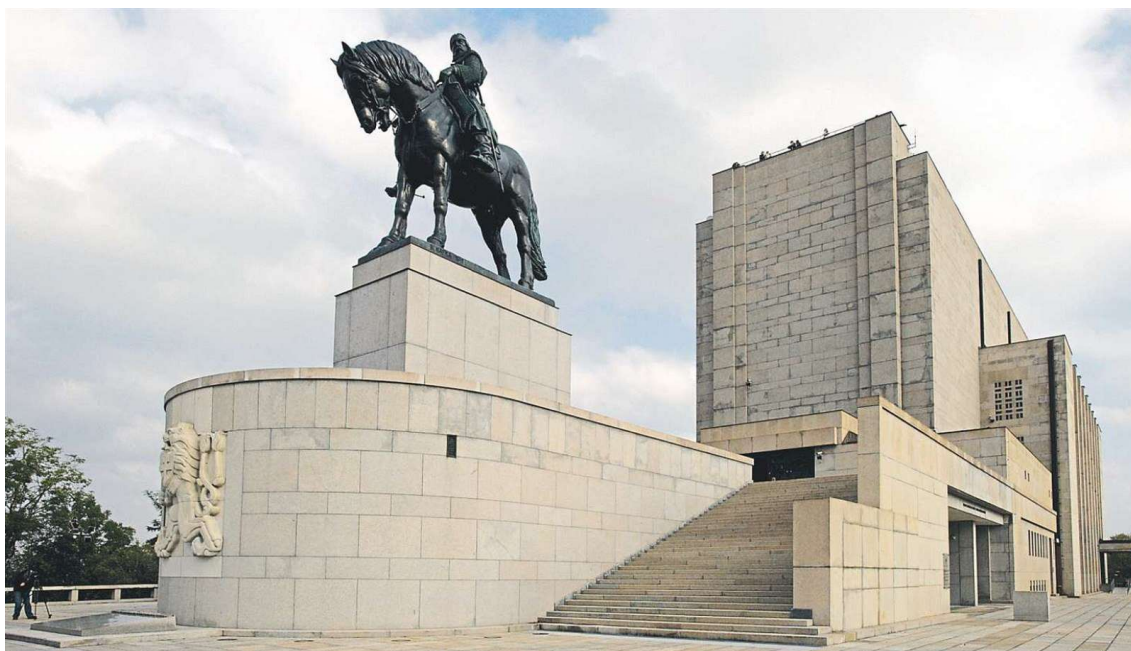
Příloha č. 6: Socha Žižky před památníkem.