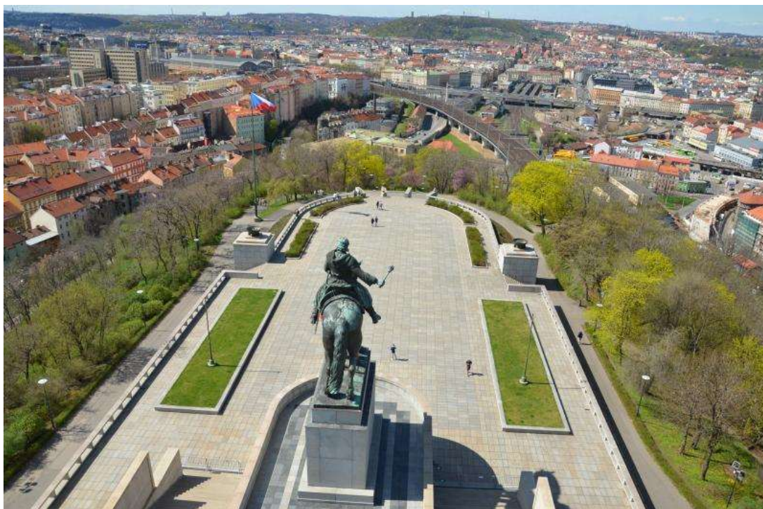
Příloha č. 5: Pohled na Prahu ze střechy památníku.