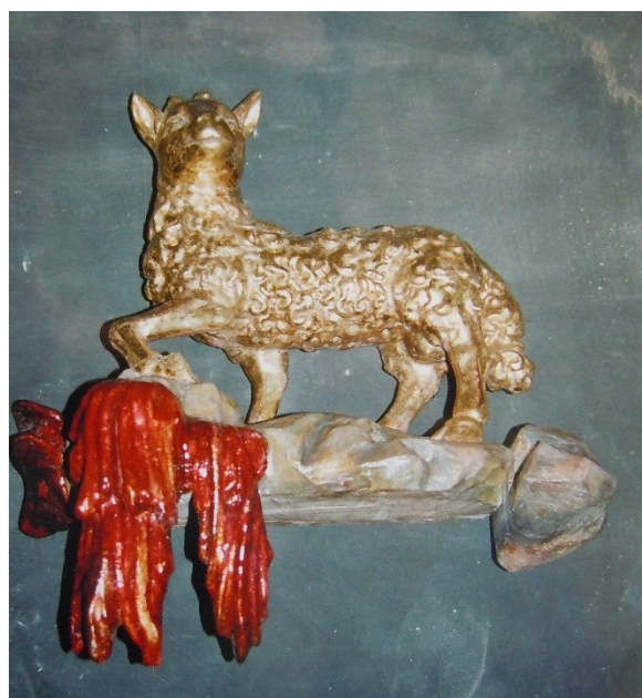
16. Dobřenice, kostel sv. Klimenta, Agnus Dei, detail (po restaurování)