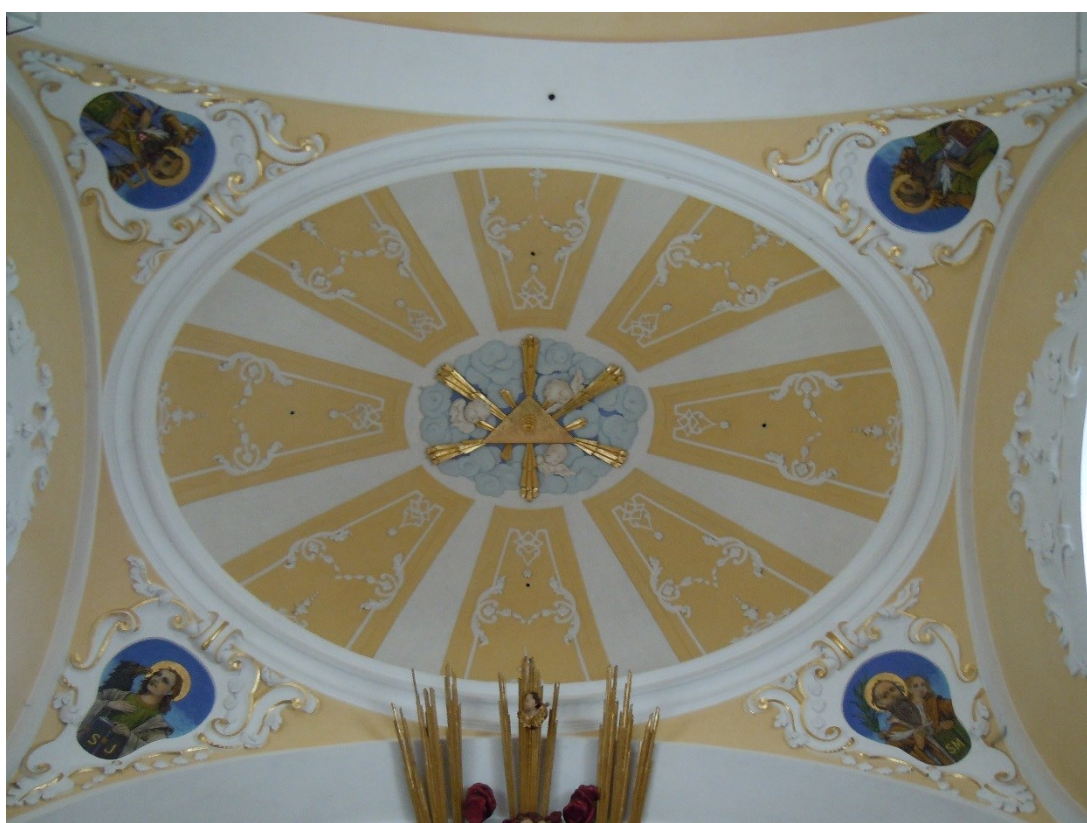
8. Dobřenice , kostel sv. Klimenta, pohled do kupole