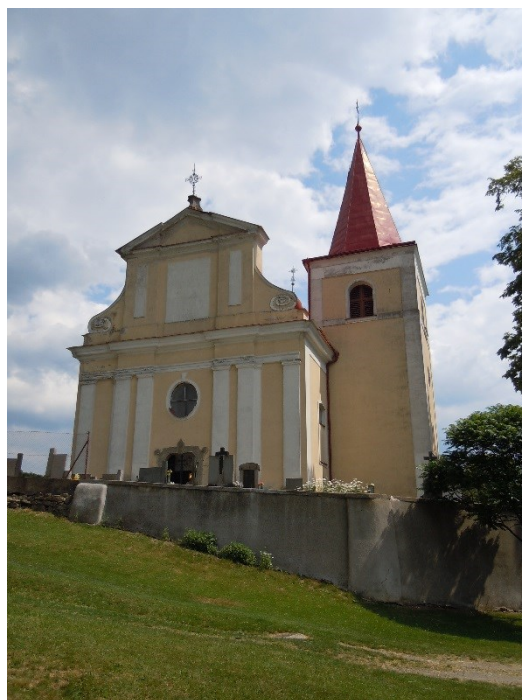
35. Uhelná Příbram , kostel sv. Archanděla Michaela, pohled od západu