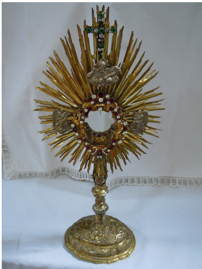
29. Dobřenice, kostel sv. Klimenta, monstrance, 2. pol. 18. stol.