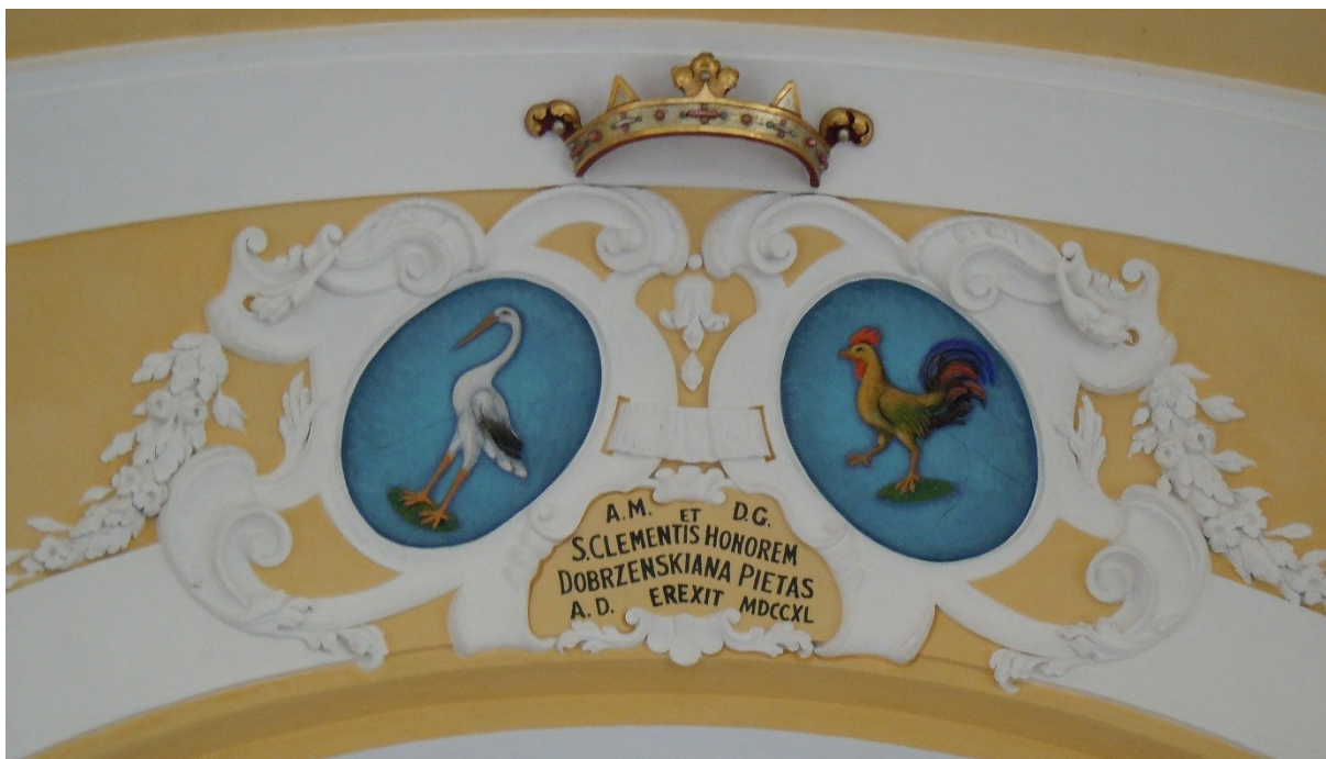
7. Dobřenice , kostel sv. Klimenta, vítězný oblouk, alianční erb Dobřenských a Straků z Nedabylic