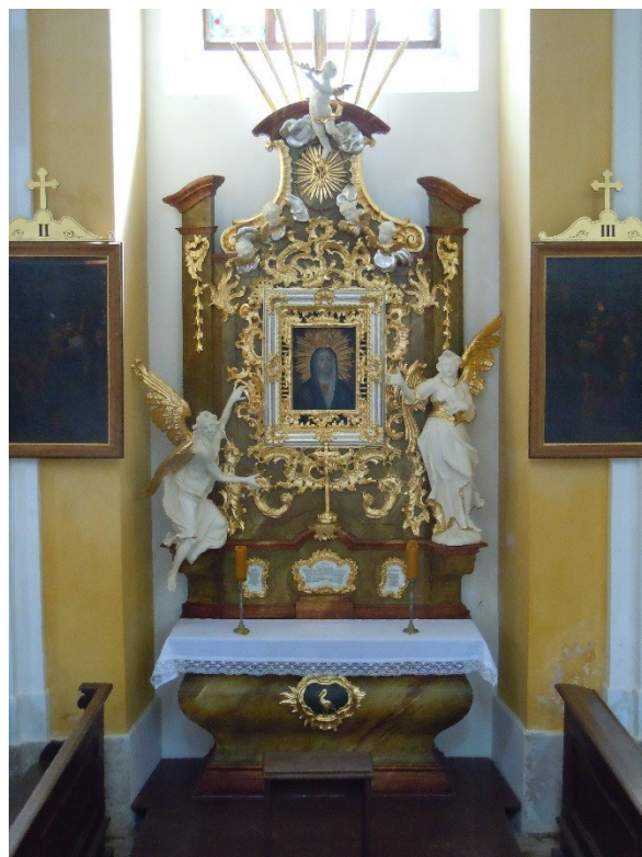
22. Dobřenice , kostel sv. Klimenta, oltář Panny Marie Bolestné