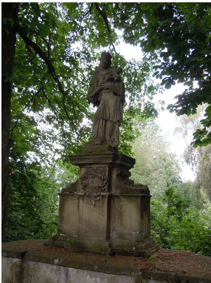
34. Ouhrov (Úhrov) , socha sv. Jana Nepomuckého, hráz rybníka