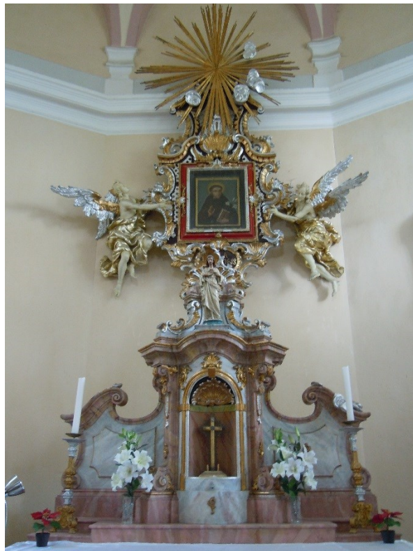
33. Ouhrov (Úhrov), kaple sv. Antonína Paduánského, hl. oltář