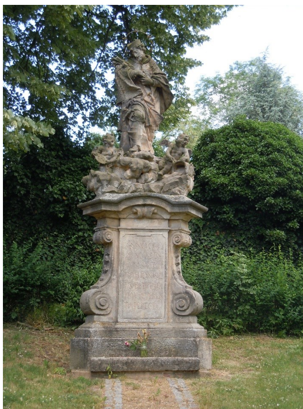
31. Neděliště, socha sv. Jana Nepomuckého