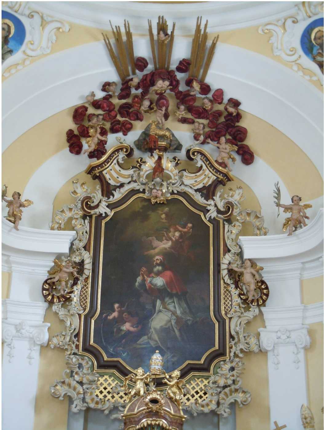
9. Dobřenice, kostel sv. Klimenta, oltářní retabulum