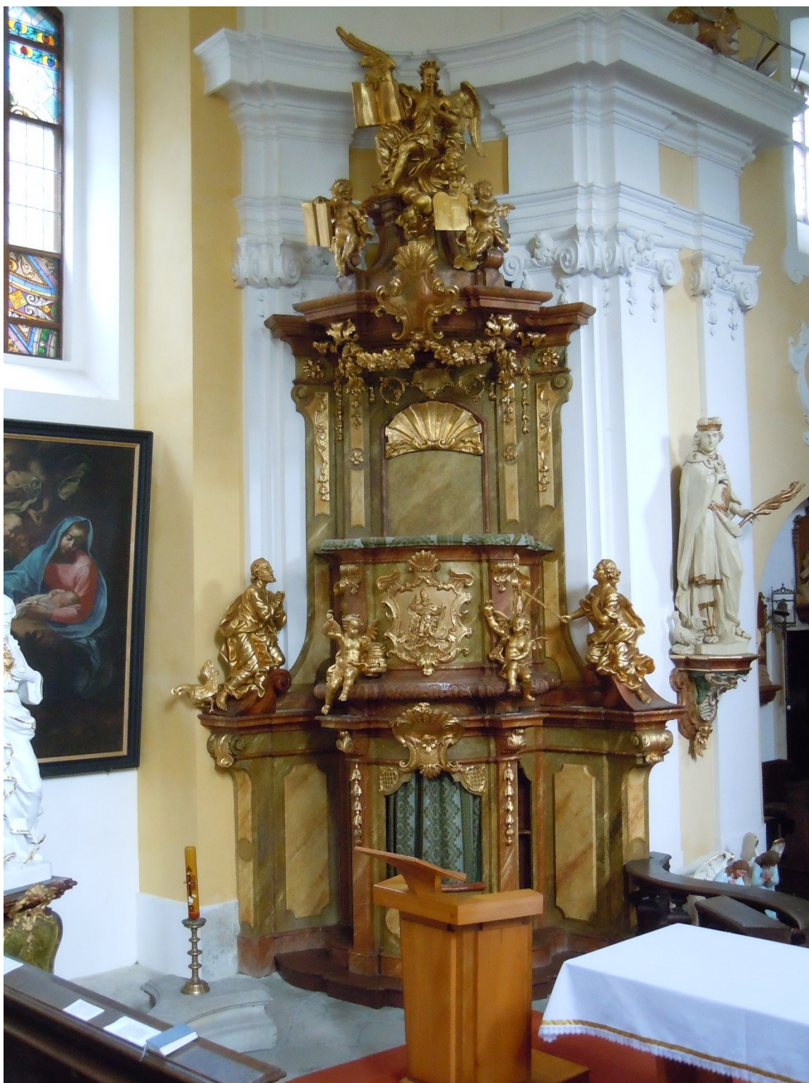
21. Dobřenice, kostel sv. Klimenta, kazatelna se zpovědnicí