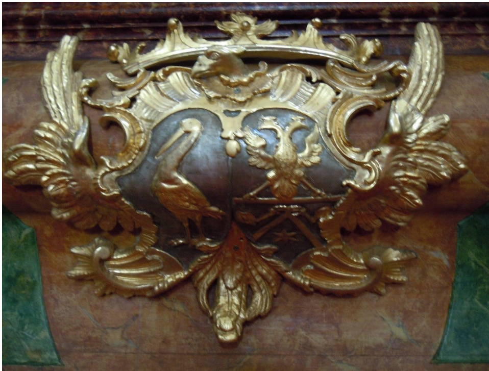
18. Dobřenice , kostel sv. Klimenta, hl. oltář, alianční erb Dobřenských a rodu des Fours