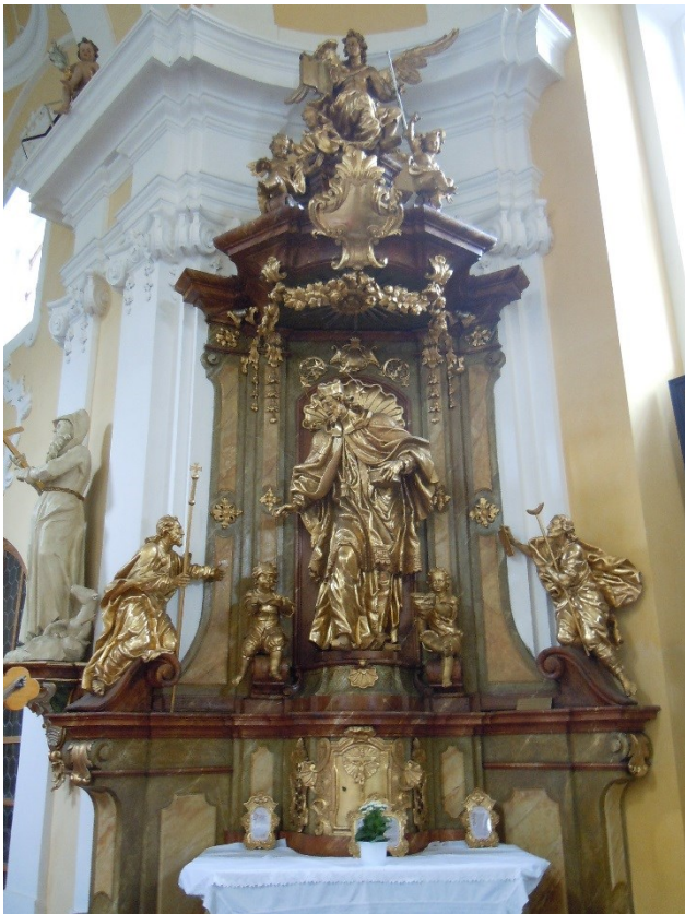
19. Dobřenice , kostel sv. Klimenta, oltář sv. Jana Nepomuckého