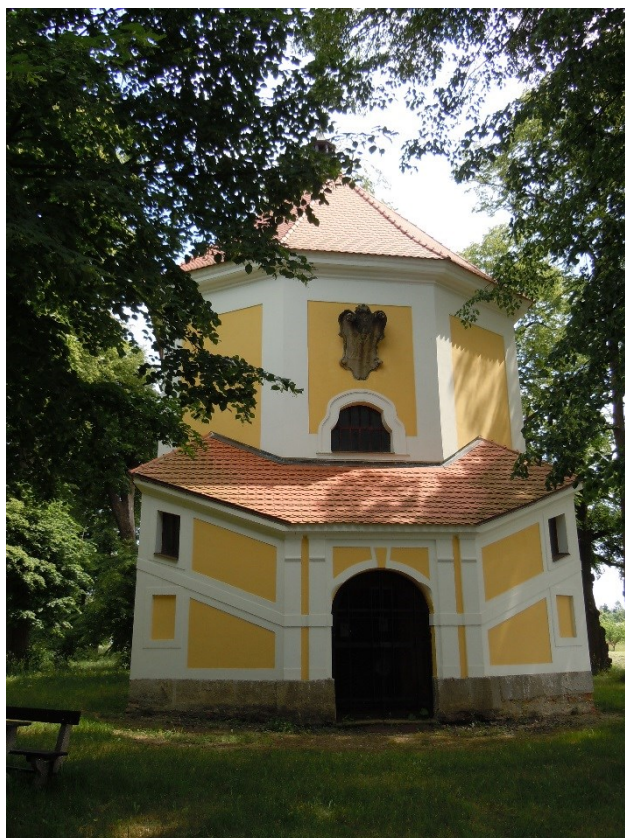
32. Ouhrov (Úhrov), kaple sv. Antonína Paduánského, exteriér