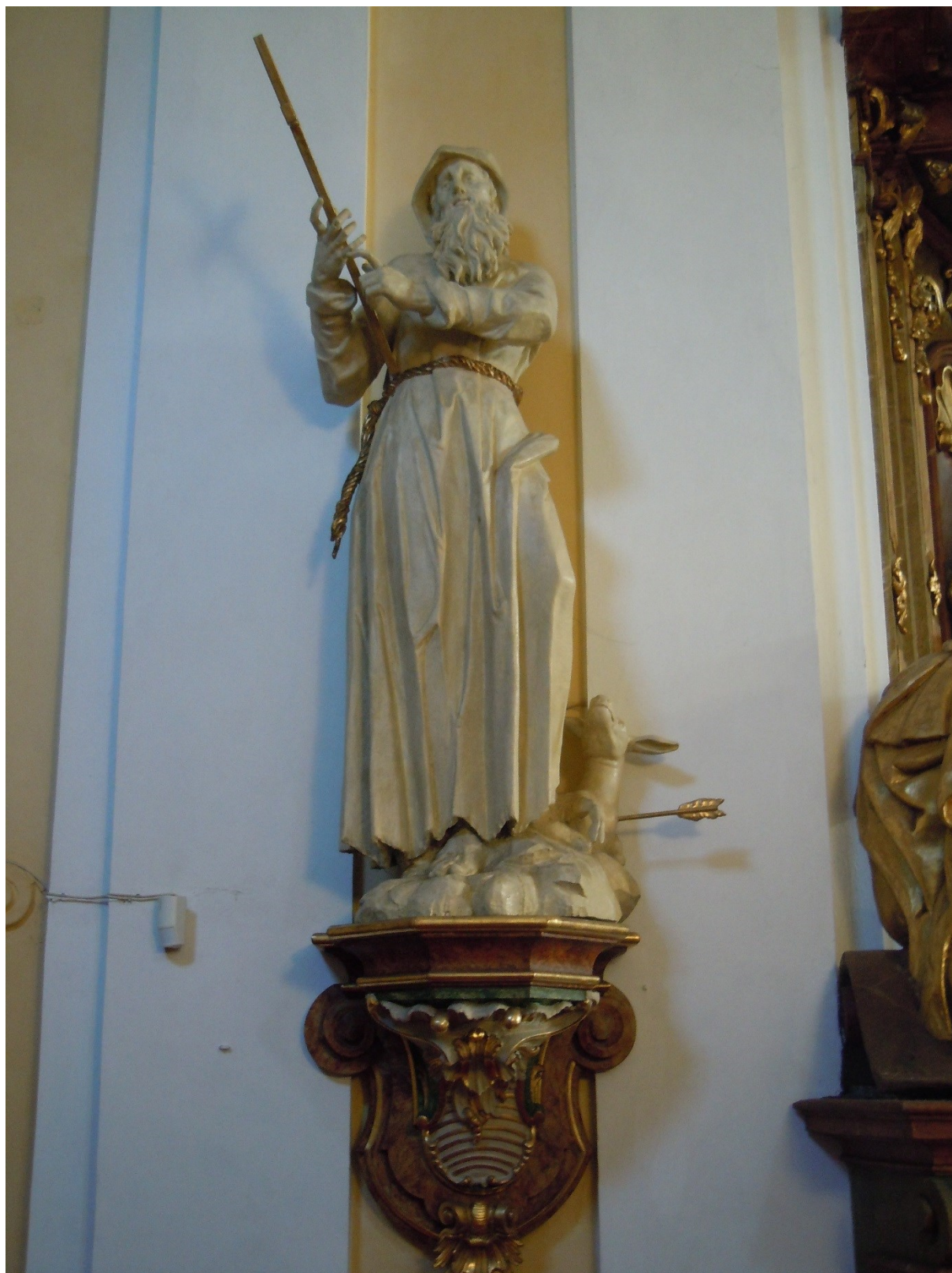
27. Dobřenice, kostel sv. Klimenta, socha sv. Ivana