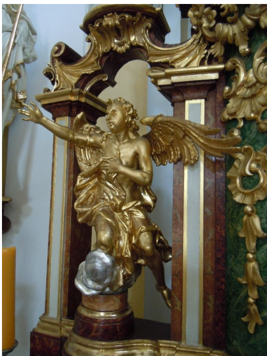
11. Dobřenice , kostel sv. Klimenta, hl. oltář, detail