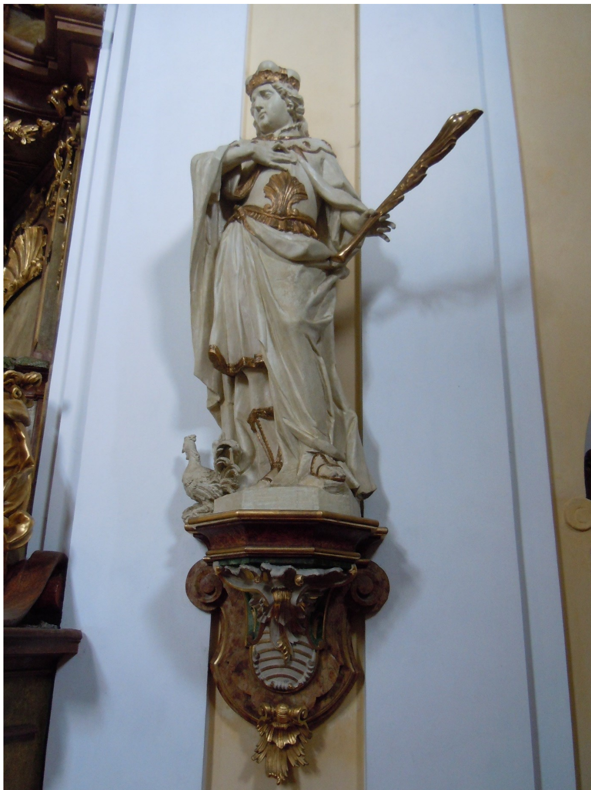
24. Dobřenice, kostel sv. Klimenta, socha sv. Víta