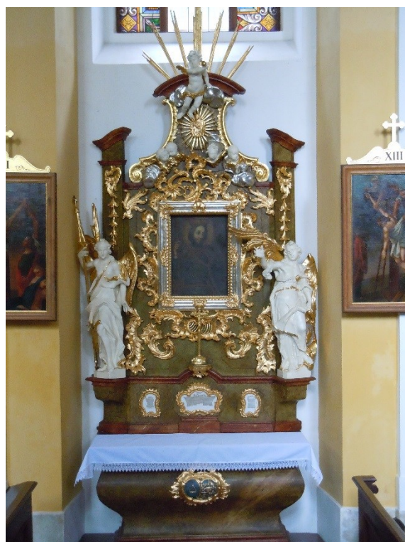
23. Dobřenice , kostel sv. Klimenta, oltář sv. Václava