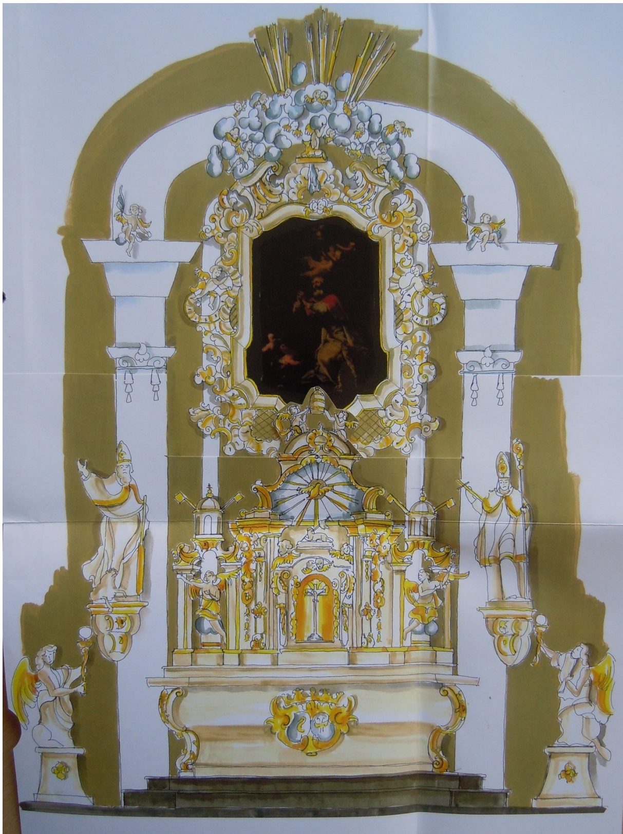
17. Dobřenice, grafické znázornění původní barevnosti oltáře a interiéru kostela sv. Klimenta, NPÚ Josefov