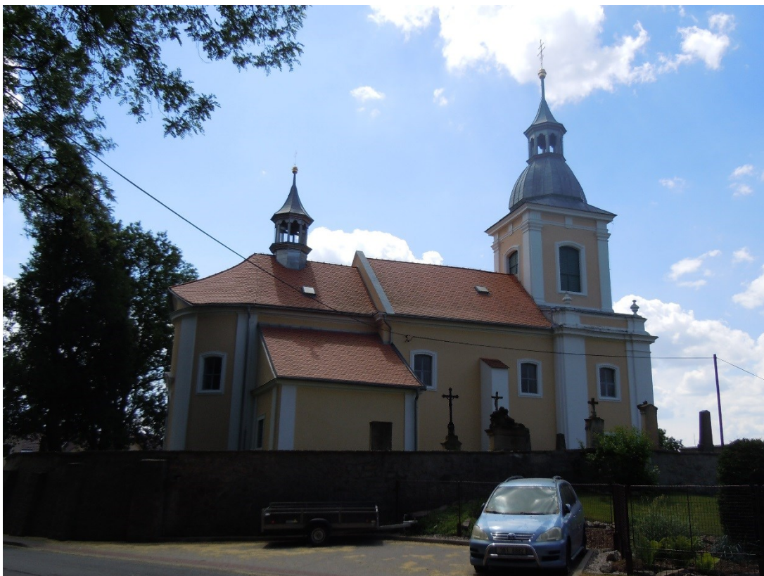
30. Neděliště, kostel Nanebevzetí Panny Marie, celkový pohled