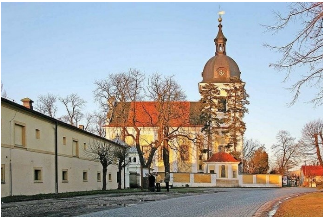
6. Kostel sv. Klimenta v Dobřenicích, pohled od jihu