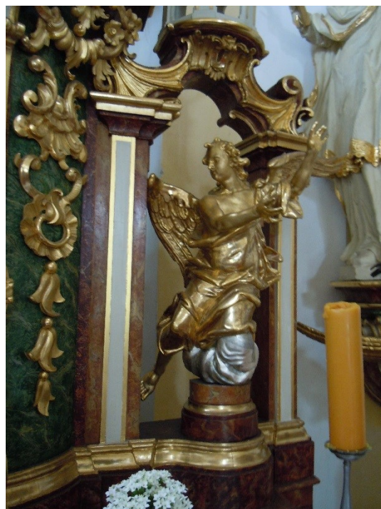
12. Dobřenice , kostel sv. Klimenta, hl. oltář, detail