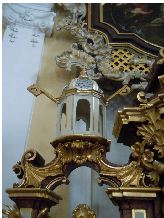
13. Dobřenice , kostel sv. Klimenta, hl. oltář, detail