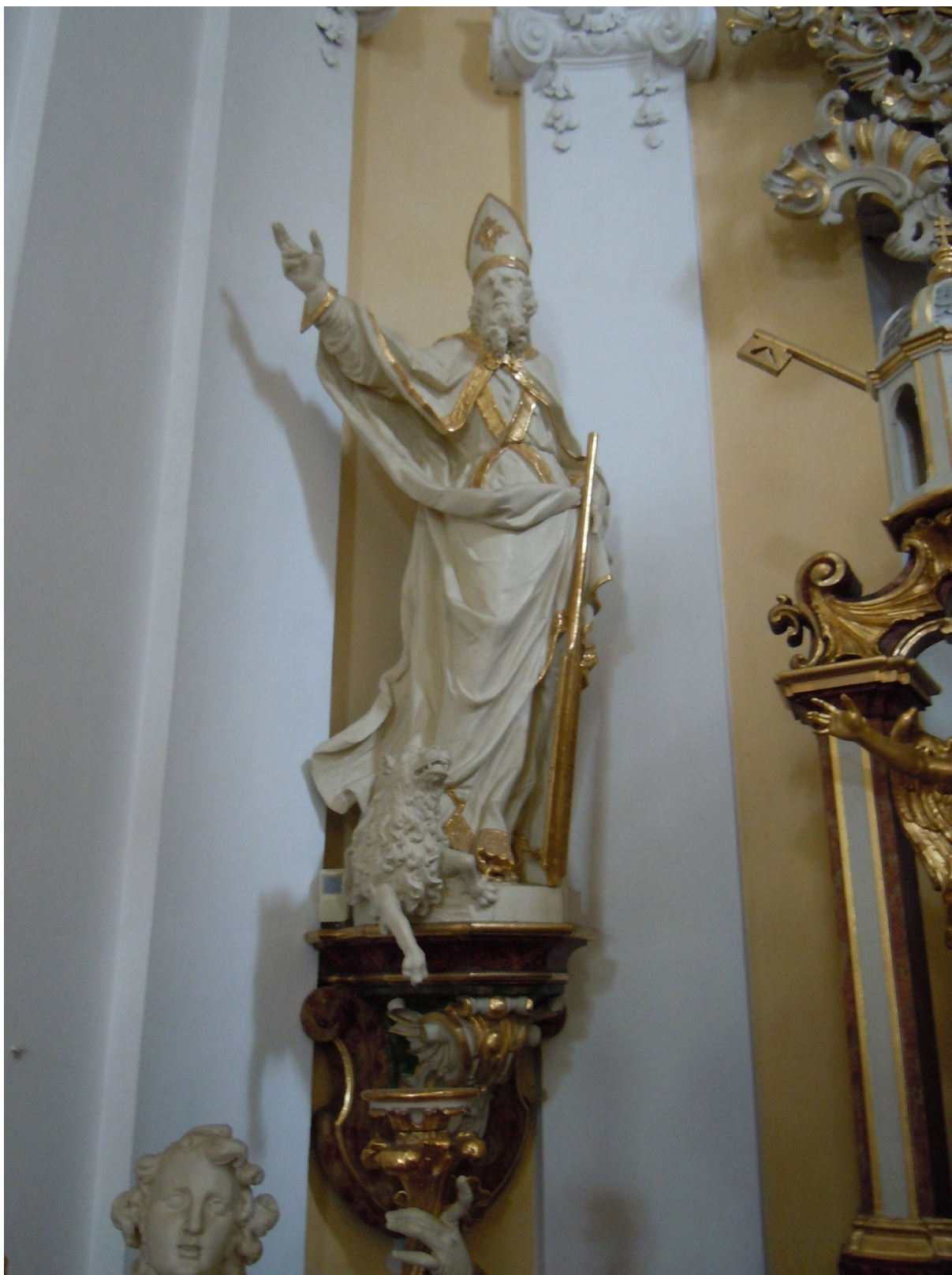
25. Dobřenice, kostel sv. Klimenta, socha sv. Vojtěcha