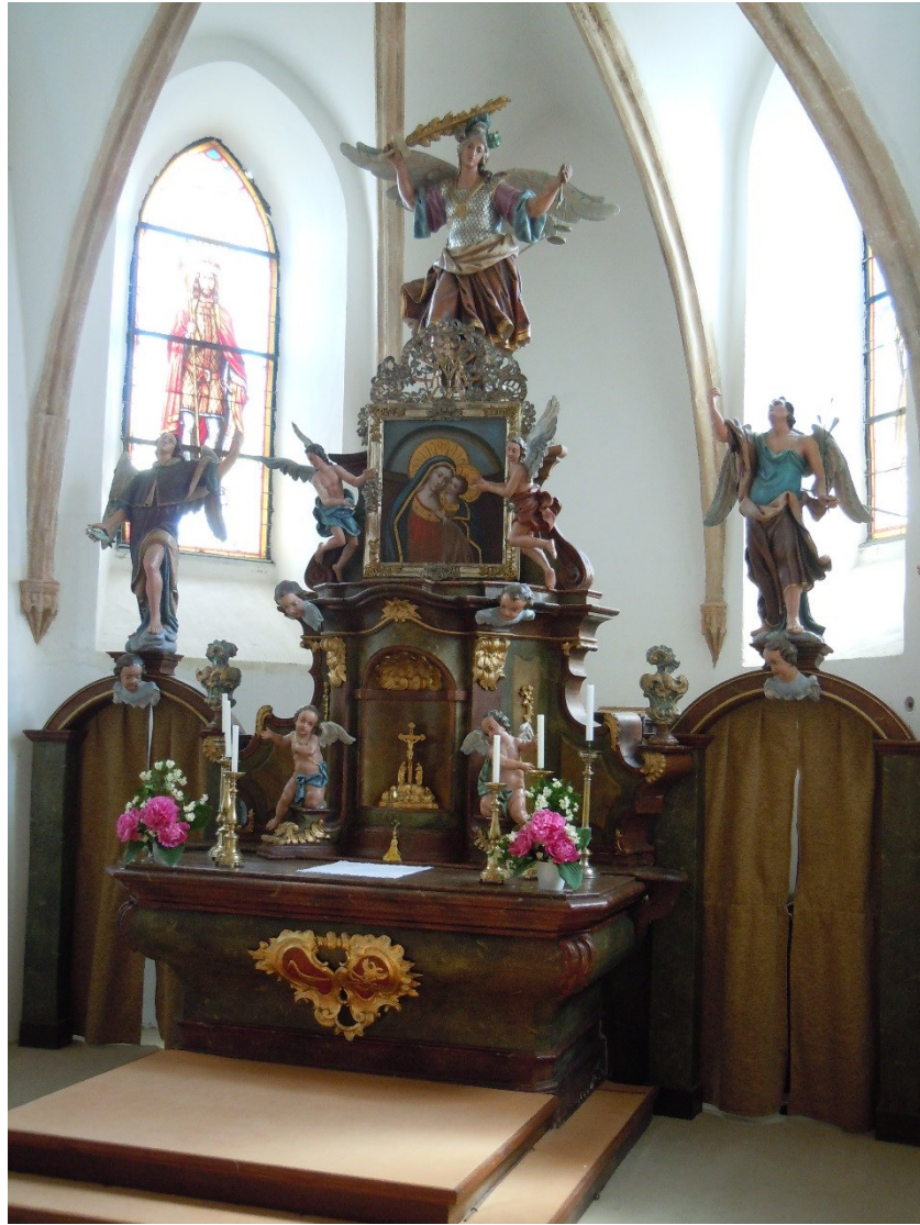
36. Uhelná Příbram, kostel sv. Michaela Archanděla, hl. oltář