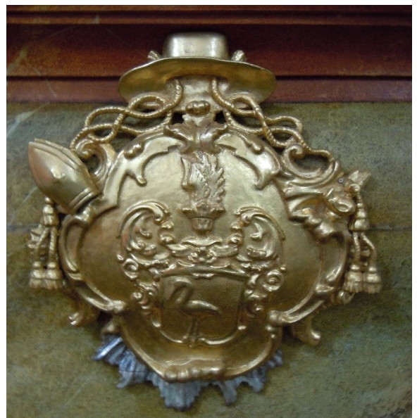
20. Dobřenice , kostel sv. Klimenta, oltář sv. Jana Nepomuckkého, detail