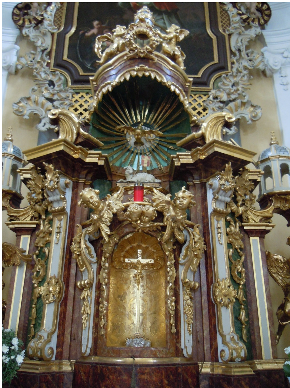
10. Dobřenice, kostel sv. Klimenta, baldachýnový tabernákl