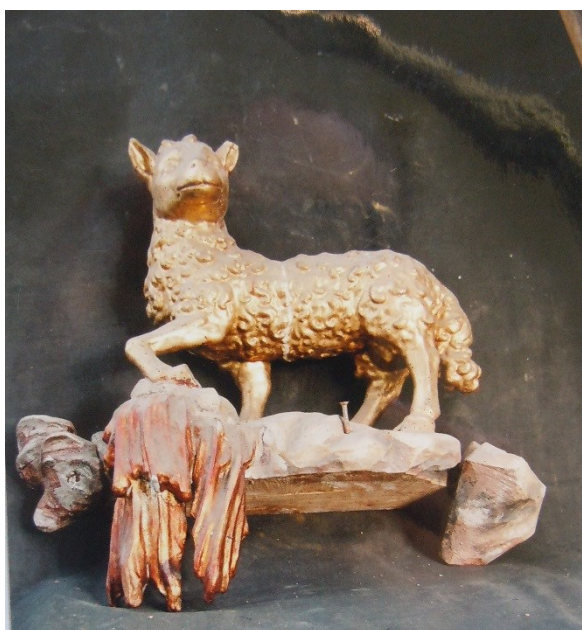
15. Dobřenice, kostel sv. Klimenta, Agnus Dei, detail (před restaurováním)