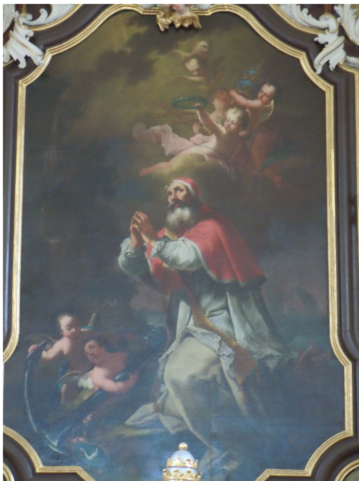
14. Dobřenice, kostel sv. Klimenta, hl. oltář, detail