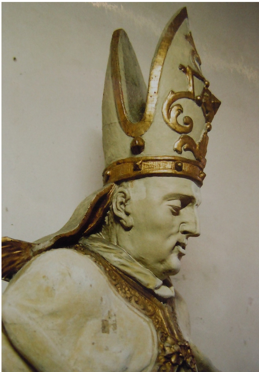
28. Dobřenice, kostel sv. Klimenta, socha sv. Prokopa (před restaurováním)