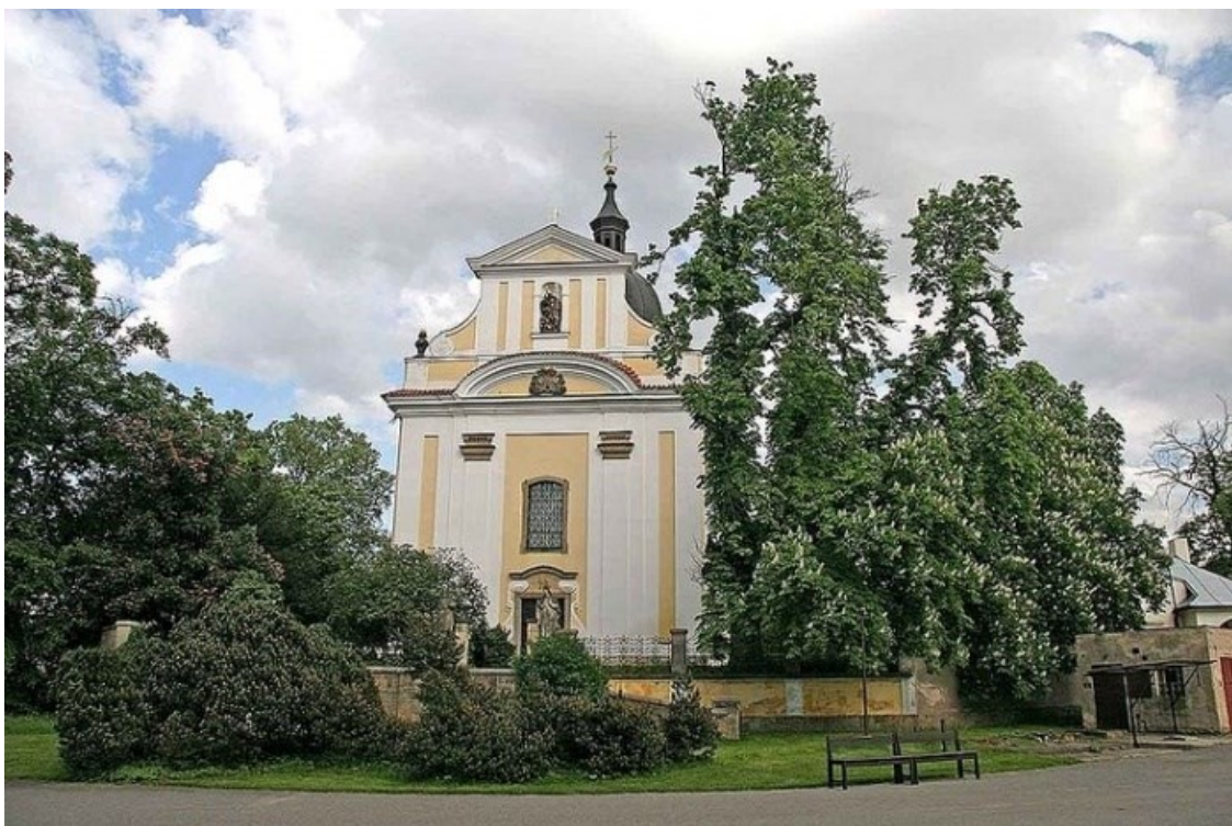
5. Kostel sv. Klimenta v Dobřenicích, pohled od západu