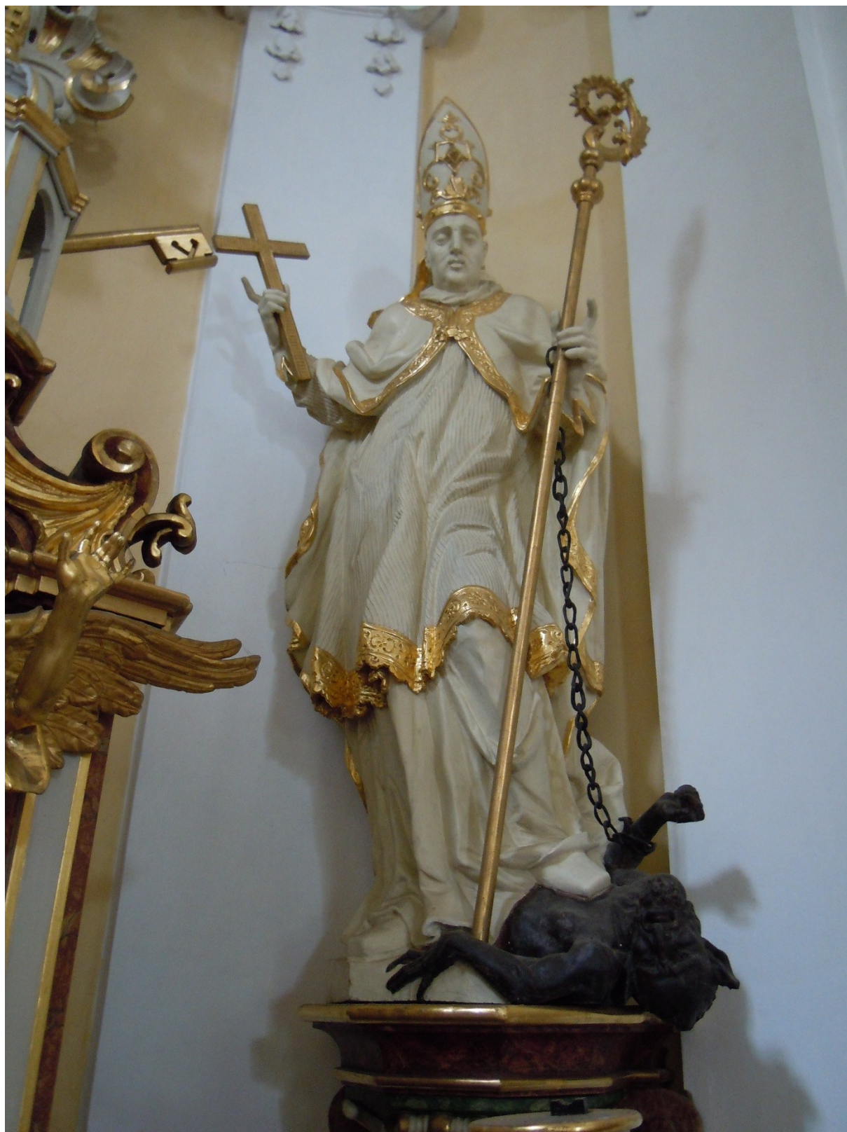
26. Dobřenice, kostel sv. Klimenta, socha sv. Prokopa