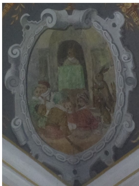
17. Zaječí soud nad lidmi, Zaječí pokoj na zámku v Bučovicích, po roce 1583