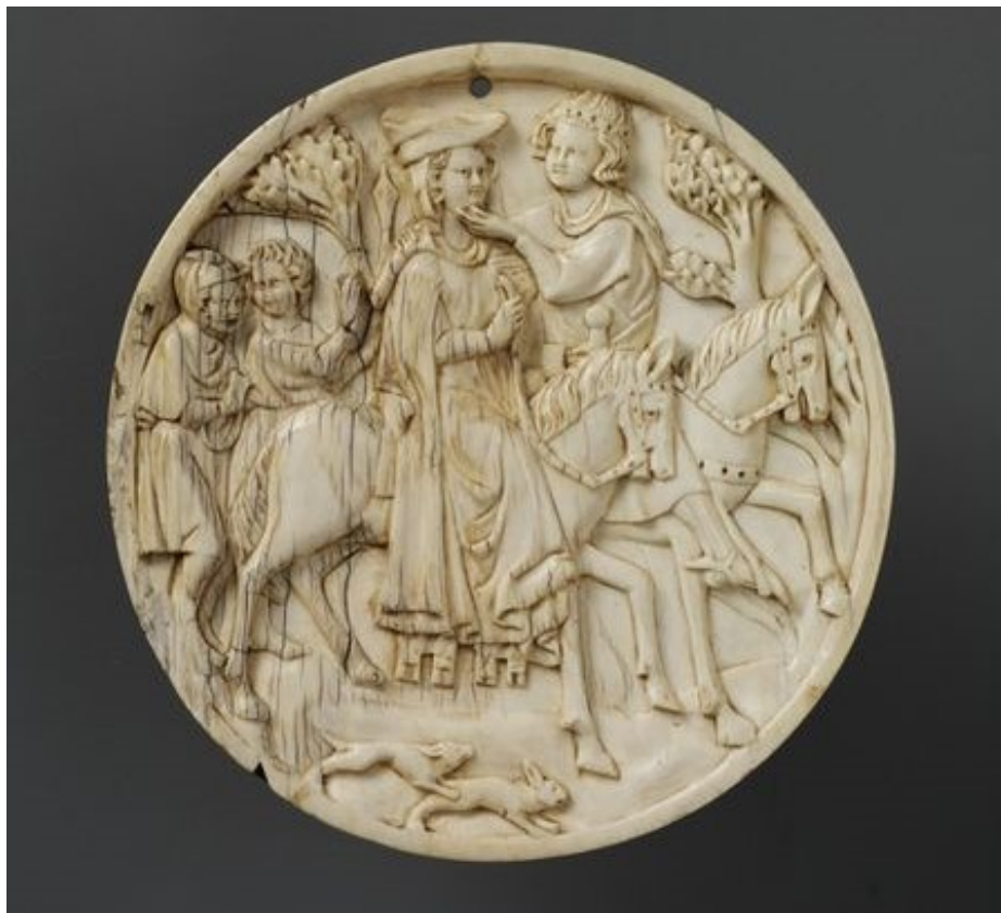
9. Milenecký pár na lovu, slonovinové zrcadlo, autor neznámý, kolem 1320