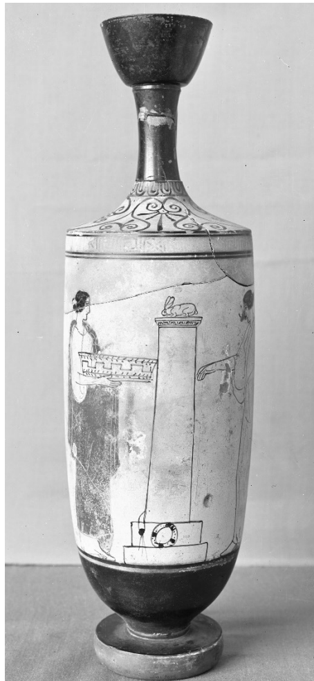
2. Ženy přinášející obětiny ke stéle se zajícem, lékythos, 440–430 př. n. l.