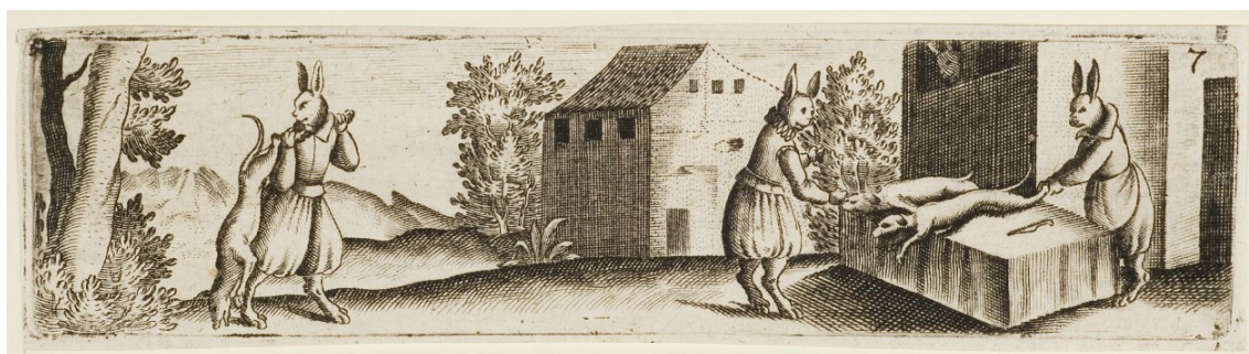
25. Zajíci připravují psy, Hieronymus Bang, 1576–1630