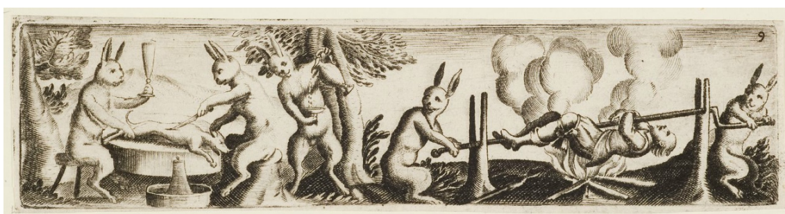
27. Zajíci opékají lovce a hodují, Hieronymus Bang, 1576–1630