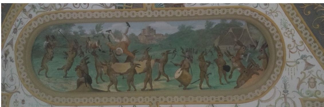
15. Masopustní veselí, Zaječí pokoj na zámku v Bučovicích, po roce 1583