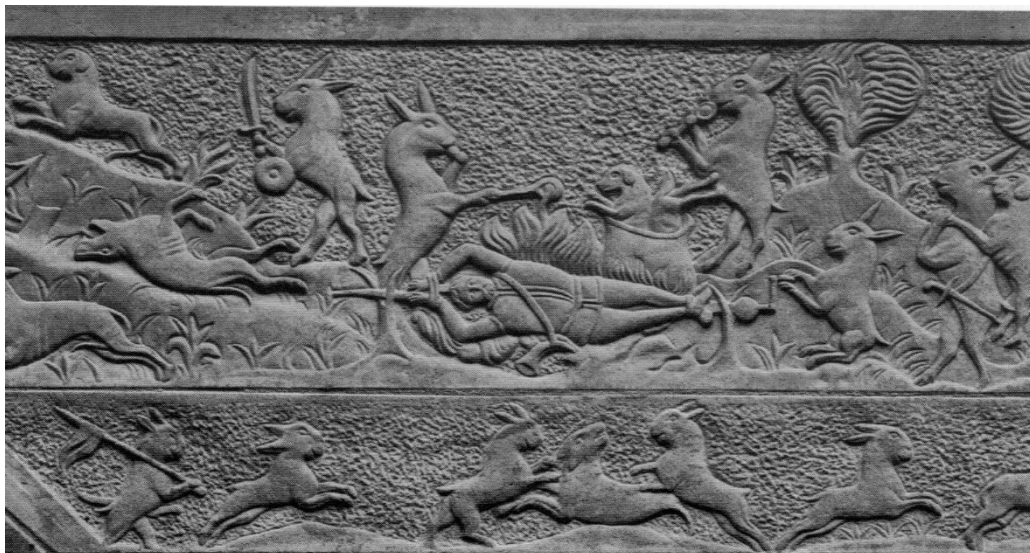
30. Zaječí cyklus, detail sochařské výzdoba arkádového nádvoří na zámku v Hustopečích nad Bečvou, italská mistři poslední čtvrtiny 16. století (?)