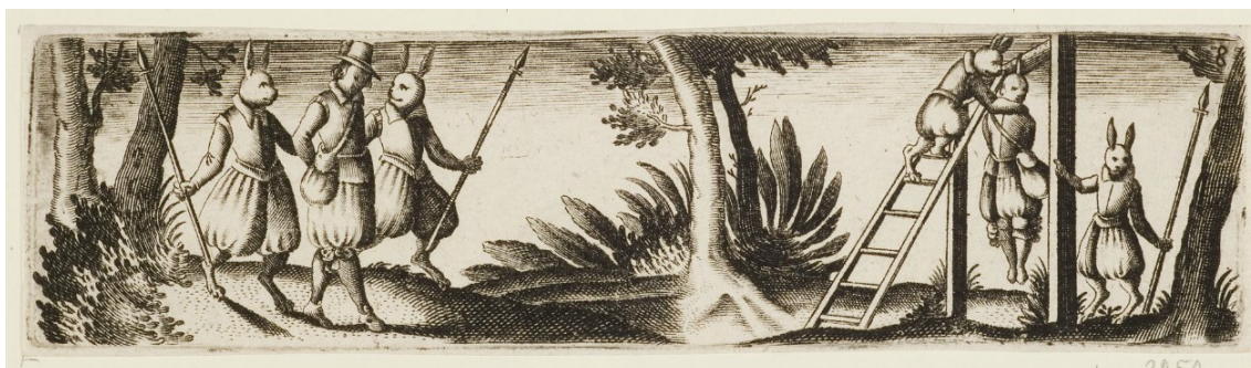
26. Zajíci popravují lovce, Hieronymus Bang, 1576–1630