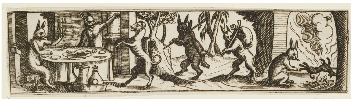
28. Zajíci hodují a škádlí psa, Hieronymus Bang, 1576–1630