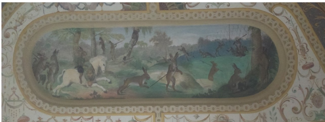
14. Zaječí hon, Zaječí pokoj na zámku v Bučovicích, po roce 1583