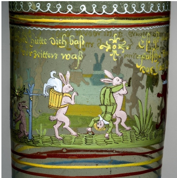
31. Zajáci nesou člověka a psa, humpen, po roce 1650