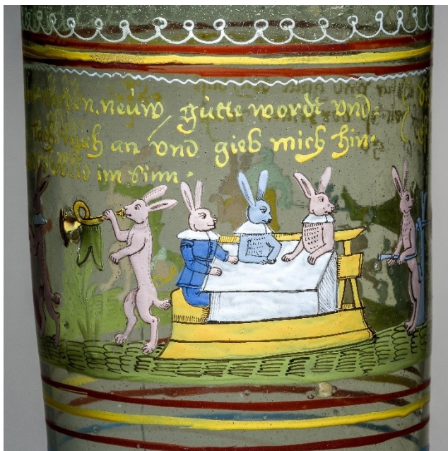
33. Zajáci u hodovního stolu, humpen, po roce 1650