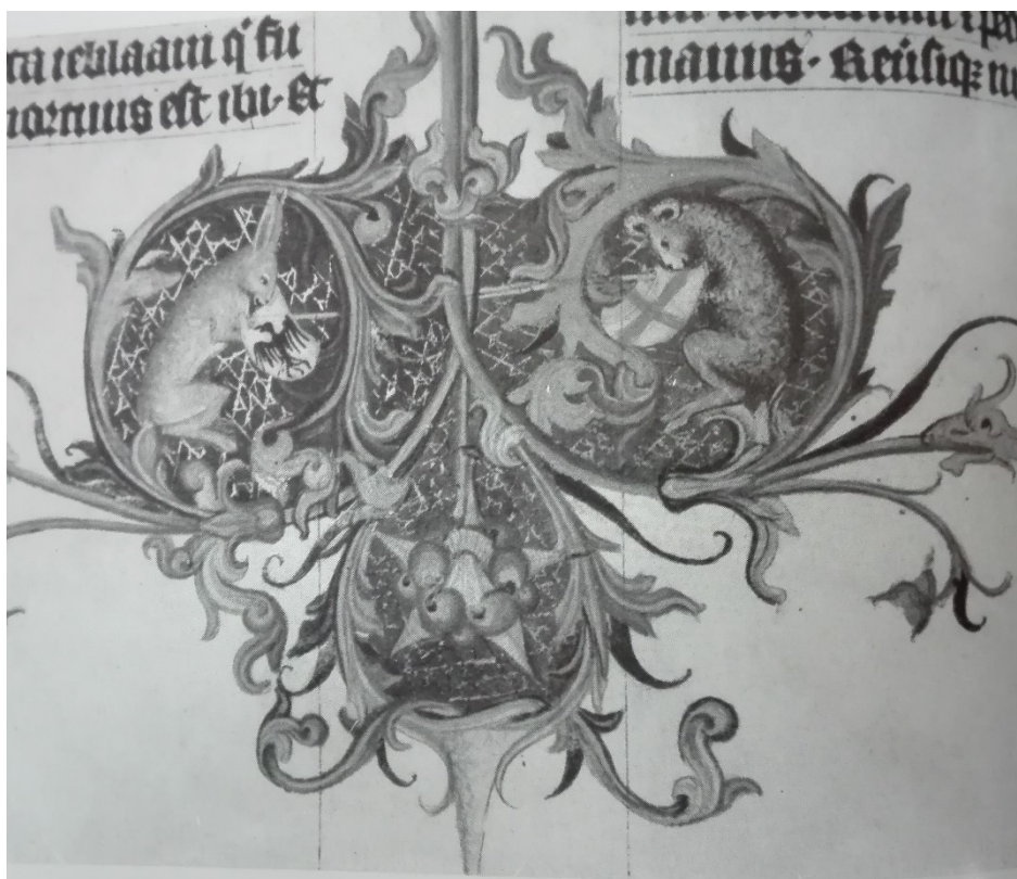
19. Zajíc zápasící s beranem, Bible Konráda z Vechty, kolem 1400