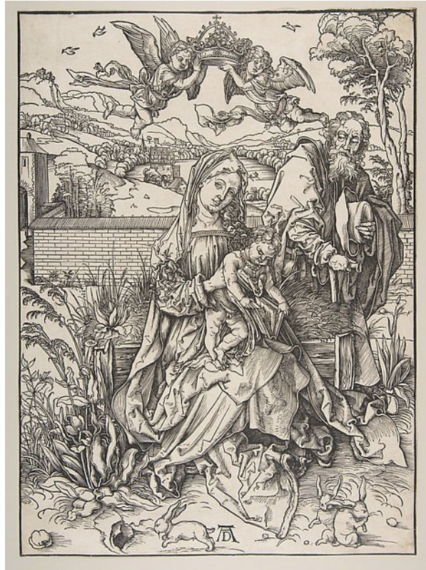
5. Svatá rodina se třemi zajíci, Albrecht Dürer, 1497–98