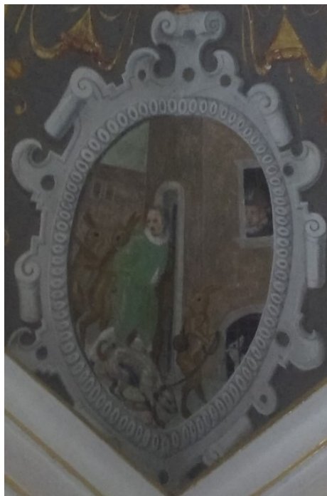
18. Uvržení do vězení, Zaječí pokoj na zámku v Bučovicích, po roce 1583