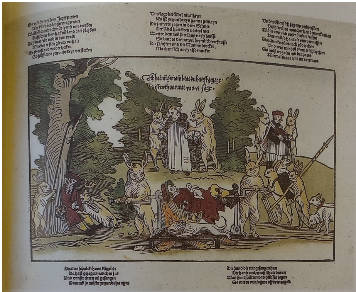
20. Zajáci vykonávají ortel nad myslivci a mnichy, neznámý německý mistr, kolem 1535