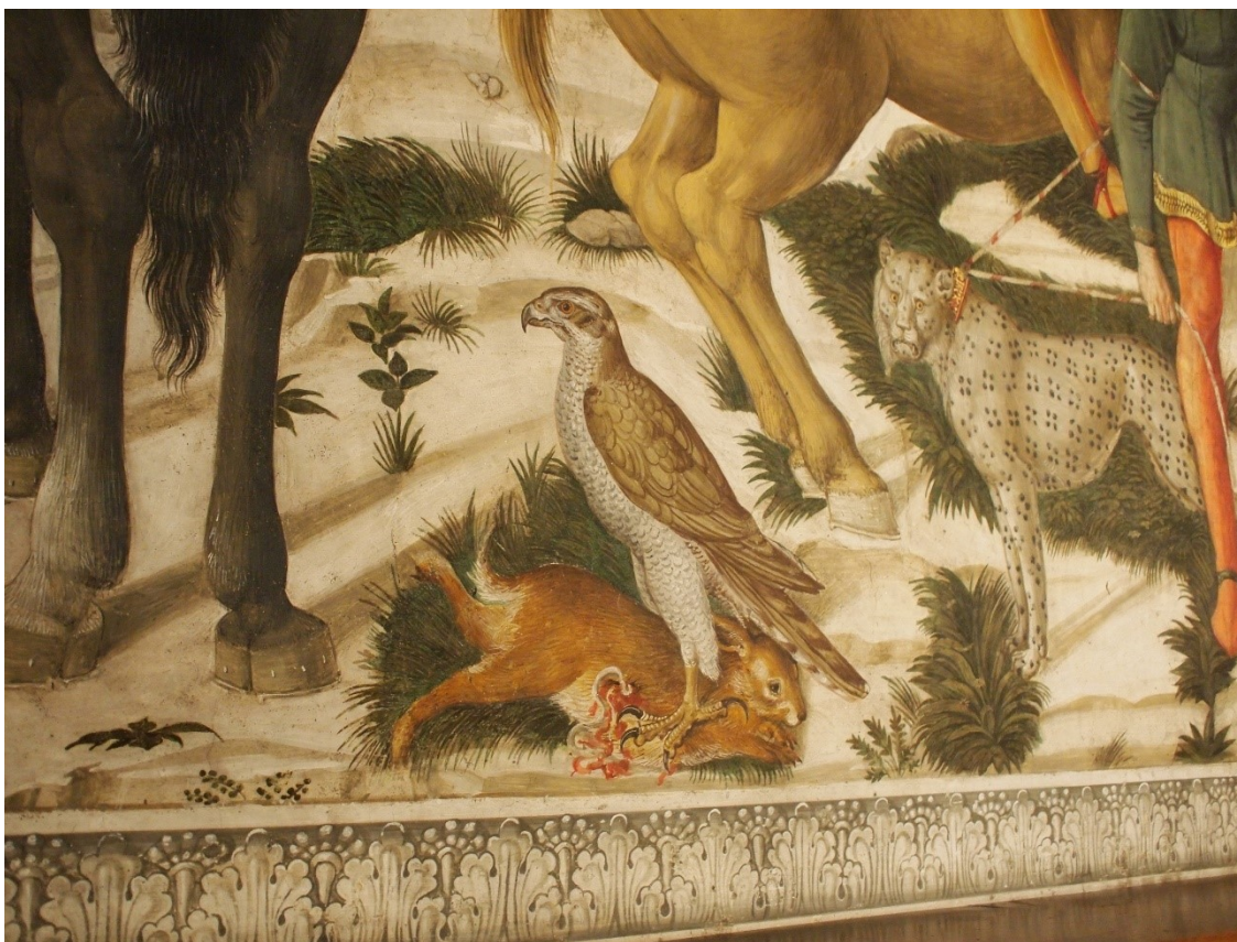
8. Průvod tří králů, detail uloveného zajíce, Benozzo Gozzoli, 1459–1461, Kaple Tří králů, východní zeď, Palazzo Medici-Riccardi, Florencie