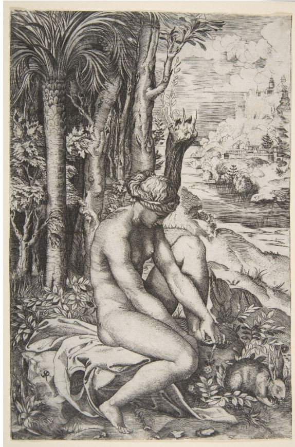
3. Venuše odstraňující si trn z paty, Marco Dente, 1515–27