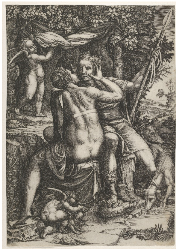
4. Venuše a Adonis, Giorgio Ghisi, kolem 1570