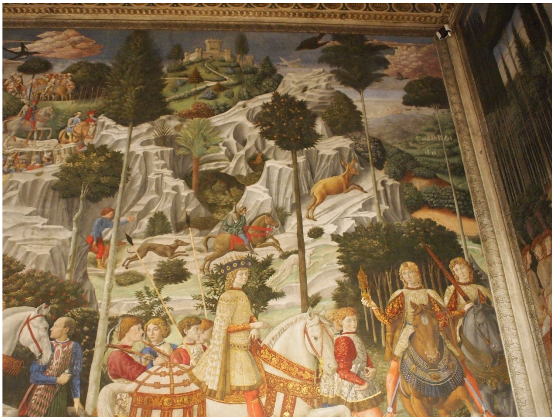
7. Průvod tří králů, zajíc ve skalách, Benozzo Gozzoli, 1459–1461, Kaple Tří králů, východní zeď, Palazzo Medici-Riccardi, Florencie