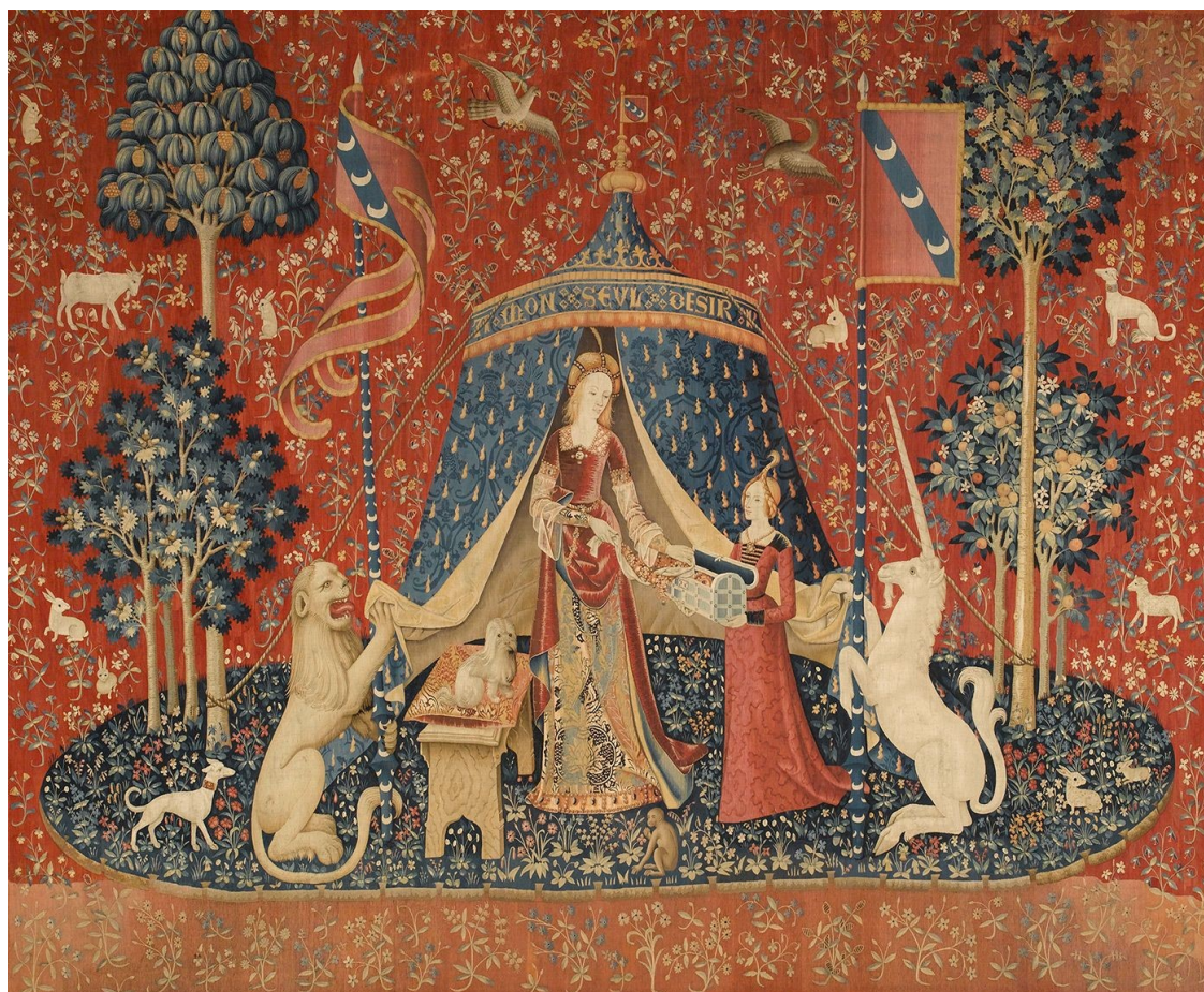
10. Mon Seul Désire, tapisérie Dáma a jednorožec, kolem 1500