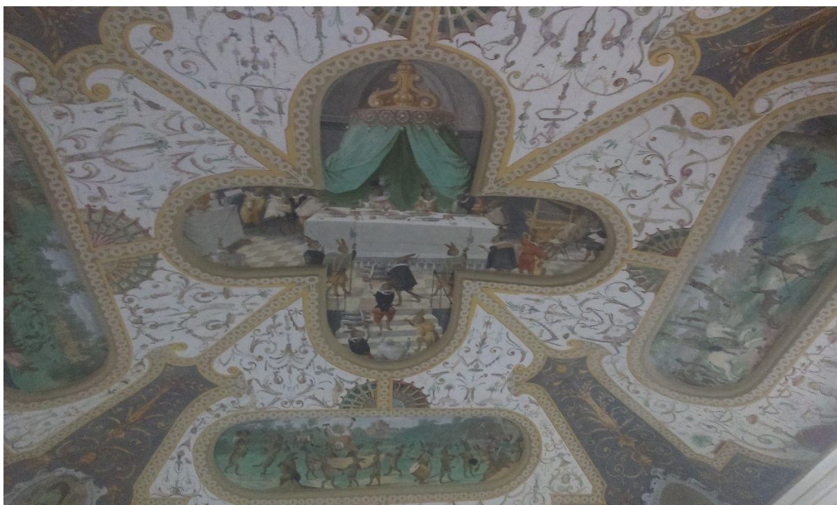
11. Zaječí hostina, Zaječí pokoj na zámku v Bučovicích, po roce 1583