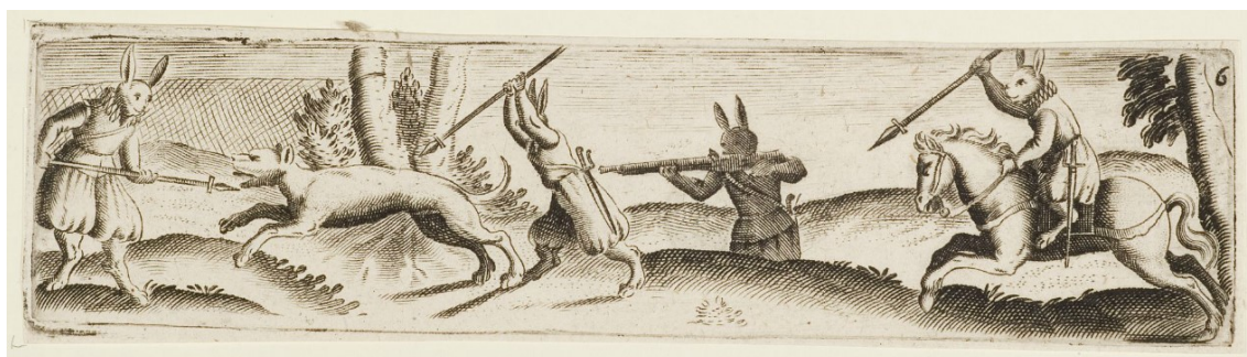
24. Zajíci loví psa, Hieronymus Bang, 1576–1630