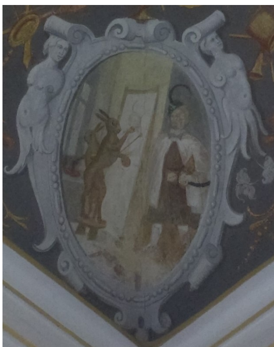
16. Zajíc portrétující šlechtice, Zaječí pokoj na zámku v Bučovicích, po roce 1583