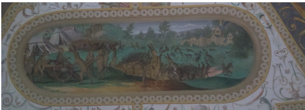
12. Zaječí tábor, Zaječí pokoj na zámku v Bučovicích, po roce 1583