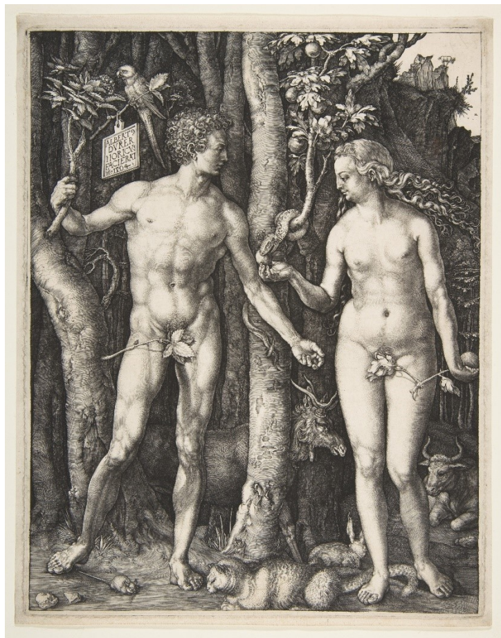
6. Adam a Eva, Albrecht Dürer, 1504