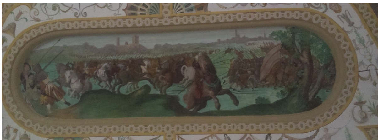
13. Jezdecká bitva – boj zajíců s lidmi, Zaječí pokoj na zámku v Bučovicích, po roce 1583