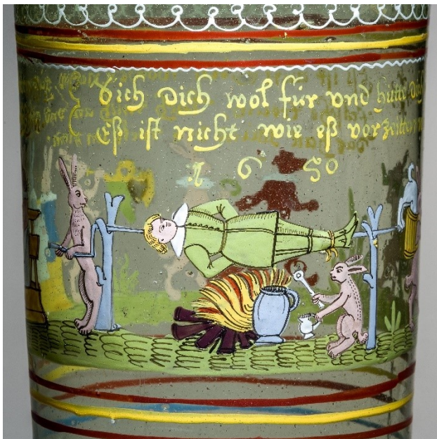
32. Zajáci opékají myslivce, humpen, po roce 1650