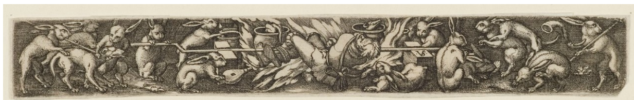
21. Zajáci opékají lovce, Virgil Solis, 1534–1562