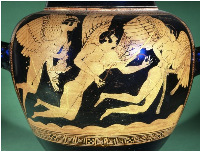
1. Tři letící Erótové se zajícem, stamnos, 480–470 př. n. l.