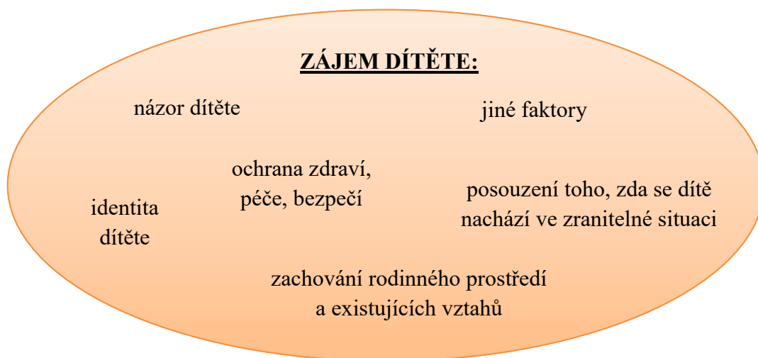
obr. č. 3 – Zájem dítěte jako multifaktoriální koncept.

Výše uvedené je možné znázornit způsobem, který vidíme na obrázku č. 3 – Zájem dítěte jako multifaktoriální koncept.