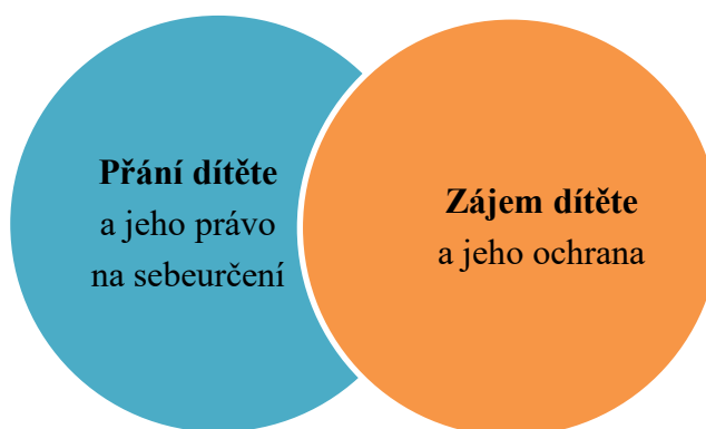
Obr. č. 2 – Částečná korespondence přání dítěte s jeho zájmem

Pokud je tedy mezi přáním dítěte a jeho zájmem nesoulad, je zúčastněnými profesionály, kteří jsou povinni dítě chránit, prosazovány zájmy dítěte v souladu s uvedeným ustanovením. Přání dítěte může být tedy bráno v úvahu a zakomponováno do rozhodnutí, pouze v záležitostech, které se prolínají s jeho zájmy, což je ilustrováno obrázkem č. 2 – Částečná korespondence přání dítěte s jeho zájmem. Hodnota přání dítěte závisí na míře souladu s jeho zájmy.