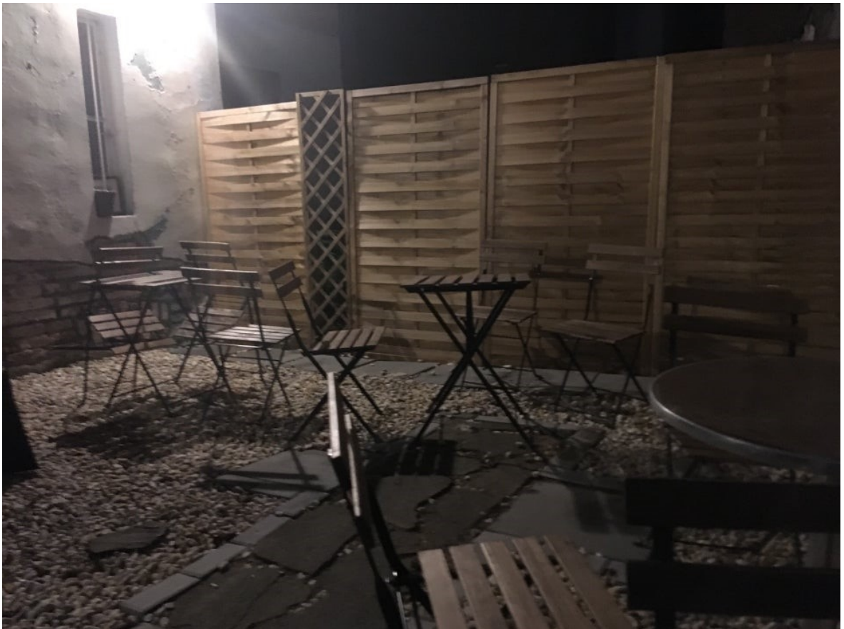
(obrázek č.3)

V průměru se za dobu pozorování na místě vystřídalo po dobu sledování (tedy většinou mezi hodinou až hodinou a půl) zhruba 30 lidí za den. Častými návštěvníky byli mladí lidé, velmi pravděpodobně studenti. Café Indigo bych dle pozorování charakterizoval jako studentský bar. Také zde byli poměrně častými hosty cizinci. Nezaznamenal jsem během svého pozorování závažnější neshody mezi návštěvníky a barmany. Pouze párkrát proběhla výměna názorů při uzavírání zahrádky, kdy se návštěvníkům nechtělo zahrádku opustit, ale po pár argumentech ze strany barmanů ustoupili a přesunuli se dovnitř kavárny.