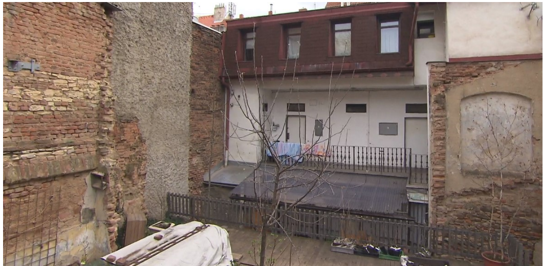
(obrázek č.7, dům pana J.)

Také je zde snaha o pěstování co možná největšího množství jedlých plodin, jak je uvedeno v části rozhovoru výše. I přes celkově pozitivní ohlasy se najdou občané, kteří k ní mají výhrady.