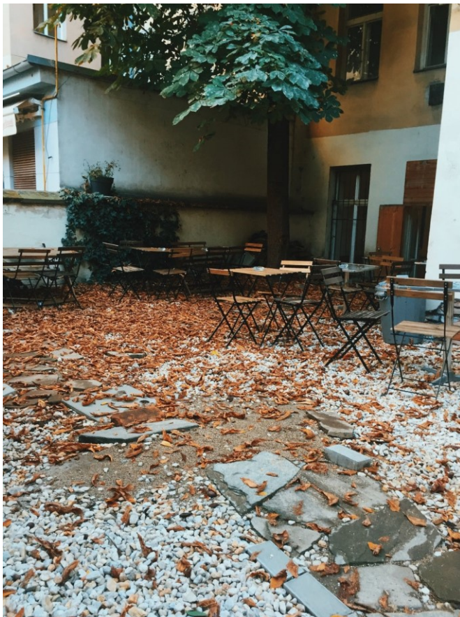
(obrázek č.2, autor)

Paní majitelka S. má přehled o obyvatelích domu v Opatovické 3, ale neví, zda jsou okolní byty pronajímány jako Airbnb (*soukromá platforma sloužící k pronájmu ubytování převážně pro turisty) nebo zda tam bydlí stálí nájemníci.