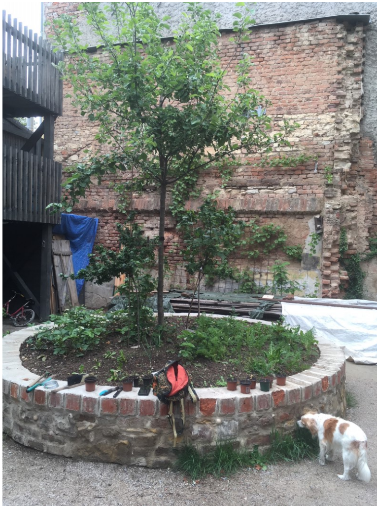
(obrázek č.6, záhon na pěstování)

Hlavním cílem a vizí Vršovické zahrady je vytvoření komunitní zahrady pro své sousedy (ale i pro kolemjdoucí), zlepšování susedských vztahů a pořádání různých aktivit, charakteristickým rysem je neziskovost zdejších aktivit. Důležité pro Vršovickou zahradu bylo i to, aby o podobě mohli rozhodovat lidé, kteří ji využívají. To potvrzuje i sama organizátorka v rozhovoru pro Českou televizi: