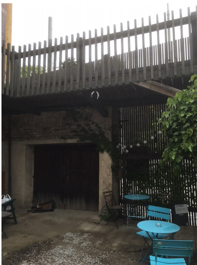
(obrázek č.4, přední část zahrady)

Komunitní zahrada byla částečně financována z participativního rozpočtu organizovaného městskou částí nadací Via a samotnými členy Zahrady.