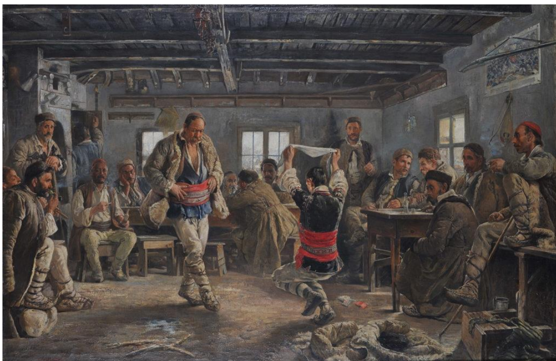
6. Jan Václav Mrkvička: Račenica, 1894, olej, plátno, 75,5 x 105 cm. Národní galerie v Sofii