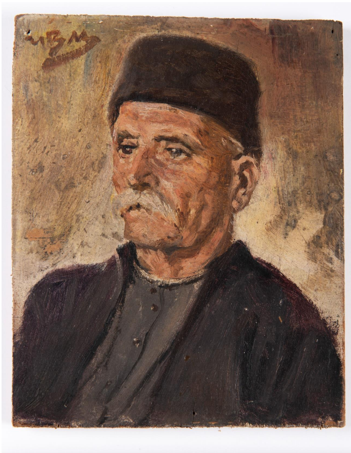
5. Jan Václav Mrkvička: Portrét muže, přelom 19. a 20. st., olej, dřevěná deska, 15 x 12 cm. Soukromá sbírka