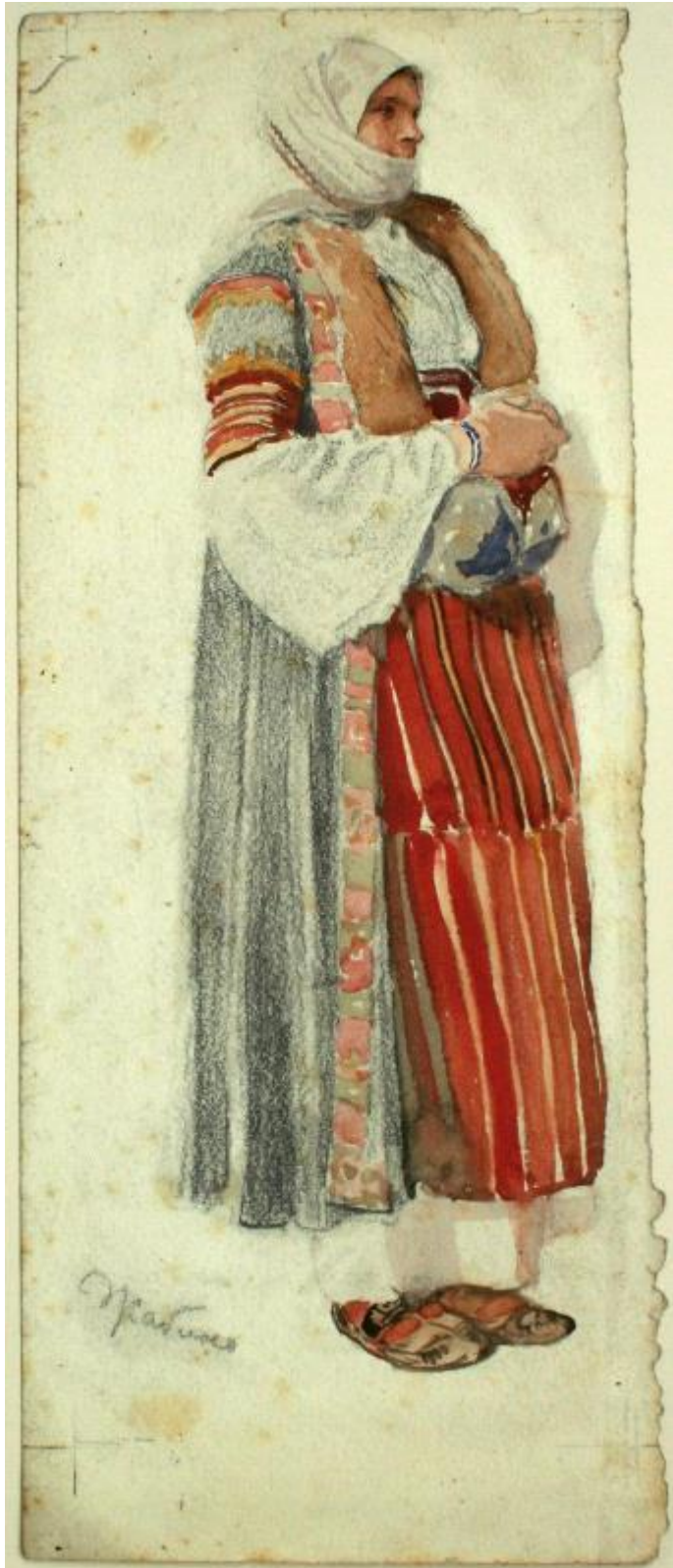
3. Jan Václav Mrkvička: Národopisná studie ženy, (kolem roku 1900), papír, uhlí, 296 x 120 mm. Moravská galerie