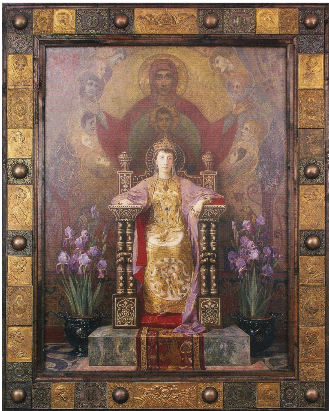
4. Jan Václav Mrkvička: Portrét kněžny Marie Louisy, 1900, olej, plátno, 256 x 192 cm. Národní Galerie v Sofii