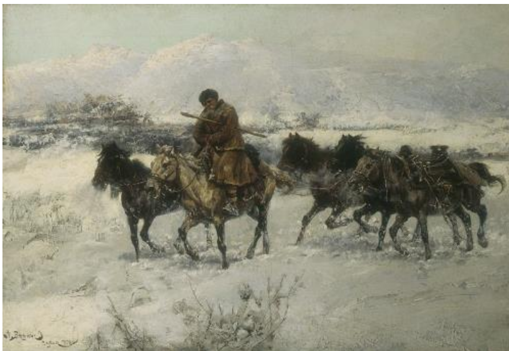
7. Jaroslav Věšín: Návrat z trhu, 1898, olej, plátno, 42,5 x 62,5 cm. Národní galerie v Sofii