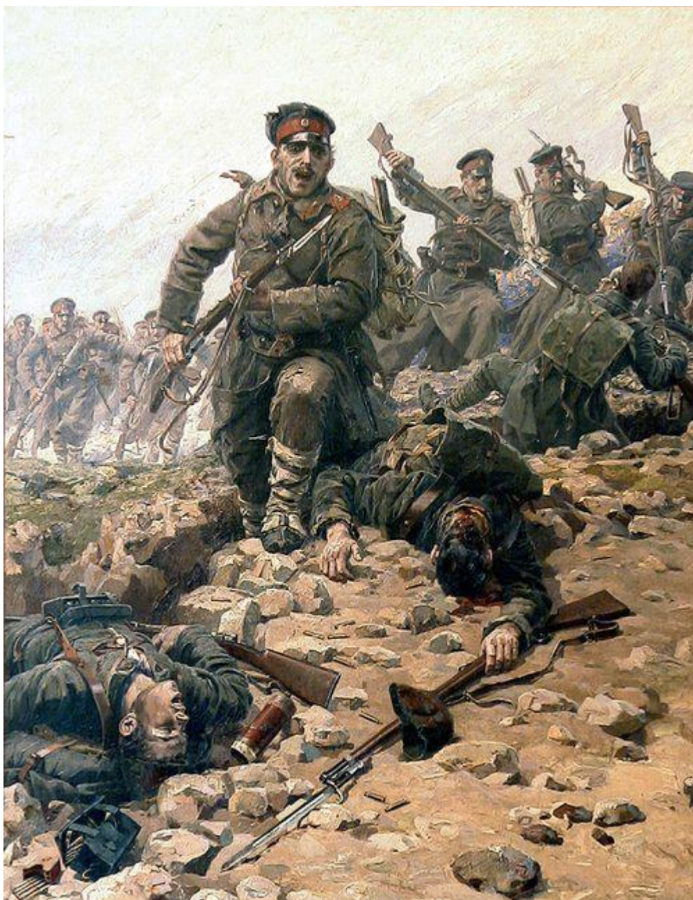
8. Jaroslav Věšín: Útok na bodáky, 1912, olej, plátno, 180 x 138 cm. Národní vojensko-historické muzeum v Bulharsku