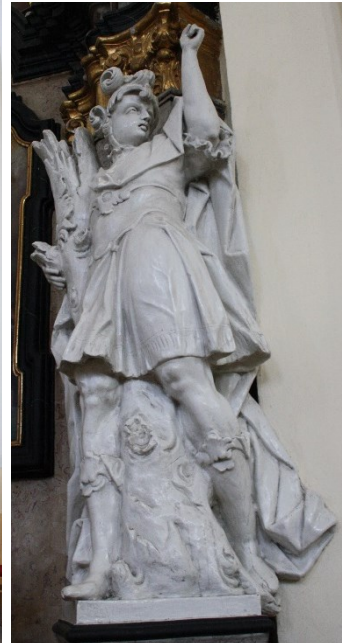
28. Příbor, kostel sv. Valentina, boční oltář sv. Jana Nepomuckého, socha sv. Floriána a sv. Šebestiána, Jan Schubert, 60. léta 18. století