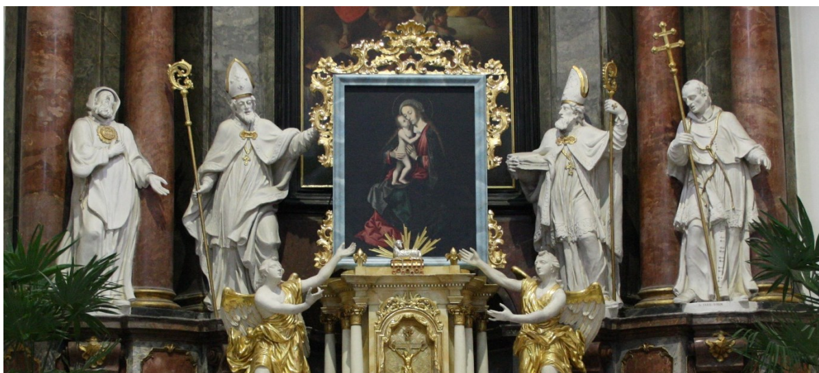
34. Strážnice, kostel Nanebevzetí Panny Marie, hlavní oltář, sochy sv. Františka z Pauly, sv. Vojtěcha, sv. Augustína, sv. Karla Boromejského, Ignác Morávek, 1745–1748