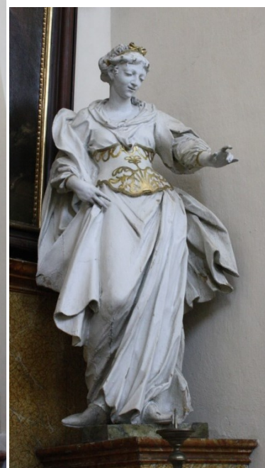
5. Bruntál, kostel Panny Marie Těšitelky, oltář sv. Anny, socha sv. Barbory a sv. Kateřiny Alexandrijské, Ondřej Zahner, 40. léta 18. století