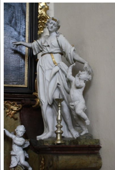
4. Bruntál, kostel Panny Marie Těšitelky, oltář sv. Josefa Kalasanského, personifikace Vzdělání a Výchovy, Ondřej Zahner, 40. léta 18. století