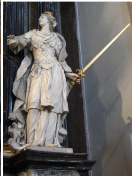
13. Kroměříž, kostel sv. Jana Křtitele, oltář sv. Rodiny, socha sv. Barbory a sv. Kateřiny Alexandrijské, sochařská výzdoba Wolfgang Träger, 1755–1759