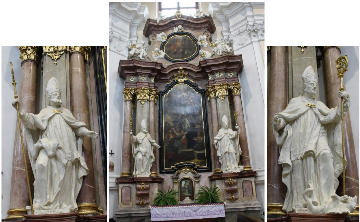
37. Strážnice, kostel Nanebevzetí Panny Marie, boční oltář sv. Jana Nepomuckého, socha sv. Vojtěcha a sv. Prokopa, Ignác Morávek, 1745–1748