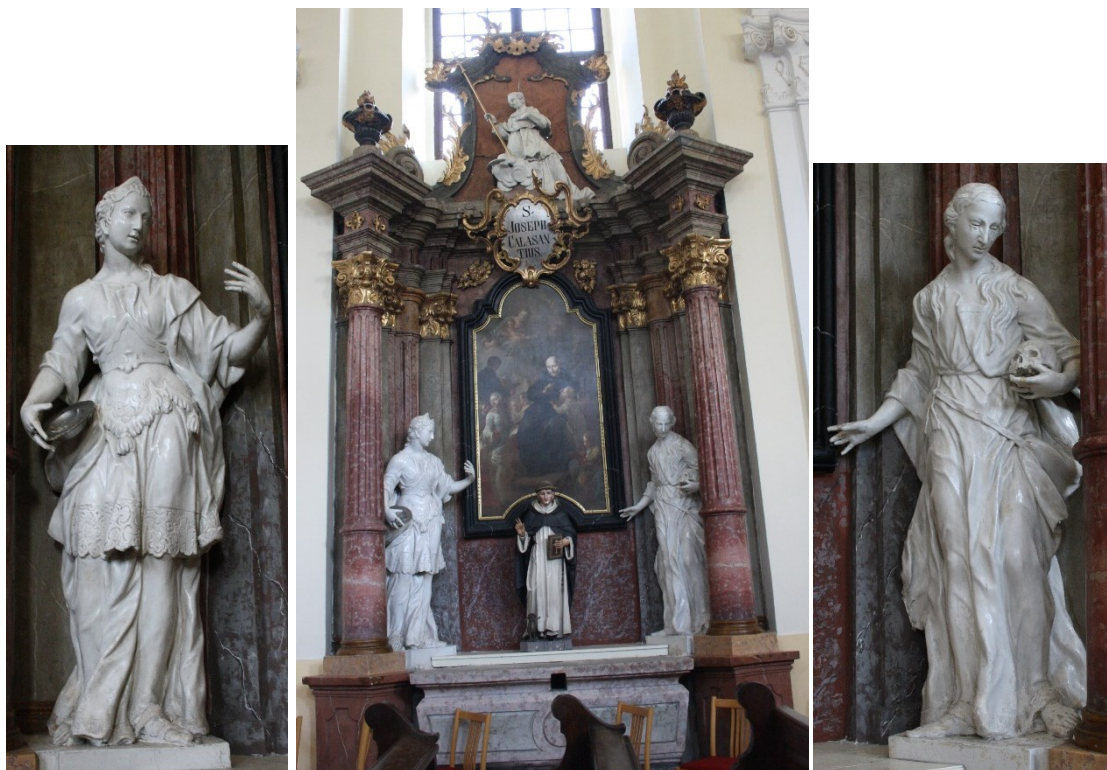
30. Příbor, kostel sv. Valentina, boční oltář sv. Josefa Kalasanského, socha sv. Doroty a sv. Maří Magdalény, Jan Schubert, 60. léta 18. století