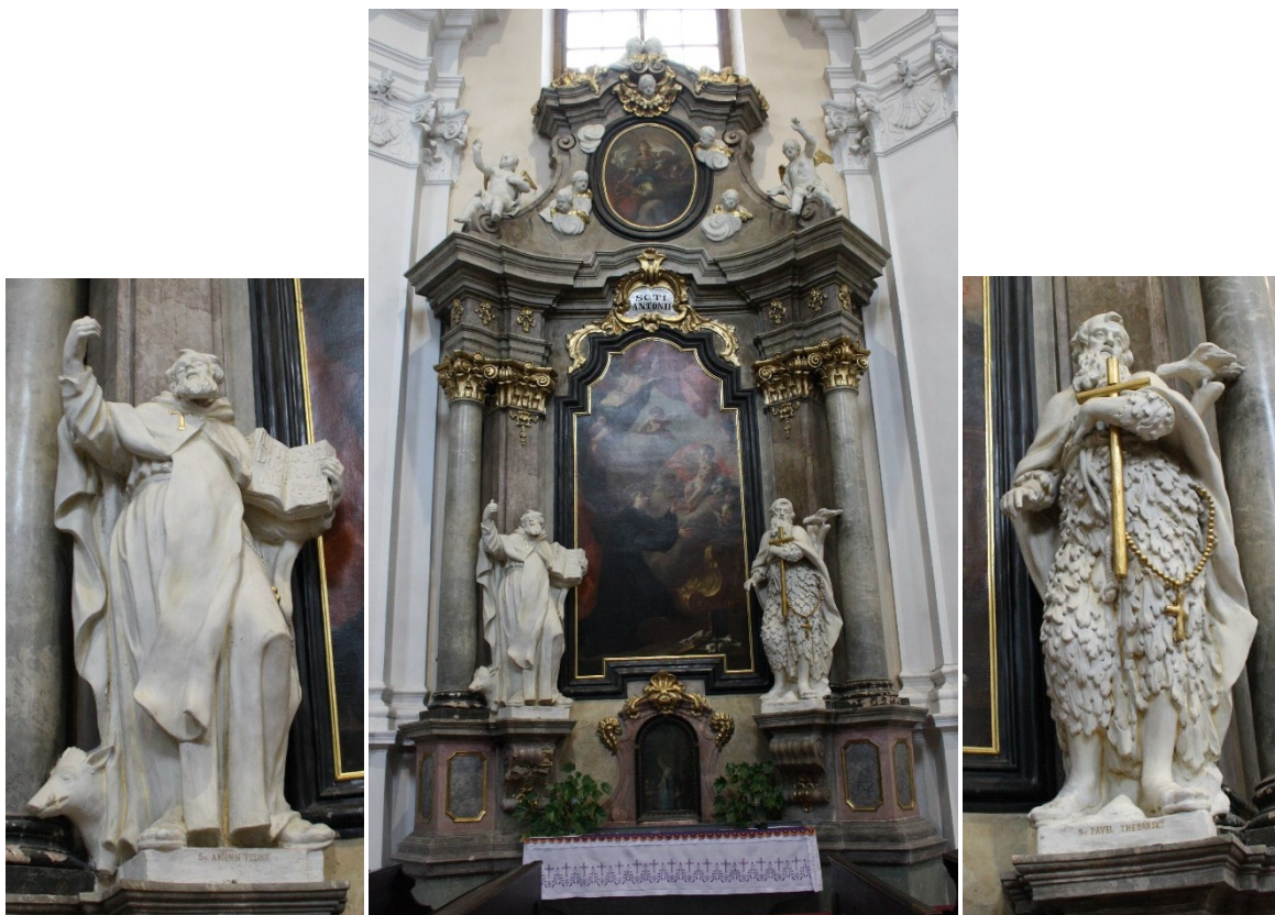
39. Strážnice, kostel Nanebevzetí Panny Marie, oltář sv. Antonína Paduánského, socha sv. Antonína a sv. Pavla Thébánského, Ignác Morávek, 1745–1748