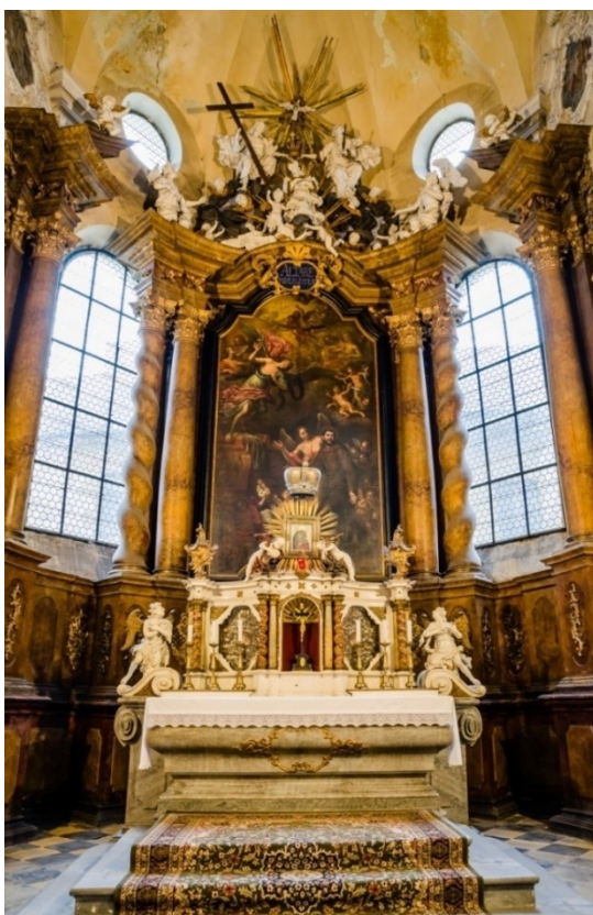
18. Lipník nad Bečvou, kostel sv. Františka Serafinského, hlavní oltář, architektura Václav Render, sousoší Korunování Panny Marie, Filip Sattler, 20. léta 18. století