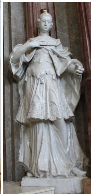
29. Příbor, kostel sv. Valentina, boční oltář sv. Josefa pěstouna Páně, socha sv. Barbory a sv. Kateřiny Alexandrijské, Jan Schubert, 60. léta 18. století