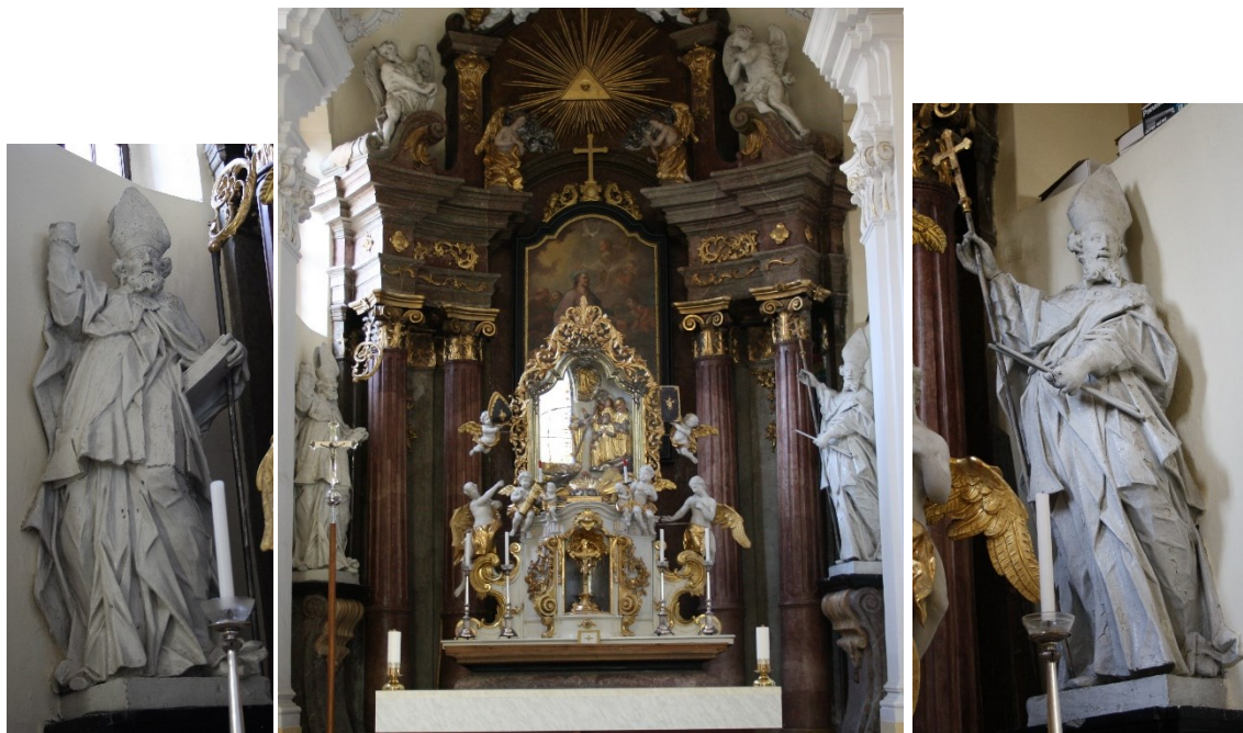
26. Příbor, kostel sv. Valentina, hlavní oltář, socha sv. Mikuláše a sv. Blažeje, Jan Schubert, 60. léta 18. století