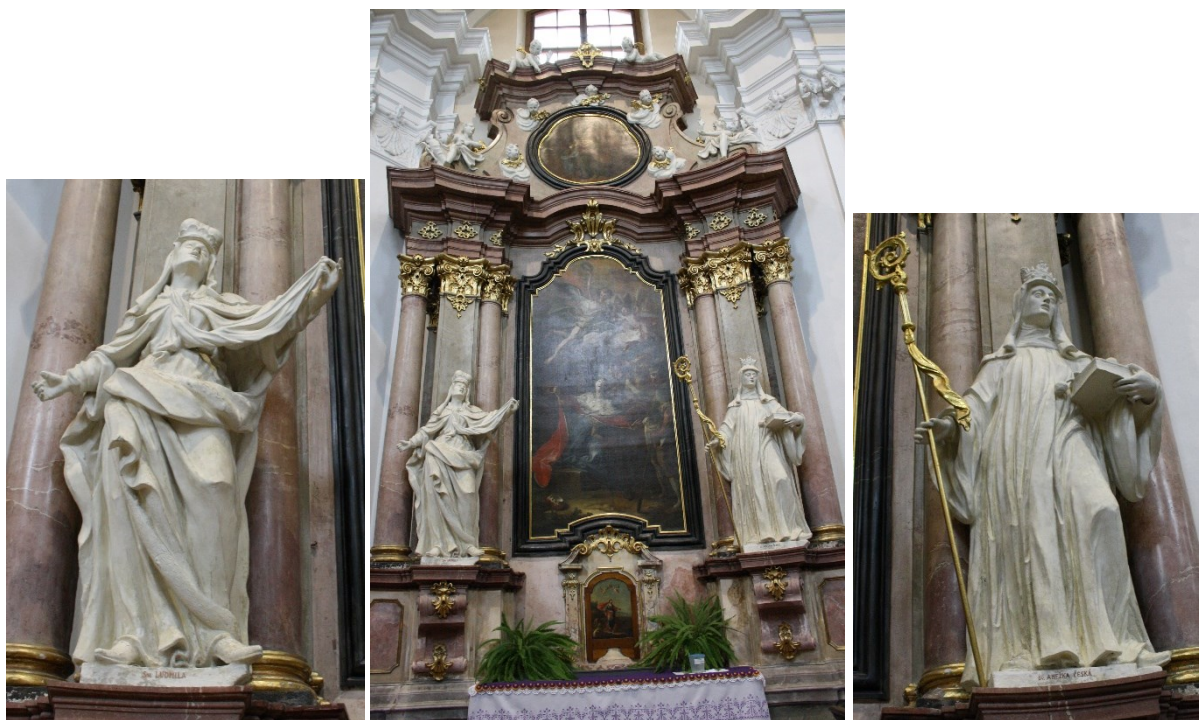
38. Strážnice, kostel Nanebevzetí Panny Marie, boční oltář sv. Václava, socha sv. Ludmily a sv. Anežky české, Ignác Morávek, 1745–1748