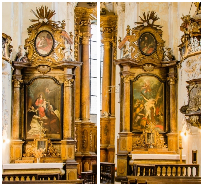
19. Lipník nad Bečvou, kostel sv. Františka Serafinského, boční oltáře Panny Marie Růžencové a sv. Šebestiána, sochařská výzdoba Filip Sattler, 20. léta 18. století