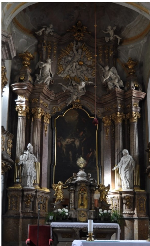
22. Mikulov, kostel sv. Jana Křtitele, hlavní oltář, sochařská výzdoba Wolfgang Träger, 60. léta 18. století