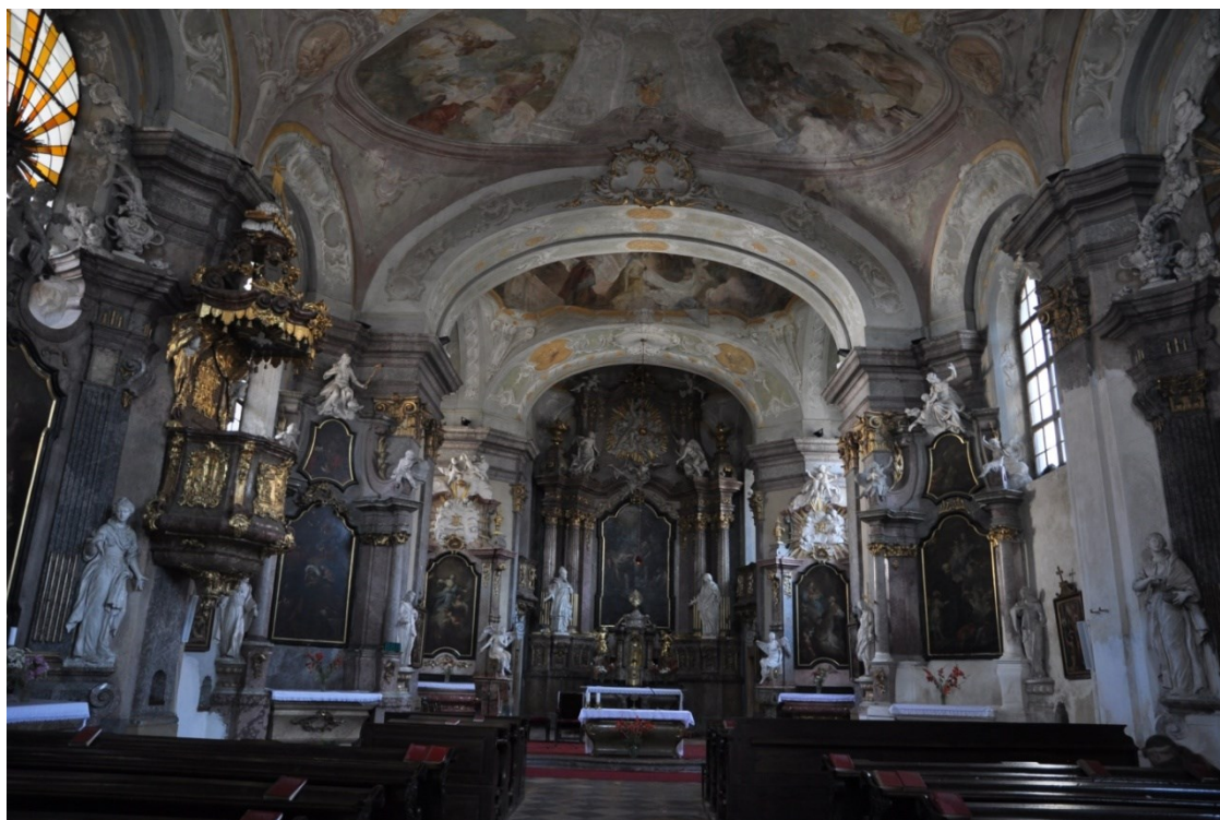
25. Mikulov, kostel sv. Jana Křtitele, hlavní oltář, sochařská výzdoba Wolfgang Träger, 60. léta 18. století