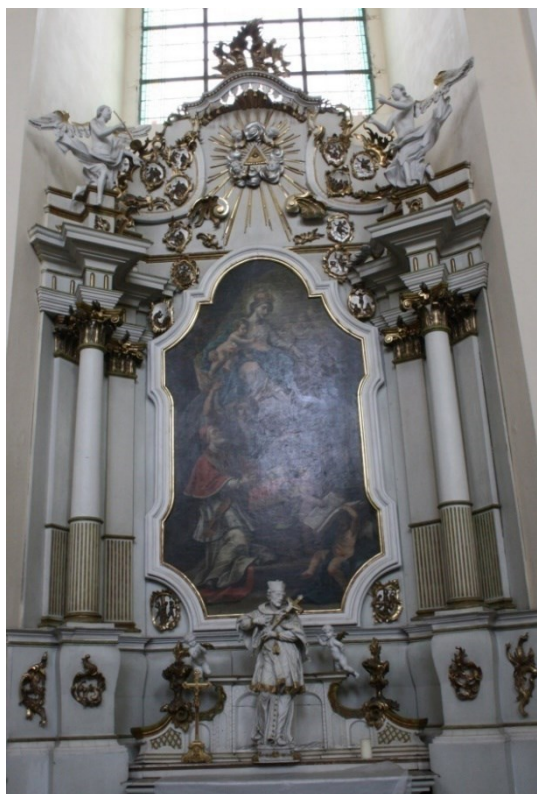
6. Bruntál, kostel Panny Marie Těšitelky, oltář Panny Marie Vítězné a sv. Pia V., sochařská výzdoba Amand Strauss, 60. léta 18. století