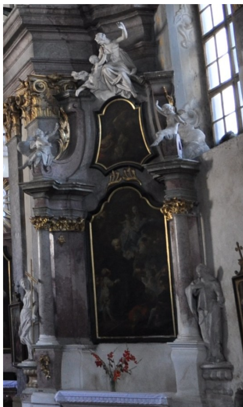
24. Mikulov, kostel sv. Jana Křtitele, boční oltář sv. Josefa Kalasanského, alegorické sochy, Wolfgang Träger, 60. léta 18. století