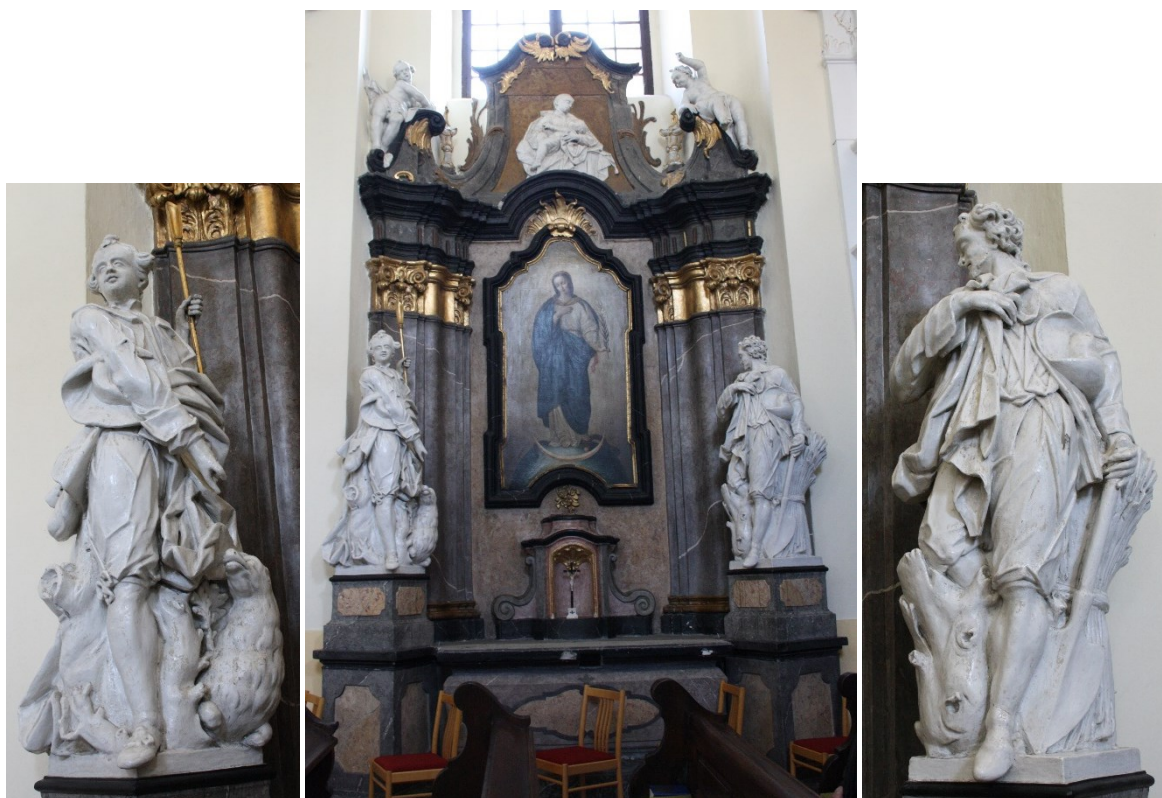
32. Příbor, kostel sv. Valentina, boční oltář Panny Marie Immaculaty, socha sv. Vendelína a sv. Isidora, Jan Schubert, 60. léta 18. století