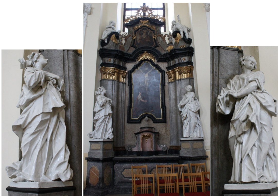
27. Příbor, kostel sv. Valentina, boční oltář sv. Kříže, socha Panny Marie Bolestné a sv. Jana Evangelisty, Jan Schubert, 60. léta 18. století