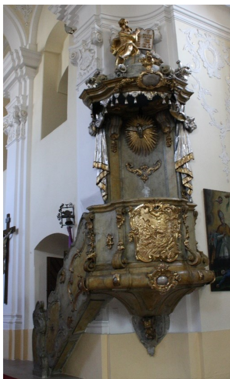
33. Příbor, kostel sv. Valentina, kazatelna, sochařská výzdoba Jan Schubert, 60. léta 18. století