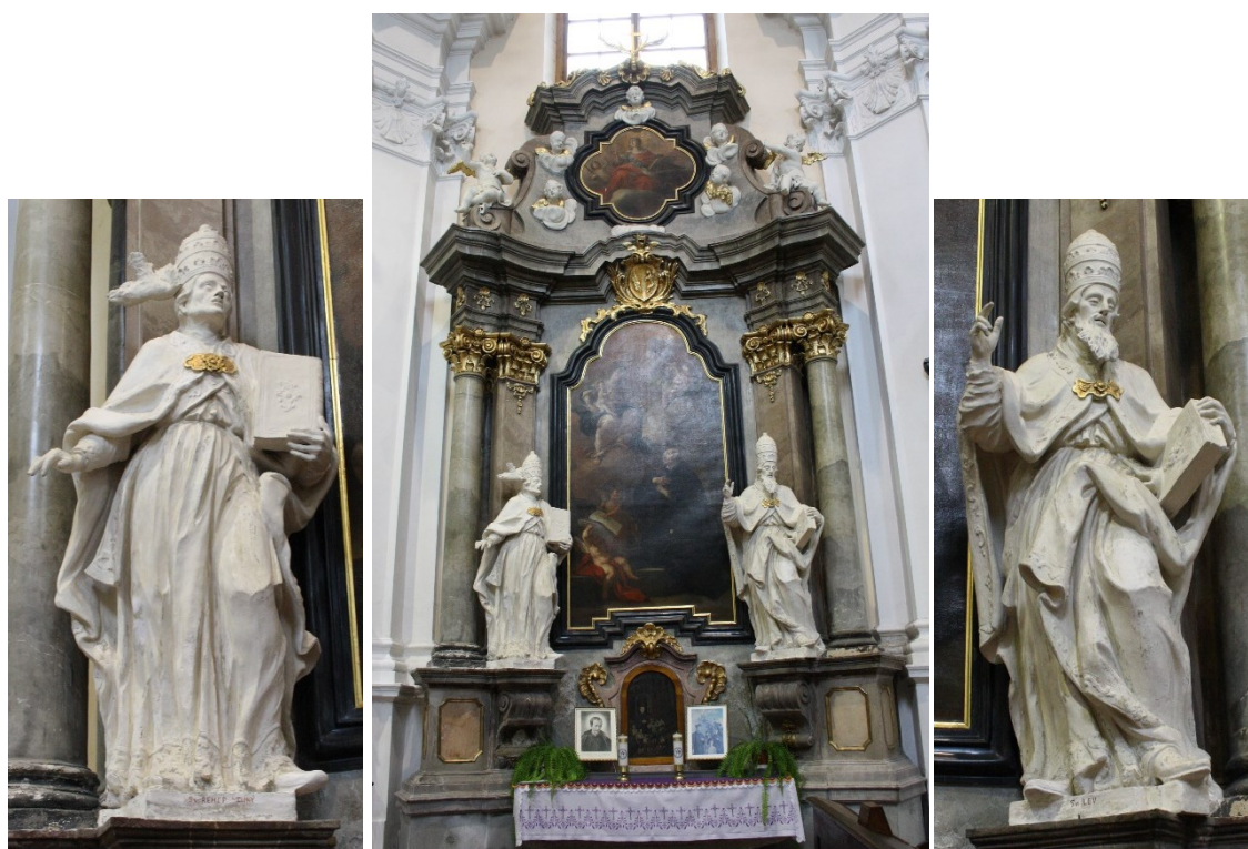
36. Strážnice, kostel Nanebevzetí Panny Marie, boční oltář sv. Josefa Kalasanského, socha sv. Řehoře a sv. Lva Velikého, Ignác Morávek, 1745–1748