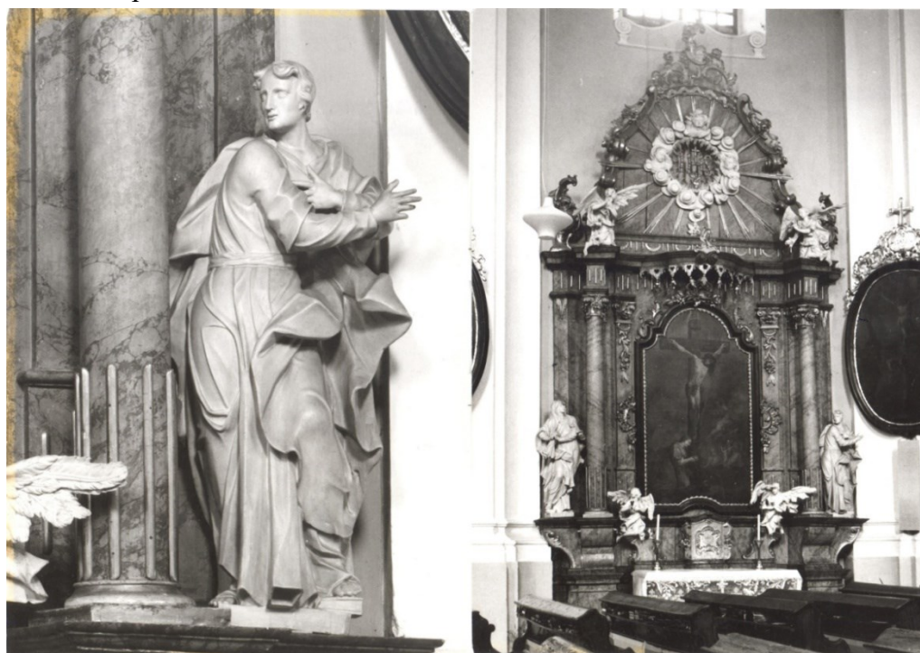
3. Bílá Voda, kostel Navštívení Panny Marie, oltář sv. Kříže, socha sv. Jana Evangelisty, Amand Strauss, 2. polovina 70. let 18. století – počátek 80. let 18. století