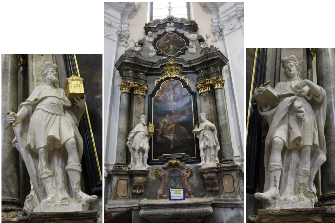
35. Strážnice, kostel Nanebevzetí Panny Marie, boční oltář sv. Josefa pěstouna Páně, socha sv. Leopolda a sv. Víta, Ignác Morávek, 1745–1748