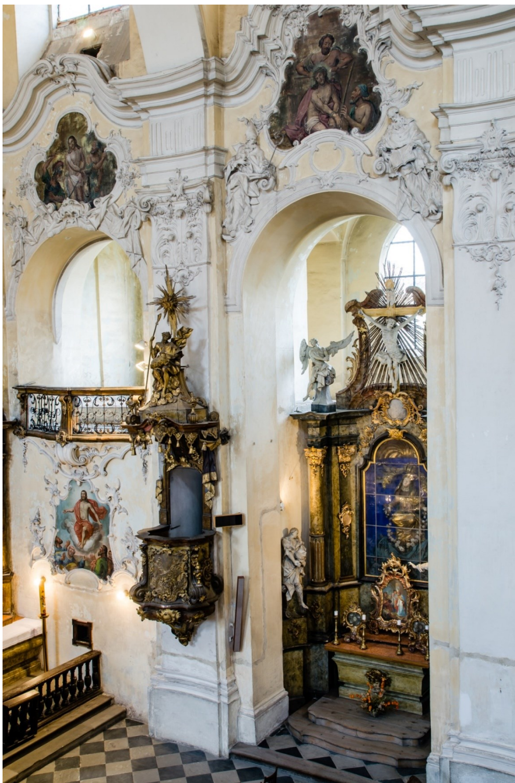
21. Lipník nad Bečvou, kostel sv. Františka Serafinského, boční kaple s oltářem Panny Marie Bolestné a kazatelna, sochařská výzdoba Jan Schubert, 60. léta 18. století