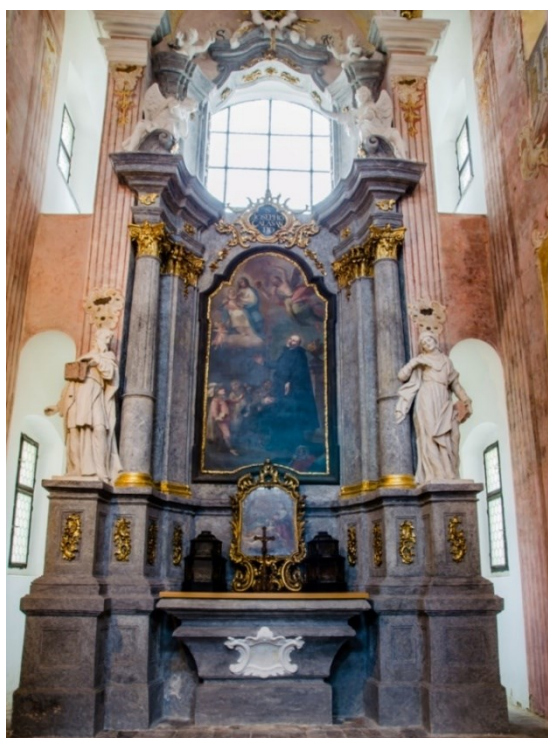
20. Lipník nad Bečvou, kostel sv. Františka Serafinského, kaple sv. Josefa Kalasanského s oltářem sv. Jana Kalasanského, socha sv. Jáchyma s sv. Anny, Jan Schubert, 60. léta 18. století