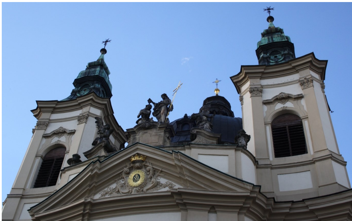
11. Kroměříž, kostel sv. Jana Křtitele, sousoší Křtu Krista, Ondřej Zahner, 1752