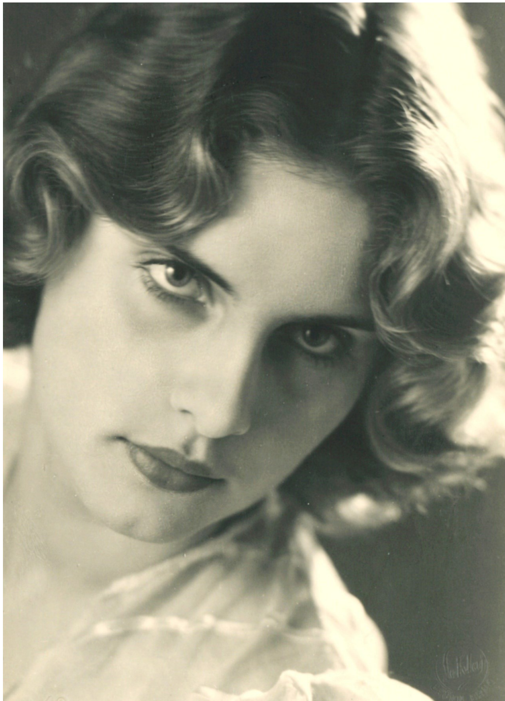
7. Posluchačka konzervatoře (1944)