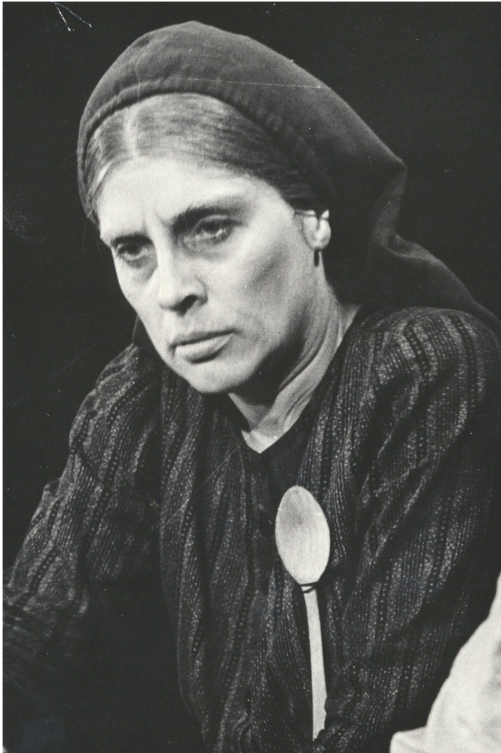
17. Matka Kuráž (1964)