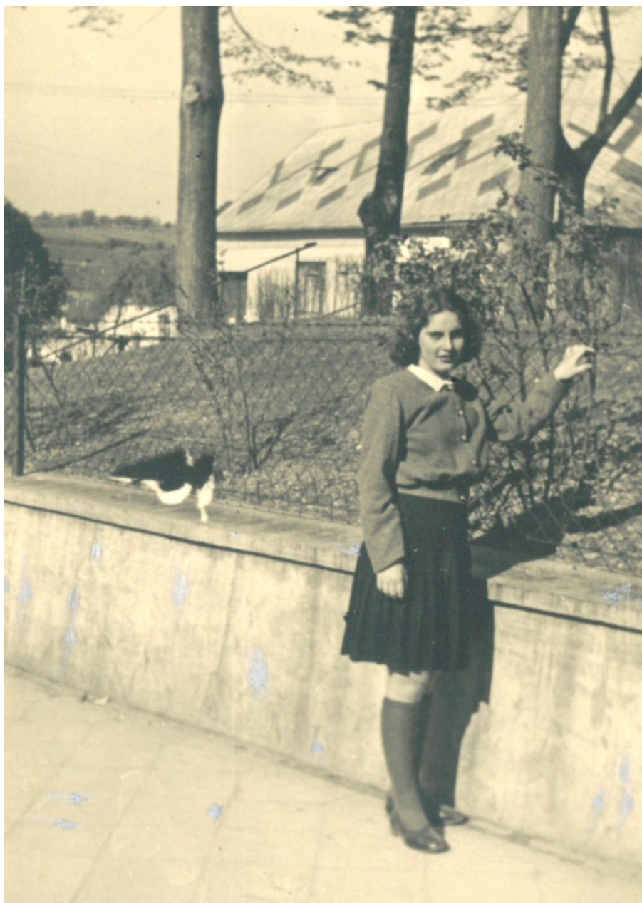
4. Studentka gymnázia v Brně-Husovicích (1943)

který patřil mezi humanitní, které jak sama dosvědčila, měla raději. Stalo se tak někdy v období mezi říjnem a listopadem 1941. 205 Místo toho se však objevila zřejmě její další studijní noční můra vedle matematiky, možná i horší. Tou byla výuka latinského jazyka. Kromě jediného II. pololetí, kdy „uhrála“ latinu za tři, měla na vysvědčení vždy samé čtyřky. Je tedy jisté, že pokud by se jí někdo na latinu zeptal, nerada by vzpomínala na dobu, kdy se musela učit latinské deklinace.