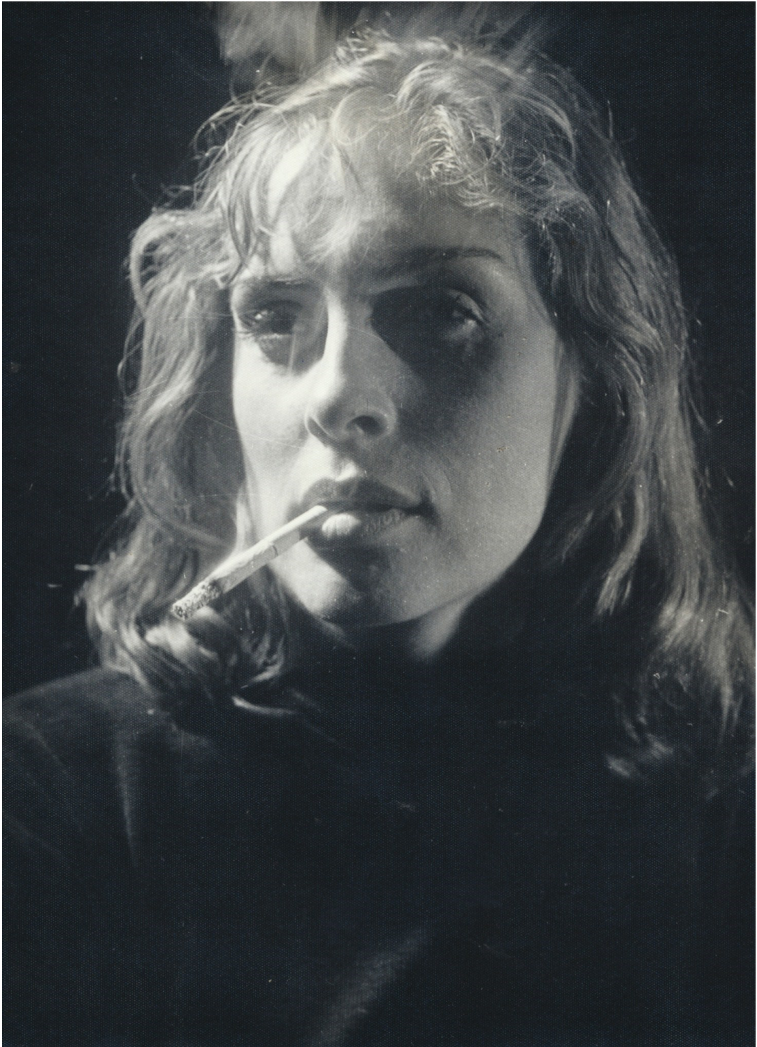
12. Soňa v Aristokratech