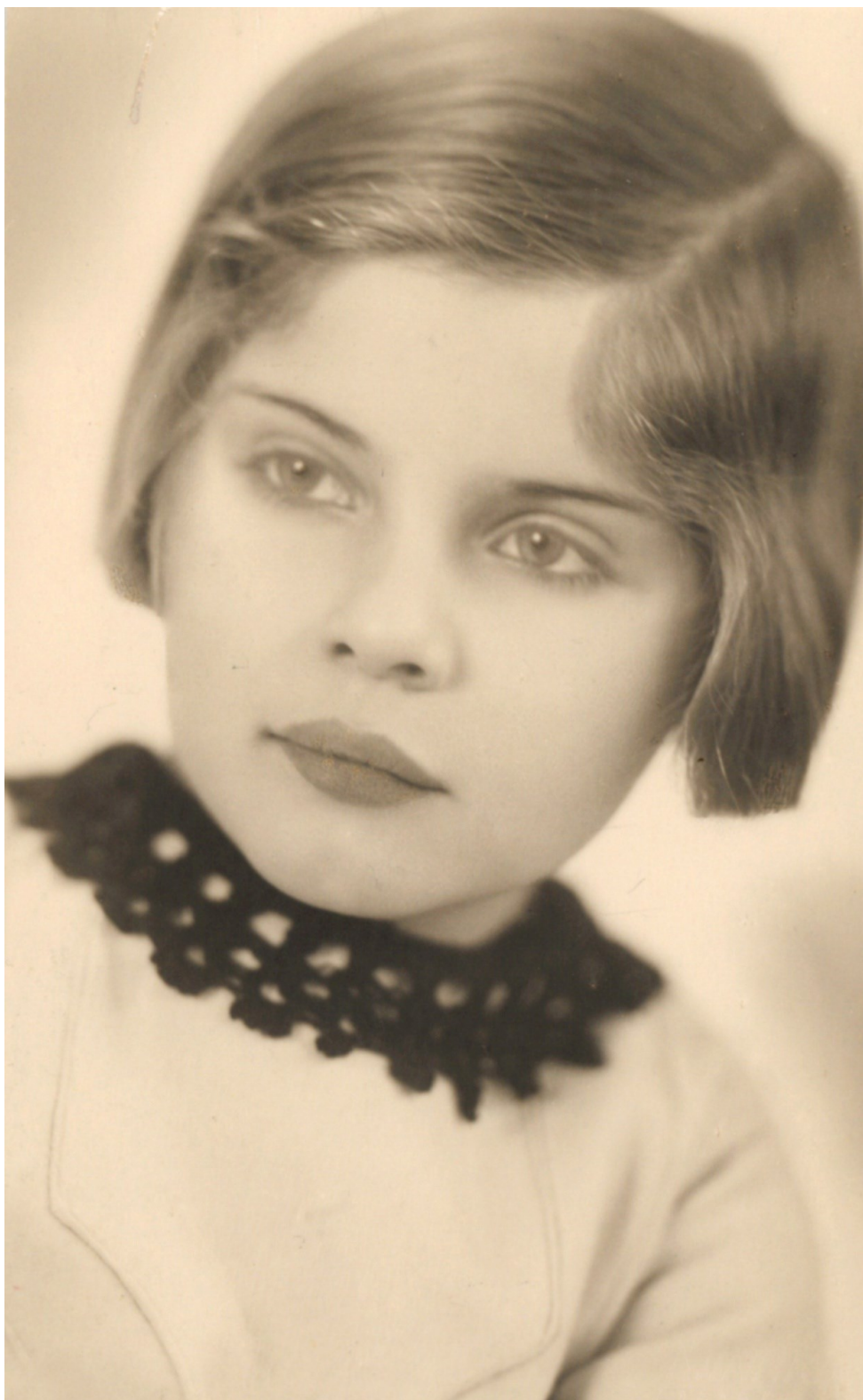
3. Jako pětiletá dívka (1933)