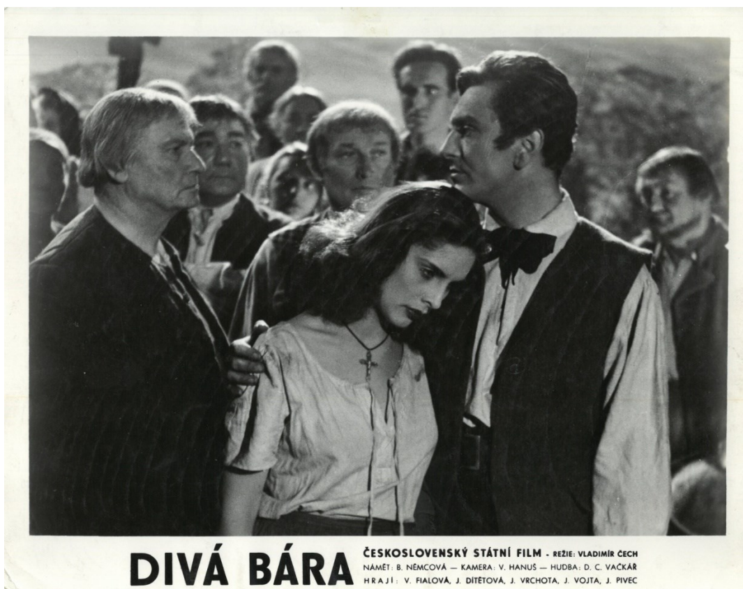
21. Zachráněna myslivcem z hořící márnice