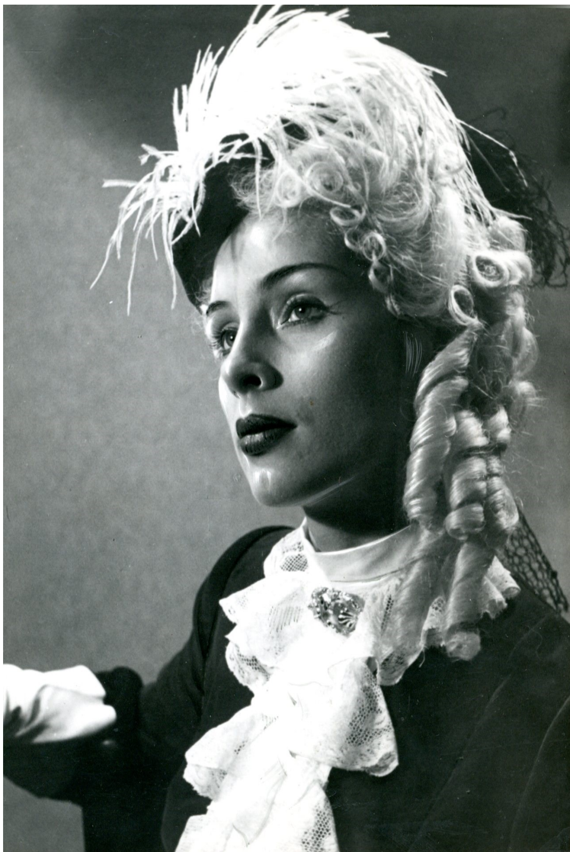
10. Kněžna v Lucerně , počátek 50. let