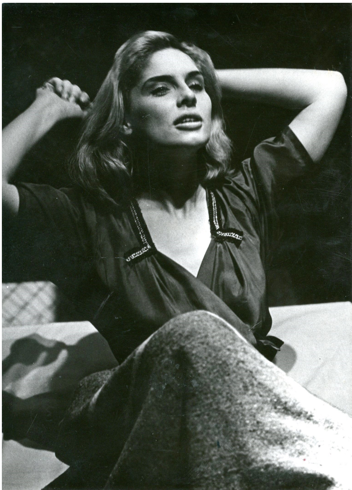
14. Šansoniérka v Totálním kuropění (1961)