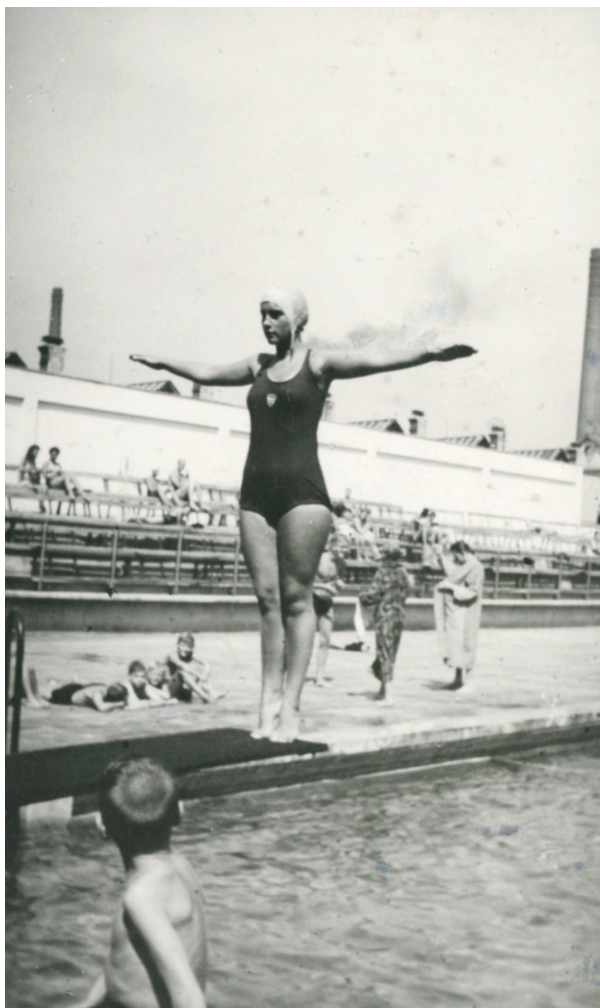
6. Na prkně před skokem vzad v brněnských Zábrdovicích (1943)

vyhořeli, bohužel jsem o ten broušený klenot přišla. Ovšem moje radost z vítězství byla znásobena pocitem, že Moravanka z Brna zvítězila nad pražskými závodnicemi, které měly, pokud co se tréninku týče, daleko větší možnosti než já. 221