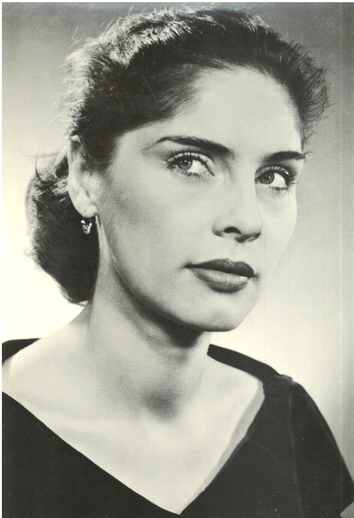
9. Portrét od Viléma Rosegnala z konce 50. let.