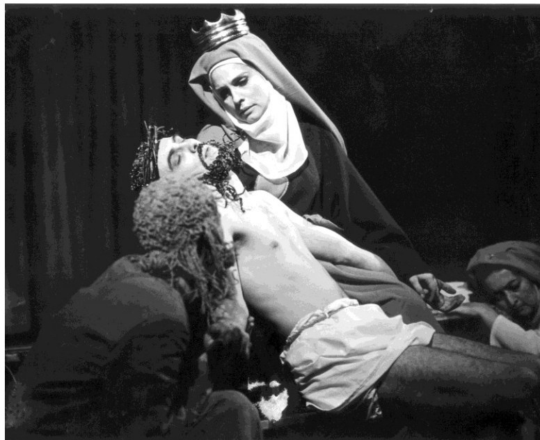
18. Matka Marie držící v náruči svého z kříže sňatého syna (1965)