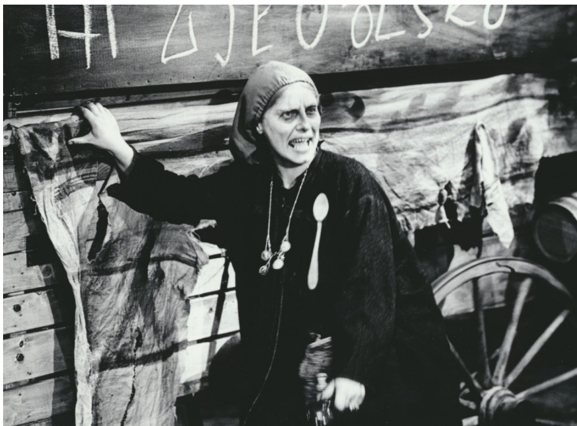
15. Matka Kuráž u svého povozu (1964)