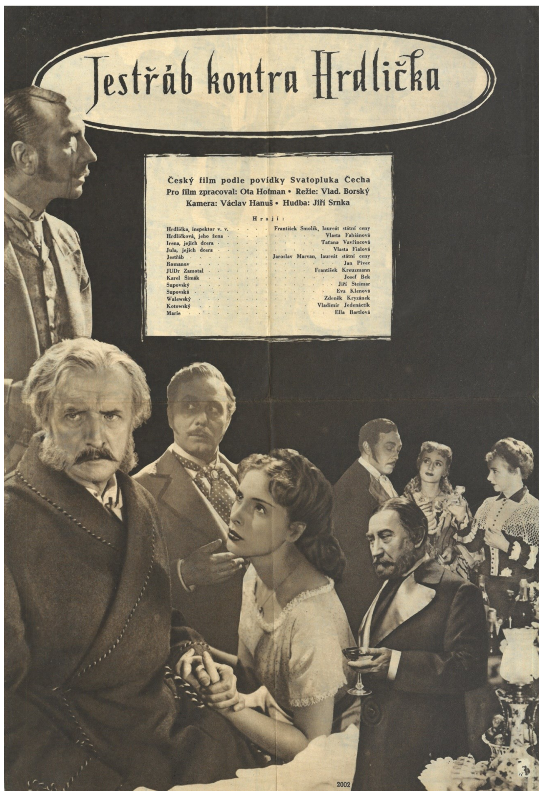
25. Dobový plakát k filmu Jestřáb kontra Hrdlička (1953)