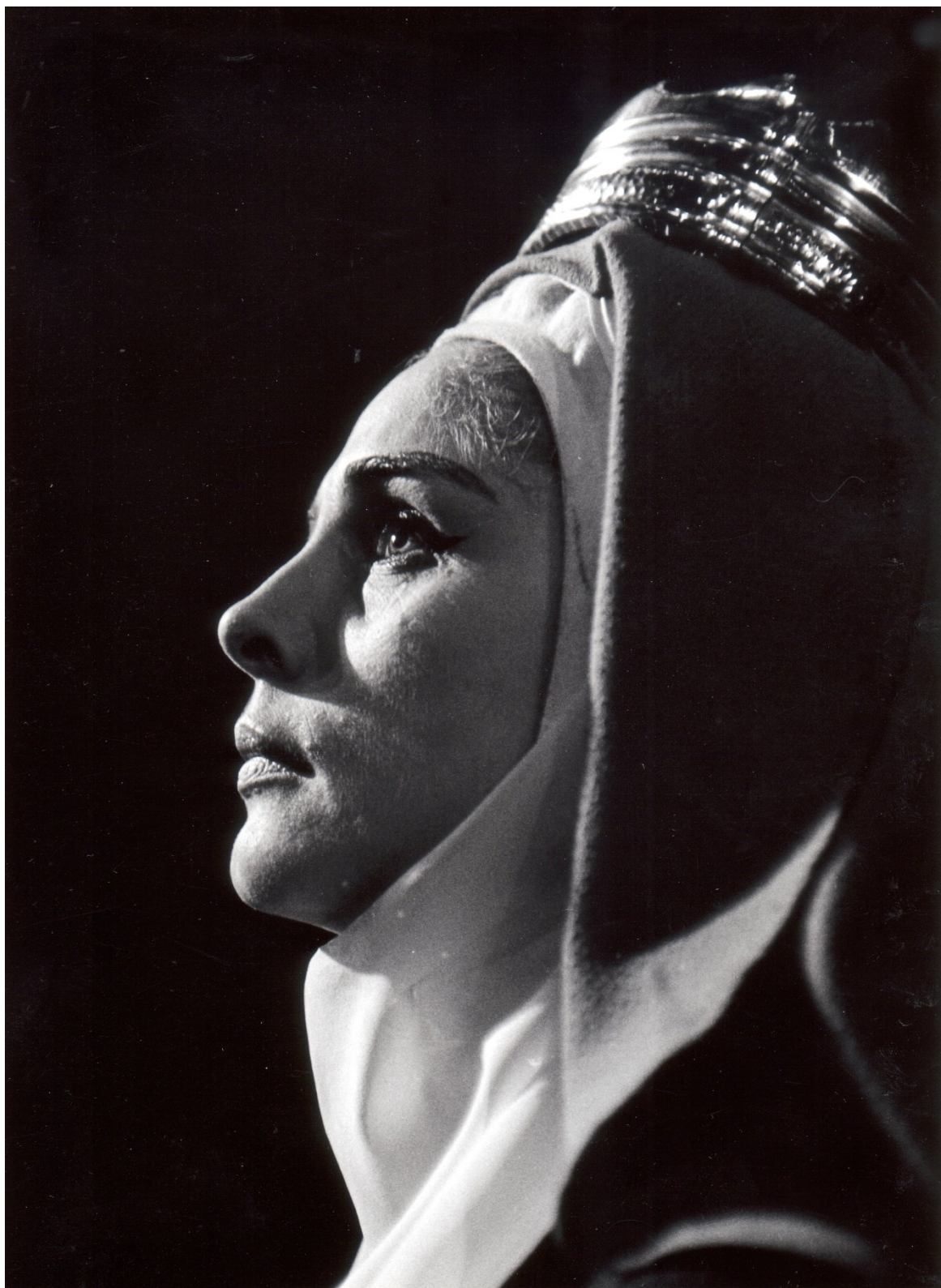
19. Matka Marie v Komedii o umučení (1965)