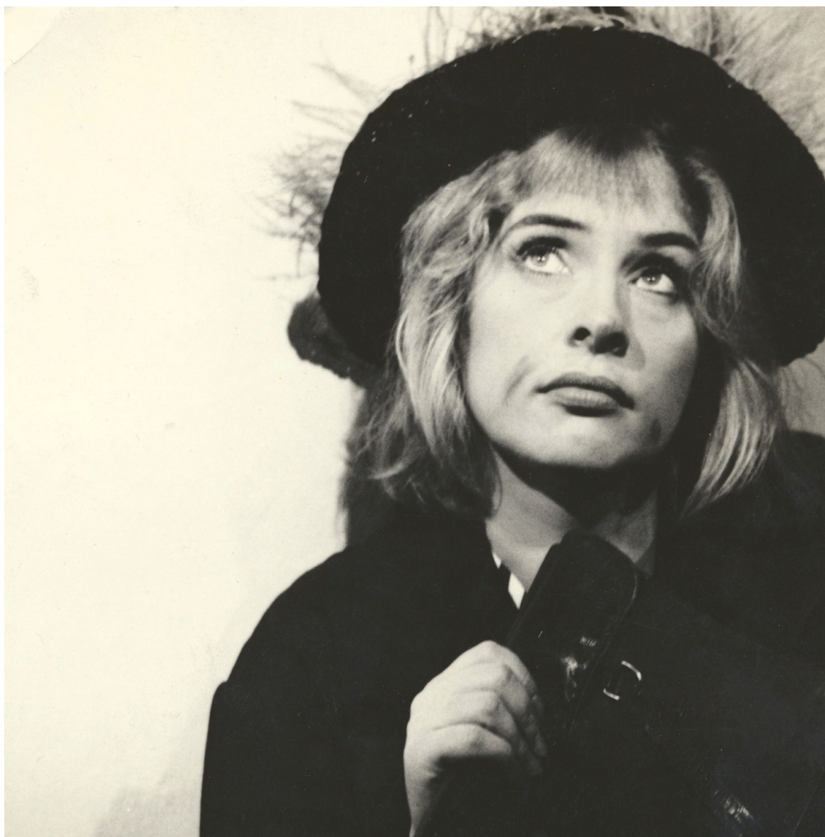
13. Liza Doolittlová v Pygmalionu (1961)