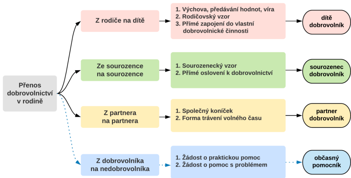
Schéma 2: Přenos dobrovolnictví v rodině