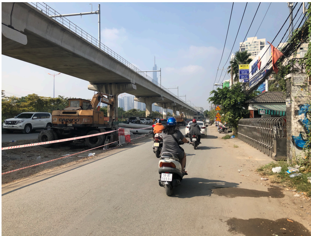
Obr. č.1. Ulice v D2