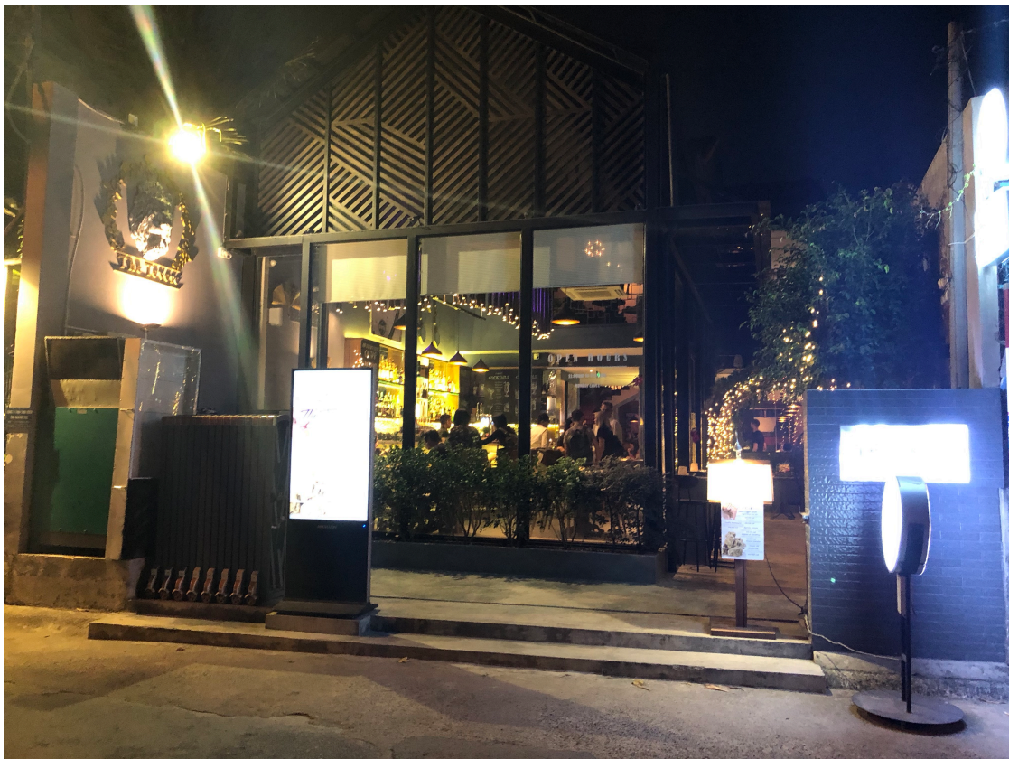
Obr. č.4. Restaurace Tevere