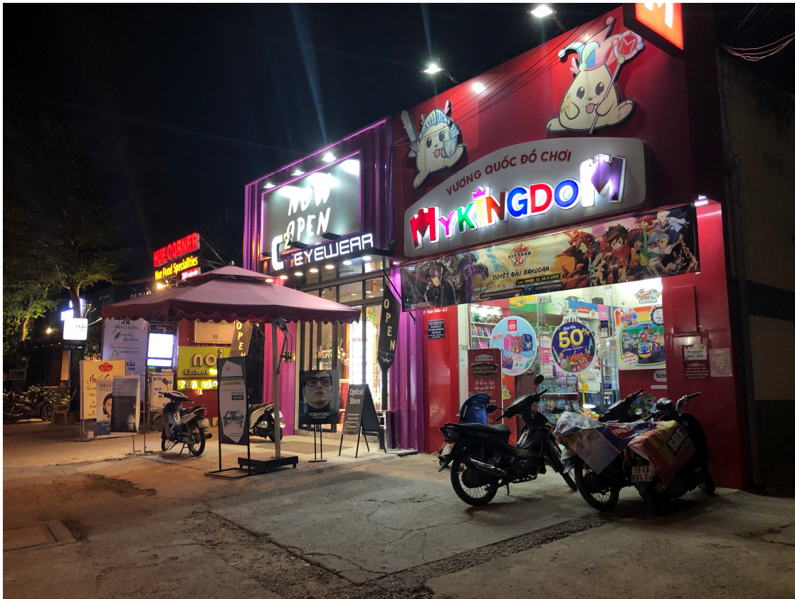
Obr. č.3. Obchody na D2