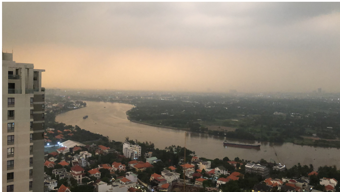
Obr. č. 2. Výhled na D2