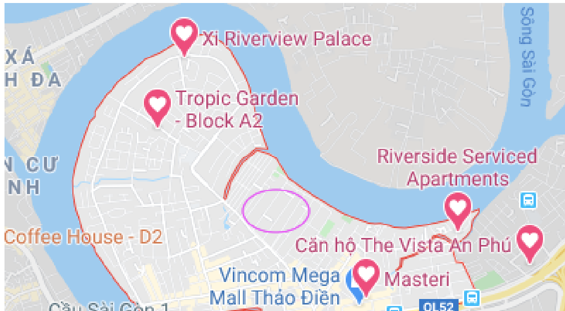
Mapa č.1 komplexy, kde aktérky bydlí