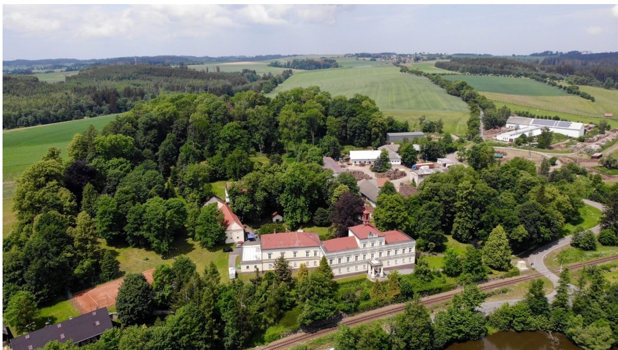
Rozsochatecký zámek dnes (v pozadí areál bývalého JZD)