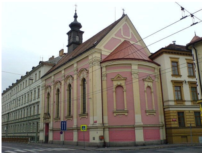
Kostel Božského Srdce Páně v Českých Budějovicích (budova vpravo je českobudějovický mateřinec)