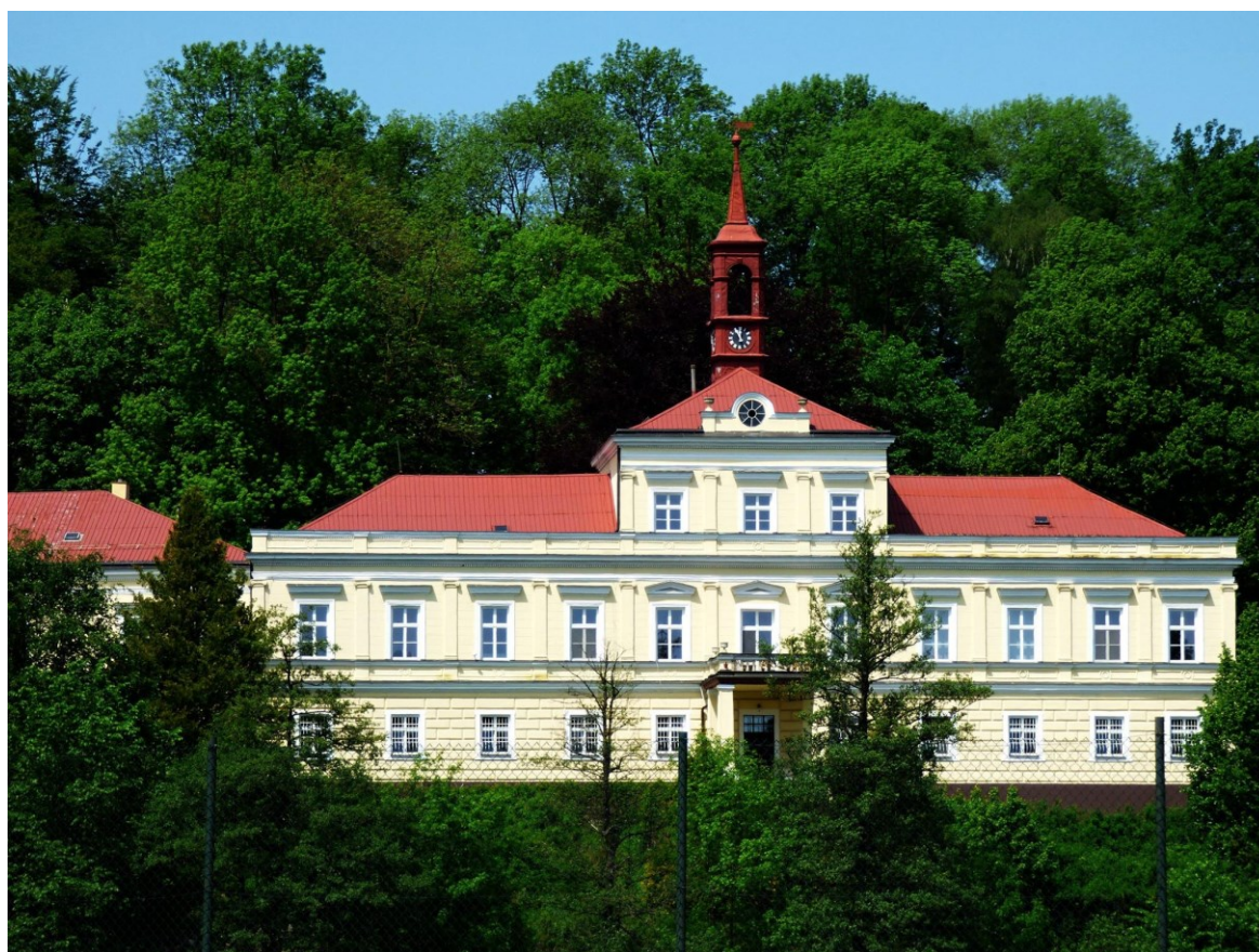
Rozsochatecký zámek – tzv. nový zámek (vlevo starý zámek)