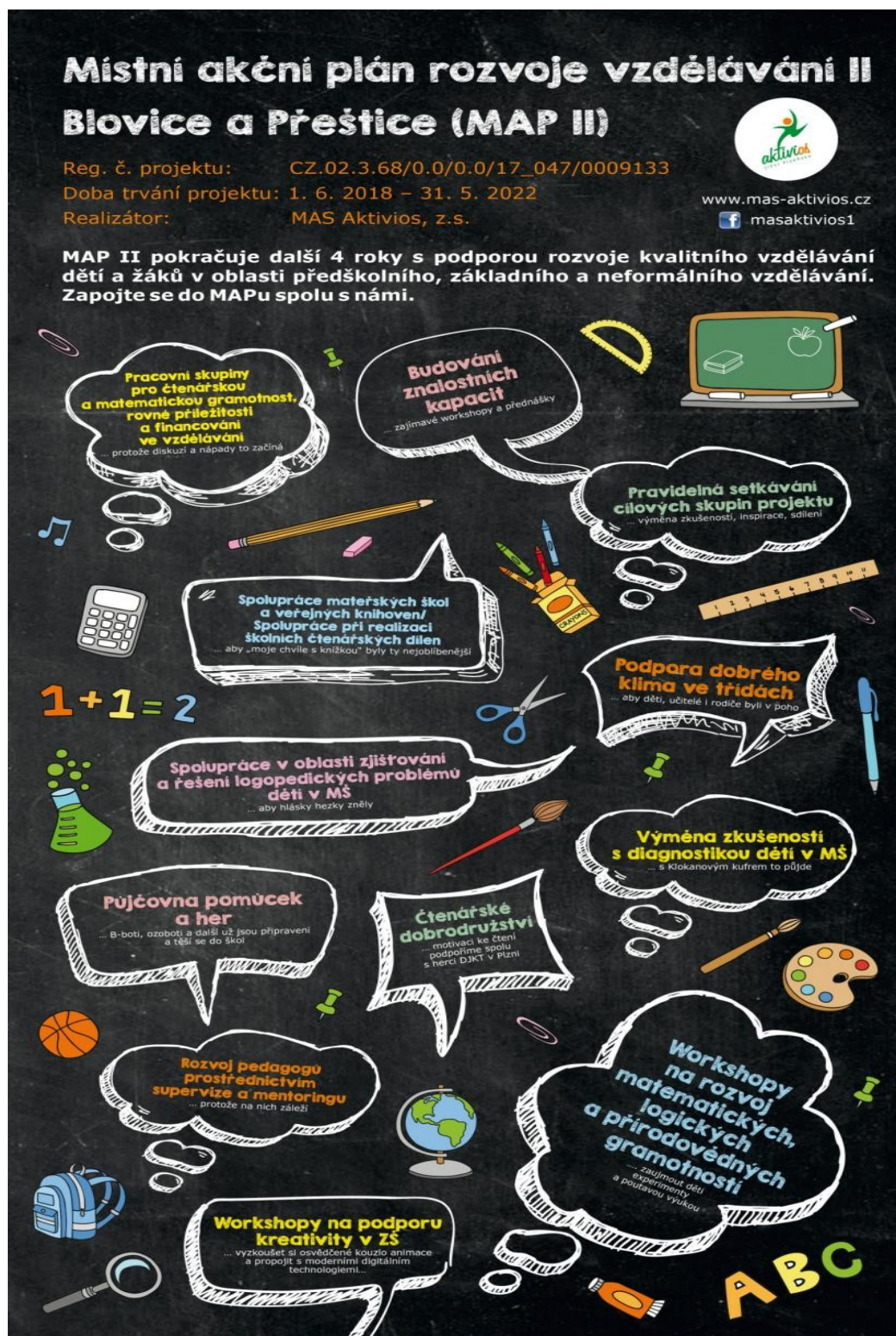
Obrázek 2. Informační leták