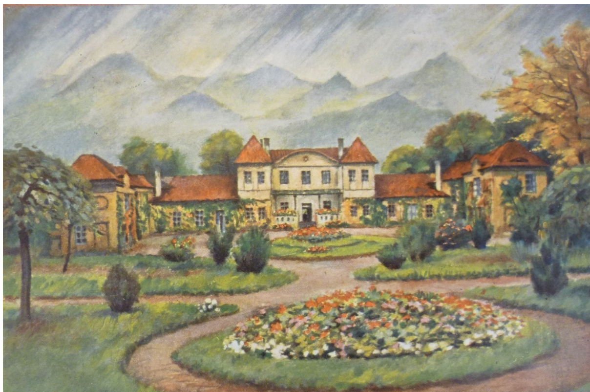
Obrázek 3: Plán tuchlovského zámku (půdorys).