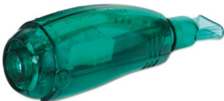
Obrázek 2.2.5.4 Acapella

RC-Cornet je zařízení ve tvaru dutého rohu, uvnitř kterého je vložená gumová rourka. Během výdechu přes zařízení dochází k jejímu rozkmitání, tak dojde k nárazům na stěny dutého rohu. Tyto nárazy pak vedou k vytvoření jemného bronchiálního chvění. RC-Cornet usnadňuje odstranění nadměrné bronchiální sekrece z dýchacích cest. Při výdechu přes RC-Cornet se v dýchacích cestách tvoří pozitivní tlak. Tento tlak umožní udržet dýchací cesty otevřené déle a proudící vzduch se tak může dostat za hlen a snadněji ho posunout ven z dýchacích cest. (Smolíková a Máček, 2006; Zdařilová et al., 2005)