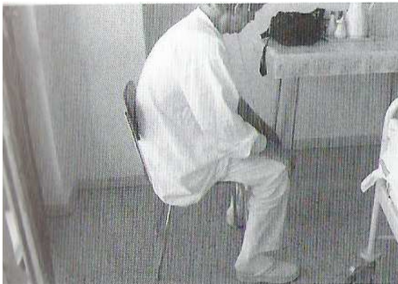
Obrázek 2.2.9.1 Úlevová poloha kočího na kozlíku

Další možností relaxace je například využití jógy a jógového dechu. Právě na jógový dech se zaměřuje Shaw (2015) ve své studii, kde uvádí, že “specifická sekvence jógového dýchání může snížit každodenní stres, úzkosti, deprese, posttraumatický stres a stresem způsobená onemocnění”. (Malátová et al., 2017; Smolíková a Máček, 2006)