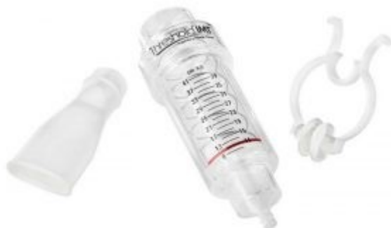
Obrázek 2.2.5.1 Threshold IMT

dávkovat podle aktuálního stavu. Výhodou tohoto zařízení je, že po úvodní edukaci a instruktáži o použití od fyzioterapeuta je pacient schopen zařízení používat sám v rámci autoterapie kdykoli během dne. (Smolíková a Máček, 2006; Neumannová a Kolek, 2012; Burianová, 2013)