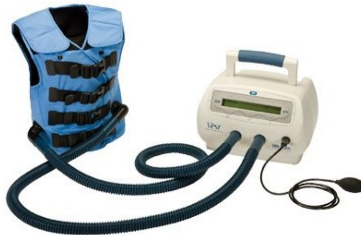
Obrázek 2.2.6.2 The Vest Airway Clearance

Siemox je přístroj určený k odhlenění dýchacích cest. Přístroj během výdechu generuje vibrační signál ve formě krátkých impulzů podtlaku o konstantním objemu vzduchu. Tyto impulzy rozpouští hlen v periferních dýchacích cestách do kapalnější formy. Hlen se tak snadněji dostane do centrálních dýchacích cest a je možné jej vykašlat. (PhysioAssist)