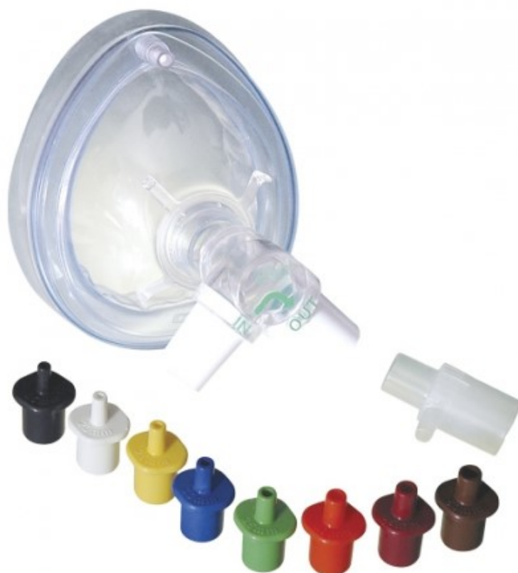
Obrázek 2.2.5.2 PEP maska

Flutter se používá ke snížení viskoelasticity hlenu, také pomáhá ke snazšímu odstranění hlenu z dýchacích cest a tím přispívá k efektivní expektoraci. Jedná se o zařízení ve tvaru dýmky, v jejímž konusu je malá kmitající kulička. Oscilující vibrace vzduchu tvořené kmitající kuličkou se přenáší do dýchacích cest a tím působí na posun hlenu. Velikost odporu při výdechu je dána polohou flutteru a silou výdechu. Při použití flutteru je zásadní osvojit si zásady jeho správného použití, jelikož jeho chybné použití může vést ke vzniku únavy a ztíženého dýchání. Výchozí polohou pro použití flutteru je vzpřímený sed u stolu, lokty jsou opřené o stůl, v jedné ruce drží pacient flutter a druhou fixuje tvář, aby se při výdechu nenadouvaly. Pro kontrolu a prevenci chyb při používání flutteru je vhodné nacvičovat dýchání s ním před zrcadlem. Jakmile pacient ovládne základní dechovou techniku přes zařízení flutter, je možné polohu flutteru různě modifikovat. (Neumannová a Kolek, 2012; Smolíková a Máček, 2006)