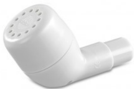
Obrázek 2.2.5.3 Flutter

Acapella slouží k uvolnění a snazšímu odstranění sekrece z dýchacích cest a k posílení výdechových svalů. Tato pomůcka je založena na principu oscilujícího pozitivního výdechového tlaku. Při výdechu ventil přerušuje průtok vydechovaného vzduchu, a tak generuje oscilace. Není závislá na poloze a lze ji použít i u intubovaných pacientů. (Neumannová a Kolek, 2012; Žurková a Skříčková, 2012)