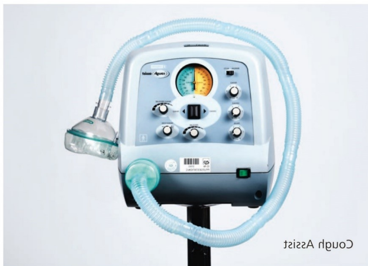
Obrázek 2.2.6.1 Cough Assist

CoughAssist je neinvazivní přístrojová metoda využívaná především k podpoře efektivní expektorace. Terapie s CoughAssist se skládá ze dvou fází. První fází je mechanická insuflace, tedy asistovaný prohloubený nádech. Mechanická insuflace je hned následována rychlou mechanickou exsufací – rychlý výdech přes otevřená ústa sloužící ke zvýšení a prodloužení výdechové rychlosti. Jeden cyklus sestává ze 6 nádechů a výdechů, obvykle se aplikuje 4–5 cyklů. CoughAssist se dá využít i u pacientů nespolupracujících nebo napojených na tracheostomii. (Neumannová et al., 2013)