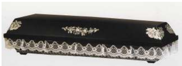
Rakev "R 25" používaná při smutečním obřadu "Requiem"

dostatečné finanční prostředky ani na umělé květiny.“ 99 Přesto zastává názor, že: „pokud se příbuzní rozhodli uspořádat pohřeb bez obřadu právě pod ekonomickým tlakem, prožívají později trýznivou lítost, že neuspořádali pohřeb tak, »jak se patří.«“ 100 Podle mého názoru není půjčená květinová výzdoba hodna zatracení, protože umožňuje i sociálně slabým rodinám vypravit pohřeb s obřadem. Každý, kdo vypravuje pohřeb má nárok na sociální dávku, která činí 5.000 korun.