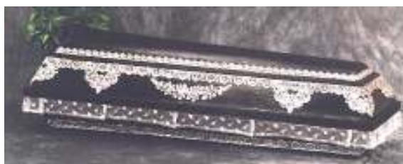
ekologická papírová rakev

dřevěné a při spalování neprodukuje takové množství zplodin jako rakev dřevěná. V české republice ekologické rakve ji nabízí společnost Komes, spol. s r.o., sídlící na Praze 3.