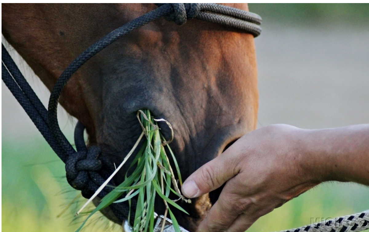
Fotografie č. 12 – Důvěra (bázlivý pacient/klient začal koni, díky jeho povzbuzení, důvěřovat a odvážil se ho nakrmit).

Na fotografii č. 11 vidíme koně, který povzbuzuje a vybízí bázlivého pacienta/klienta ke kontaktu s ním.