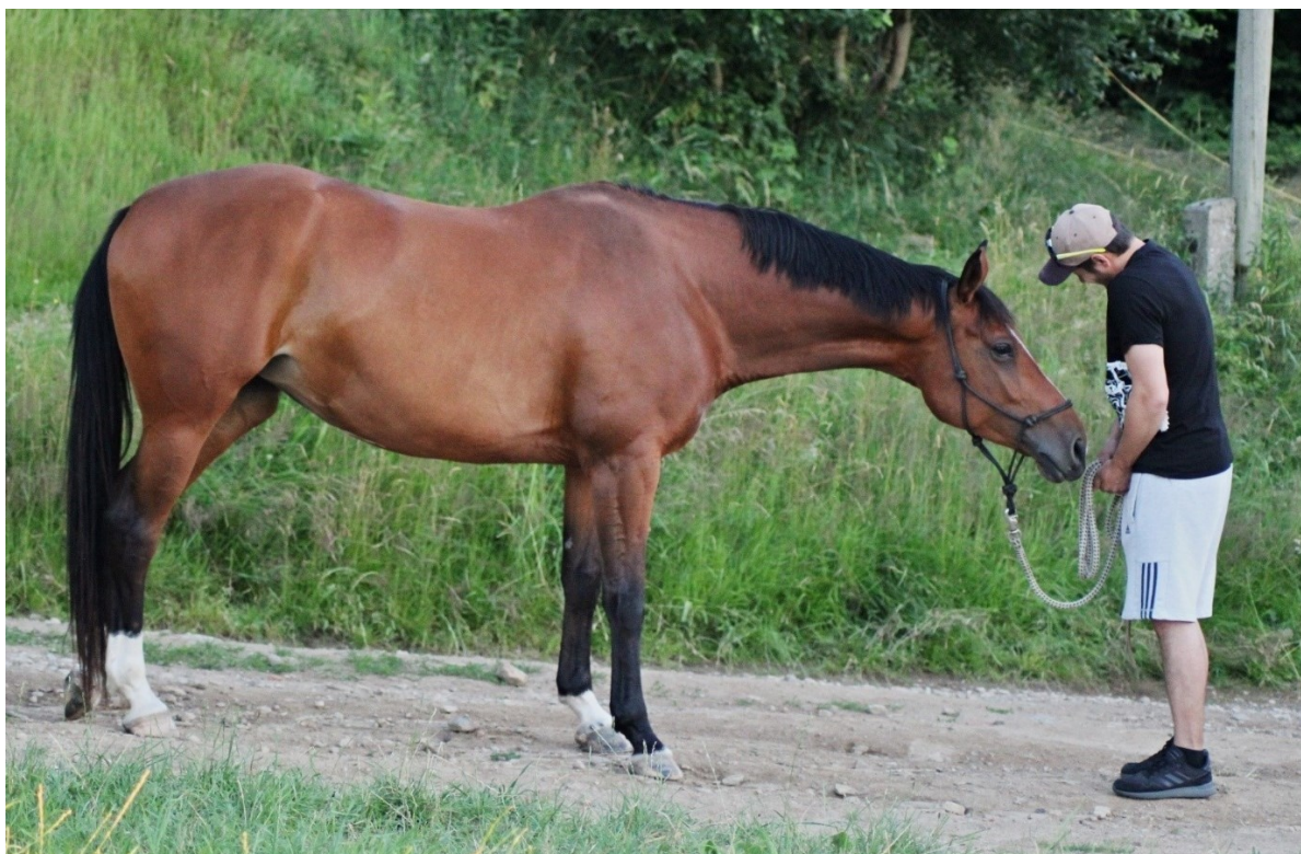
Fotografie č. 11

Na fotografii č. 11 vidíme koně, který povzbuzuje a vybízí bázlivého pacienta/klienta ke kontaktu s ním.