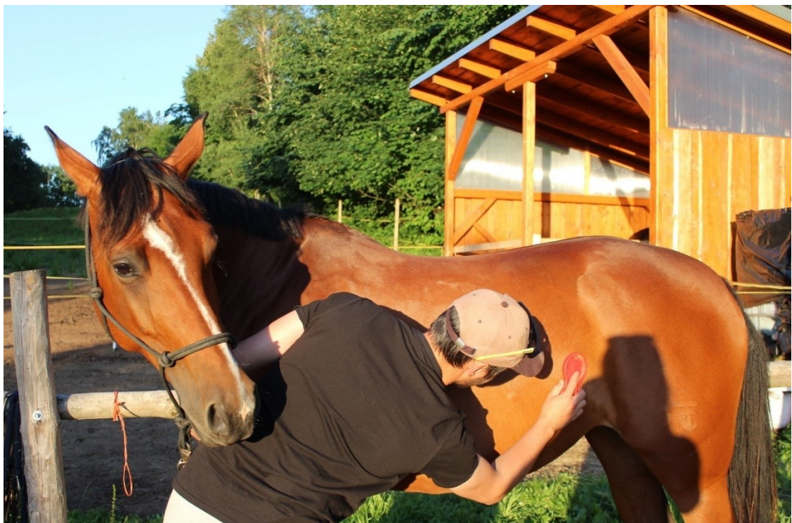
Fotografie č. 6 – Čištění koně před prací (již zde dochází ke komunikaci mezi koněm a pacientem/klientem).

Na fotografii č. 5 lze vidět překonávání výzev a dosahování vysokých cílů.