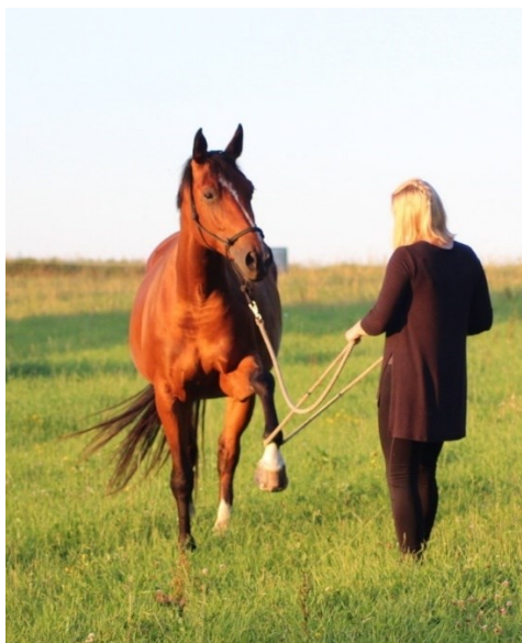
Fotografie č. 9

Na fotografii č. 8 kůň zrcadlí nefunkční jednání pacienta/klienta (příliš příkrý, agresivní a rychlý přístup ke koni – kůň háže hlavou, kulí oči, couvá, vyjadřuje nelibost).