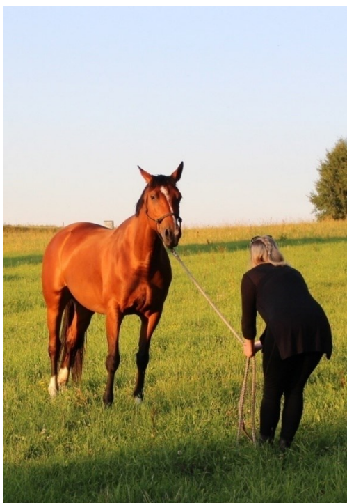
Fotografie č. 7

Na fotografii č. 7 lze vidět odmítnutí spolupráce.