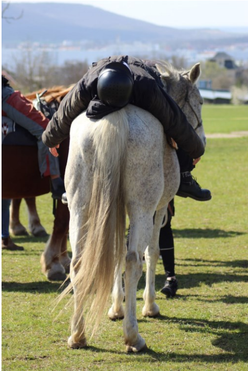
Fotografie č. 4 – Lehnutí si na zád' koně