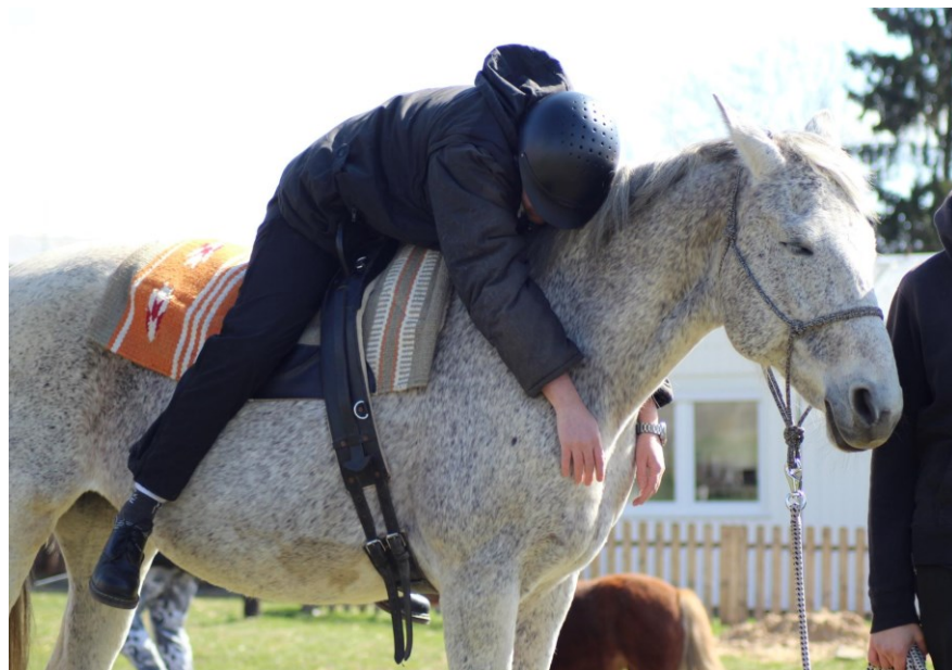
Fotografie č 3 – Lehnutí si na krk koně (kůň je klidný, uvolněný, stejně tak pacient/klient)