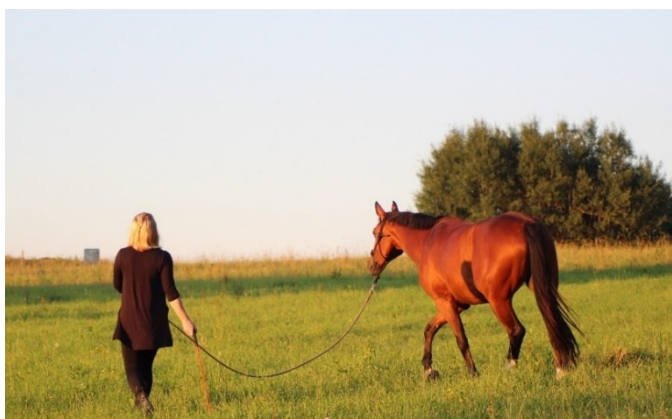
Fotografie č. 10

Na fotografiích č. 9 a č. 10, kdy došlo ke změně chování pacienta/klienta, je vidět klidný a komunikující kůň, ochotný ke spolupráci.