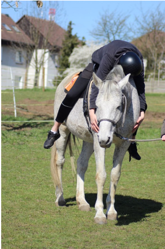
Fotografie č. 1 – Obejmutí koně kolem krku