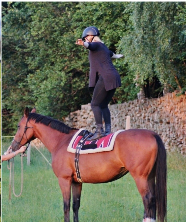
Fotografie č. 5 – Stoj na koni

Na fotografii č. 5 lze vidět překonávání výzev a dosahování vysokých cílů.