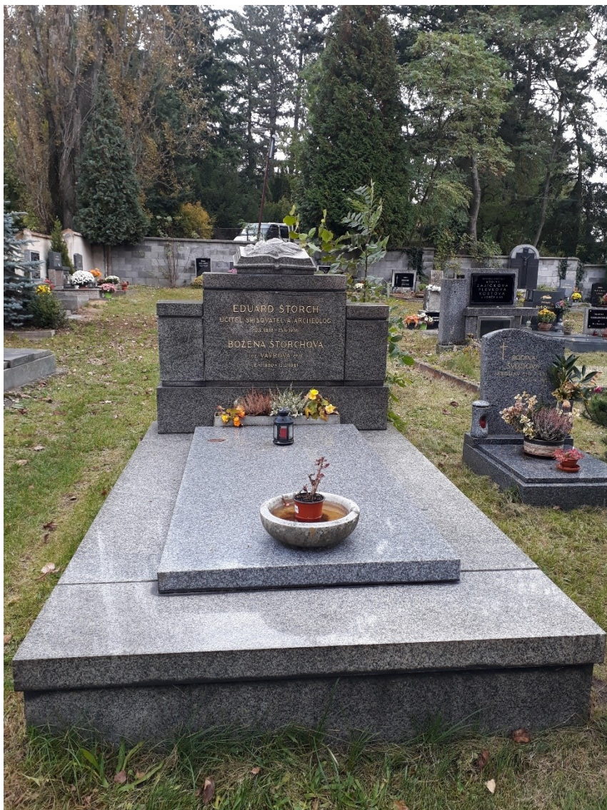
Obrázek 9. Lobeč – hrob Eduarda Štorcha a jeho manželky Boženy Štorchové, rozené Vávrové. Za hřbitovni zdi se nachází Pustý vrch.