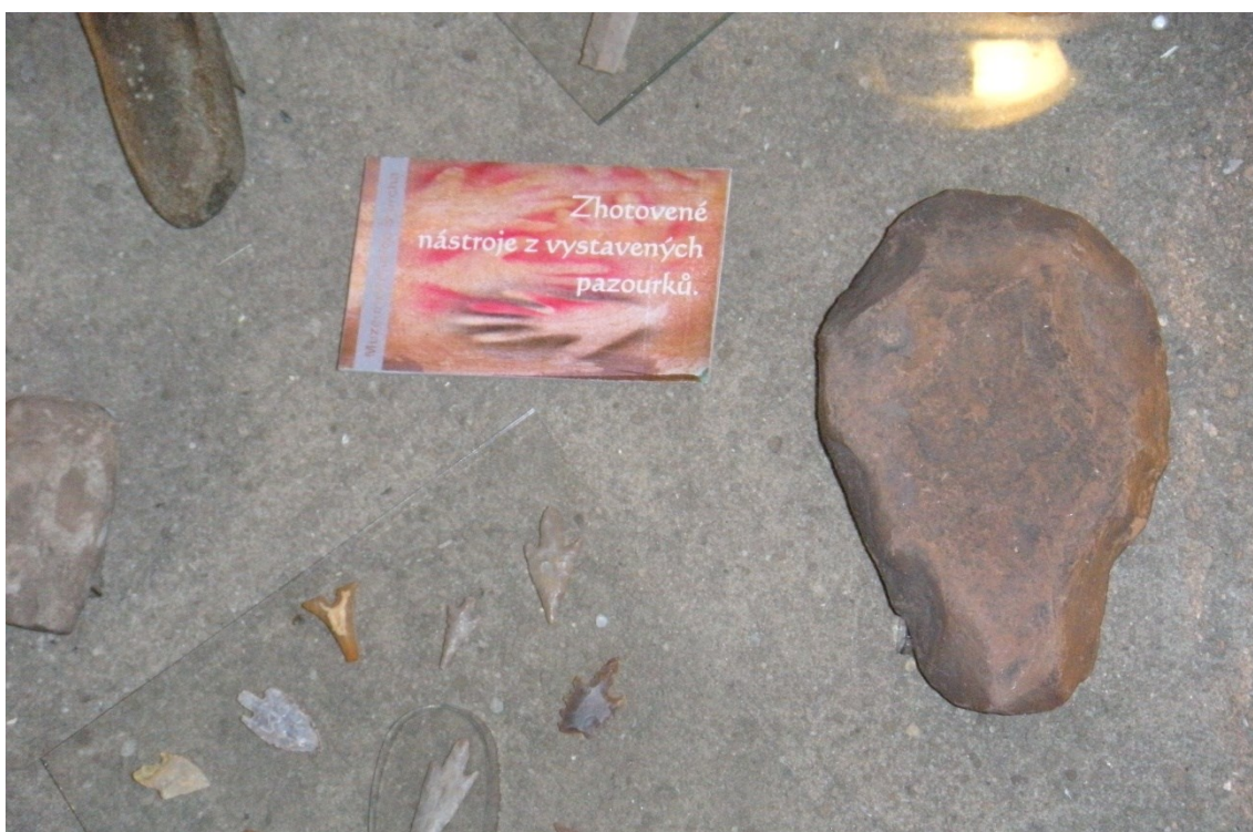
Obrázek 6. Ukázka muzejního interiéru – pazourkové nástroje.