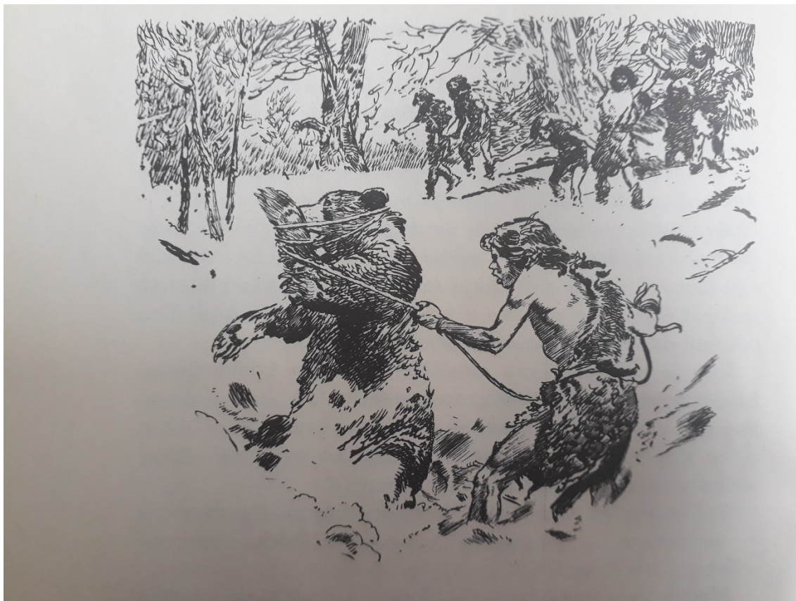
Obrázek 4. Další Burianova ilustrace z románu Osada Havranů . Je zde vyobrazen Havranpírko bojující s medvědem.