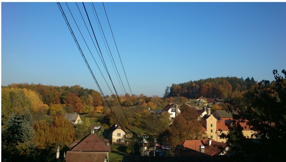
Obrázek 8. Pohled na Lobeč, na pravé straně v pozadí Pustý vrch.