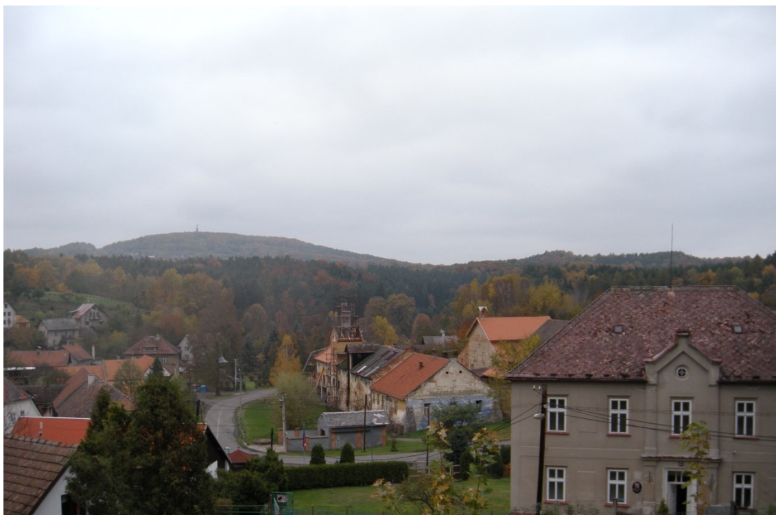
Obrázek 5. Pohled na Lobeč. V popředí nynější budova, ve které se nachází Muzeum Eduarda Štorcha. Ve středu fotografie rozestavěný pivovar. V pozadí Vráteňská hora.