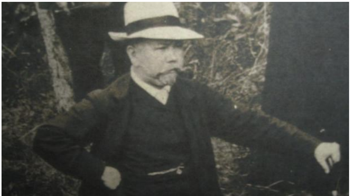
Obrázek 2. Fotografie Eduarda Štorcha.