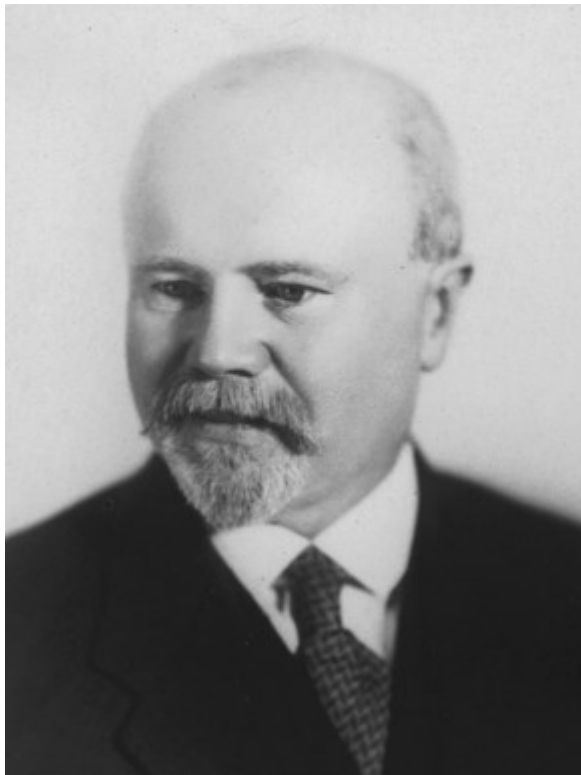
Obrázek 1. Fotografie Eduarda Štorcha.