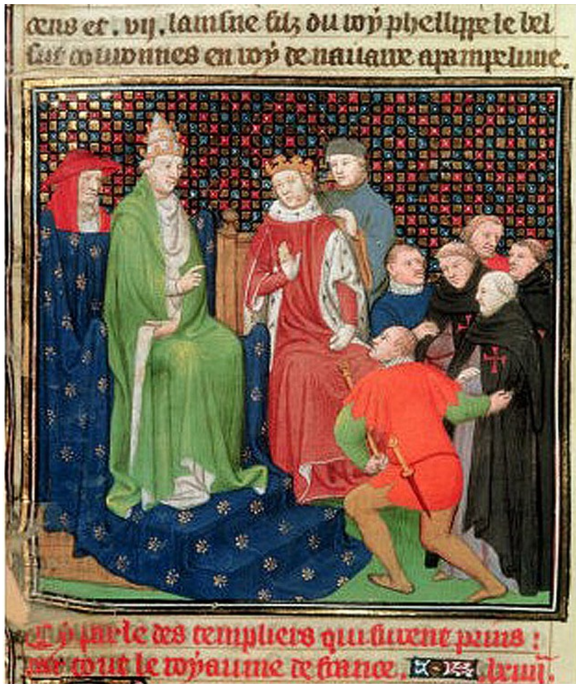
Obrázek 6 Klement V. a Filip IV. Sličný, templáři na vídeňském koncilu, mistr Bocicaut 15. stol Národní knihovna Francie 114