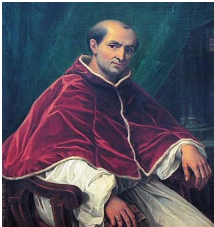
Obrázek 5 Portrét Klementa V. od Henriho Serruta 113