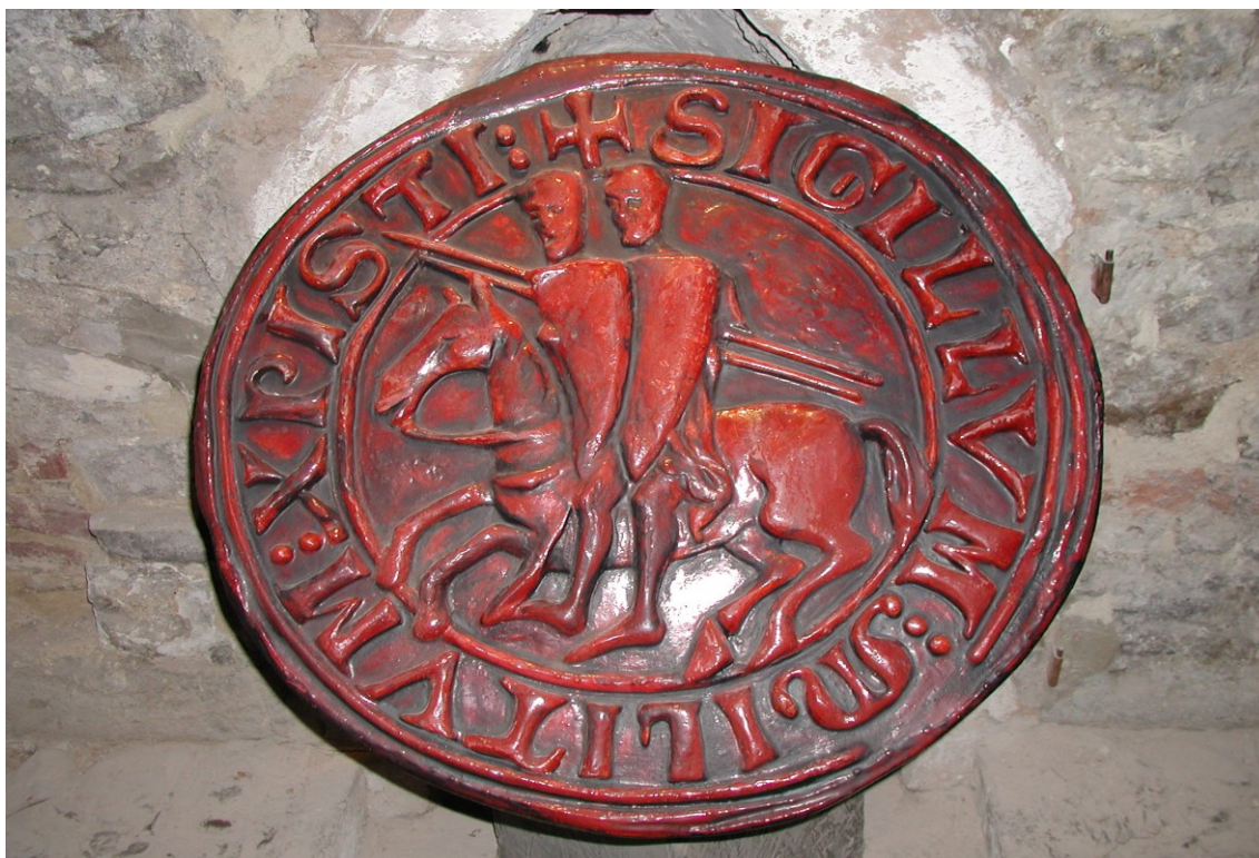
Obrázek 4 Reprodukce templářské pečeti na výstavě v Praze 112