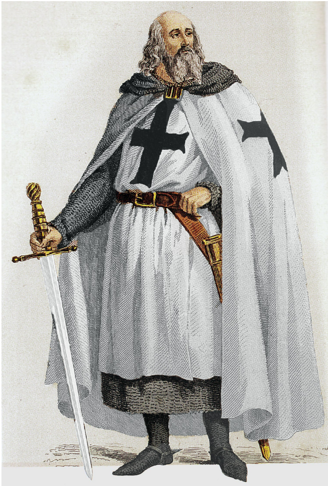
Obrázek 7 Jacques de Molay, Bilbliothque National de France, autor neznámý 115