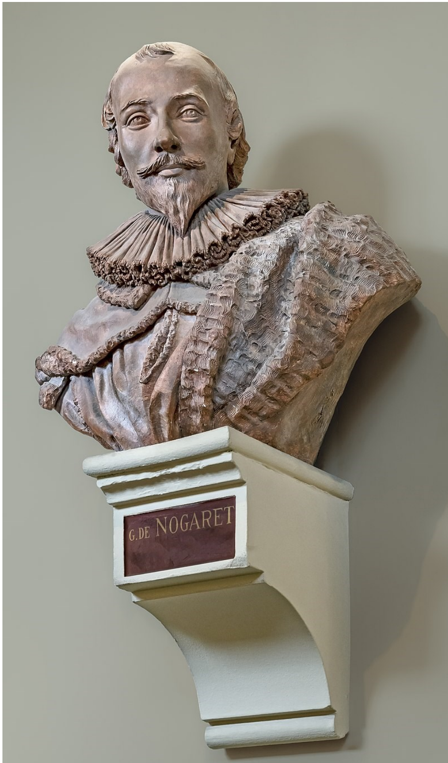
Obrázek 8 Guillaume de Nogareth od autora Didiera Descouens 116