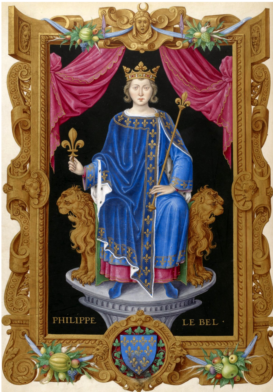
Obrázek 3 Vyobrazení Filipa IV. Sličného v rukopisu sbírky francouzských králů od Jeana du Tilleta 111