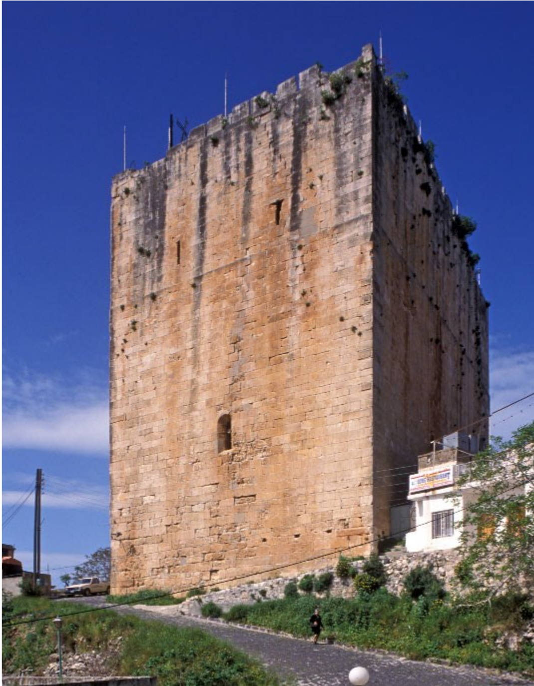
Obrázek 9 Templářská pevnost Chastel Blanc 117