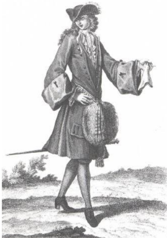
Obr 9: Aristokrat v zimním oděvu, muž má na sobě justacorpus s širokými manžetami a na pase visí rukávník, kravata je bohatě zdobená. Reprodukováno podle Galerie des Modes et Costumes Francais III

závisel na postavení pána, kterému krk zdobil, u těch bohatších nebyl výjimkou mušelín nebo hedvábí.