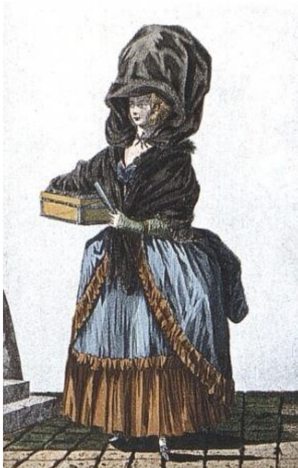
Obr. č. 19: Na dobovém mědirytu z roku 1776 vidíme obchodnici prodávající módní doplňky, reprodukováno E. und J. de Goncourt v Die Frau im 18. Jahrhundert. Bratři Goncourtovi společně vydali několik knih, žili v 19. století.

s informacemi o parfémecích a jejich složkách a o vůních, které byly v tu dobu dostupné. Rousseau vůně zařadil do své příručky k výchově a jejich vliv považuje za důležitý: „Sladká vůně toaletního pokoje není léčkou tak slabou, jak se za to má; a nevím, mám-li blahoslaviti nebo litovati onoho chladného člověka rozumu, jehož vůně květin, které má jeho milenka na prsou, nikdy nepřivedla v rozpaky.“ 204 Když může vůně uvádět v rozpaky i osvíceného Rousseaua, není divu, že se parfumérské odvětví se v té době velmi rozrostlo.