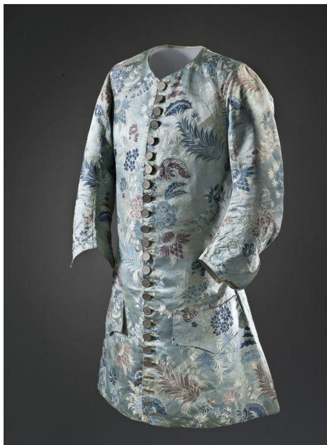
Obr. č. 8: Na fotce vidíme pánský kabátec s rukávy vyhotovený z bizarního hedvábí. Jeho výroba se odhadem datuje mezi roky 1700-1720.

Zdroj: Muzeum Los Angeles County Museum of Art (LACMA), inventární číslo M.2007.211.40.