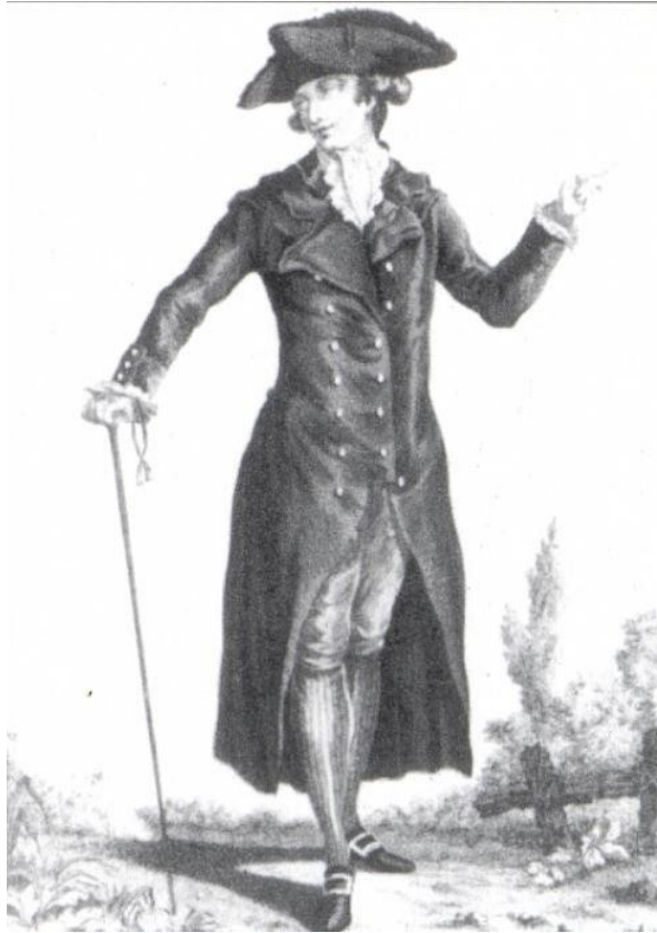
Obr. 11: Šlechtic nosí redingot se třemi límci doplněn o třírohý klobouk a kravatou à l'anglaise. Módní list z roku 1778-87. Reprodukováno podle Ribeira.