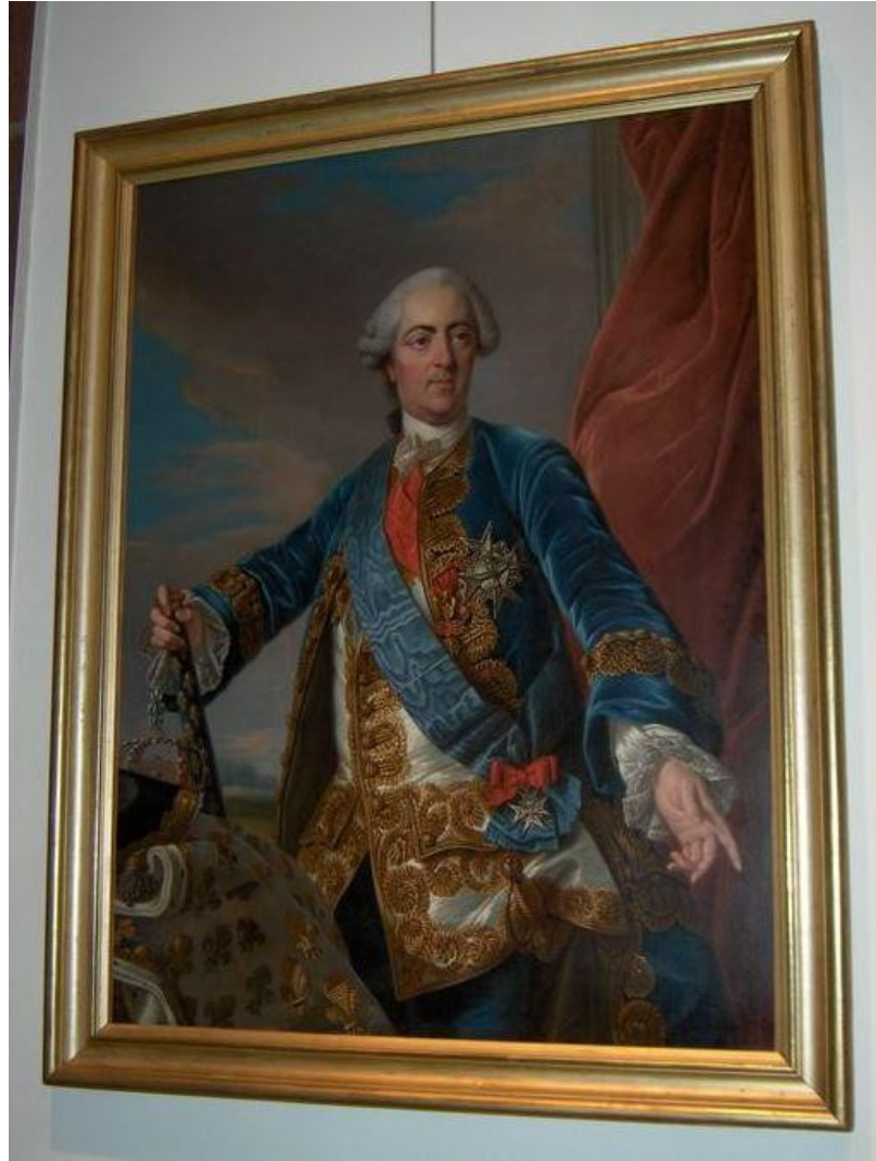
Obr. č. 21: Na obrazu vidíme Ludvíka XV.

Zdroj: Kolekce z muzea Louvre, sbírka Katedry obrazů, inventární číslo INV 6325, autorem je Louis-Michel Van Loo (narodil se v roce 1707 v Toulonu a zemřel v roce 1771 v Paříži). Malbu studoval v Turíně a Římě, stal se dvorním malířem španělského krále a později se vrátil do Paříže, kde namaloval několik portrétů Ludvíka XV.