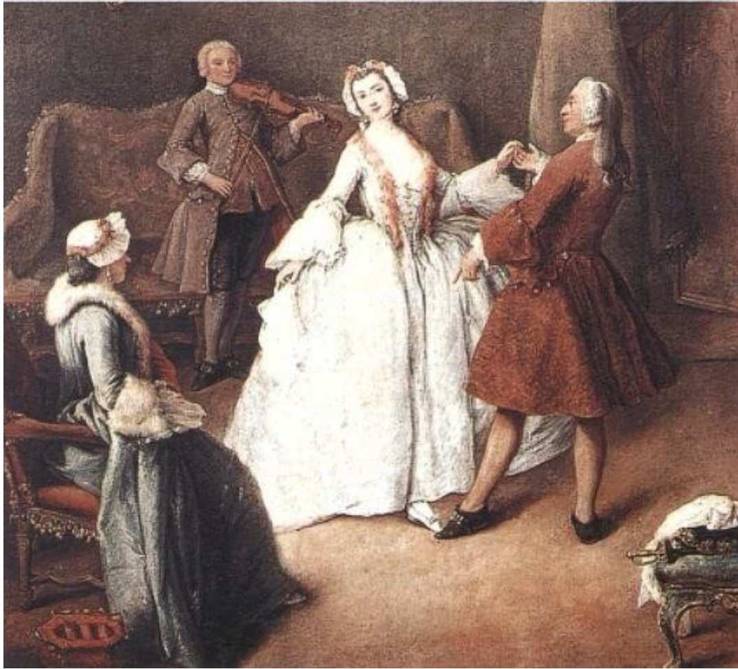
Obr. 4: Hodina tance, žena nosí krinolínu typu „à coudes“, její učitel zase justaucorpus s rozšířenými šosy. Autor obrazu je Pietro Longhi, jmenuje se Hodina Tance, pochází z Benátek z galerie Galleria dell' Accademia. Longhi byl benátským malířem žijícím v osmnáctém století. Tento obraz nakreslil asi v roce 1741, často kreslil každodenní scény ze života.