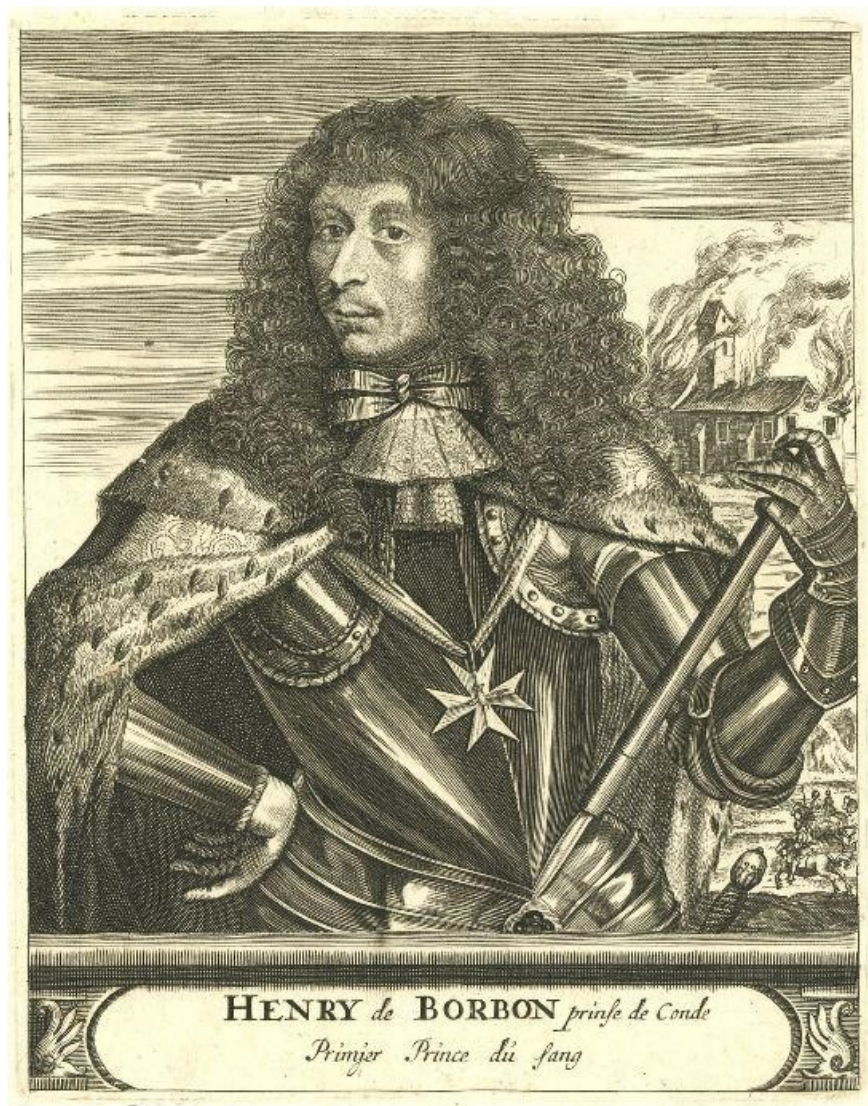
Obr. 14: Na rytině vidíme Louise II de Bourbon, prince de Condé někdy mezi lety 1646-1700 a typickou dvorskou módou co se alonžové paruky týče. Autor anonymní, 1646-1700.

Zdroj: The British Museum, Portrait of Louis II de Bourbon, Prince of Condé ["Le Grand Condé"], č. 1565953001