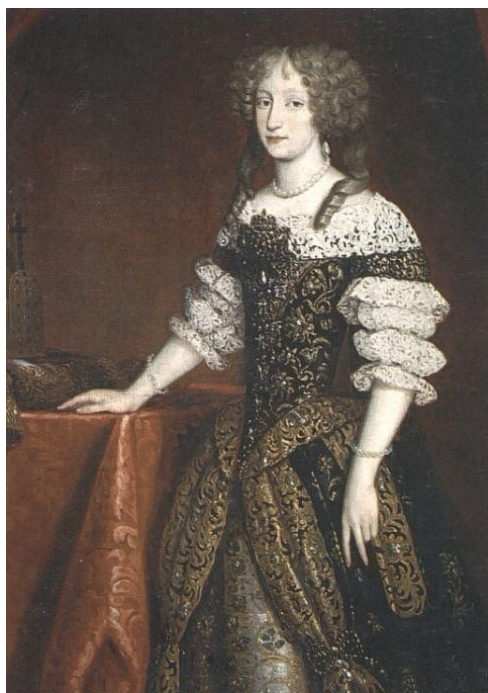
Obr. 1: Na obrazu je Alžběta Karolina, dcera prince Orleánského v šatech z kombinace těžké hedvábné látky protkávané kovovou nití a krajkou.