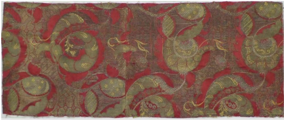
Obr. 17: Tzv. „bizarní“ hedvábí s červeným pozadím zdobené květy a plody, datum výroby asi 1700-1720. Bizarní hedvábí se vyznačuje velkými, asymetrickými vzory a

„Zhruba od poloviny 18. století už nebyly manufaktury schopné zmocnit se veškeré výroby ani ji snížit natolik, aby ji ovládly.“ Problém tvořila jejich nedostatečné mechanizace, především pomalé rozšiřování parního stroje, ač začíná postupně vznikat průmyslová výroba. Nejdůležitějším odvětvím pro Francii byla právě textilní výroba, která dohromady tvořila více než polovinu celkové francouzské průmyslové výroby. Technicky se rozvíjelo bavlnářství, hedvábnictví, na konci sedmnáctého a v průběhu osmnáctého století se tato odvětví dále mechanizovala.