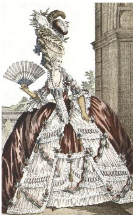
Obr. 6: Urozená dáma ve velké dvorské toaletě, módní list z roku 1777. Krinolína je typu „à coudes“ zdobená krajkami, stužkami a festony (garlandami). Reprodukováno podle bratrů Gocourtů.

Ženy ve velké dvorské toaletě působily až orientálním, exotickým půvabem. Ostatně právě orientem se v té době Francie inspirovala, a to především ve spodním prádle, županech nebo v kalhotkách. Šaty byly obšity perlami, leskly se zlatem a drahými kameny. Při méně slavnostních příležitostech ale i nadále převládaly hlavně květiny a stužky. 75