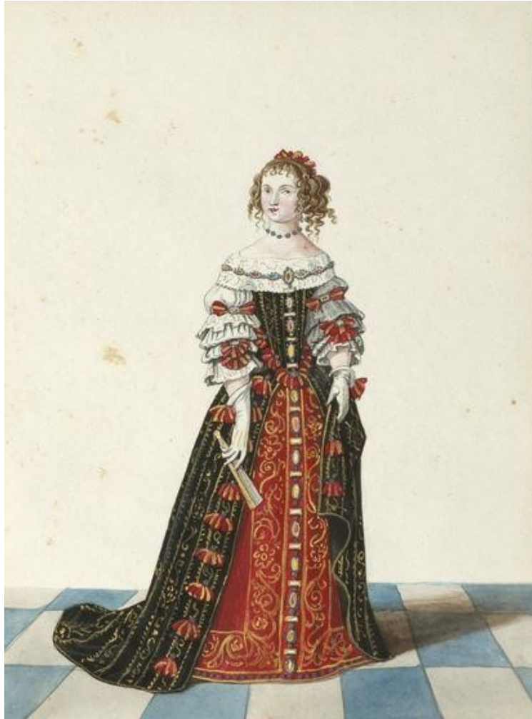
Obr. 2: Na rytině vidíme Marii Terezu Habsburskou, manželku Ludvíka XIV. Šaty jsou bohatě zdobené stužkami, pestrobarevné a nechybí ani krajka.

Zdroj: Soupis kreseb vytvořených pro Rogera de Gaignières a uchovaných v oddělení tiskovin a rukopisů Národní knihovny ve Francii v knize historika Henriho Bouchota, Paříž: Plon, Nourrit et Cie, 1891