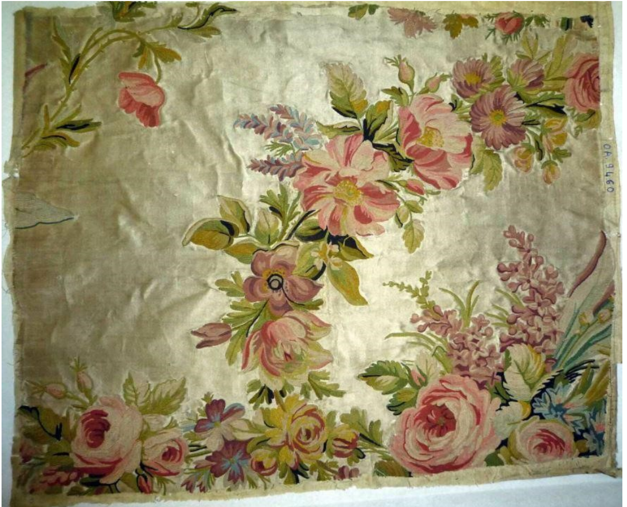
Obr. 5: Na snímku vidíme kus saténu s bílým pozadím zdobený květy vyšívány žinylkou z období Ludvíka XVI. (vznikl mezi lety 1770-1800).

Sukně využívá stejně jako v baroku asymetrii. Vrchní sukně se trojúhelníkovitě rozevívá, díky čemuž může využít kontrastu jedné látky mezi druhou. Neustále se hledají nové způsoby aranžování, řasení a shrnování látky, příkladem je například robe „à la polonaise“ (tedy na polský způsob podle královny). Robe „à la polonaise“ se vyznačuje vpředu otevřenou svrchní sukni zdviženou a zřasenou dvěma nebo třemi náběry. Přirozeně tento způsob výzdoby sukni začíná přebírat celá Evropa.