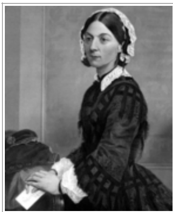
Obrázek č. 1 1

První ošetřovatelskou školu založila, z výnosu veřejné sbírky 9. července 1860 v Londýně při nemocnici svatého Tomáše, paní Florence Nightingale (1820 - 1910) – ošetřovatelka, průkopnice srovnávací lékařské statistiky a nejvýznamnější osobnost světového ošetřovatelství vůbec, viz Obr. č. 1. Škola nesla název The Nightingale Training school a cíleně vychovávala ošetřovatelky pro nemocniční i domácí službu. V Příloze č. 1 uvádím fotografii z jednoho ze školních výletů studentek s F. Nightingale a znak školy.