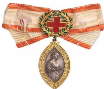
Obrázek č. 2 15