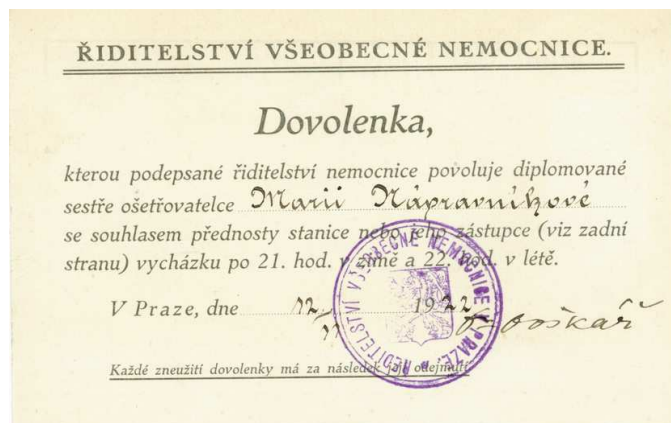
Obrázek č. 3 28