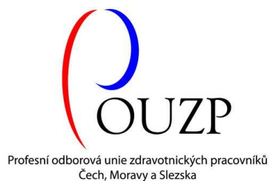
Obrázek č. 4 72