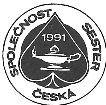
Obrázek č. 6 83

Od schůzky na ministerstvu zdravotnictví, která se konala 1. listopadu 1991 z podnětu ČAS a za účasti několika zástupkyň bývalého předsednictva ČSS, pokračovaly obě společnosti ve své činnosti samostatně, ačkoliv se tehdy příliš nelišily v programu, organizační struktuře a ani v činnosti. Na listopadové schůzce došlo k rozhodnutí, že ČAS je novou organizací a ne nástupnickou za ČSS. ČSS se vlivem vystoupení z České lékařské společnosti v roce 1990, spojením s Kluby a poté odstoupením z ČAS musela opět zaregistrovat pod svým původním názvem dne 24. ledna 1992. 81 K datu 31.5.1993 měla Společnost 1179 členů. 82 Znakem ČSS byl typický kahan s hořícím ohněm (součástí znaku již za dob SDS) vprostřed lipového listu s opisem po obvodu znaku: Česká společnost sester, viz Obr. č. 6.