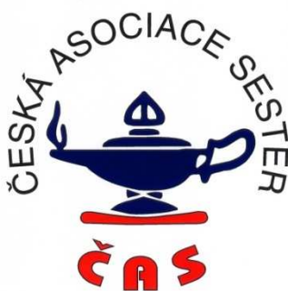
Obrázek č. 8 124

Na dalších společných jednáních se obě organizace dohodly, že nová sloučená organizace ponese název Česká asociace sester (registrace v ICN pod tímto názvem), převezme obrazovou část loga České společnosti sester a bude mít sídlo v Praze a pobočku v Brně. Dojde ke sloučení společných sekcí a ostatní zůstanou nezměněny. Volby byly plánovány na začátek roku 2000 po schválení stanov. Nové logo ČAS po sloučení organizací uvádí Obrázek č. 8.