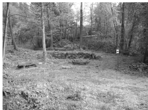
Obr. 10 a 11 Skromné pozůstatky „Lexova mlýna“, shromaždiště „adamitů“ v Dětech čistého živého u České Rybné