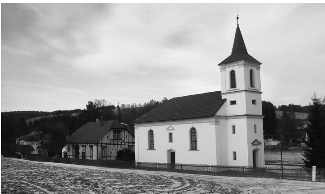
Obr. 17 Evangelický kostel z doby rovnoprávnosti v Pusté Rybné