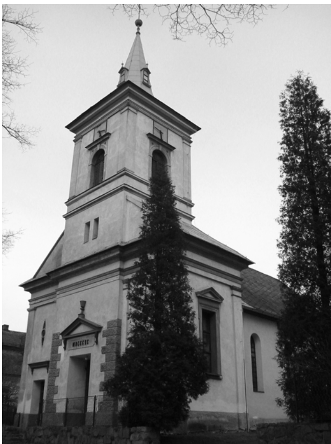
Obr. 16 Evangelický kostel z doby rovnoprávnosti v Telcím