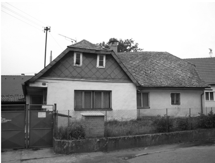
Obr. 18 Chalupa v Luži z 18. století, ve které se začátkem 20. století scházeli první adventisté (v současnosti určena k demolici)