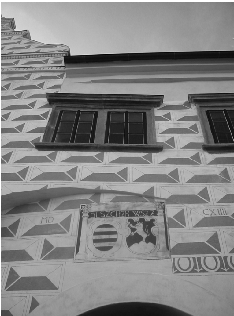
Obr. 19 Košumberk - znak Diviše Lacemboka Slavaty z Chlumu a Košumberka a jeho manželky Veroniky Slavatové ze Žerotína, přívrženců Českých bratří