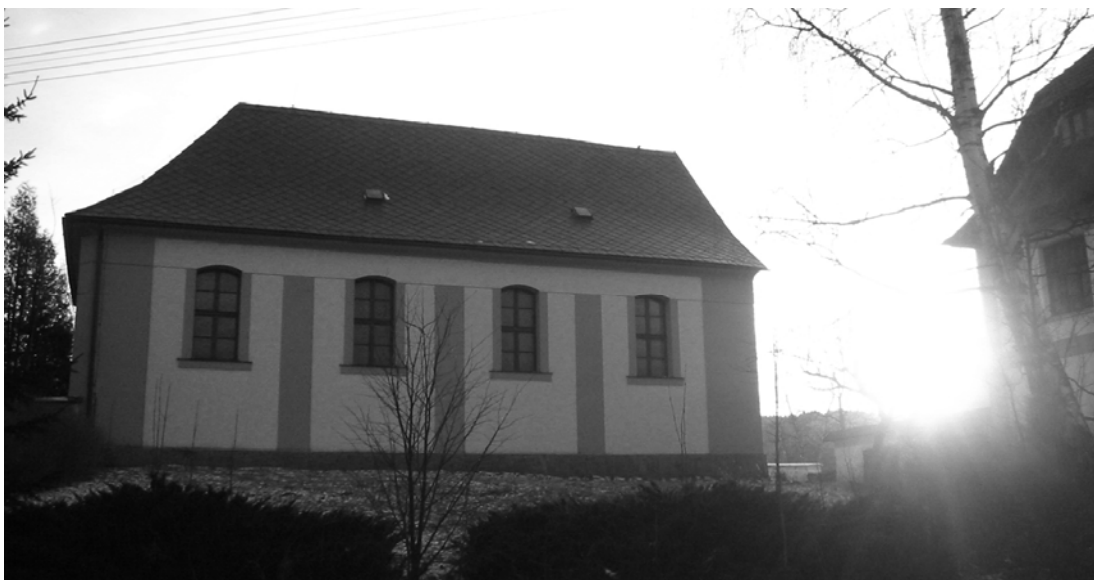
Obr. 15 Toleranční evangelická modlitebna v Borové