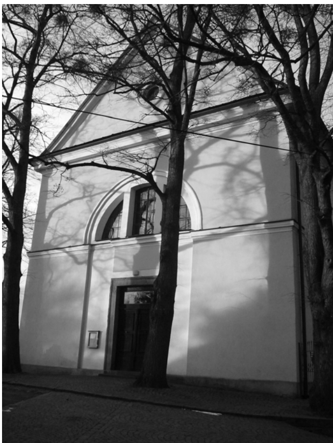
Obr. 14 Toleranční evangelická modlitebna v Proseči