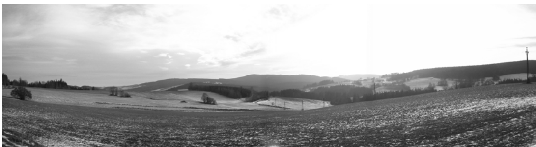
Obr. 6 Krajina u Pusté Rybné skýtající v minulosti úkryt tajným evangelíkům