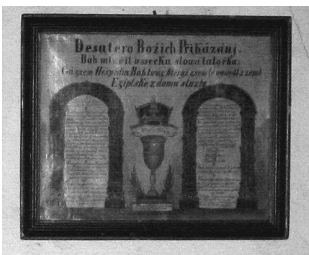
Obr. 8 Na dřevě malované Desatero Božích přikázání z konce 18. století (viz obr. 7)