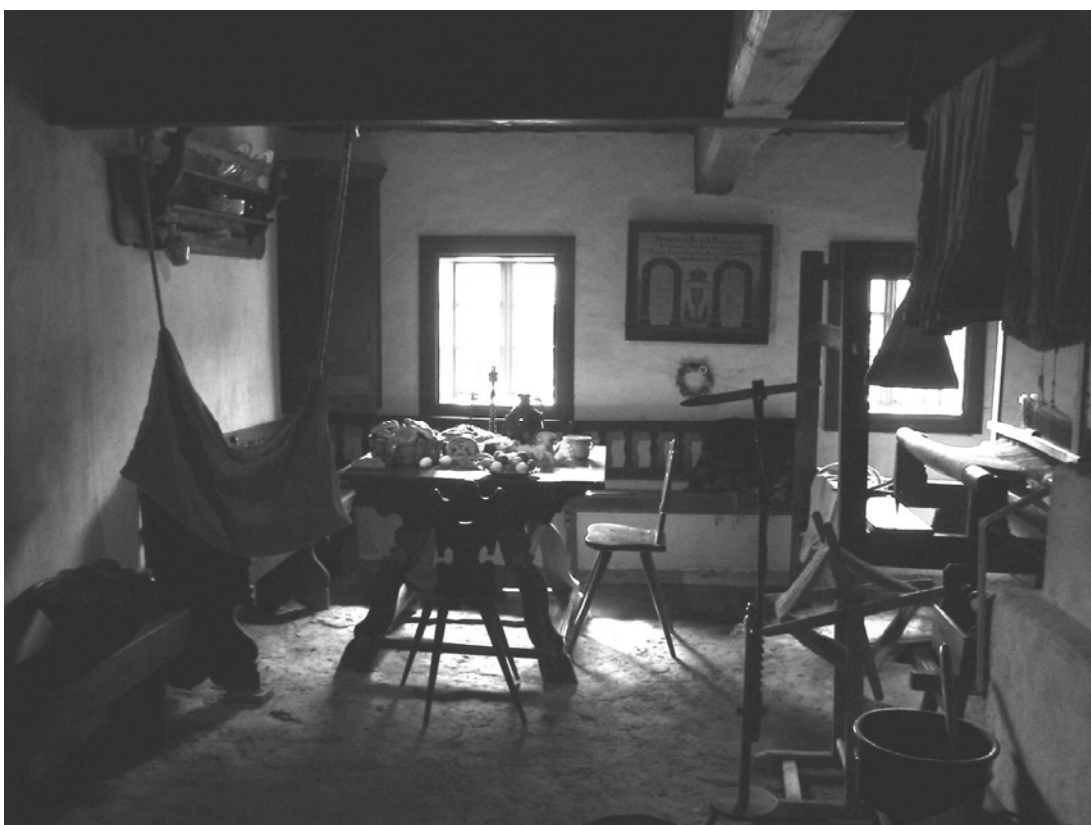
Obr. 7 Typický interiér obydlí na Vysočině 18. a 19. století s tkalcovským stavem (Muzeum Vysočiny – Veselý Kopec)