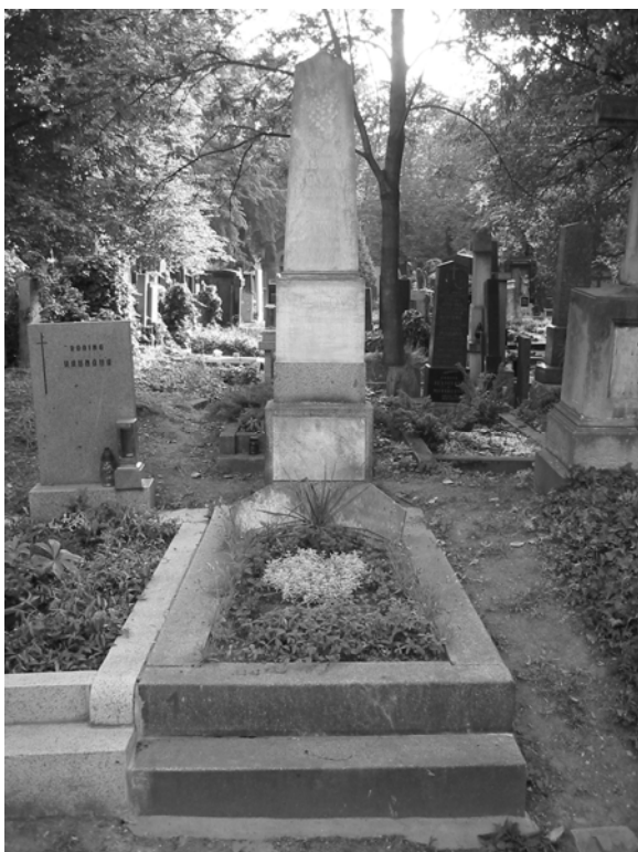
Obr. 3 Hrob rodiny Novákových na Olšanských hřbitovech v Praze (V, 20, 25)