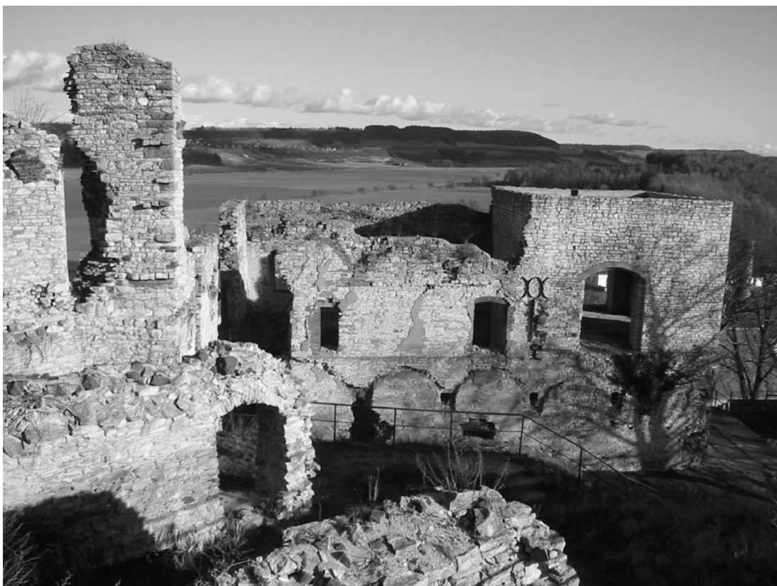
Obr. 20 Ruiny hradu Košumberk, v dálce domy vsi Střemošic, rodiště „Jiřího Šmatlána“