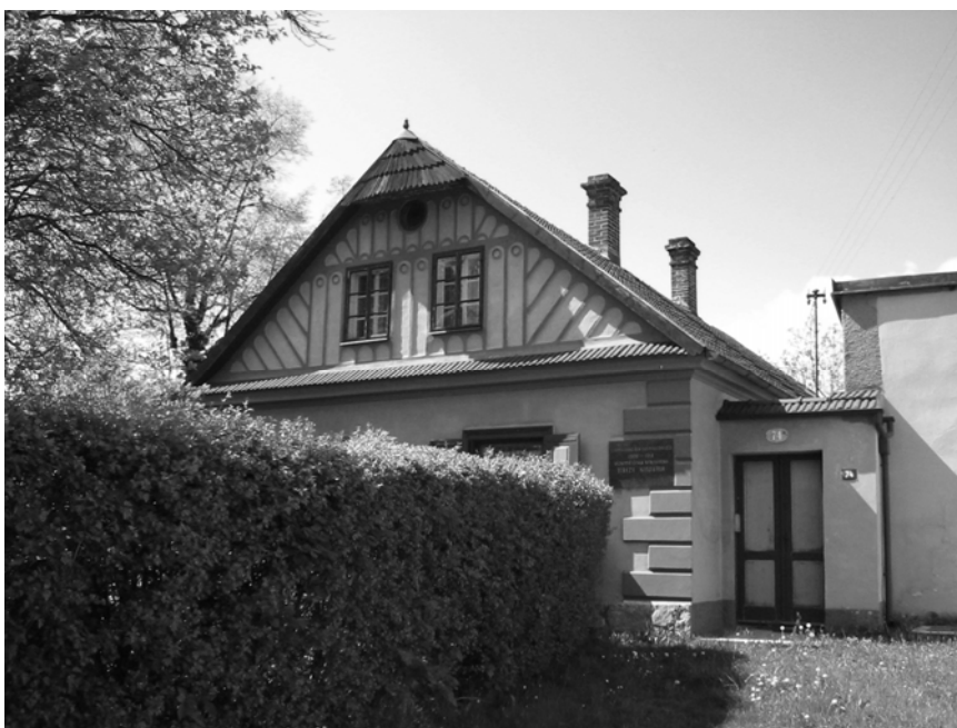
Obr. 2 Domek Novákových s pamětní deskou Terézy Novákové v Proseči