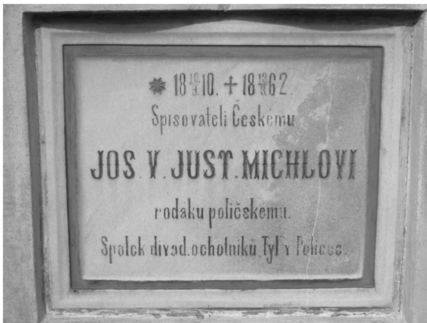
Obr. 12 Drašarova pamětní deska z roku 1891 na hřbitově na Březinách