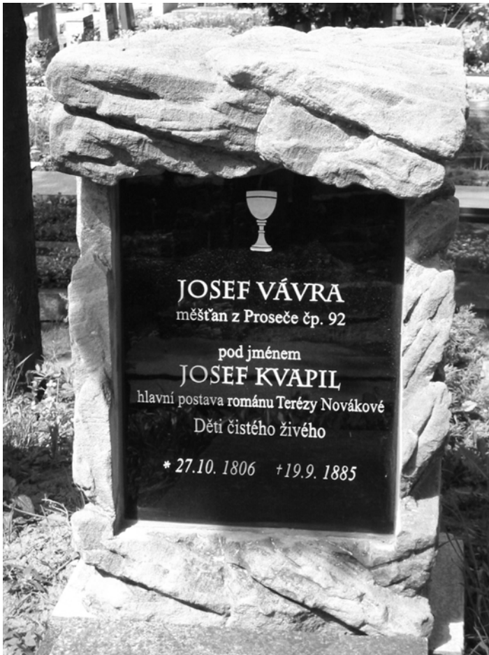
Obr. 9 Hrob Josefa Vávry – Kvapila na prosečském evangelickém hřbitově