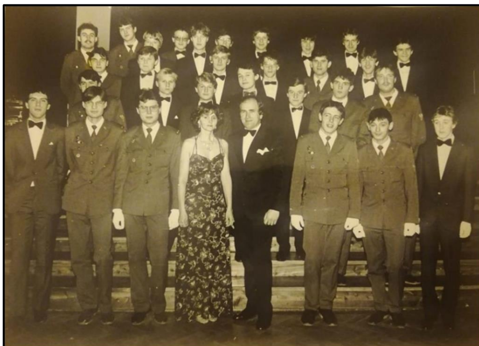
Obrázek 10: Taneční kurz Holýšov 1985/86