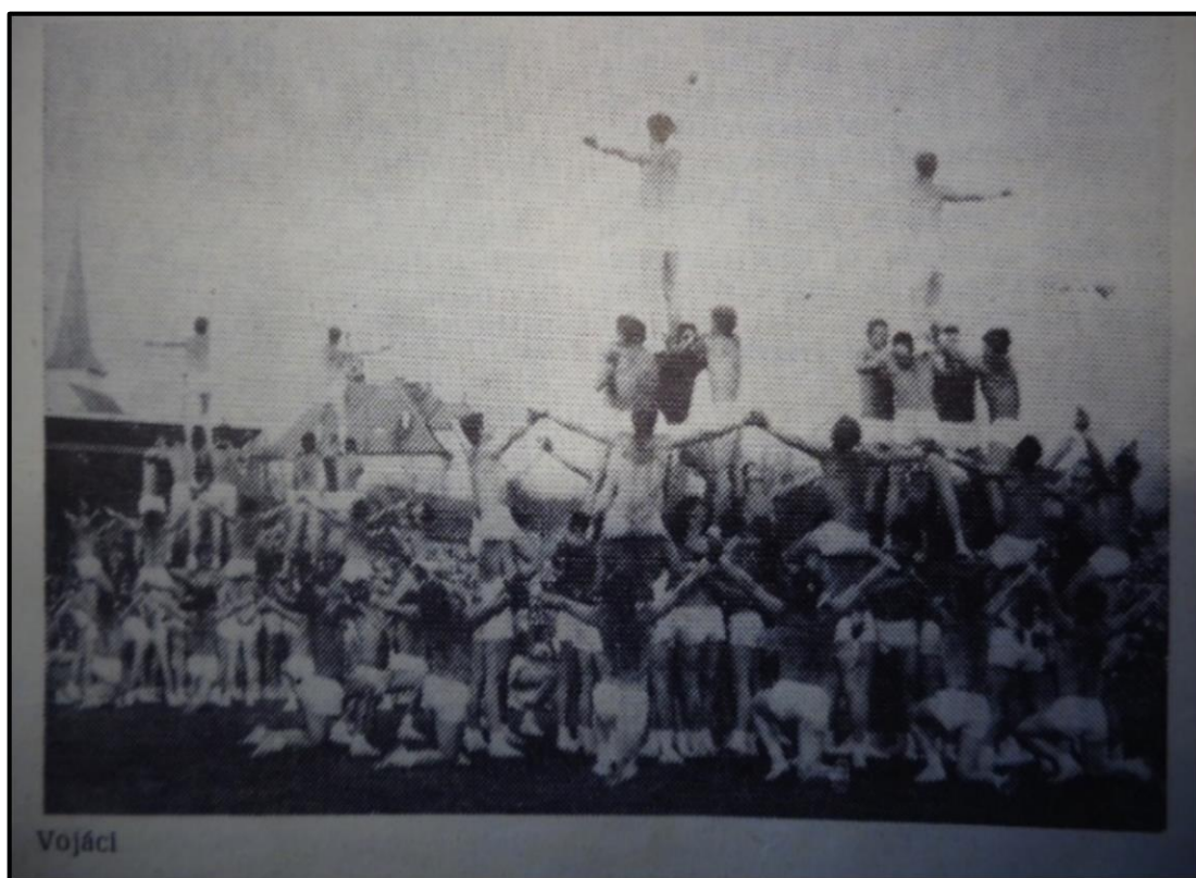
Obrázek 4: Spartakiádní číslo vojáků prezentované občanům Holýšova, rok 1985