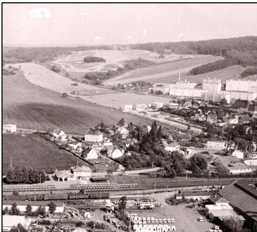
Obrázek 7: Letecký pohled na Holýšov, vlevo nahoře tankové cvičiště v těsné blízkosti panelového sídliště, nedatováno