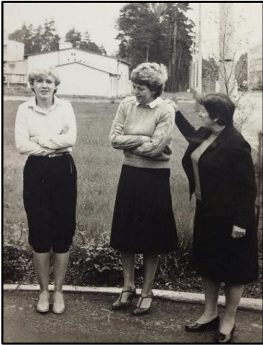
Obrázek 5: Civilní zaměstnankyně vojenské posádky Holýšov, nedatováno