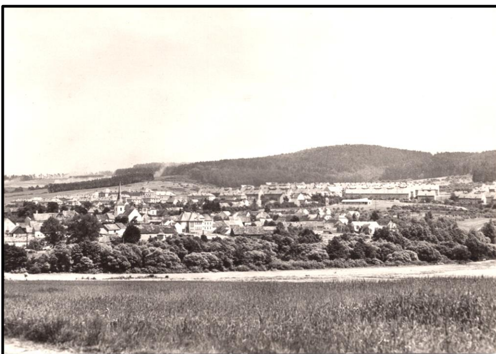
Obrázek 8: Pohled na Holýšov, v levém horním rohu oblak prachu vznášející se nad tankovým cvičištěm, nedatováno