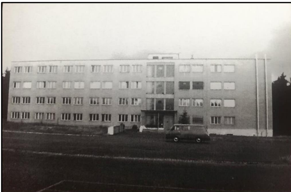
Obrázek 2: Ubikace tankového praporu u nástupiště v roce 1997