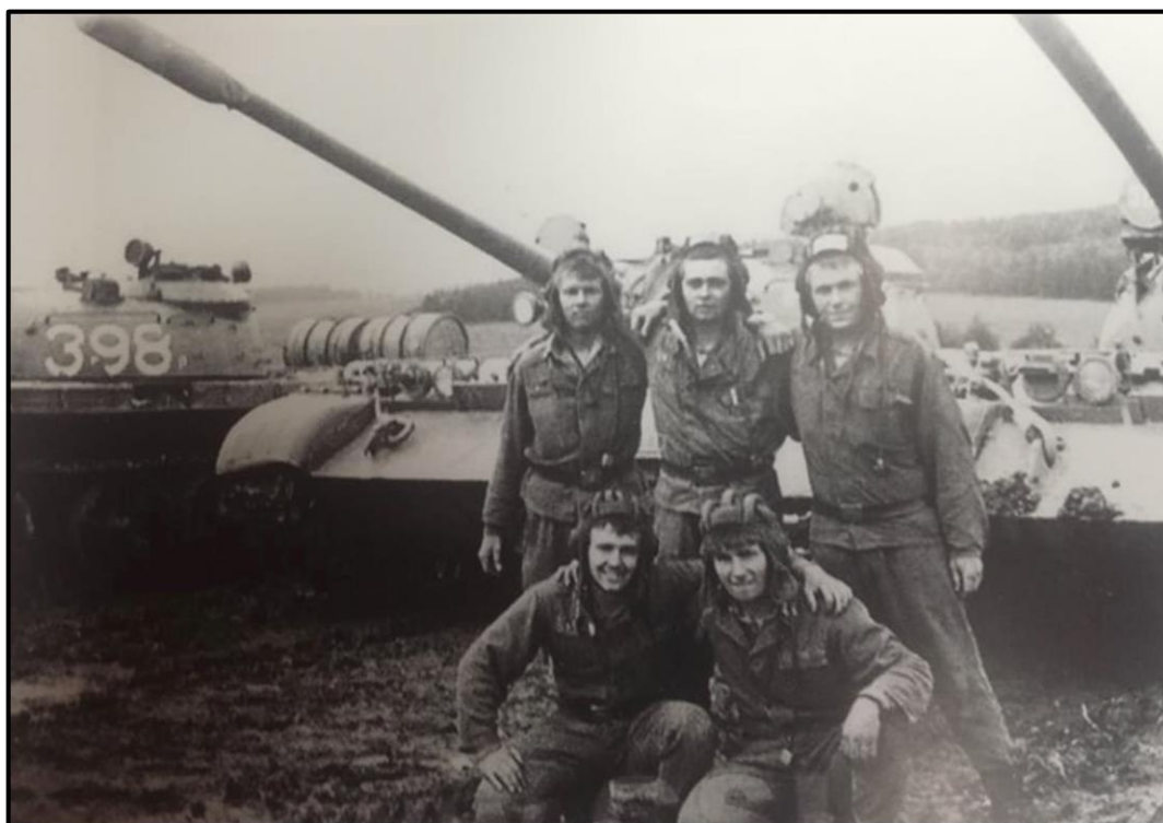
Obrázek 12: Tanky tankového pluku na tankodromu Holýšov v roce 1982