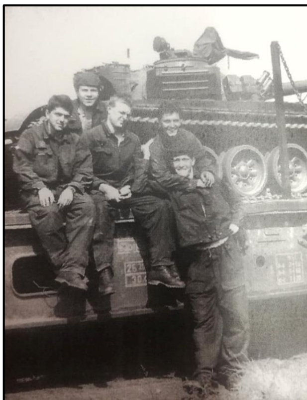
Obrázek 11: Tank T-72 naložený na železničním vagónu ve vlakovém nádraží Holýšov, rok 1988