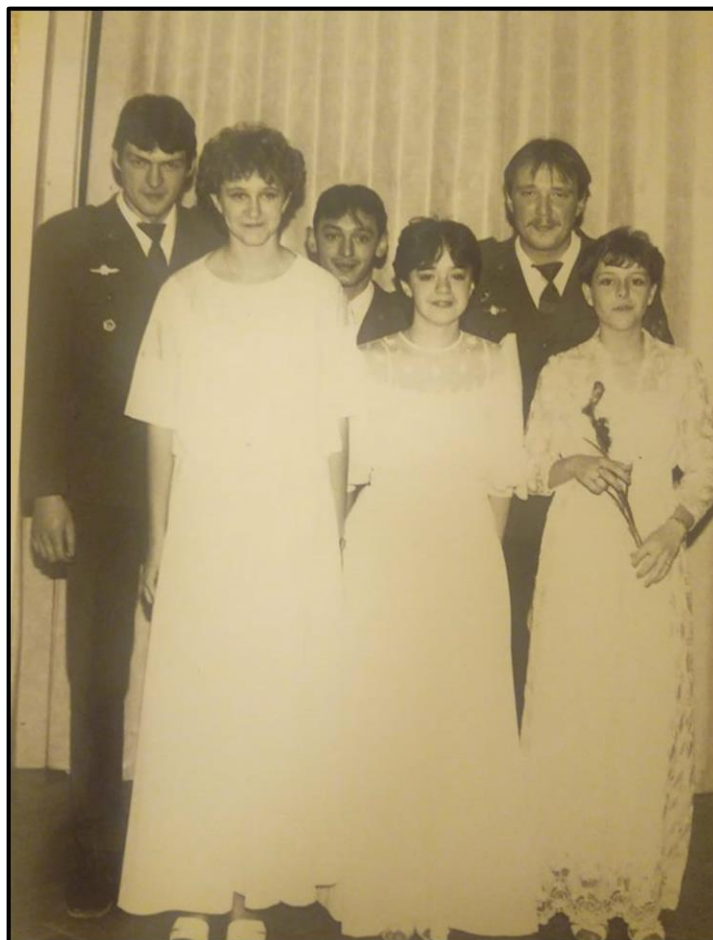
Obrázek 9: Taneční kurz Holýšov 1985/86