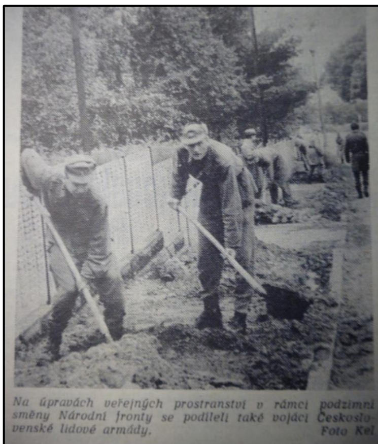
Obrázek 3: Pomoc vojáků z vojenské posádky Holýšov na úpravách veřejných prostranství, rok 1980