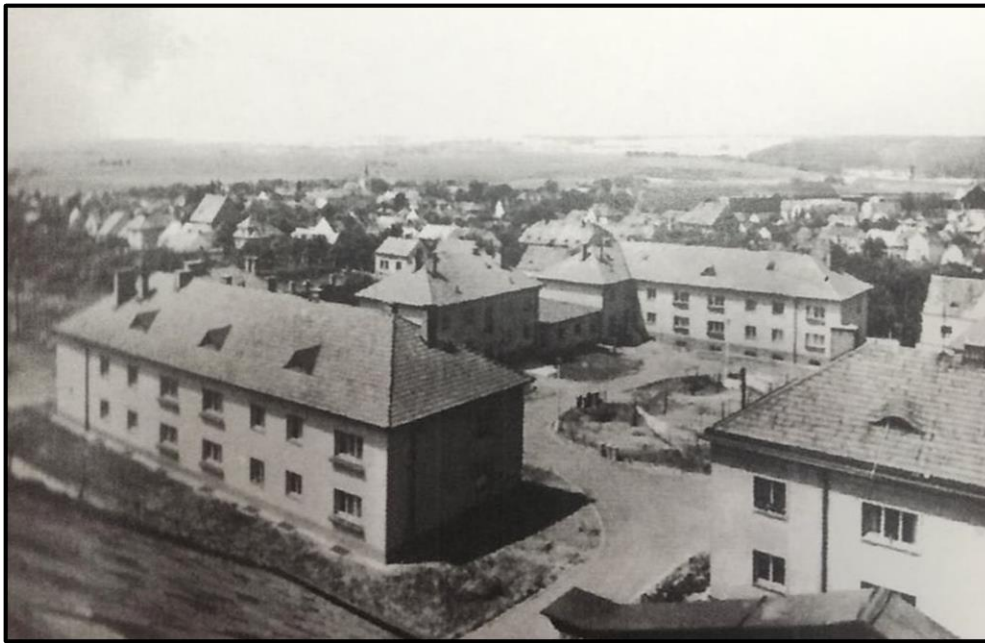
Obrázek 1: Část vojenského sídliště v Holýšově v 60. letech minulého století