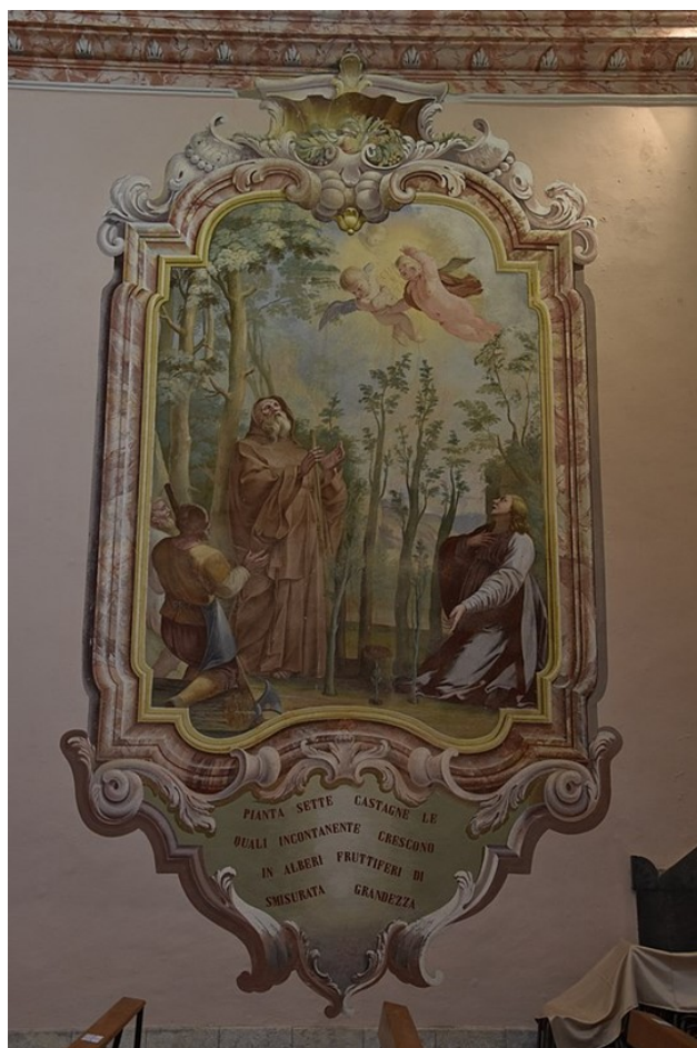
Obrázek 8 – ukázka nástěnné malby z kostela Lazaretto v Arcisate