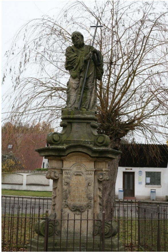
Obrázek 41 – socha sv. Františka z Pauly v Hoříněvsi