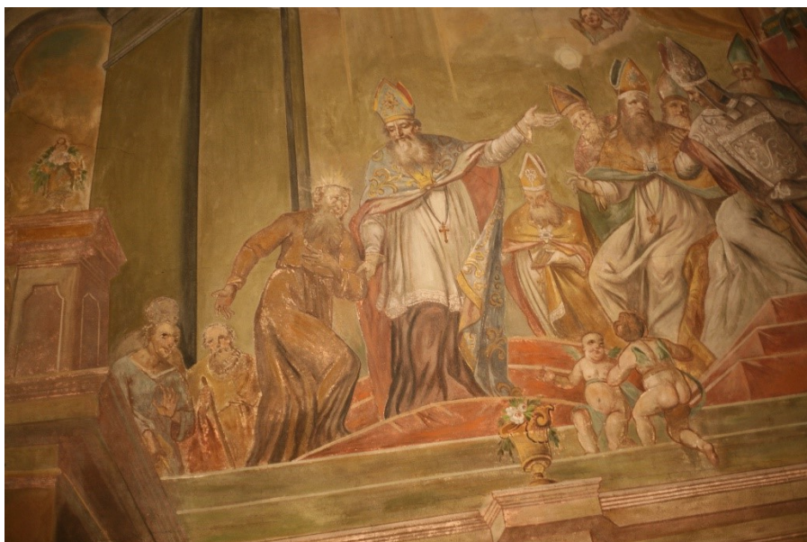
Obrázek 22 – detail fresky v kostele sv. Mikuláše v Chotči