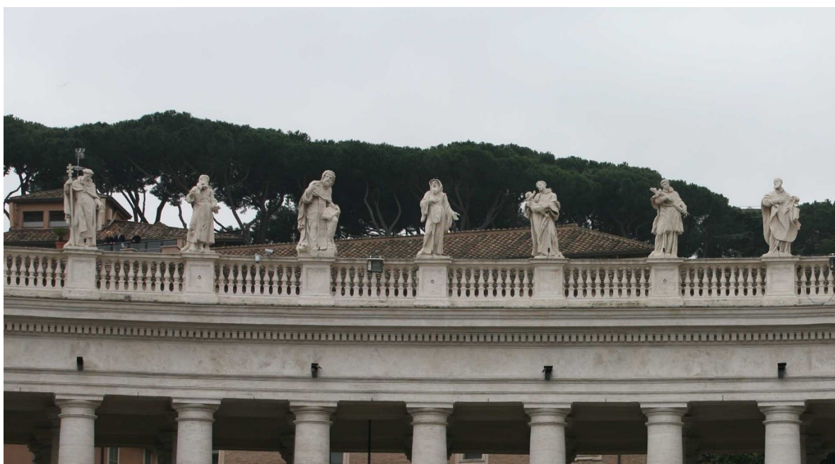
Obrázek 26 – socha sv. František z Pauly na kolonádě náměstí sv. Petra ve Vatikáně, (Francesco Antonio Fontana 1670–73) uprostřed; zdroj: http://stpetersbasilica.info/Exterior/Colonnades/Saints/St%20Anthony%20abbot-128/StAnthony-Abbot.htm