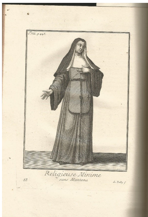
Obrázek 3 – vyobrazení oděvu paulánky (bez pláště); zdroj: laskavě poskytnuto z osobního archivu br. Milan Dolečka O. M.