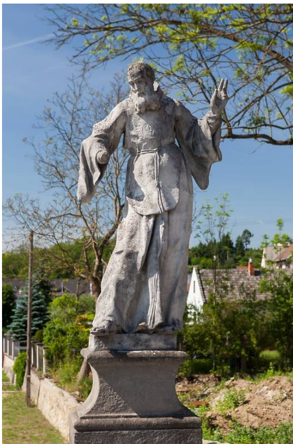
Obrázek 38 – socha sv. Františka z Pauly v Náměšti nad Oslavou