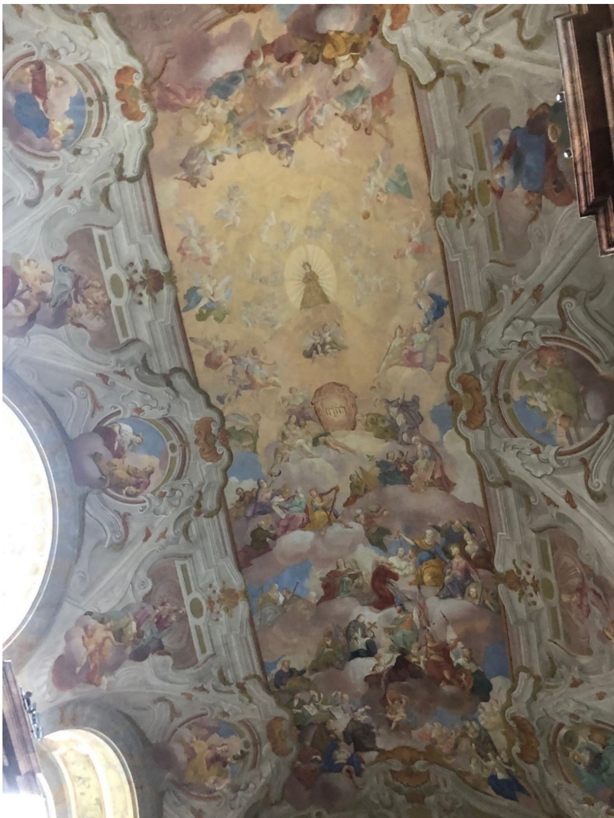
Obrázek 30 – Fresková výzdoba kostela Narození Panny Marie ve Vranově u Brna