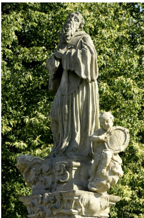
Obrázek 37 – socha sv. Františka z Pauly v Pardubicích