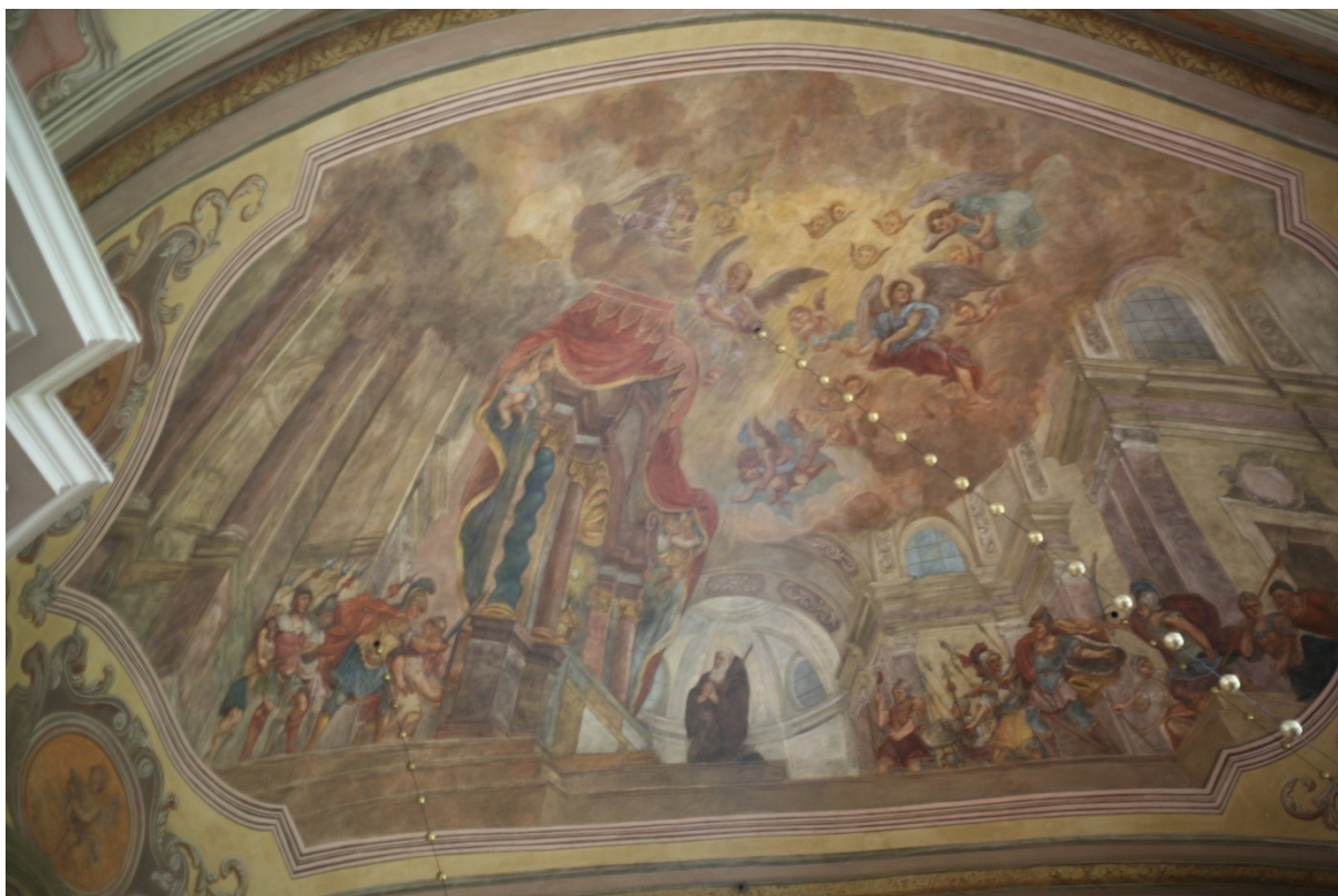
Obrázek 18 – ukázka nástropní fresky v kostele Nanebevzetí Panny Marie v Nové Pace