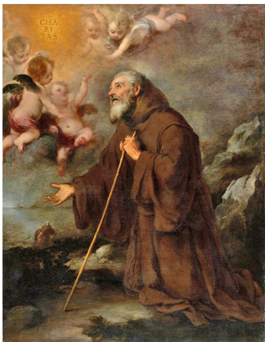
Obrázek 15 – Vidění sv. Františka z Pauly (Bartolomeo Esteban Murillo, 1670, Jean Paul Getty Museum)