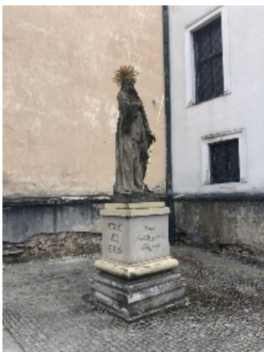
Obrázek 32 – socha sv. Františka u kostela Narození Panny Marie ve Vranově u Brna