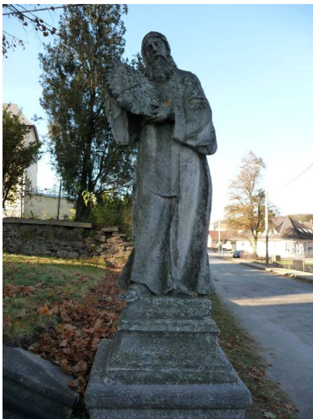
Obrázek 44 – socha sv. Františka z Pauly v Rokytnici nad Rokytinou