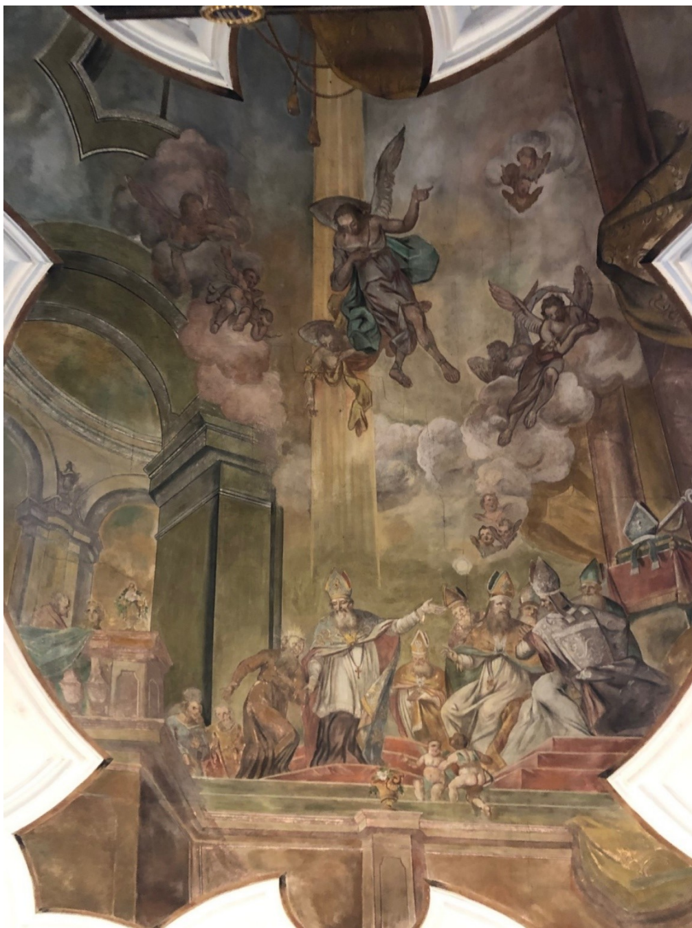
Obrázek 21 – nástropní freska v kostele sv. Mikuláše v Chotči