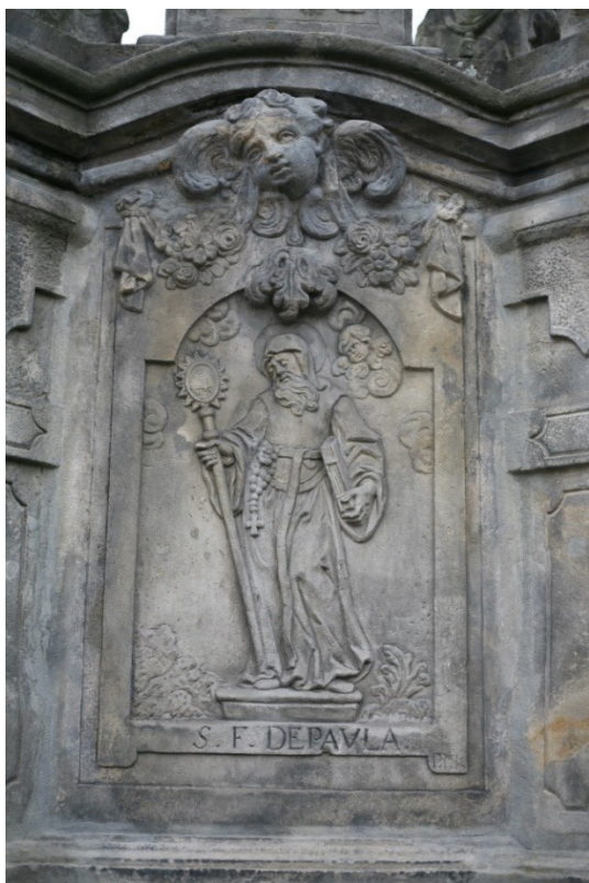
Obrázek 39 – reliéfní mariánské sousoší v Sobotce