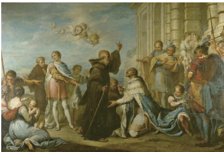
Obrázek 14 – Král Ludvík XI. Vítá sv. Františka z Pauly při jeho příjezdu do Plessis-les-Tours (Jacques Dumont, 1730, Musée de Beaux Arts Tours) zdroj: https://mba.tours.fr/TPL_CODE/TPL_COLLECTIONPIECE/98-18e.htm?COLLECTIONNUM=13&PIECENUM=203&NOMARTISTE=DUMONT+Jacques%2C+dit+le+Romain