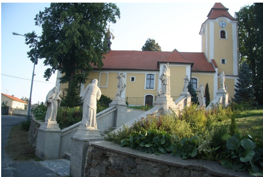
Obrázek 45 – pohled na schodiště se sochami a kostel sv. Jana Křtitele v Rokytnici nad Rokytinou