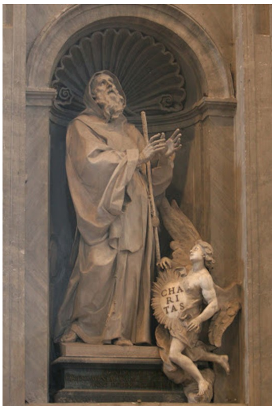
Obrázek 25 – socha sv. Františka z Pauly (Giovanni Battista Maini, 1732, bazilika sv. Petra)