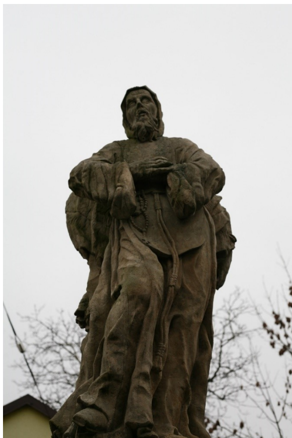
Obrázek 43 – pohled na sochu sv. Jana Nepomuckého a sv. Františka z Pauly v Hlušicích