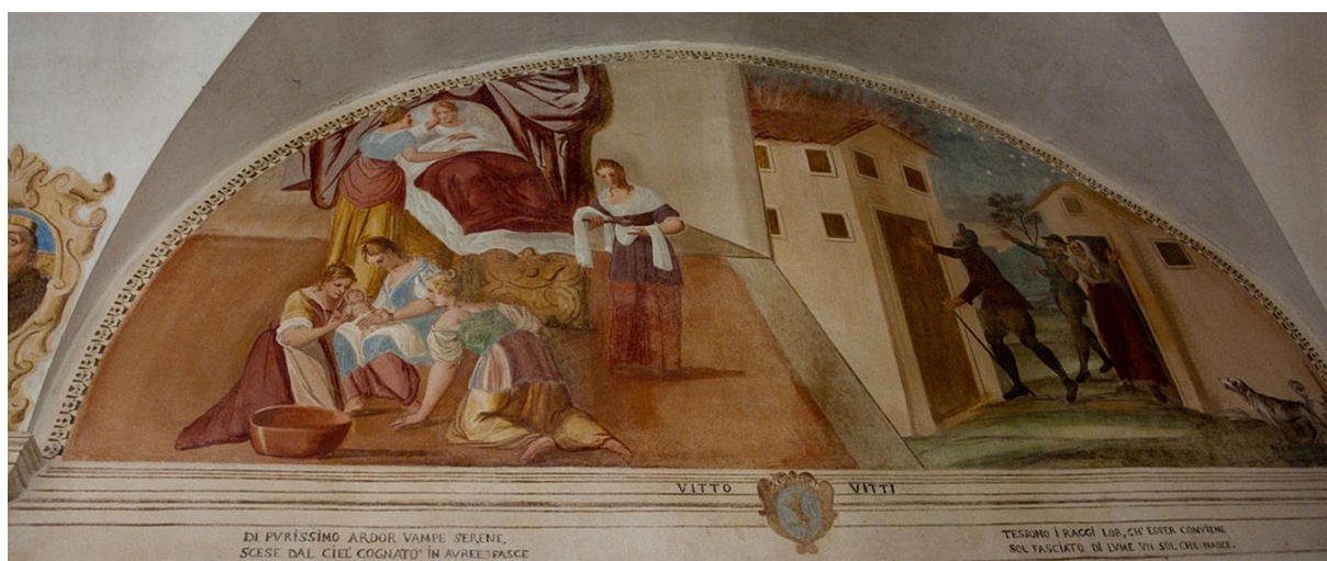
Obrázek 7 – ukázka nástěnné malby z chodby u kostela San Giuliano ve Vicenze; zdroj: https://commons.wikimedia.org/wiki/File:Vicenza_San_Giuliano_affresco_miracoli_S_Francesco_di_Paola_Corridoio-3-2.jpg autor: Claudio Gioseffi