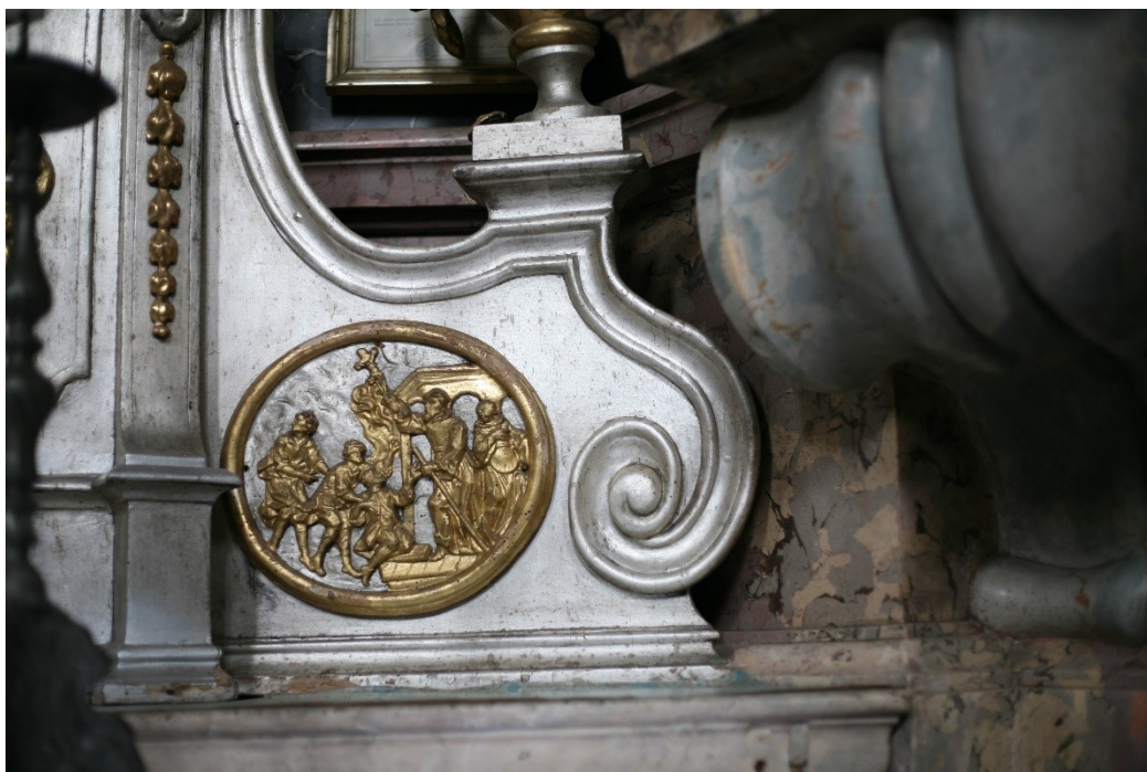
Obrázek 20 – detail bočního oltáře v kostele Nanebevzetí Panny Marie v nové Pace