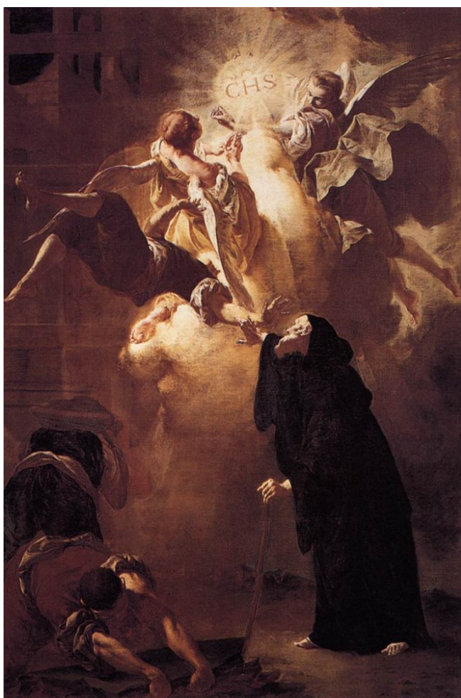
Obrázek 17 – Zázrak sv. Františka z Pauly (Francesco Capella, pol. 18. stol. Museo Diocesano)