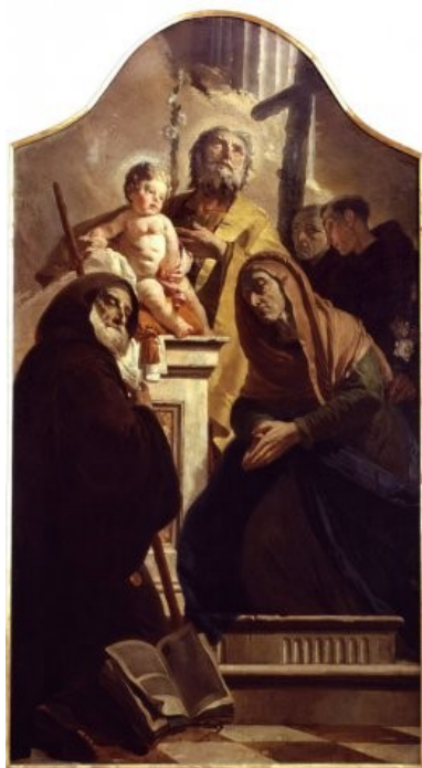
Obrázek 28 – Sv. Josef s malým Ježíšem, sv. Františkem z Pauly, Annou, Antonínem a Petrem z Alcantary (Giambattista Tiepolo, 1730–35, Galleria Academia Venezia)