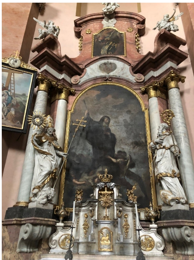
Obrázek 19 – oltář sv. Františka z Pauly v kostele Nanebevzetí Panny Marie v Nové Pace