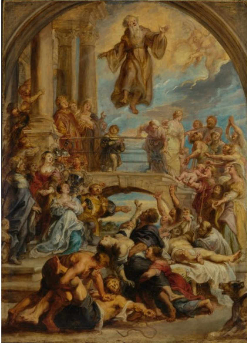
Obrázek 9 – Zázraky sv. Františka (Petr Paulus Rubens, 1627–28, Jean Paul Getty Museum) zdroj: http://www.getty.edu/art/collection/objects/839/peter-paul-rubens-the-miracles-of-saint-francis-of-paola-flemish-about-1627-1628/