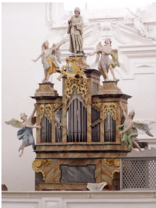
Obrázek 36 – varhanní skříň v kostele Nejsvětější Trojice v Klášteře