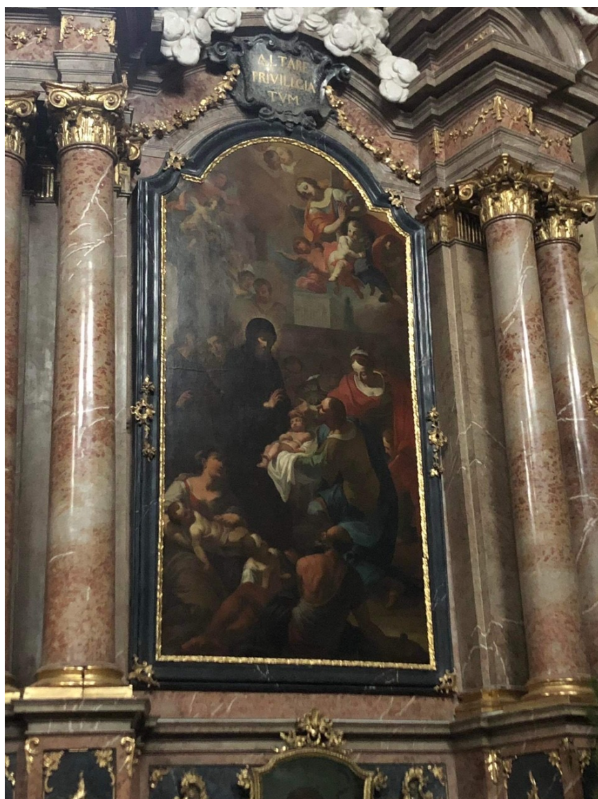
Obrázek 23 – oltářní obraz v kostele Narození Panny Marie ve Vranově u Brna