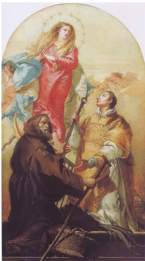
Obrázek 27 – Immaculata se sv. Vavřincem a sv. Františkem z Pauly (Giovanni Domenico Tiepolo, 1775–80, Musée Beaux Arts Strasbourg); zdroj: https://commons.wikimedia.org/wiki/File:Gian_Domenico_Tiepolo-La_Vierge_en_gloire-Mus%C3%A9e_des_beaux-arts_de_Strasbourg.jpg autor: Ji-Elle