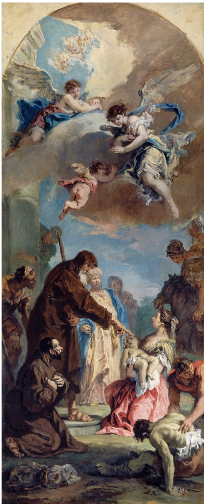
Obrázek 11 – sv. František z Pauly oživuje dítě (Sebastiano Ricci, 1732–34, National art Museum in Washington D.C.)