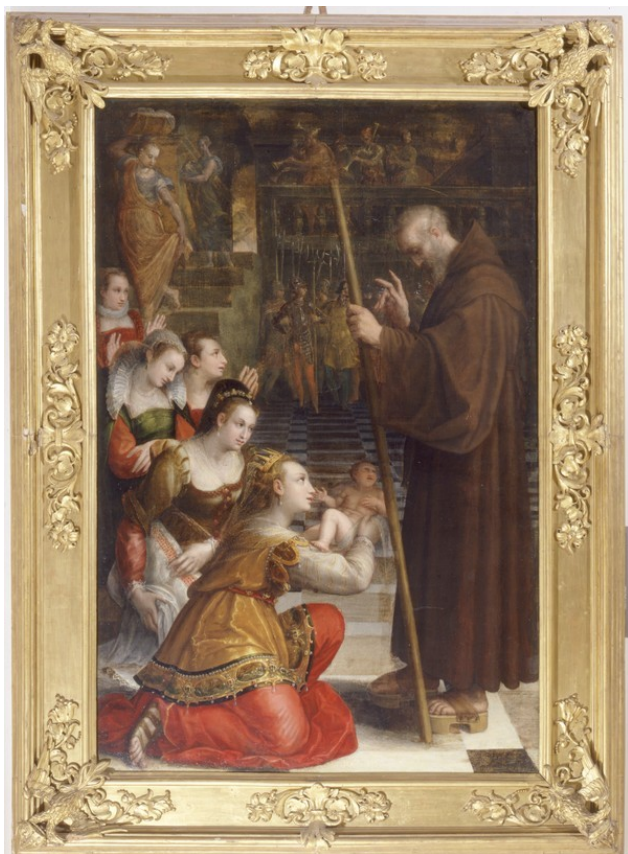
Obrázek 13 – sv. František žehná dítěti Louisy Savojské (Lavinia Fontana, kol. 1590, Pinacoteca Nazionale Bologna)