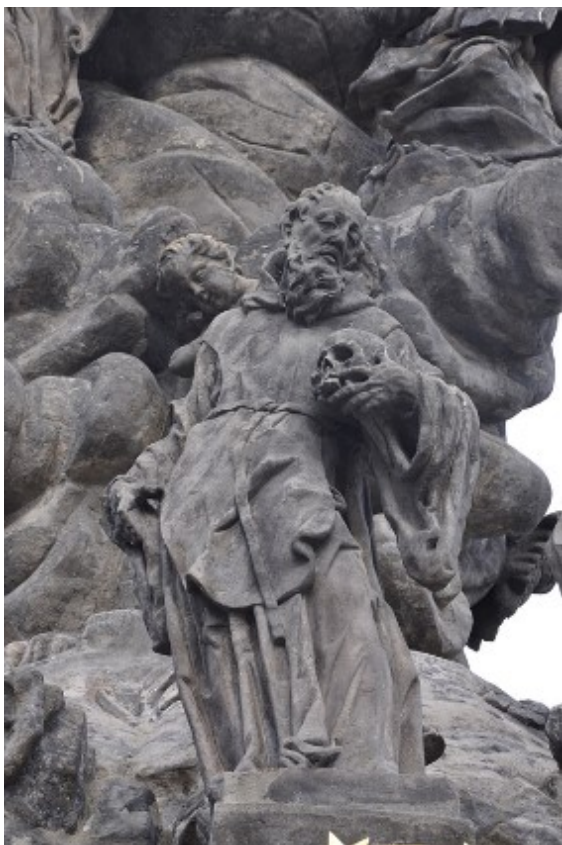
Obrázek 40 – socha na sloupu Proměnění Páně v Chrudimi