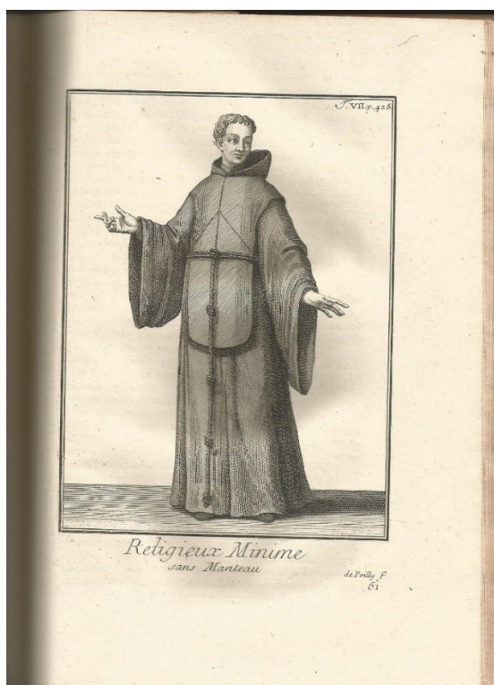
Obrázek 4 – vyobrazení oděvu paulána (bez pláště)