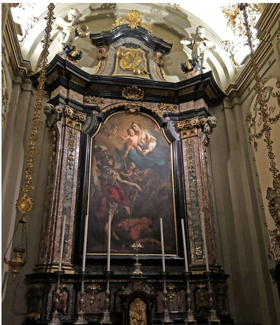
Obrázek 29 – oltář v kostele sv. Františka z Pauly v Miláně (Giacomo Guerrini)