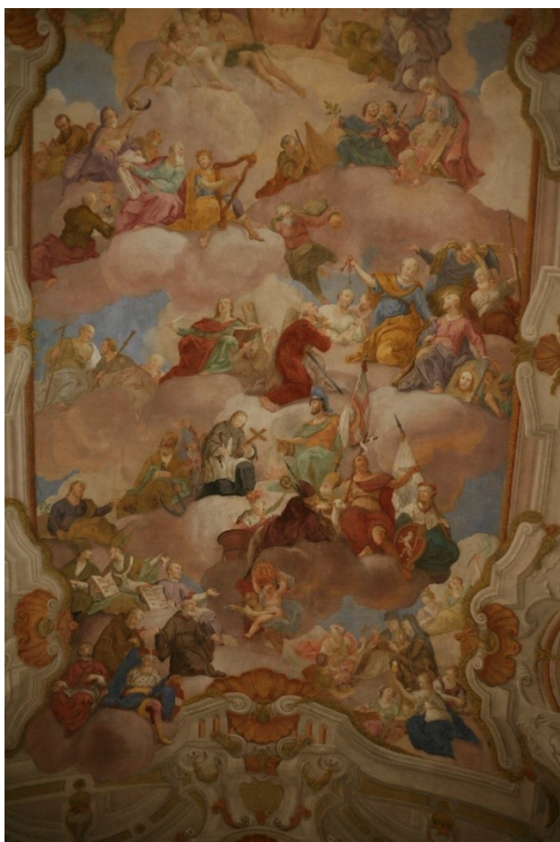
Obrázek 31 – detail freskové výzdoby kostela Narození Panny Marie ve Vranově u Brna