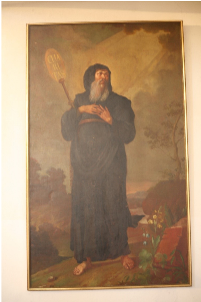
Obrázek 34 – obraz sv. Františka z Pauly v kostele v Chotči