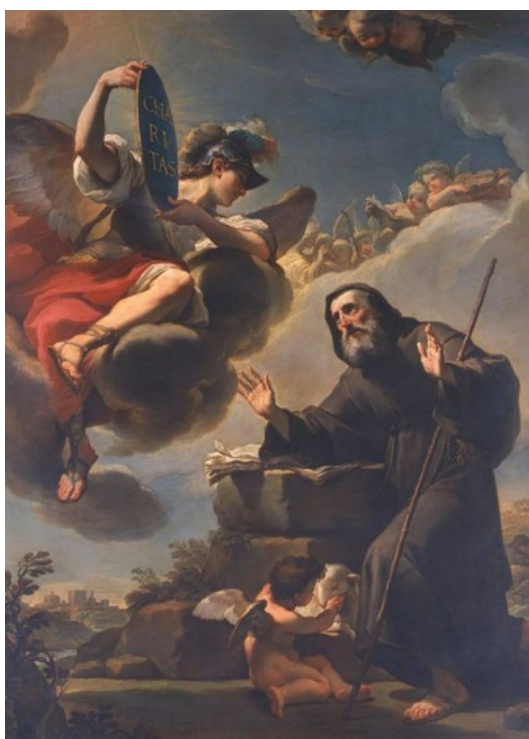
Obrázek 16 – Sv. František z Pauly dostává nápis Charitas od archanděla Michaela (Ubaldo Gandolfi, 1778–79, Pinacoteca Nazionale Bologna)