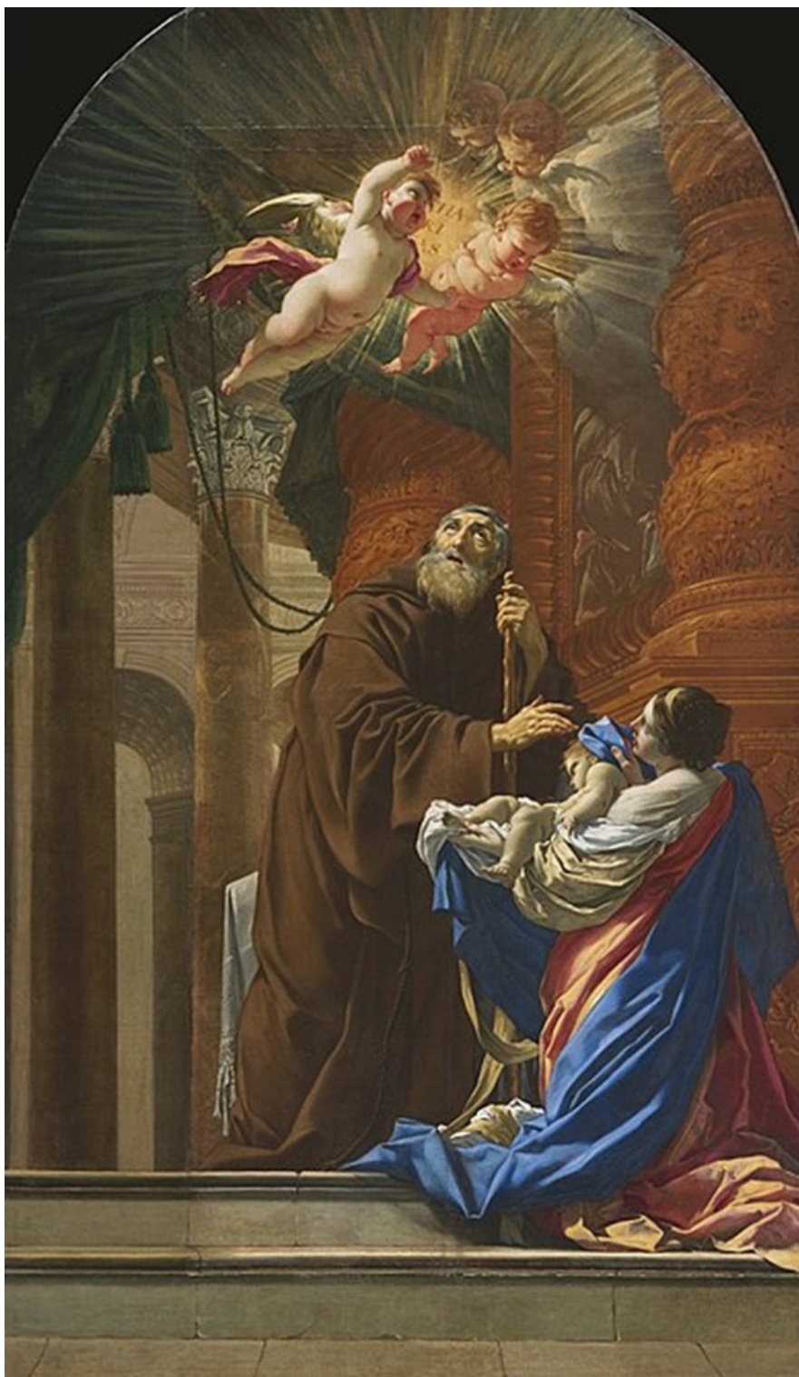
Obrázek 12 – sv. František z Pauly oživuje dítě (Simon Vouet, 1648, kostel St. Henri-de-Lévis, Quebec)