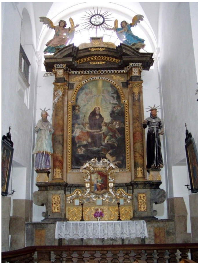
Obrázek 35 - oltář sv. Františka z Pauly v kostele Nejsvětější Trojice v Klášteře