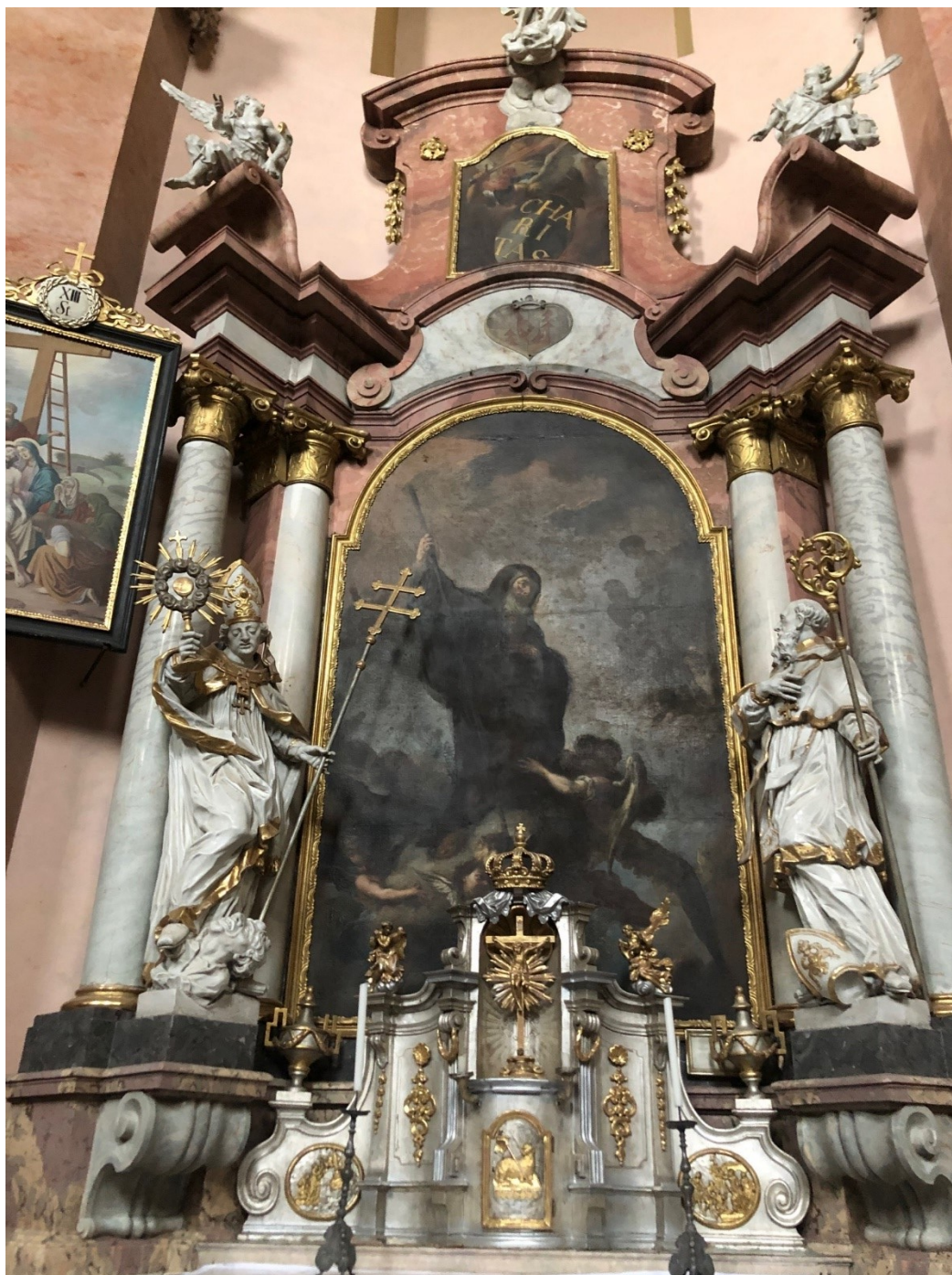
Obrázek 33 – oltář sv. Františka z Pauly v kostele Nanebevzetí Panny Marie v Nové Pace (Petr Brandl)