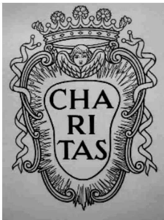
Obrázek 2 – současný znak řádu Nejmenších bratří sv. Františka z Pauly; zdroj: laskavě poskytnuto z osobního archivu br. Milan Dolečka O. M.