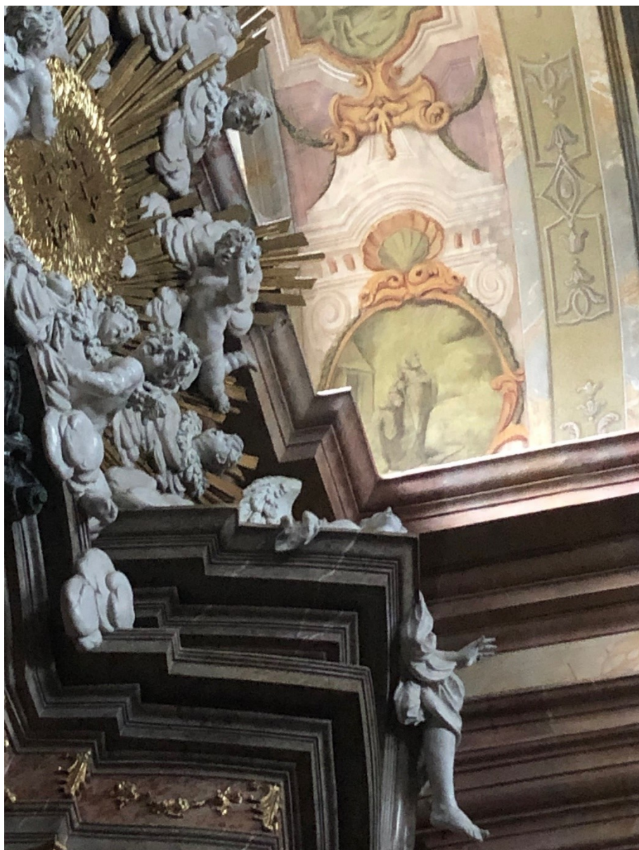
Obrázek 24 – ukázka freskové výzdoby a oltářního nástavce v kostele Narození Panny Marie ve Vranově u Brna