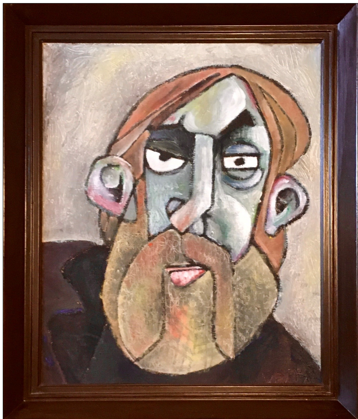
Příloha č. 3: Obraz s názvem „Vrát'a“ (olej na plátně, 1982 – soukromá sbírka), vytvořený krátce před Brabencovou nucenou emigrací – autorem je akademický malíř Pavel Beneš.