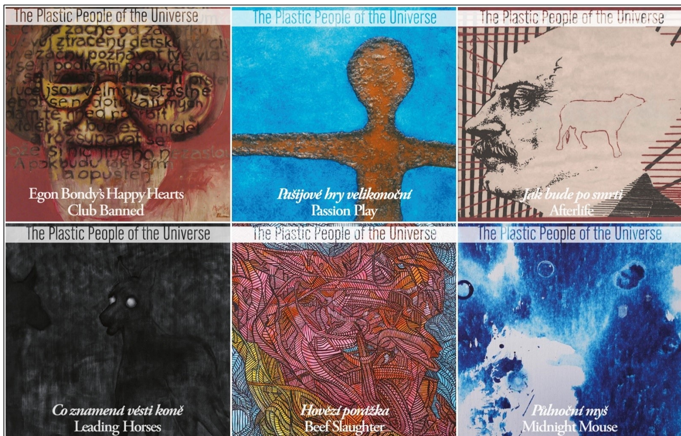
Příloha č. 1: Přední obaly („front-covery“) jednotlivých, nově vydaných redigitalizovaných desek The Plastic People of the Universe (Guerilla Records, 2021).