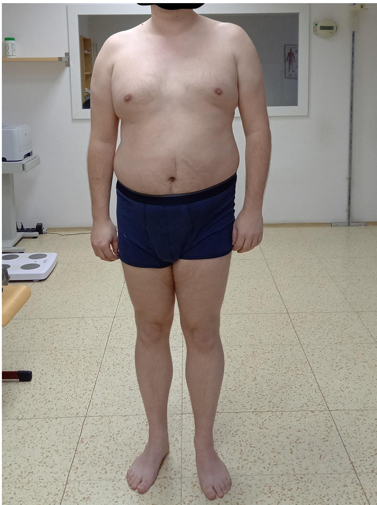
Obr. č. 3 Fotografie probanda s obezitou zepředu