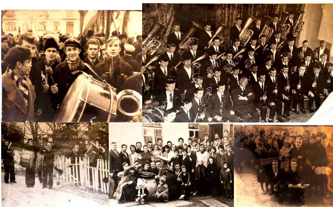
Rodinná setkání/ zábava