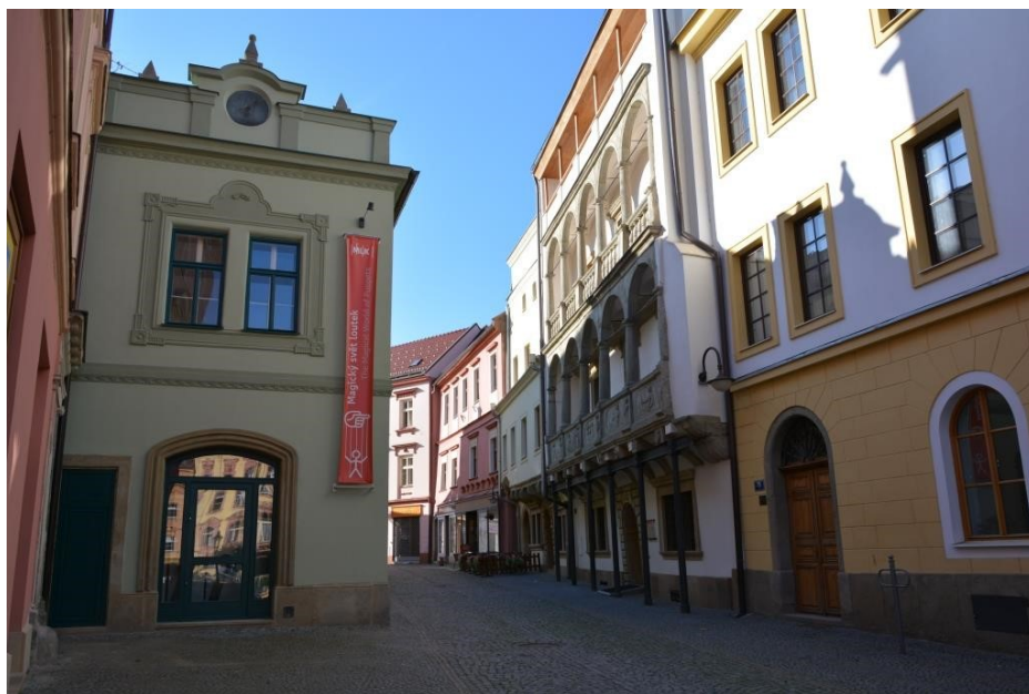
Obr. 27: Současný pohled na MLK z Břetislavovy ulice

vpravo dům č. p. 75, dále Mydlářovský dům a v pozadí Piklův dům, vlevo dům č. p. 62 zakoupený v roce 2012