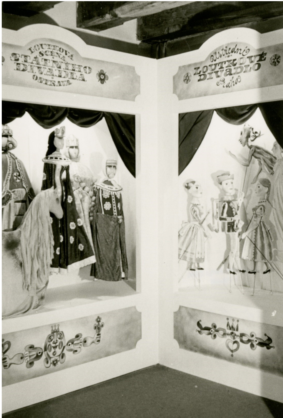
Obr. 19: Výstava Současné české loutkové divadlo dle návrhu Jana Hlíny, 1981

MLK v Chrudimi, Fotografie, Inv. č. FOT 6447