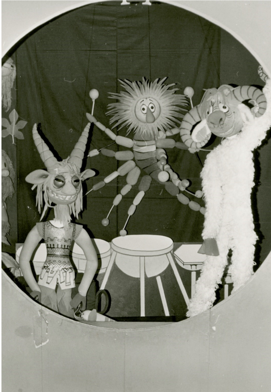
Obr. 20: Expozice Luminiscenční divadlo Františka Tvrčka, 1986

MLK v Chrudimi, Fotografie, Inv. č. FOT 9027