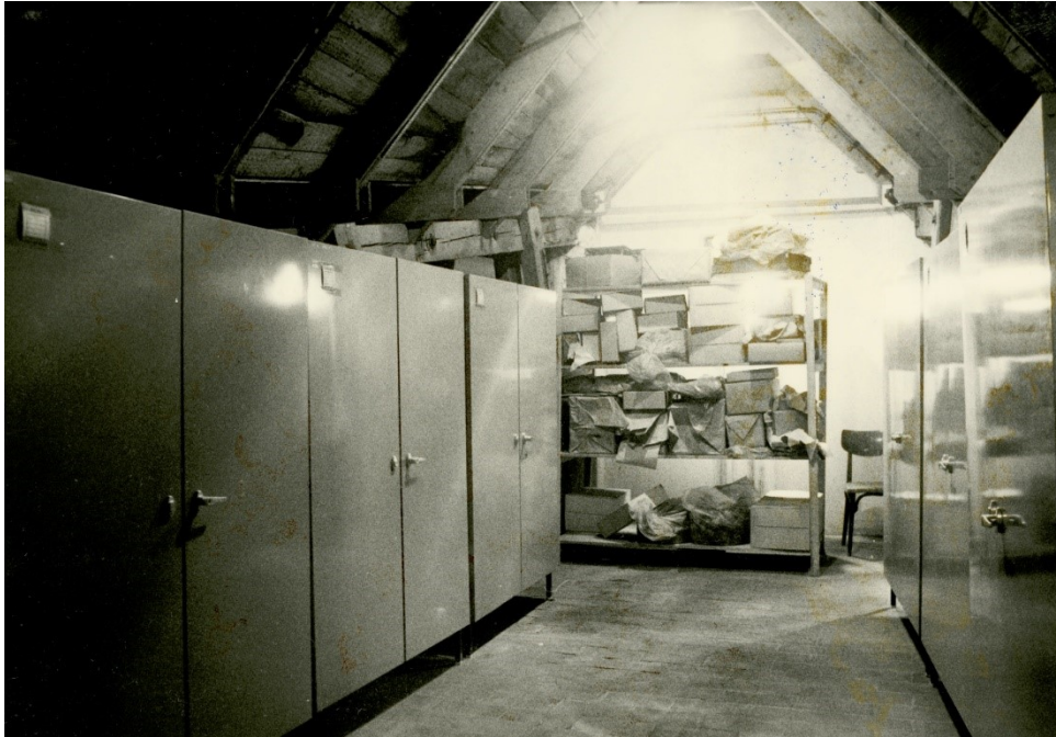
Obr. 23: Depozitární prostory na půdě Mydlářovského domu, konec 80. let

MLK v Chrudimi, Fotografie, Inv. č. FOT 11168