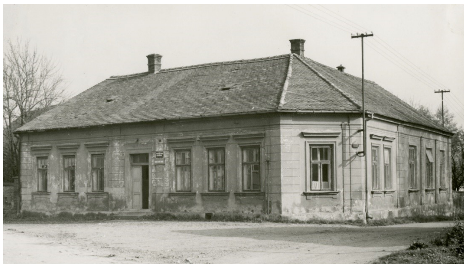
Obr. 22: Depozitář MLK ve Stolanech před rekonstrukcí, 1977

MLK v Chrudimi, Fotografie, Inv. č. FOT 10318