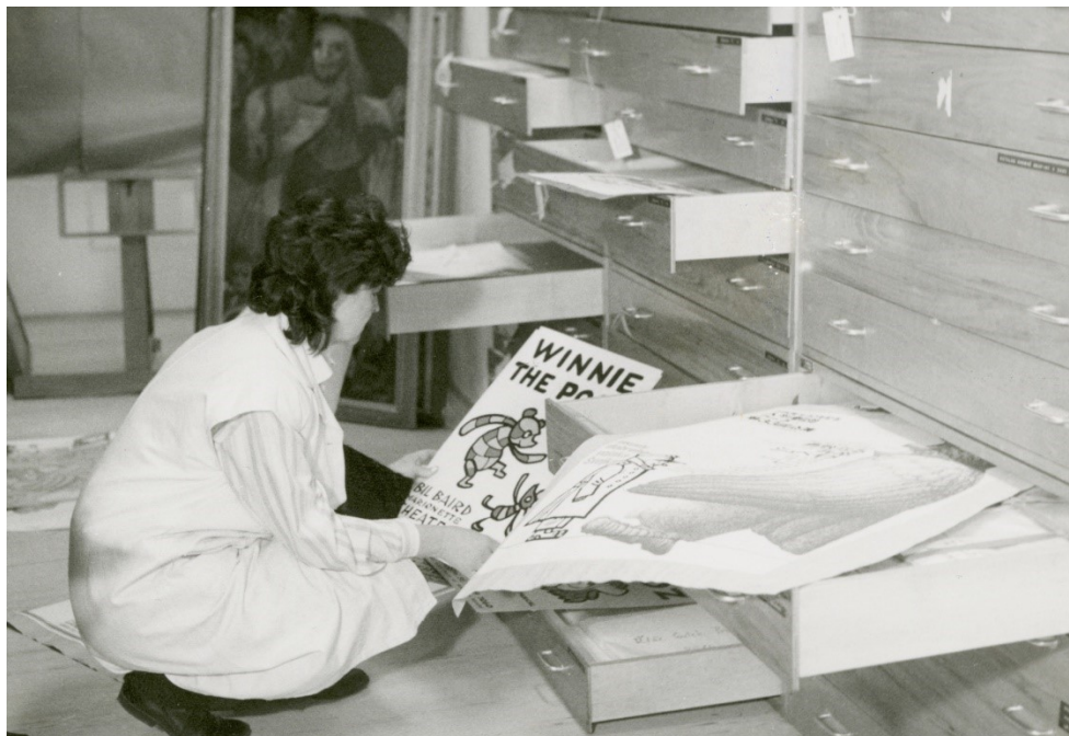
Obr. 24: Ukládání plakátů v depozitáři, 1992

MLK v Chrudimi, Fotografie, Inv. č. FOT 11168