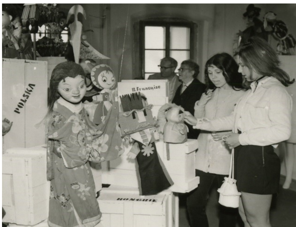
Obr. 10: Ukázka ze zahajovací expozice z července 1972

MLK v Chrudimi, Fotografie, Inv. č. FOT 8875