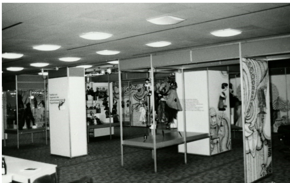
Obr. 16: Výstava Tradice a současnost čs. loutkového divadla v Berlině z roku 1976

MLK v Chrudimi, Fotografie, Inv. č. FOT 4155