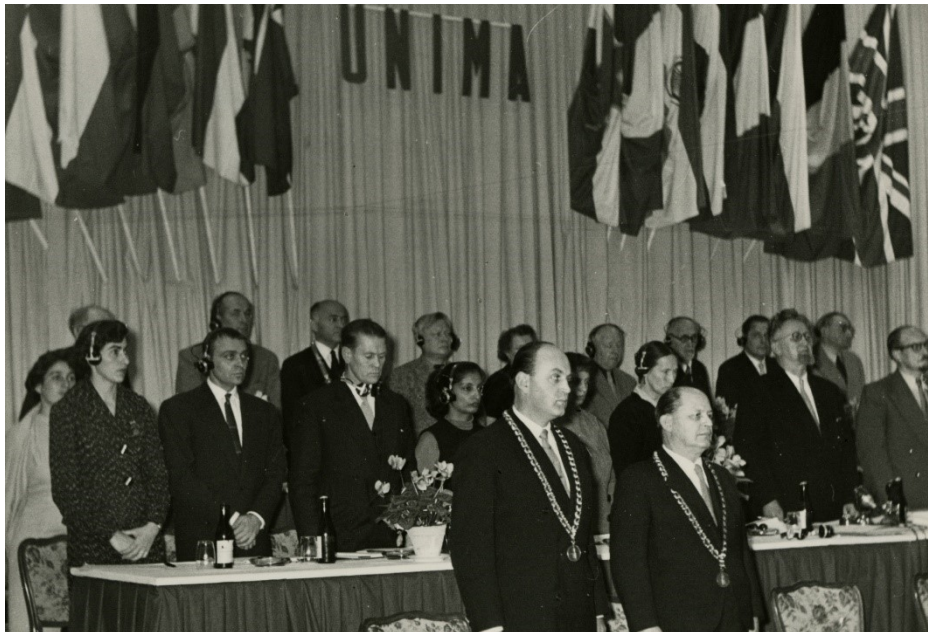
Obr. 5: Zahájení X. kongresu UNIMA v Praze, 1969 MLK v Chrudimi, Fotografie, Inv. č. FOT 9707