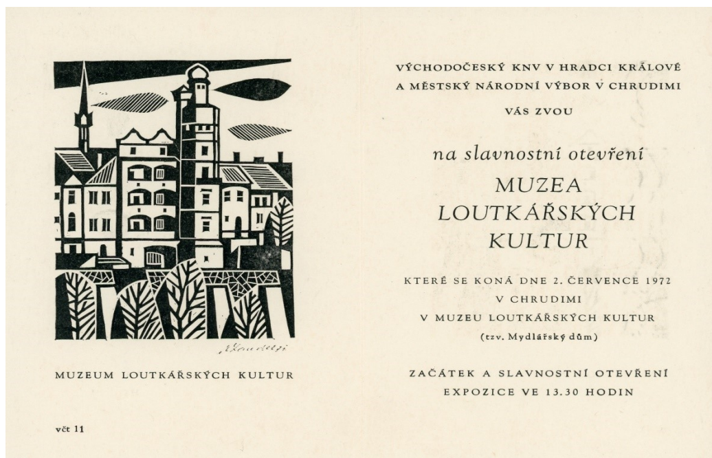
Obr. 9: Pozvánka na slavnostní otevření MLK