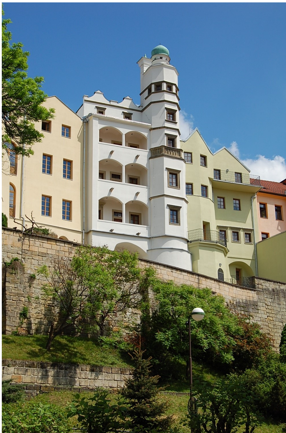
Obr. 26: Současný pohled na MLK z jihu

vlevo dům č. p. 75, uprostřed Mydlářovský dům č p. 74 a vpravo Piklův dům č. p. 73