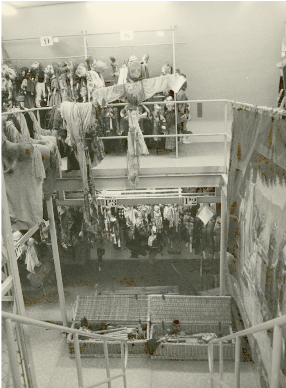
Obr. 25: Interiér depozitáře ve Stolanech, 1992

MLK v Chrudimi, Fotografie, Inv. č. FOT 11219