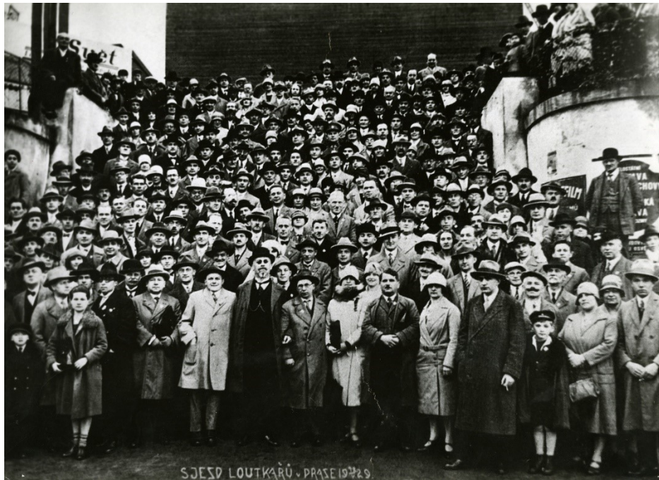
Obr. 2: Účastníci Druhého sjezdu loutkářských pracovníků v Praze, 1929

MLK v Chrudimi, Fotografie, Inv. č. FOT 10618