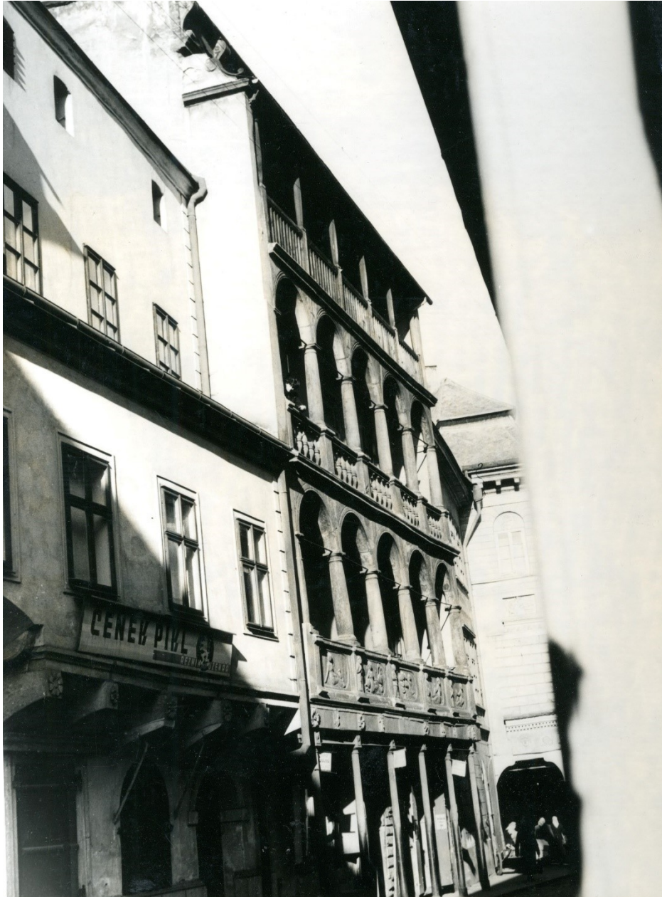
Obr. 6: Piklův dům a Mydlářovský dům, polovina 15. století

SOKA Chrudim, Fond Rudolf Stanislav (neuspořááno)