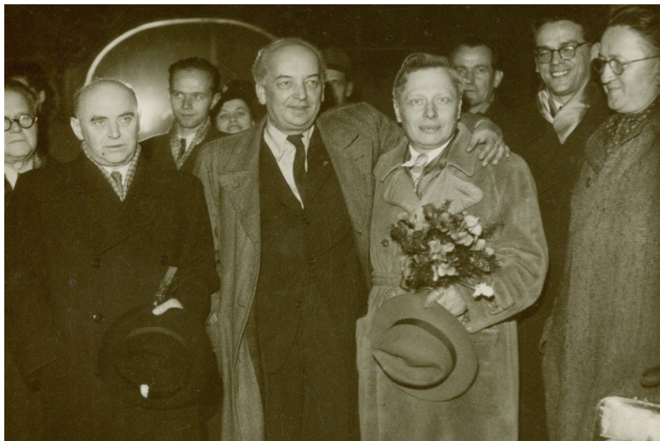
Obr. 3: Zájezd moskevského Ústředního loutkového divadla v Praze 1948, v popředí zleva Václav Kopecký, Josef Skupa, Sergej V. Obrazcov a Jan Malík

MLK v Chrudimi, Fotografie, Inv. č. FOT 10618