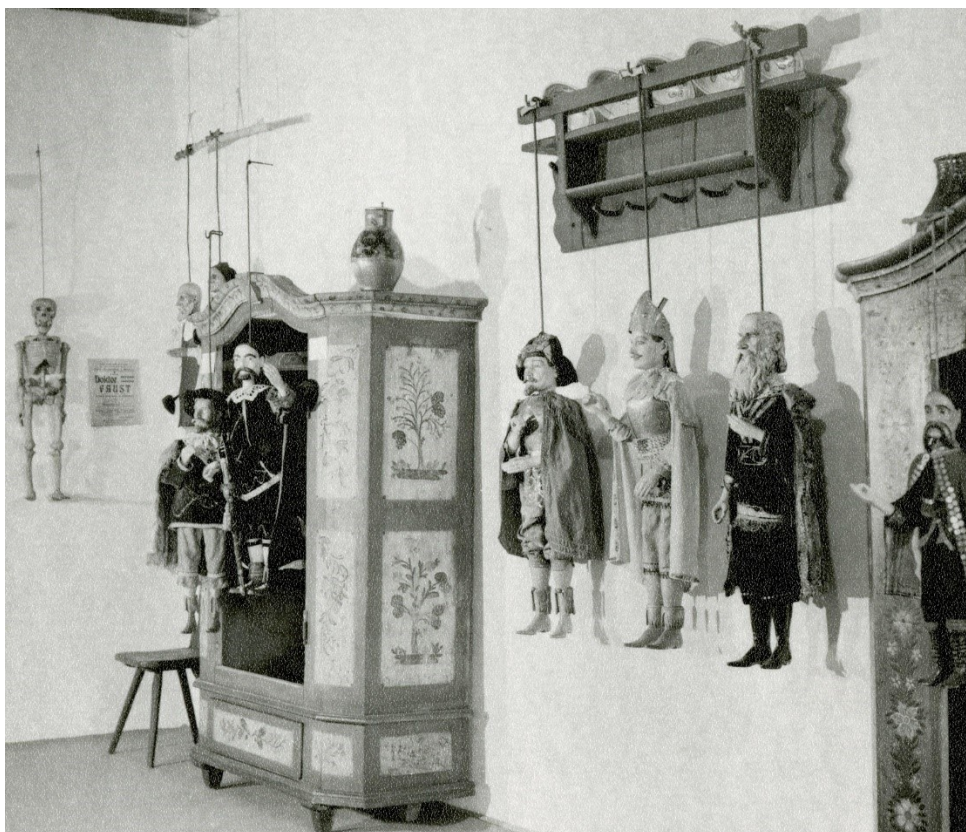
Obr. 15: Expozice marionet kočovních loutkářů z roku 1976

MLK v Chrudimi, Fotografie, Inv. č. FOT 4155