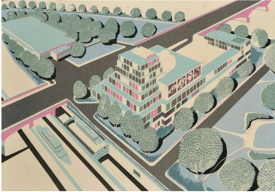
Obr. 4: Architektonická studie Ústředního loutkového divadla v Praze, originál pro knižní studii Miroslava Kouřila a Františka Fencla z roku 1966 MLK v Chrudimi, Výtvarné, Inv. č. V 1087