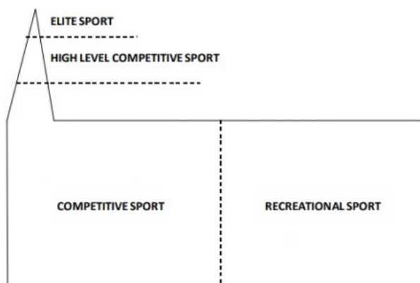
Obrázek 1 – Model sportu – kostel

Nejzákladnějším kritériem, podle kterého se dá sport dělit, je úroveň výkonnosti. Mezinárodní sportovní a kulturní asociace (ISCA) používá model kostel, viz následující obrázek 1. Je zde vidět, že elitní (ELITE) a vysoce výkonnostní soutěžní sport (HIGH LEVEL COMPETITIVE) provozuje velice malé procento občanů ve srovnání s kategoriemi soutěžního (COMPETITIVE) a rekreačního sportu (RECREATIONAL).