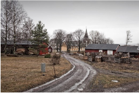
Obrázek č. 2 Věznice na ostrově Bastøy (Zdroj: www.thinkglobalhealth.com )

Ve věznici v Haldenu má každá cela vlastní lednici, TV, koupelnu s keramickou dlažbou, nejsou mříže na oknech. Na konci pracovního dne si vězni mohou vařit ve společné kuchyni, která je určena pro obsluhu vězňů z 10-12 cel/pokojů. V této věznici je lezecká stěna, běžecká dráha, basketbalové hřiště se speciálním povrchem a fotbalové hřiště. V nahrávacím studiu se odsouzení učí hrát na kytaru, klavír a další nástroje. Vedení věznice se dokonce rozhodlo nastudovat muzikál, ve kterém všechny role ztvární vězni.