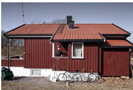
Obrázek č. 1 Ubytovna odsouzených na Bastøy

Bastøy je jednou z nejznámějších otevřených věznic v Norsku. Vrazi, násilníci a zloději si zde odpykávají trest, zachází se s nimi zde důstojně. Vězení se nachází na samostatném skalnatém ostrově bohatém na lesy a pole. Žádné ploty z ostnatého drátu, žádné kamery, dokonce ani stráž. Zločinci bydlí v malých dřevěných ubytovnách. Na ostrově se mohou volně pohybovat, včetně cyklistiky, telefonovat pomocí telefonních budek. Vězni pěstují ovoce a zeleninu, opravují auta a získávají vzdělání. O víkendech mohou rybařit, chodit na pláž, a dokonce hrát fotbal.