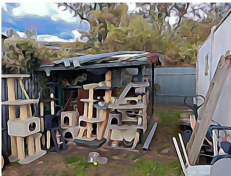
Obrázek č. 17. Kočičí pelíšky. Autorka Anna Vykoukalová. Říjen 2021.

Kočky byly na přítomnost lidí zvyklé, zároveň zůstávaly ostražitě. Pokud jsem se k nim přiblížila na vzdálenost kratší než dva-tři metry, utíkaly ode mě. Marii však k sobě pustily blíž, neutíkaly před ní a bylo vidět, že jsou na ni zvyklé. Občas s nimi promlouvala, některé měla pojmenované.