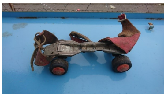
Obrázek č. 13. Stará brusle. Březen 2021.