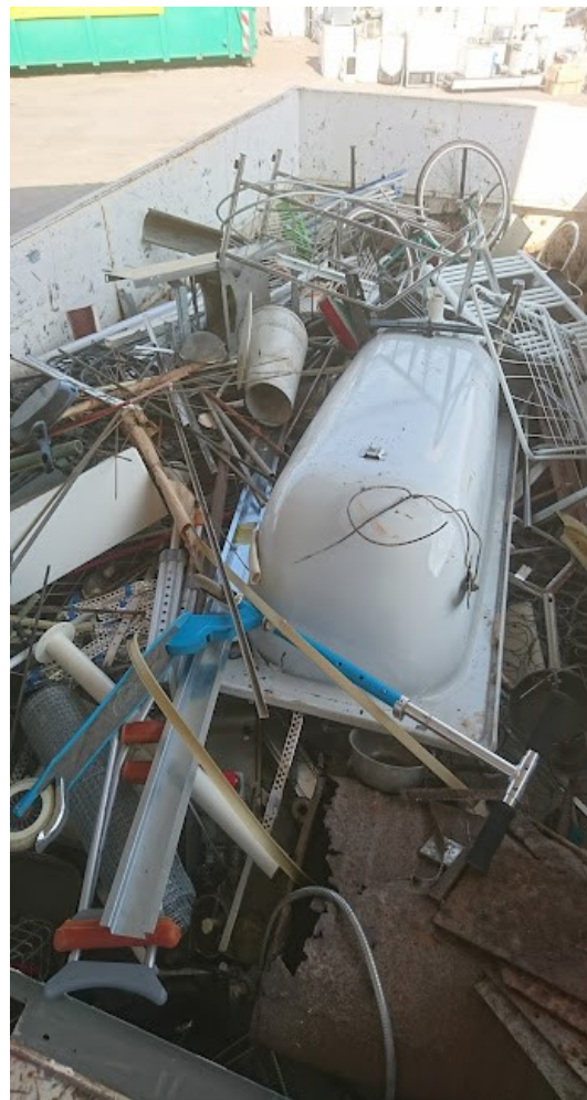
Obrázek č. 11. Železo. Září 2021.