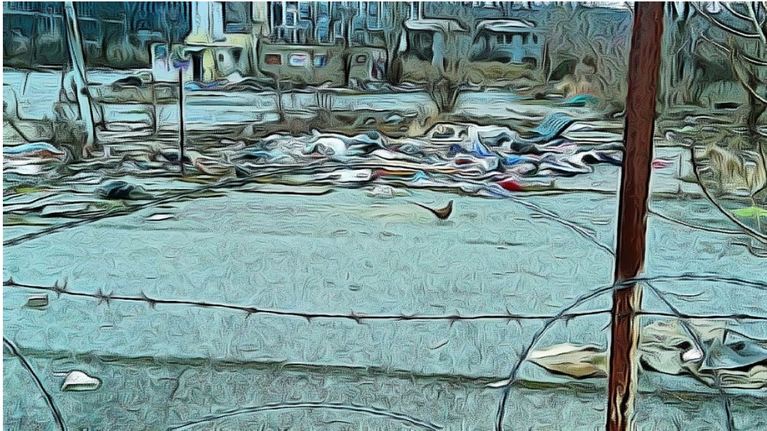
Obrázek č. 18. Bažant v brownfieldu. Březen 2021.