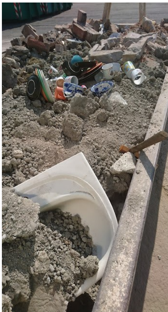
Obrázek č. 10. Umyvadlo než ho rozbijí. Autorka Anna Vykoukalová. Říjen 2021.