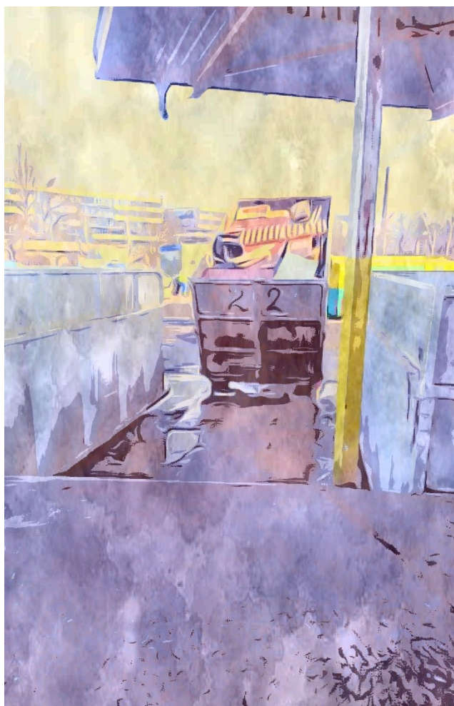
Obrázek č. 3. Kontejner v pohybu. Březen 2021.