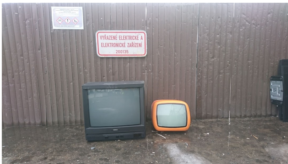
Obrázek č. 14. Liminální televize. Autorka Anna Vykoukalová. Březen 2021.