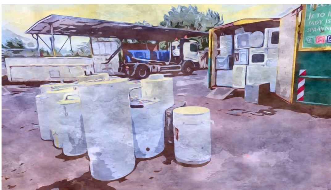
Obrázek č.4. Auto nakládá kontejner. Květen 2021.