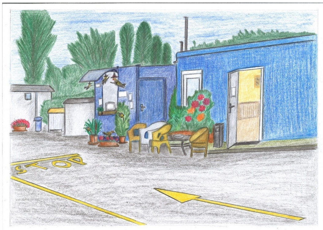
Obrázek č. 16. Mariina bouda. Autorka Dana Vykoukalová. Červen 2022

Vyhozené odpady fungovaly v každodenní praxi sběrného dvora také jako ozdoby či prostředky pobavení. Zaměstnanecké budky byly totiž obložené plastovými květinami, plyšáky, figurkami apod., které tam umístila Marie, když na sběrném dvoře začala pracovat. Také se využívaly velké květináče, ve kterých si v létě pěstovala vzadu rajčátka a papriky. V příjezdové budce trávila každý týden mnoho hodin, a tak si ji chtěla zabydlet, promítnout do pracoviště něco ze sebe.