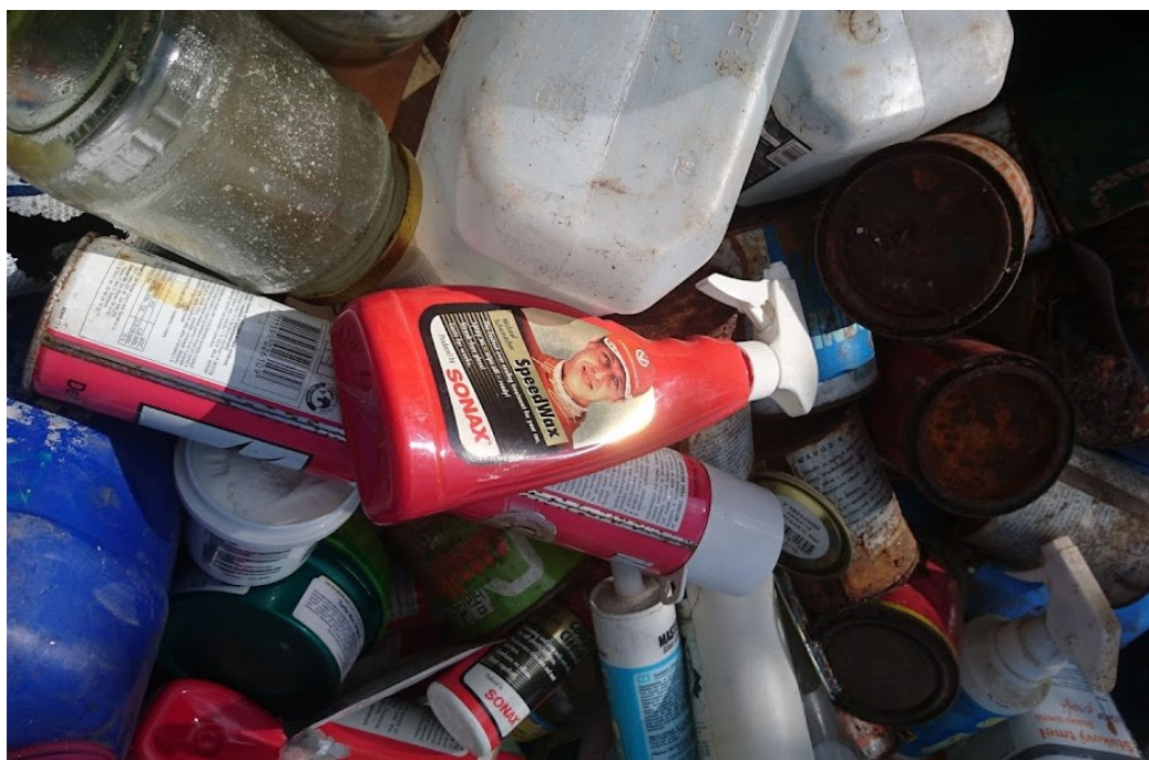
Obrázek č. 15. Michael Schumacher ležící zářící. Autorka Anna Vykoukalová. Květen 2021.

Jelikož staré barvy se nijak recyklovat nedají, musí se akorát zabezpečeně skládkovat nebo se spalují. [TRÍDĚNÍ ODPADU.CZ, 2007]. Pan Ráfek i pan Blecha tak svým jednáním minimalizují množství vyhozených barev, jejíž nebezpečné látky se poté mohou vsakovat do životního prostředí.