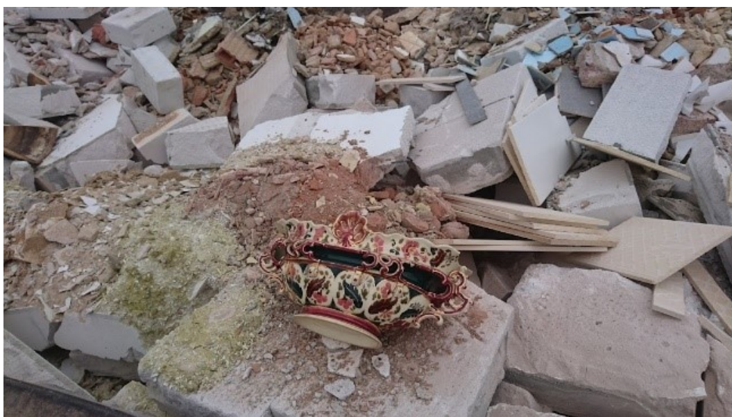
Obrázek č. 9. Překvapení v suti. Autorka Anna Vykoukalová. Březen 2021.