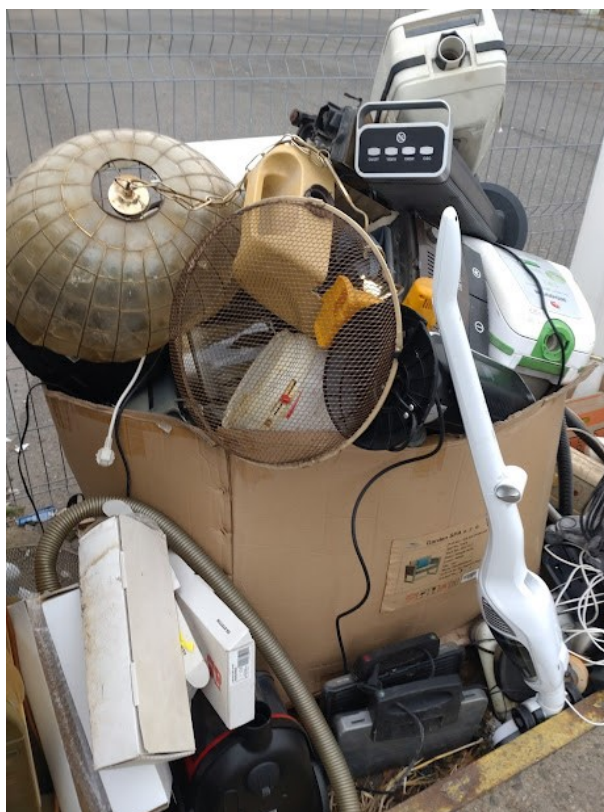
Obrázek č. 12. Několik období najednou v krabici. Autorka Anna Vykoukalová. Listopad 2021

Na sběrném dvoře se tedy nacházejí věci, které lidé vyhazují ze svých domovů, a to jak ze současnosti, tak z 90. let i ze čtyřicetileté socialistické éry a sem tam něco staršího, věci, které sloužily k různým každodenním praktickým, dekoračním nebo jiným účelům různé obaly a stavební materiály nevyjímaje. V tom je sběrný dvůr unikátní, jelikož takovouhle skrumáž věcí člověk někde jinde najde těžko. Možná na skládce, skládky však bývají většinou oplocené a narozdíl od sběrného dvora jsou veřejnosti obtížně přístupné.