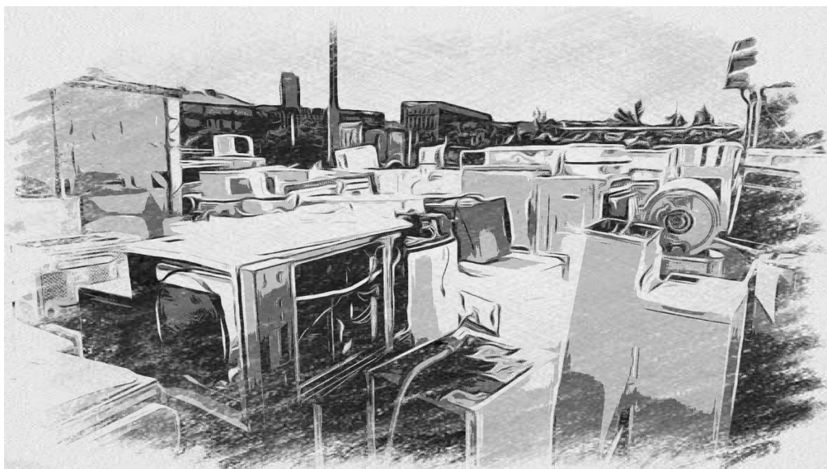
Obrázek č. 7. Hromada technických kostek. Kde končí trouby a lednice a začíná město? Autorka Anna Vykoukalová. Červenec 2021.