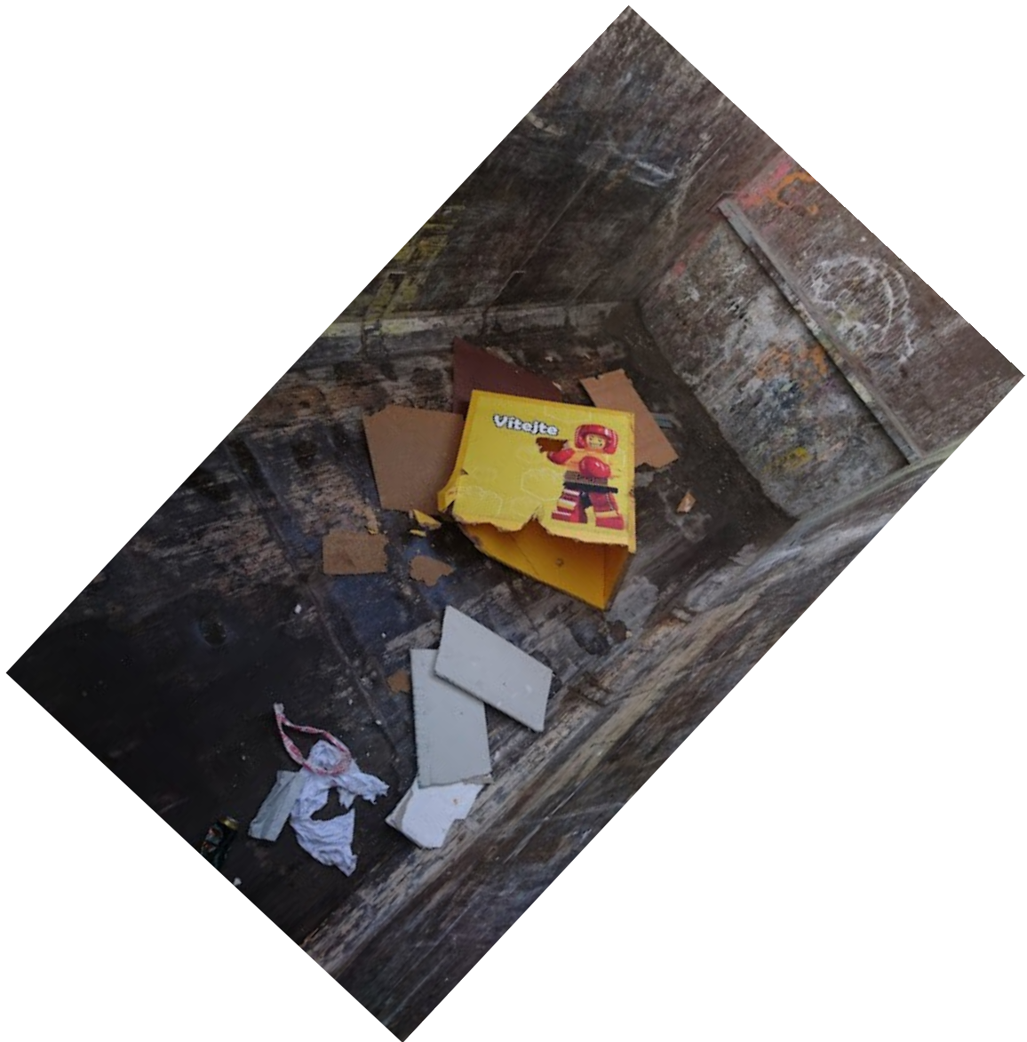
Obrázek 1: Vítejte v mé diplomové práci. Březen 2021.

Celou práci průběžně prokládám fotografiemi a obrázky, abych výrazněji vystihla zkoumaný prostor. Odpady jsou dle mého příliš zábavné na to, abych je představila pouze jednotvárným textem. Tak tedy: