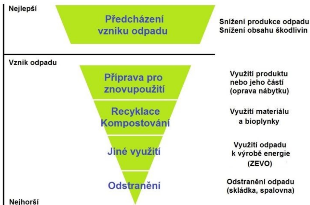
Obrázek č. 2. Odpadová Hierarchie.

V období před zřízením sběrných dvorů se sběr objemného odpadu řešil pravidelným přistavováním velkoobjemových kontejnerů (VOK) do ulic. [Sběrné dvory v Praze: 2022]. Tento systém funguje i dnes, tvoří ovšem doplňkovou službu, neboť není schopen pojmout tolik odpadů jako sběrný dvůr. I právě proto sběrné dvory vznikly, neboť VOK v devadesátých letech velmi rychle plnily a nestačily uspokojovat potřeby lidí. V naší odpadové legislativě však definici sběrného dvora nenajdeme. Každý provozovatel sběrného dvora má však většinou toto místo specifikované na svých webových stránkách nebo se lze o něm dozvědět podrobnější informace na stránkách projektů zabývajících se osvětou v třídění a recyklaci odpadů. Webové stránky projektu Samosebou popisují sběrný dvůr jako místo určené obcí nebo městem ke shromažďování a sběru vybraných složek komunálních odpadů a které je vybaveno několika druhy shromažďovacích prostředků. [Samosebou.cz: 2018]. Lidé sem mohou přinášet odpady spadající do následujících kategorií: