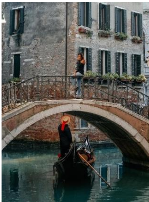
Obrázek 19: B5 a benátské mosty