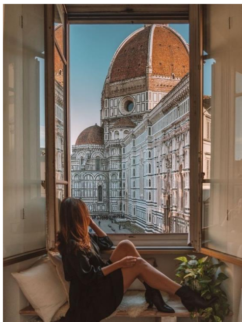
Obrázek 24: B5 a Florencie