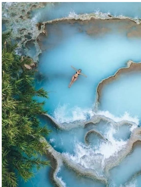
Obrázek 26: B2 a Saturnie