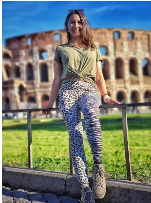
Obrázek 2: B2 a Koloseum