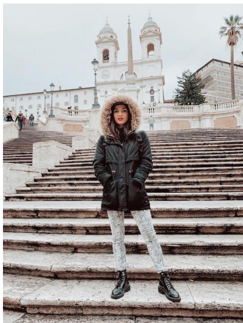
Obrázek 12: B1 a Španělské schody