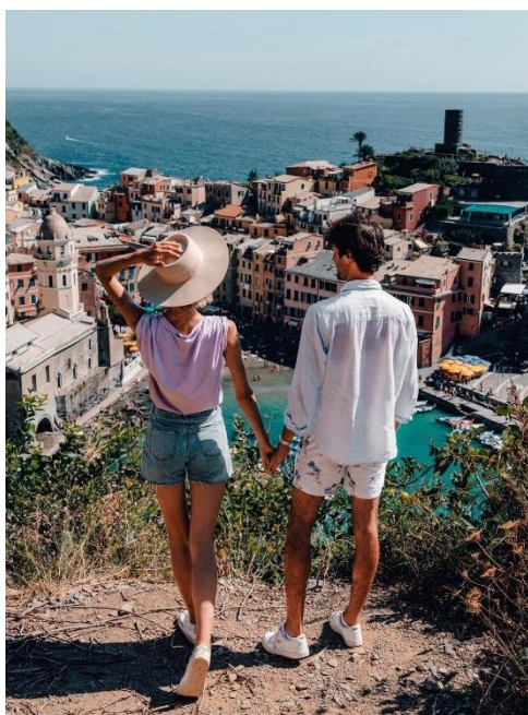
Obrázek 36: B4 a Vernazza