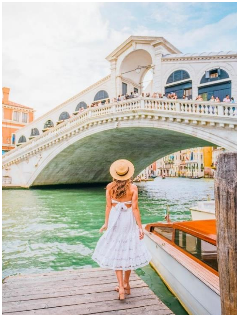
Obrázek 17: B7 a Rialto