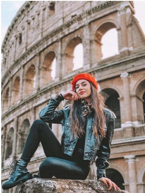
Obrázek 1: B1 a Koloseum