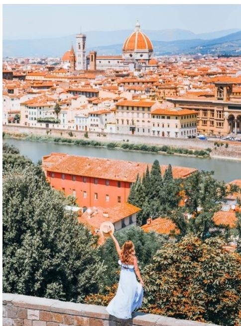
Obrázek 25: B7 a Florencie