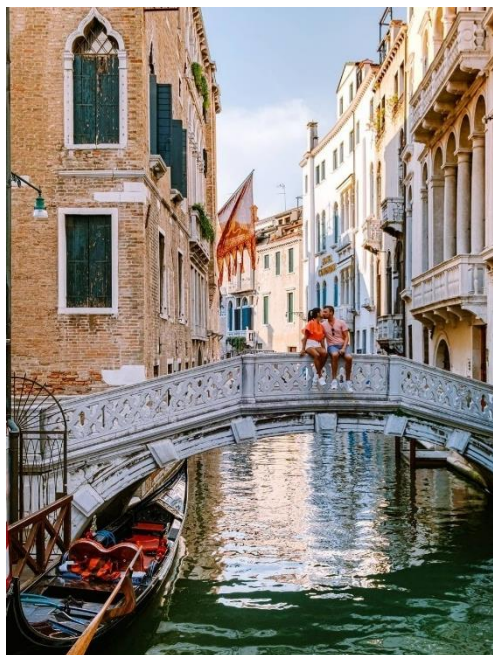
Obrázek 18: B3 a benátské mosty