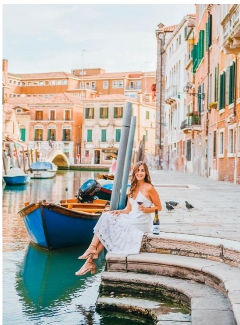
Obrázek 21: B7 a benátské mosty