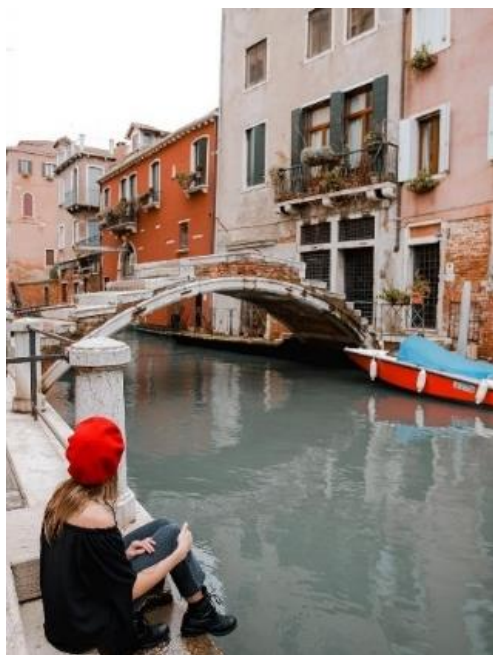
Obrázek 20: B6 a benátské mosty