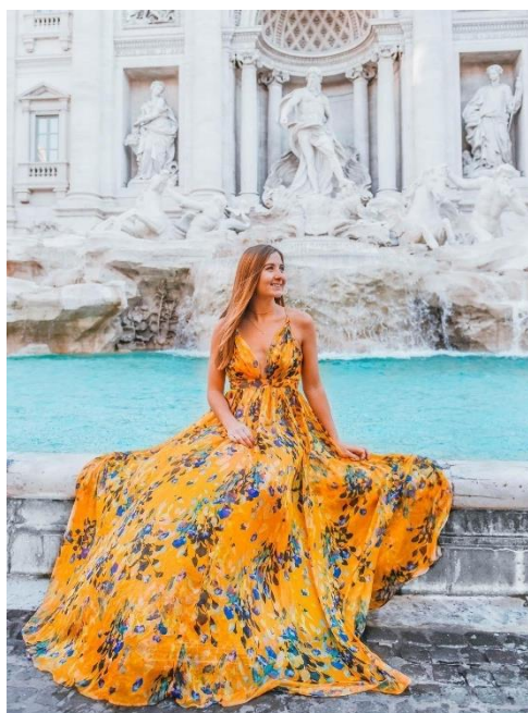
Obrázek 11: B7 a fontána di Trévi