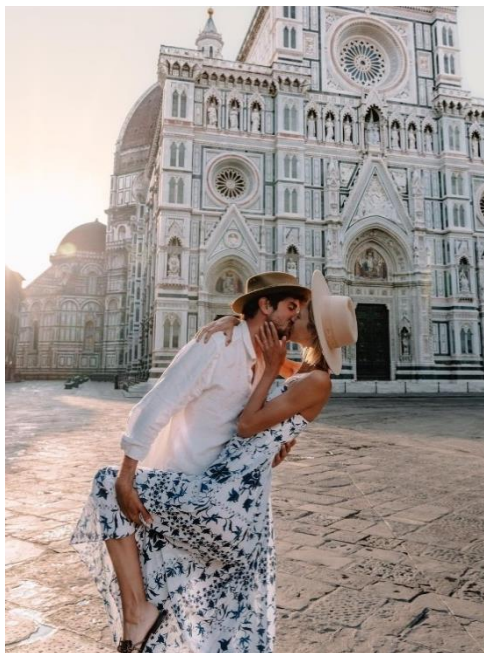
Obrázek 23: B4 a Florencie