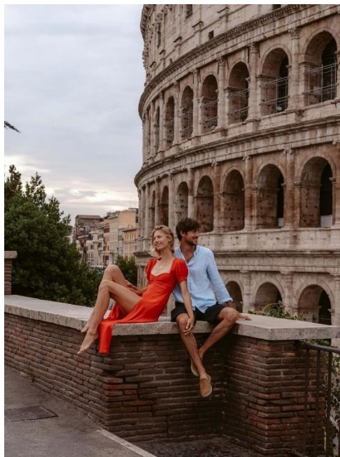
Obrázek 4: B4 a Koloseum