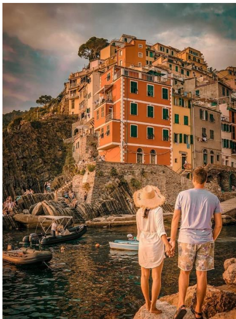
Obrázek 41: B3 a Riomaggiore