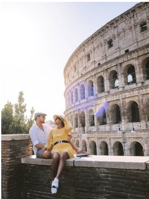
Obrázek 3: B3 a Koloseum