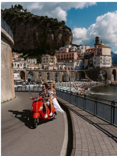
Obrázek 33: B5 a Atrani