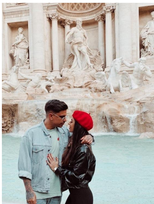
Obrázek 8: B1 a fontána di Trévi