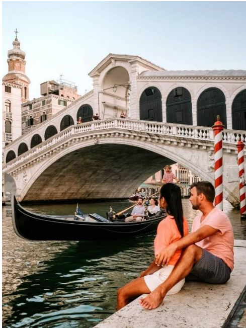
Obrázek 15: B3 a Rialto