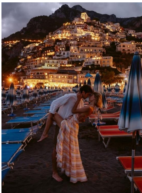
Obrázek 34: B5 a Positano