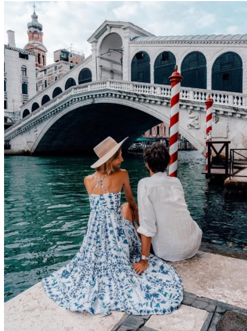
Obrázek 16: B4 a Rialto