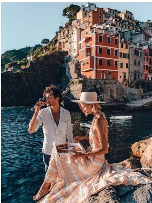
Obrázek 42: B4 a Riomaggiore