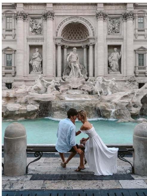
Obrázek 10: B4 a fontána di Trévi