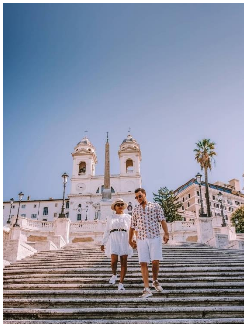
Obrázek 14: B3 a Španělské schody