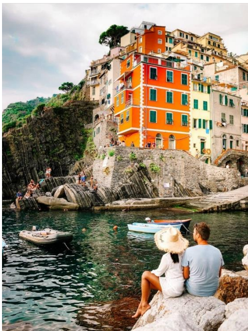
Obrázek 40: B3 a Riomaggiore