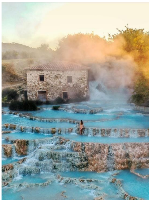
Obrázek 29: B5 a Saturnie