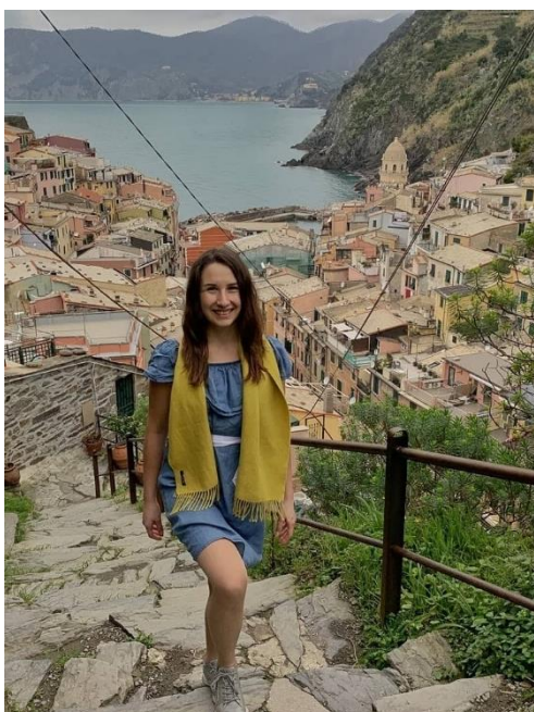
Obrázek 35: B3 a Vernazza