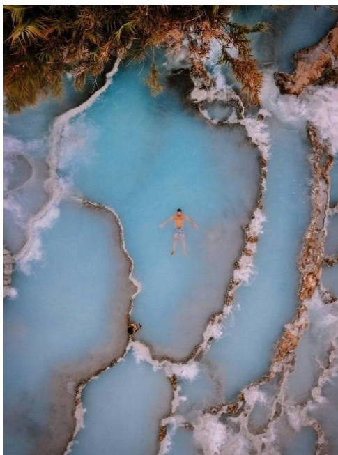
Obrázek 27: B3 a Saturnie