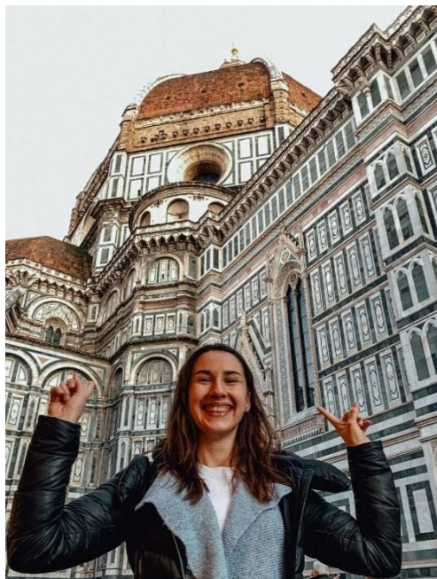
Obrázek 22: B2 a Florencie