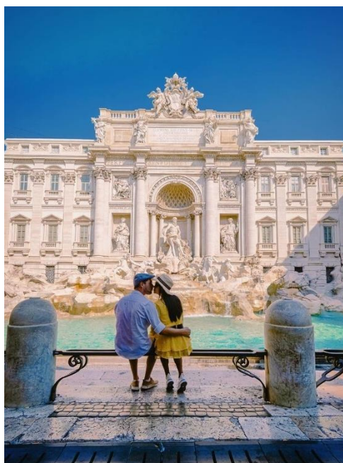
Obrázek 9: B3 a fontána di Trévi