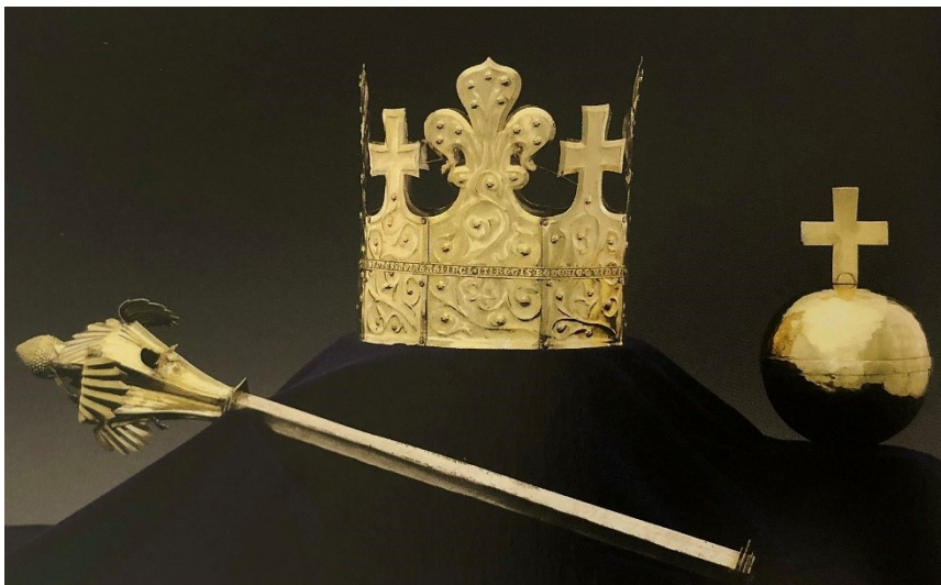
6. Pohřební koruna Přemysla Otakara II., 1296, Praha

pečeti Přemysla Otakara I. 49 , což by odpovídalo i podobě této funerální koruny ze 13. st. 50 Další inspirací pro pozdější Svatováclavskou korunu mohla být i koruna vyobrazená na pražském groši Václava II., kde jsou opět jednoznačně viditelné liliové listy na čelence.