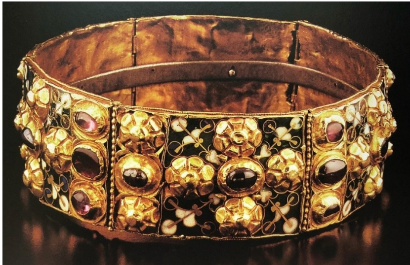
1. Lombardská koruna, 5./9. st, Monza