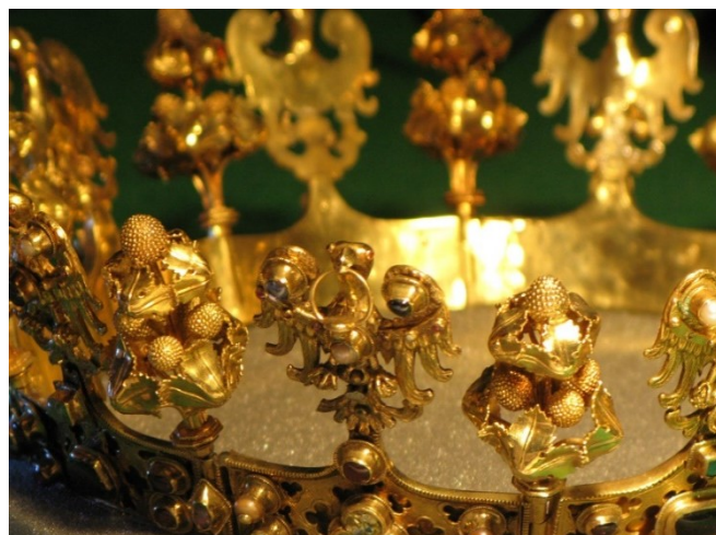
10. Koruna z pokladu ze Slezské Středy, pol. 14. st., Vratislav