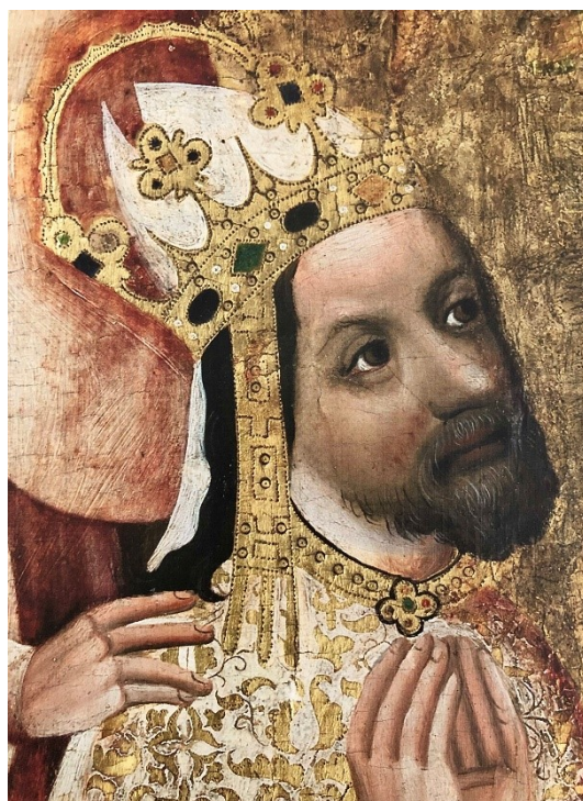
3. Detail votivní desky Jana Očka z Vlašimi, Karel IV. s římskou korunou, 2. pol. 14. st., Praha

Tato koruna ze zlaceného stříbra pravděpodobně vznikla v pražském prostředí jako osobní koruna Karla IV. To mohou dosvědčovat četná výtvarná vyobrazení císaře s touto korunou. Jedná se například o nástěnné malby na Karlštejně (cca 1350), v misálu Jana ze Středy z roku 1364, na votivní desce Jana Očka z Vlašimi [3] a mozaice s Posledním soudem na Zlaté bráně katedrály sv. Víta, Václava a Vojtěcha i v kapli sv. Václava tamtéž (kolem roku 1370). 43 Je evidentní, že výtvarní umělci věděli o přesné podobě koruny, aby docílili