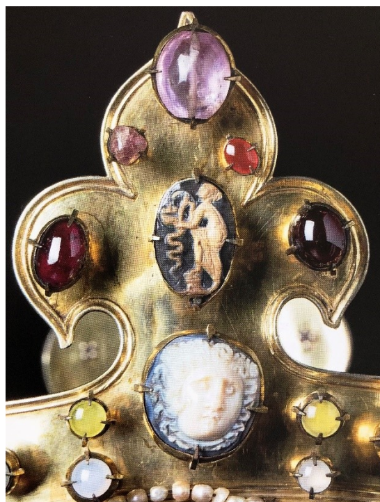
5. Římská koruna, detail, před 1349, Cáchy