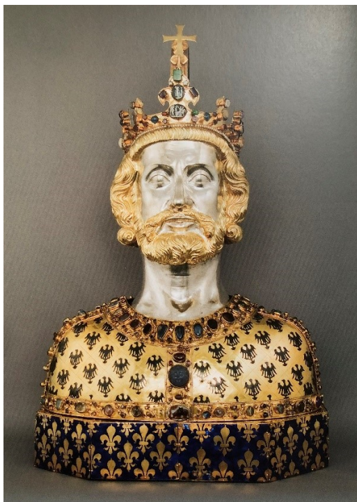
4. Koruna z relikviářové bysty, 14. st., Cáchy