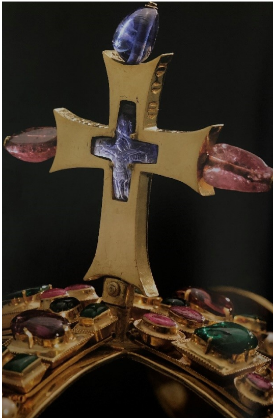
8. Svatováclavská koruna, detail křížku s kamejí, 1346