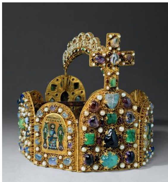
2. Koruna Svaté říše římské, 10. st., Vídeň

Zhotovení osmi dílů není náhodné, tvoří tím půdorys osmiúhelníku a tím protínajících se dvou čtverců, jež mají představovat dvě města, nebeský Jeruzalém a Řím. Ve Zjevení Janově najdeme paralelu „ Město je vystaveno do čtverce: jeho délka je stejná jako šířka. Změřil to město, a bylo to dvanáct tisíc měr. Jeho délka, šířka i výška jsou stejné. “ 39 Tvar oktagonu odkazuje i na půdorys kaple Karla Velikého v Cáchách, jež je zase připodobněna byzantské bazilice San Vitale v Ravenně. Symbolika osmi segmentů se vykládá připodobněním příběhu Potopy ze Starého zákona, kdy osm lidí, jež přežili, uzavřelo novou Boží smlouvu.