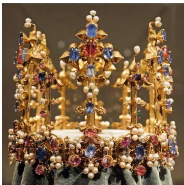
9. Koruna princezny Blanky, tzv. koruna česká, po 1370, Mníchov

Datuje se do doby poloviny 14. století podle nalezených mincí, které také poukazují na český původ koruny. Vzhledem k jejímu nálezu v židovské čtvrti ve Vratislavi se usuzuje, že byl celý poklad prodán či zastaven u židovských obchodníků Janem Lucemburským nebo Karlem IV. Dvorský kancléř Jan ze Středy totiž působil ve Slezské Středě jako kněz a mohl celý proces zprostředkovat. To by znamenalo, že koruna mohla patřit Elišce Přemyslovně, Elišce Rejčce anebo Blance z Valois. Na základě námětu orlů, jež drží v zobáčích kroužky – zásnubní prsteny, mohla být koruna svatebním darem. 67