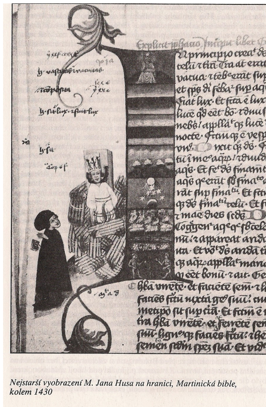
Nejstarší vyobrazení M. Jana Husa na hranici, Martinická bible, kolem 1430

Zdroj: Kolektiv autorů. Dějiny zemí koruny české . Praha: Paseka, 1992. ISBN 80-85192-29-2. str. 156