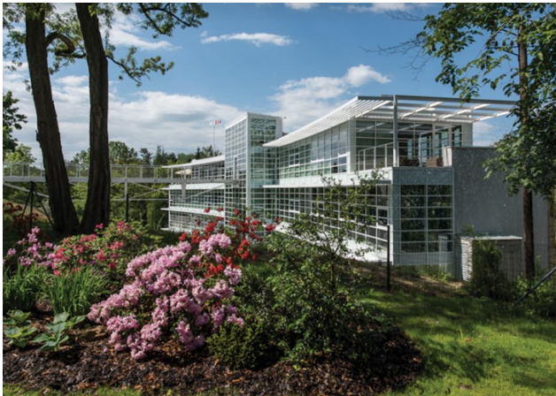
Obrázek 5: Pirkovo sanatorium - nyní