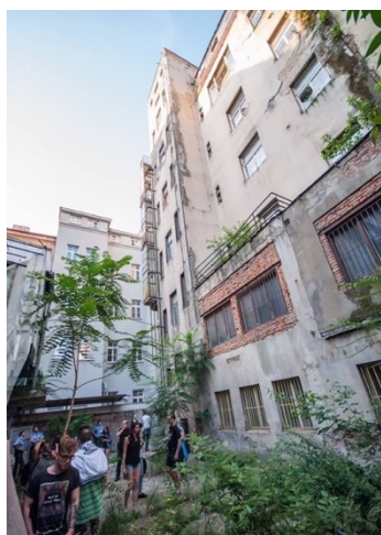
Obrázek 11: Borůvkovo sanatorium nyní

Zdroj: 11: Borůvkovo sanatorium, dvojdům Legerova 1627/61 a 1607/63 (Nové Město). Encyklopedie Prahy 2 [online]. Městská část Praha 2, 2018 - 2021 [cit. 2022-11-29]. Dostupné z: