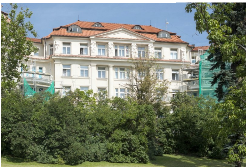
Obrázek 3: Sanatorium Podolí nyní