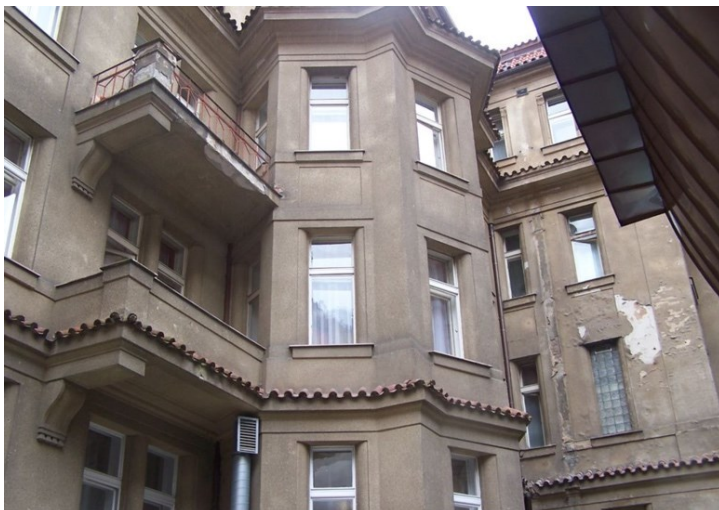
Obrázek 2: Sanatorium Podolí 1989