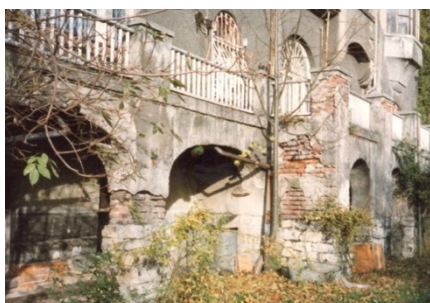
Obrázek 16: Vila Primavesi – 1989