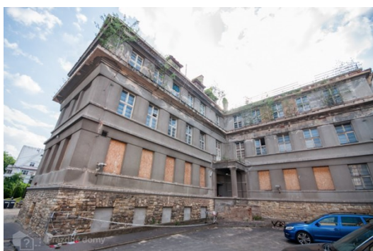
Obrázek 18: SANOPZ - nyní