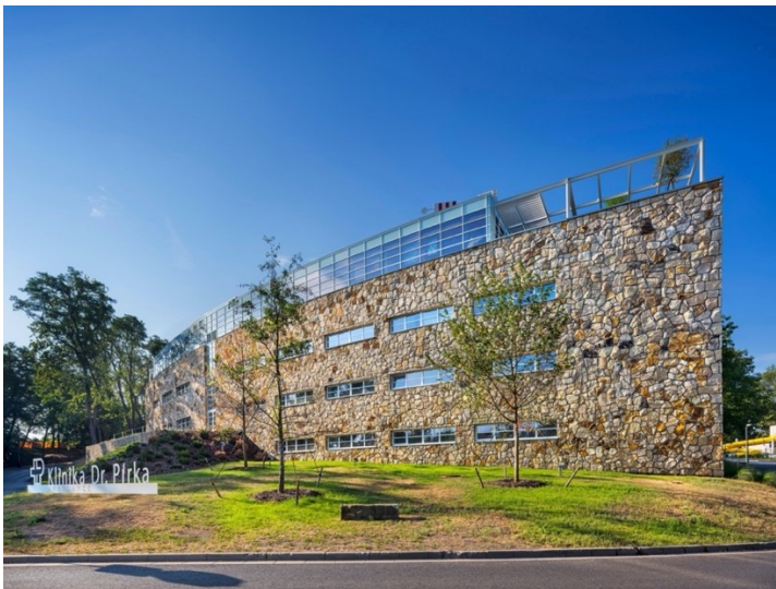
Obrázek 6: Pirkovo sanatorium – nyní

Zdroj: 6: Nová budova Kliniky Dr. Pírka. Archiweb [online]. Archiweb, 2022 [cit. 2022-11-29]. Dostupné z: https://www.archiweb.cz/b/nova-budova-kliniky-dr-pirka