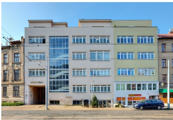
Obrázek 8: Šilhanovo sanatorium - nyní