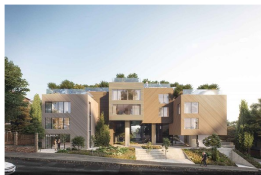
Obrázek 19 SANOPZ - plán