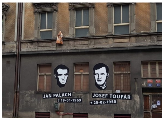
Obrázek 10: Borůvkovo sanatorium 1989