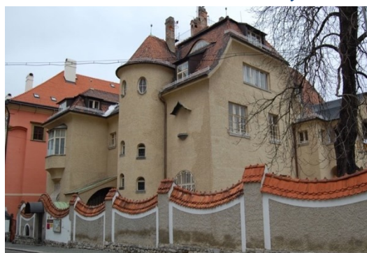
Obrázek 15: Vila Primavesi - nyní