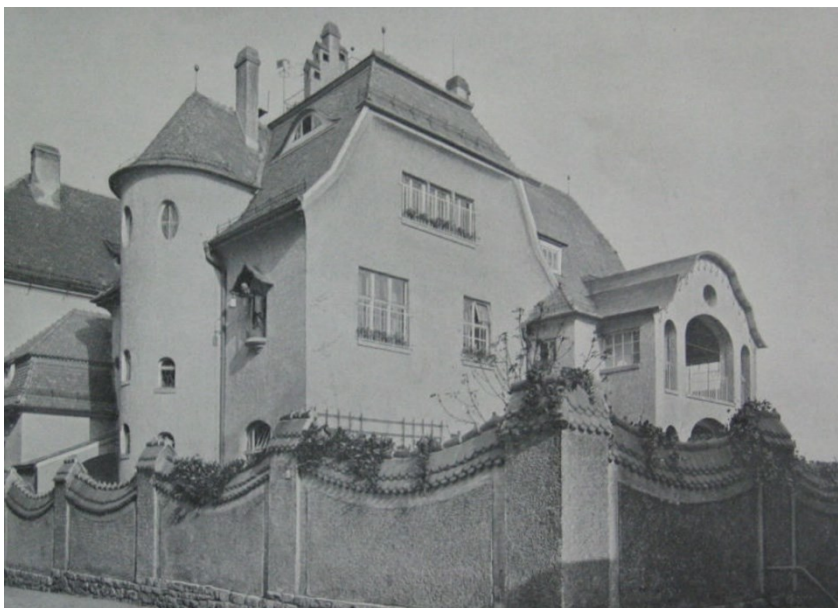
Obrázek 12: Vila Primavesi - historie