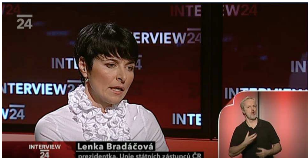
Interview ČT24 13.1. 2012