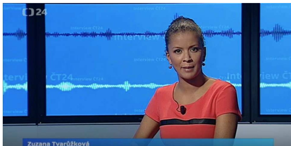
Interview ČT24, 31. 3. 2014