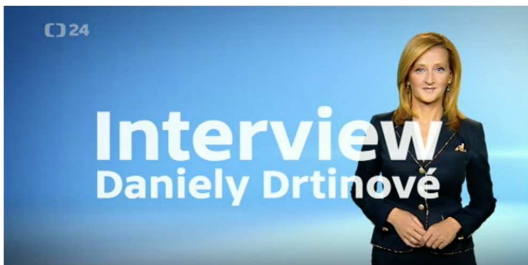
Příloha č. 7 - grafická podoba úvodního pásma pořadu v roce 2014-2021