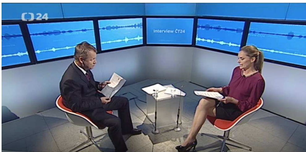
Interview ČT24, 8. 4. 2014