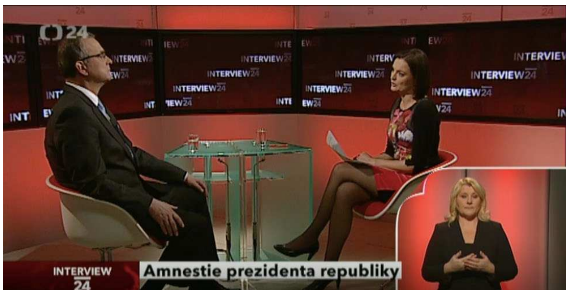
Interview ČT24, 2. 1. 2013