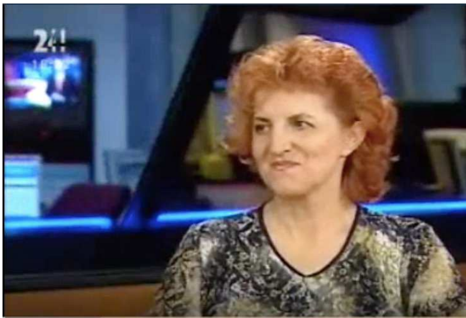
Interview ČT24 4.9. 2006