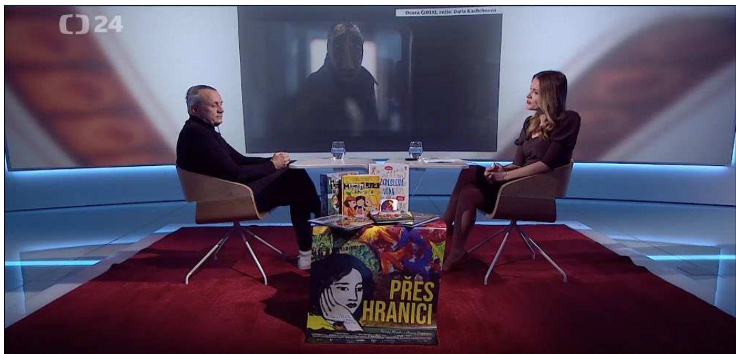
Interview ČT24, 11. 12. 2021