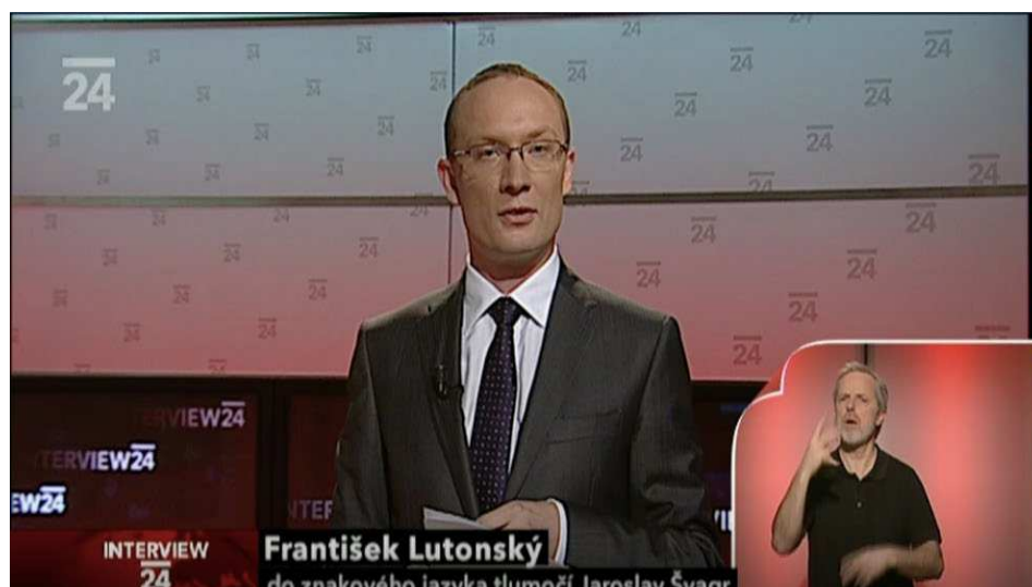
Interview ČT24 13.1. 2012