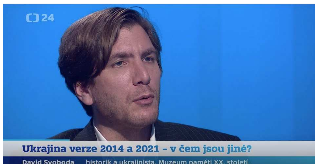
Interview ČT24, 10. 12. 2021