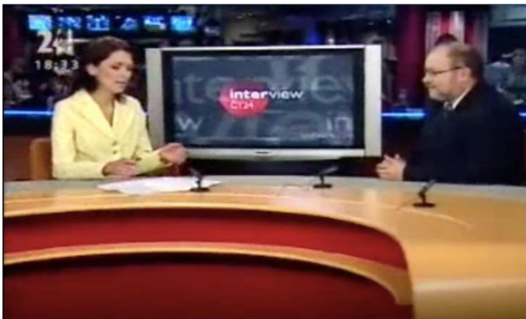
Interview ČT24 7.12. 2006