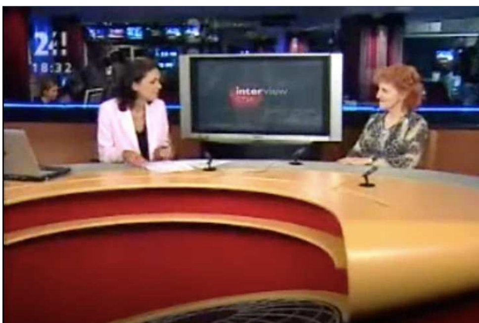
Interview ČT24 4.9. 2006