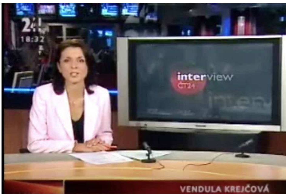
Interview ČT24 4.9. 2006