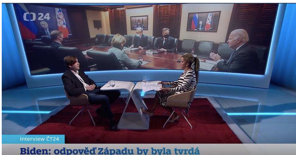
Interview ČT24, 10. 12. 2021