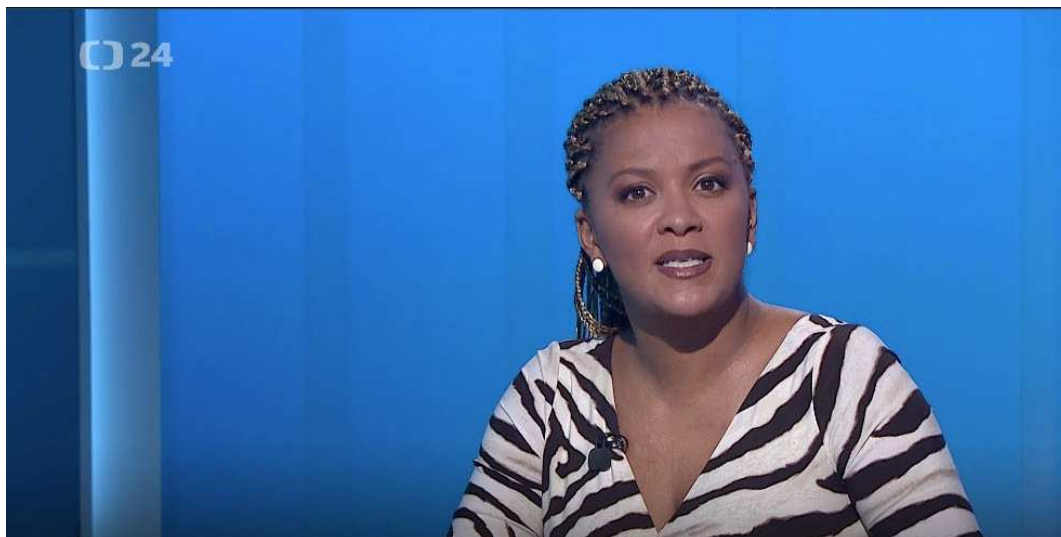
Interview ČT24, 10. 12. 2021