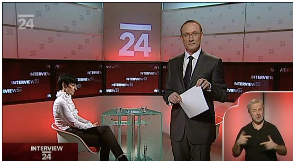
Interview ČT24 13.1. 2012