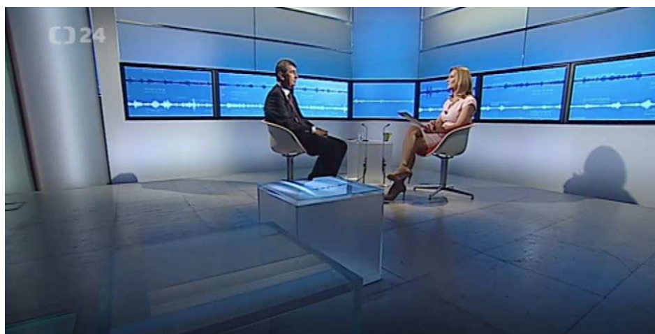
Interview Daniely Drtinové, 27. 3. 2014