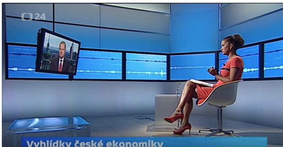
Interview ČT24, 31. 3. 2014