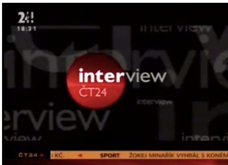
Příloha č. 4 - grafická podoba úvodního pásma pořadu v roce 2008-2013