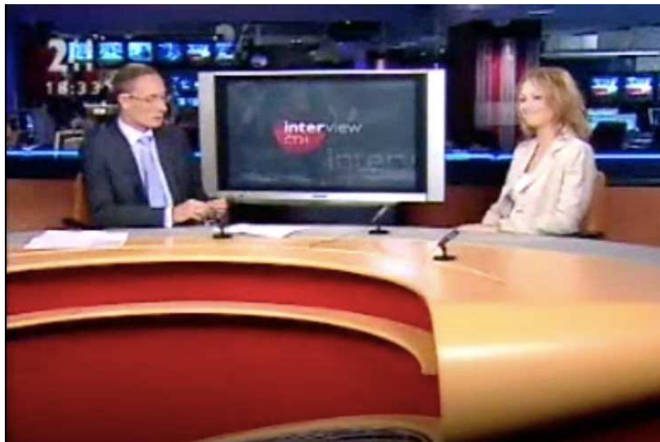
Interview ČT24 5.9. 2006