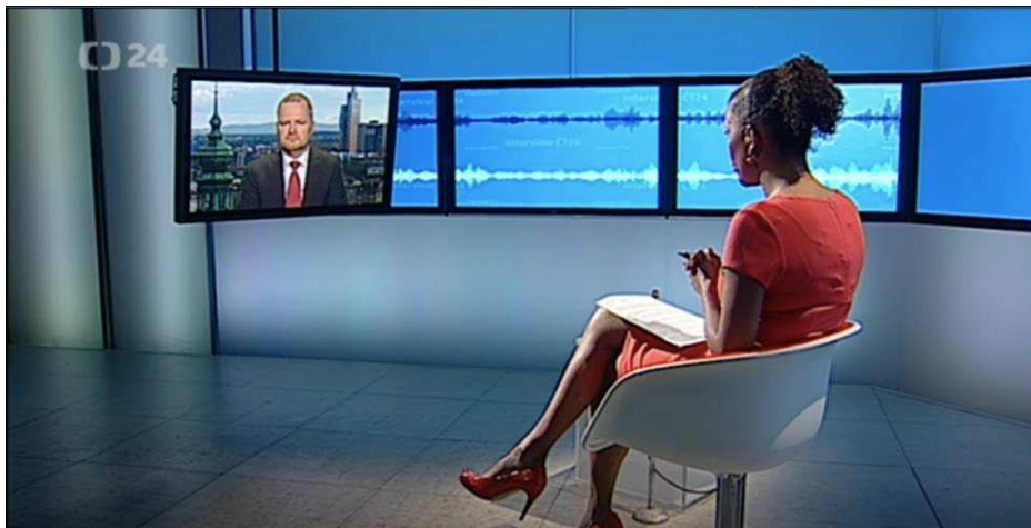
Interview ČT24, 31. 3. 2014