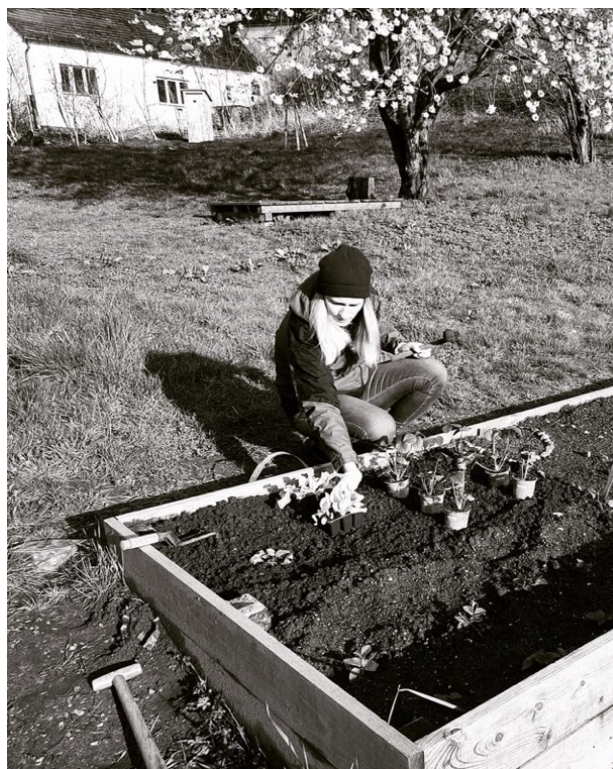
Obr. 2. První sázení rostlin

Poprvé jsem si šla zasadit jahody a saláty 24. dubna, protože jsem nějakou dobu čekala na příznivé zahrádkářské podmínky. První polovina dubna byla chladná a deštivá. Jelikož jsem se zahradničením moc zkušeností neměla, radila jsem se s rodinou, jaké volit techniky a co si zasadit. Poradili mi si na začátek zasadit sazeničky, abych měla větší jistotu, že vyrostou. Na zahradní slavnosti 27. dubna jsem si koupila od podporovatelky komunitní zahrady Laděny mátu, kterou prodávala v rámci akce. Prodávala vyrostlé sazeničky z vlastní zahrádky a výtěžek věnovala na údržbu komunitní zahrady. Během června jsem si na záhonek přidala dvě rajčata a mangold. Víc už se mi toho na můj malý záhonek nevešlo. Během jara jsem do zahrady chodila pravidelně, především o víkendech, když jsem zůstávala v Praze. Z domova do zahrady jsem to měla přes půl hodiny, což pro mě bylo časově náročnější víc, než by bylo potřeba. Většina návštěv komunitní zahrady vypadala podobně, abych ušetřila čas, brala jsem sebou do zahrady i svého psa a spojila to s příjemnou procházkou po okolí. V zahradě jsem zalila záhonek, nakypřila půdu a pozorovala, jestli se náhodou neobjeví někdo další, když jsme měla štěstí, tak jsem narazila na nějakého zahrádkáře.