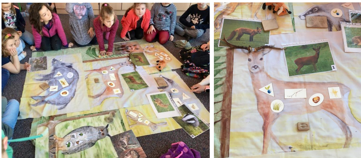
Obr. 5: Poznávání lesních zvířat