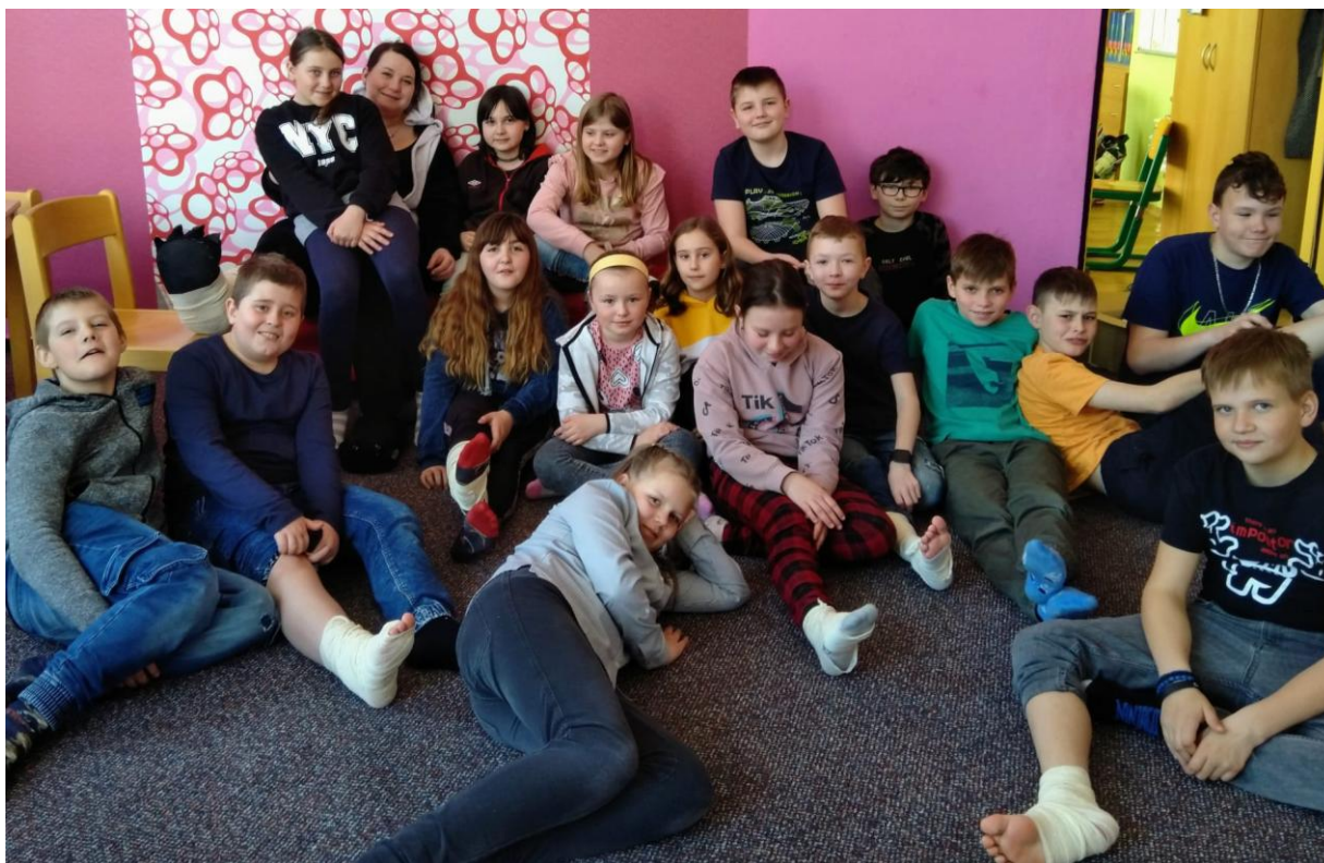
Obr. 3: Společná fotografie s obvázanými kotníky