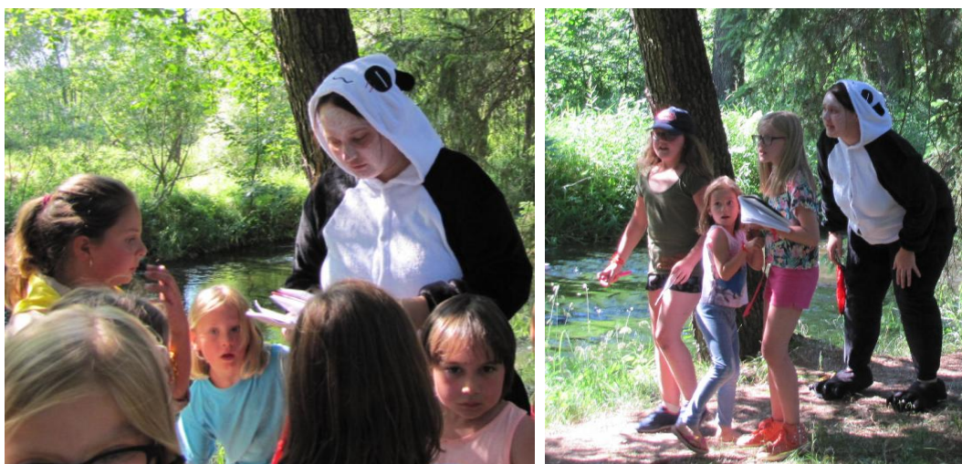
Obr. 1: První setkání s Pandou