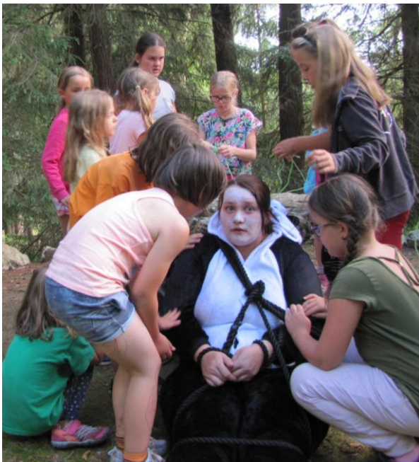
Obr. 2: Panda v nesnázích