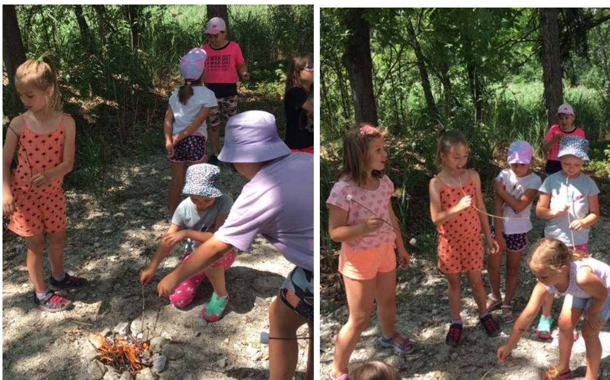
Obr. 4: Opékání marshmallow