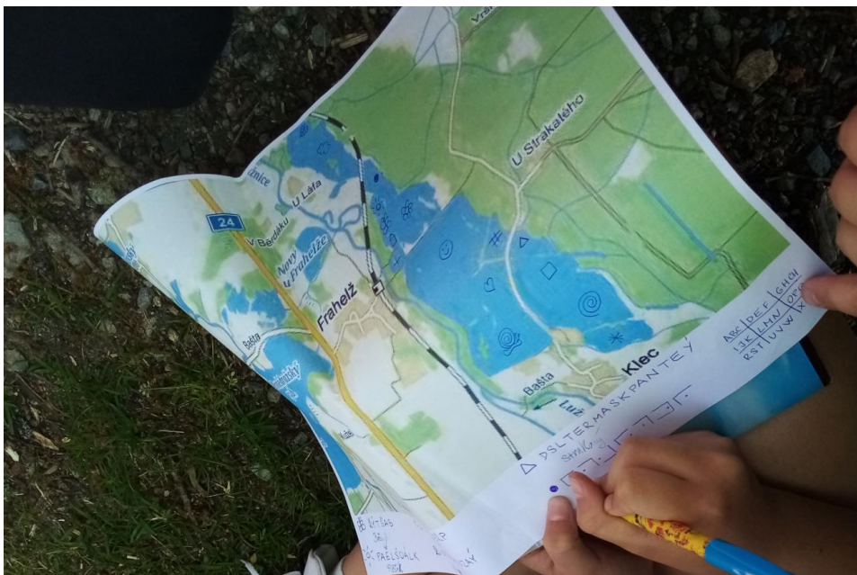
Obr. 9: Šifry