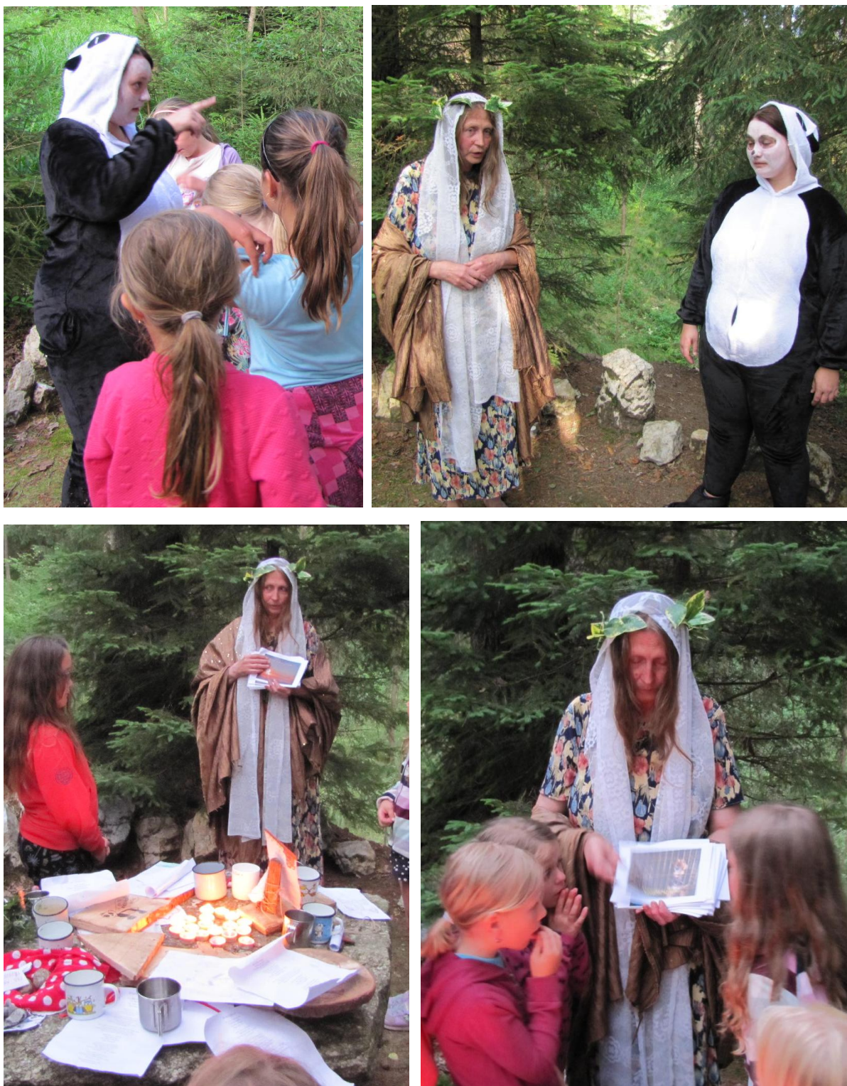
Obr. 10: Setkání s matkou přírodou.