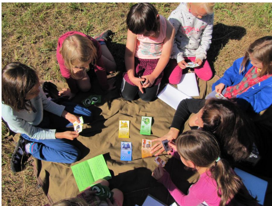
Obr. 6: Třídění odpadu