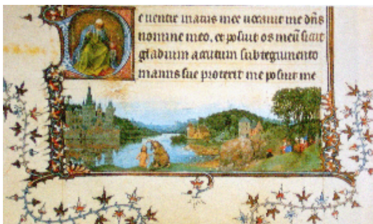
Křest Krista, iluminace pro knihu hodinek z r. 1424, Jan van Eyck, Turín, Museo Civico.