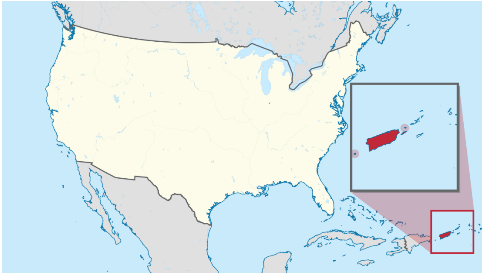
Obrázek č. 3: Portoriko. Puerto Rico in United States.