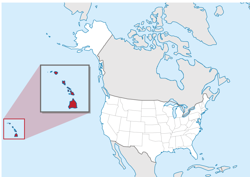
Obrázek č. 2: Havaj. Havaj na mapě USA. Wikipedia [online]. [cit. 2023-05-03]. Dostupné z: https://cs.wikipedia.org/wiki/Havaj#/media/Soubor:Hawaii_in_United_States_(zoom)_US50_(-grid).svg