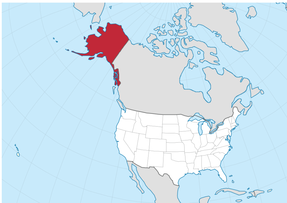
Obrázek č. 1: Aljaška. Map of the United States with Alaska highlighted. Wikipedia [online]. [cit.2023-05-02]. Dostupné z: https://en.wikipedia.org/wiki/Alaska#/media/File:Alaska_in_United_States_(US50).svg