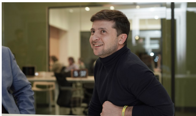
Obrázek 6 – Zelenskyy ve svém štábu