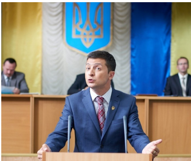
Obrázek 2 – Proslov ve sněmovně, zdroj www.facebook.com/sluga95