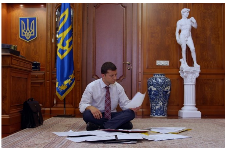
Obrázek 3 – První den v kanceláři