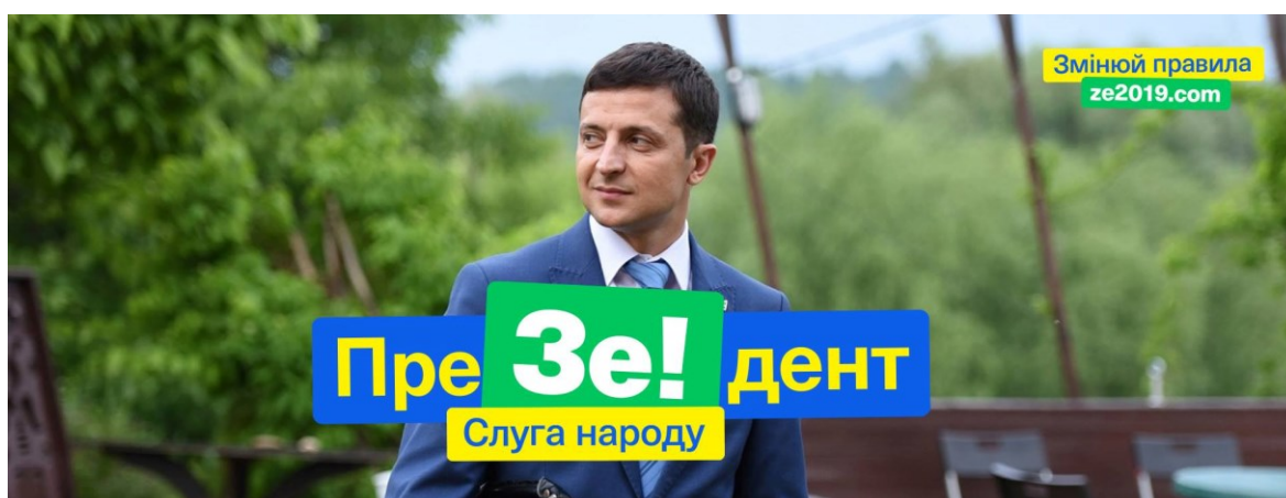
Obrázek 9 - PreZe!dent. Sluha národa (zveřejněno 31. 12. 2018).