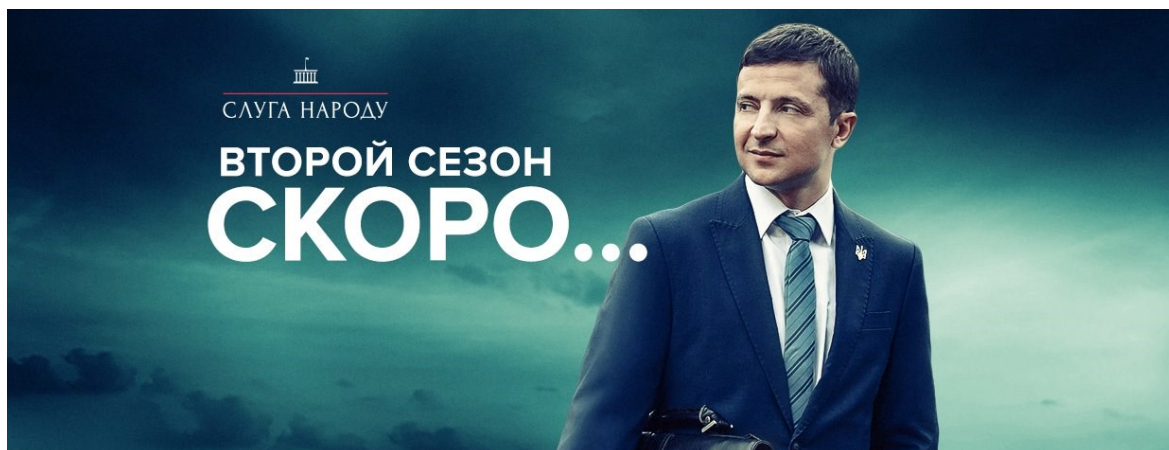
Obrázek 8 – Sluha národa. Druhá řada. Brzy..., (zveřejněno 09. 06. 2017).