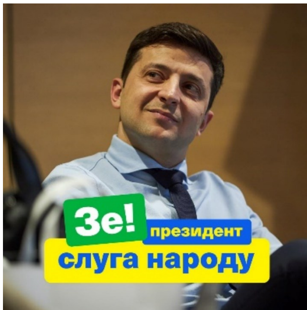
Obrázek 5 – Foto se sloganem, Ze! Prezident sluha národa, zdroj www.facebook.com/ze2019official