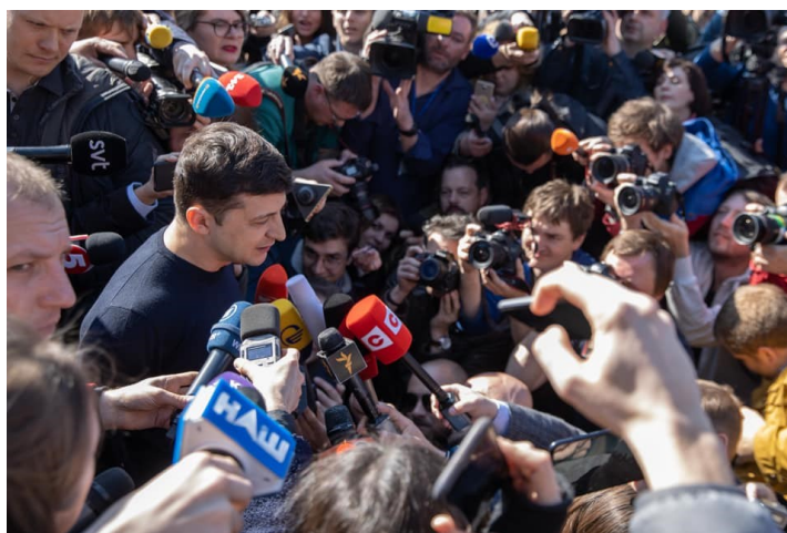
Obrázek 7 – Zelenskyy a novináři v den 1. kola voleb