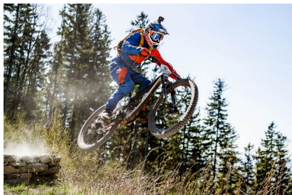
Obrázek 1: Dropdown race 2019, enduro

Obecně se za klíčový aspekt dobré sportovní fotografie považuje schopnost vystihnout a zachytit správný okamžik, čehož předpokladem je dokonalá znalost fotografovaného sportu. „Znalost pravidel a sportu samého umožní odhadnout, kde se bude odehrávat další akce, jaký je nejlepší moment pro fotografii, z jakého úhlu vypadá sportovní výkon nejlépe a podobně,“ 5 potvrzuje