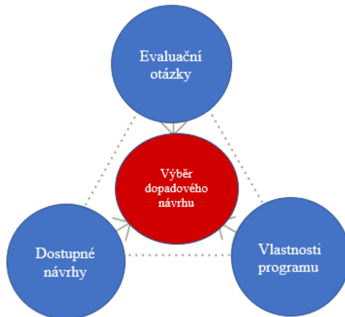
Obrázek 3 Evaluace dopadu, autorka dle Stern, 2015

Stern přináší tři faktory, které je potřeba vzít v úvahu při tvorbě vhodného návrhu evaluace dopadu. První z faktorů jsou tzv. hodnotící otázky, na které chceme získat odpovědi, „atributy“ programů, které chceme hodnotit a kapacity dostupných provedení. Druhy hodnotících otázek částečně ovlivňují výběr návrhů, zároveň musí brát v úvahu vlastnosti programu při porozumění druhům otázek, na které lze odpovědět. (Stern, 2015)