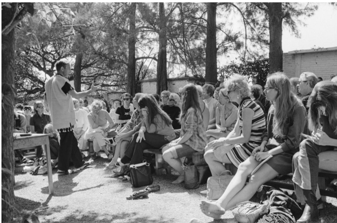
Fotka č. 3 – Ivan Illich (vlevo) vede přednášku v CIDOC