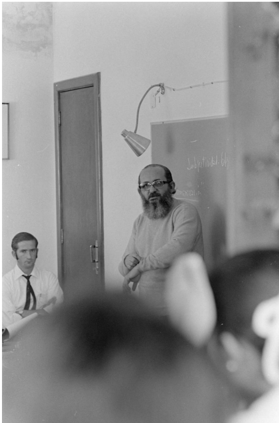
Fotka č. 2 – Paulo Freire přednáší v CIDOC