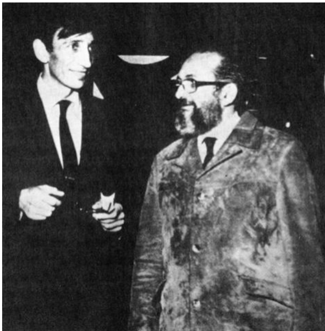
Fotka č. 4 - Ivan Illich (vlevo) a Paulo Freire (vpravo)