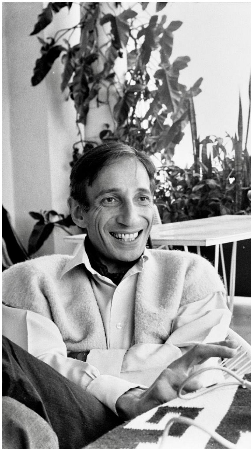
Fotka č. 1 - Ivan Illich