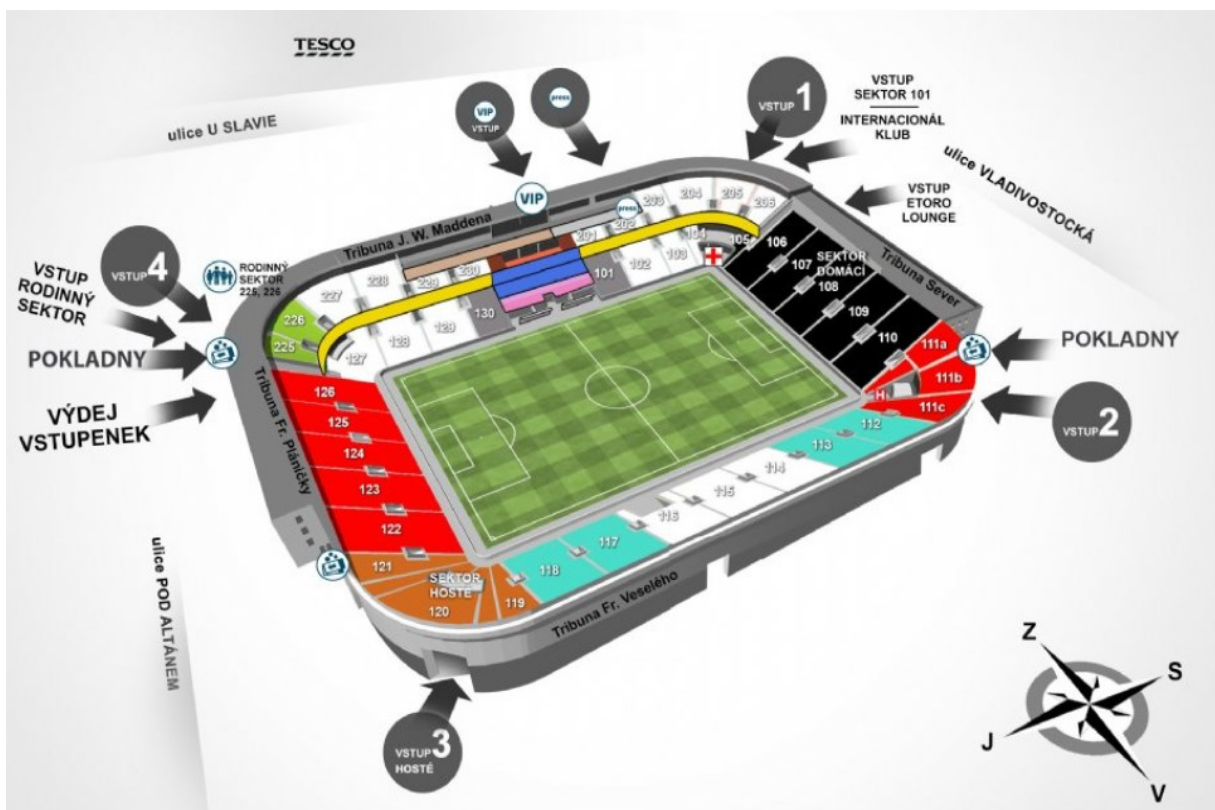
Příloha 3: Orientační plánek stadionu