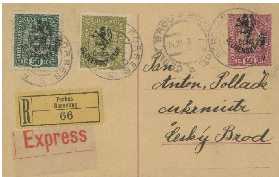
Obr. 4 – Budějovický (Hornerův) přetisk použitý na dopisnici adresované do Českého Brodu