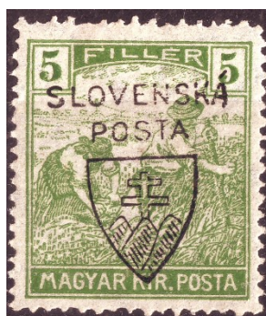
Obr. 5 – Jehličkův přetisk použitý na uherské známce typu ženci