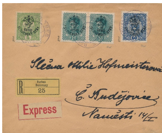
Obr. 3 – Hlbocký (Marešův) přetisk použitý na celistvosti adresované do Českých Budějovic (foto archiv autora)