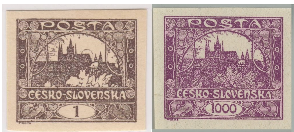
Obr. 6 – První Československé známky navržené Alfonsem Muchou – první a poslední hodnota z 26 základních hodnot