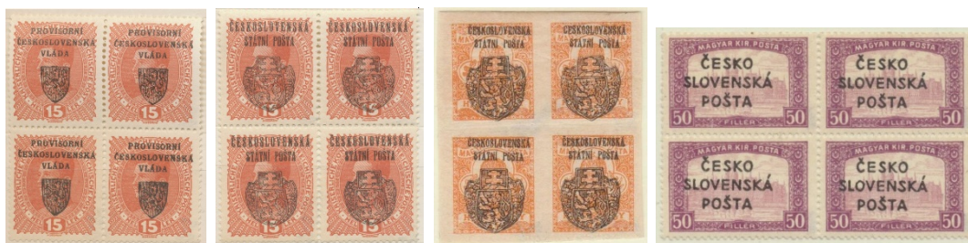
Obr. 1 - Pražský přetisk I (tzv. Malý znak), Pražský přetisk II (velký znak), Skalické a Žilinské vydání