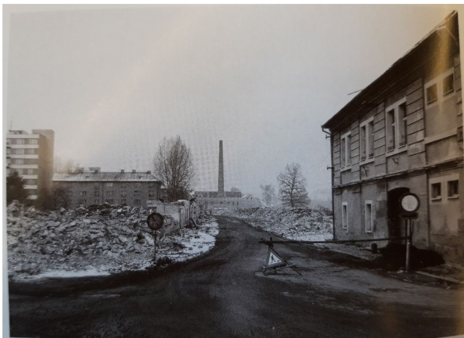
Obr. 16: V pozadí komín staré fezárnny (Jaroslava PIXOVÁ, Stará Portyč a Pražské předměstí, Písek 2013 , s. 148)