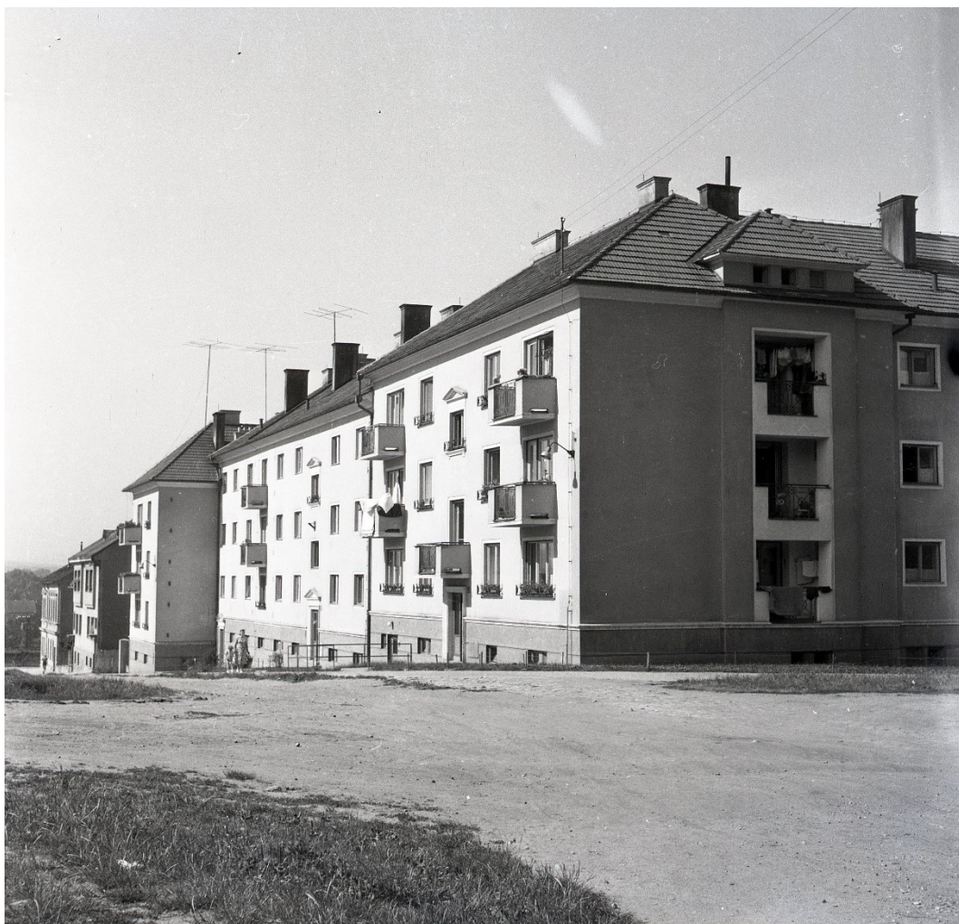
Obr. 6: Podniková výstavba v Heritesově ulici