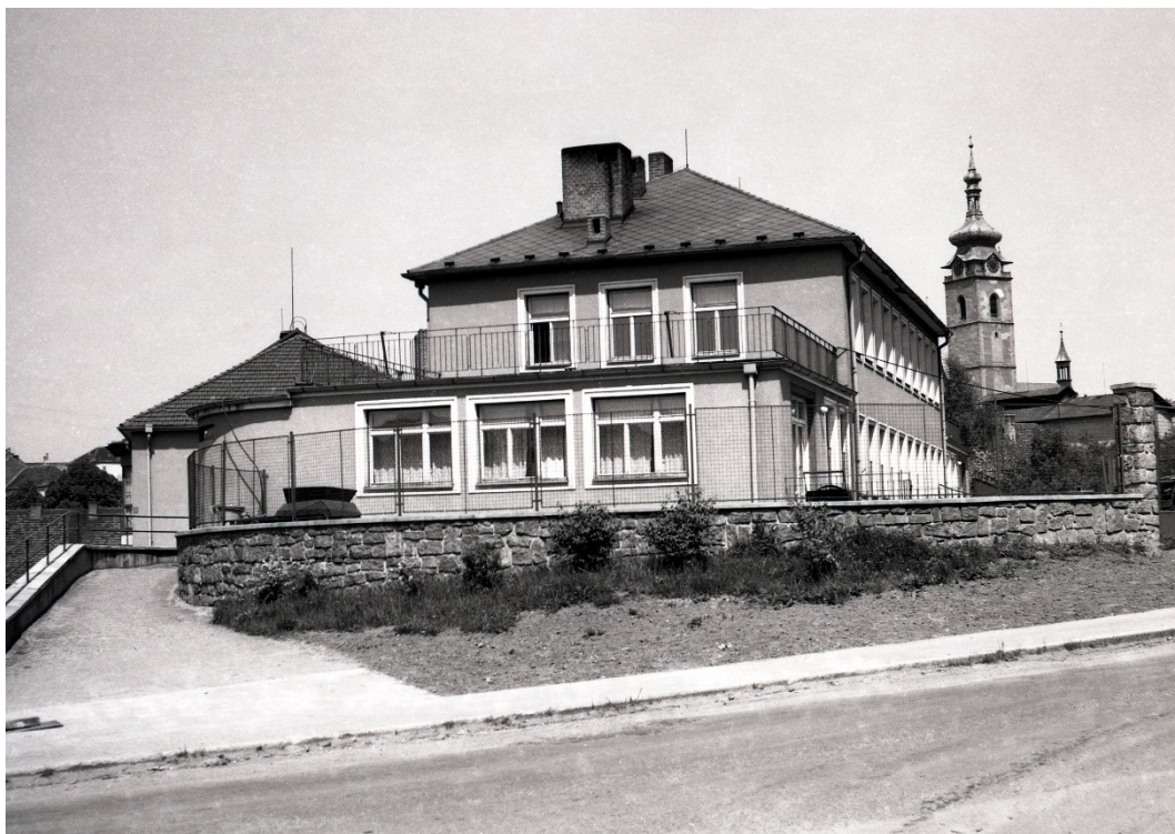
Obr. 9: Závodní jesle ve Švantlově ulici (Prácheňské muzeum v Písku, podsbírka historická)