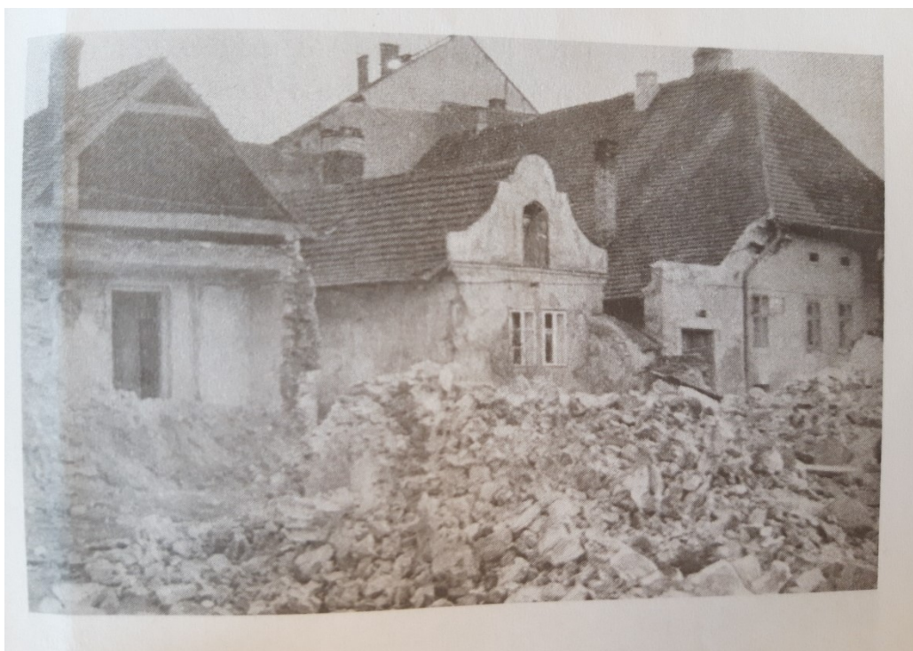
Obr. 14: Demolice domů v Rybářské ulici (Zdeněk MAGERSTEIN, Rybářská ulice. O ulici, která zmizela z mapy Písku , Písek 2009, s. 77)