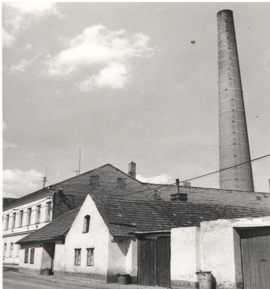
Obr. 1: Budova staré továrny na fezy v Písku