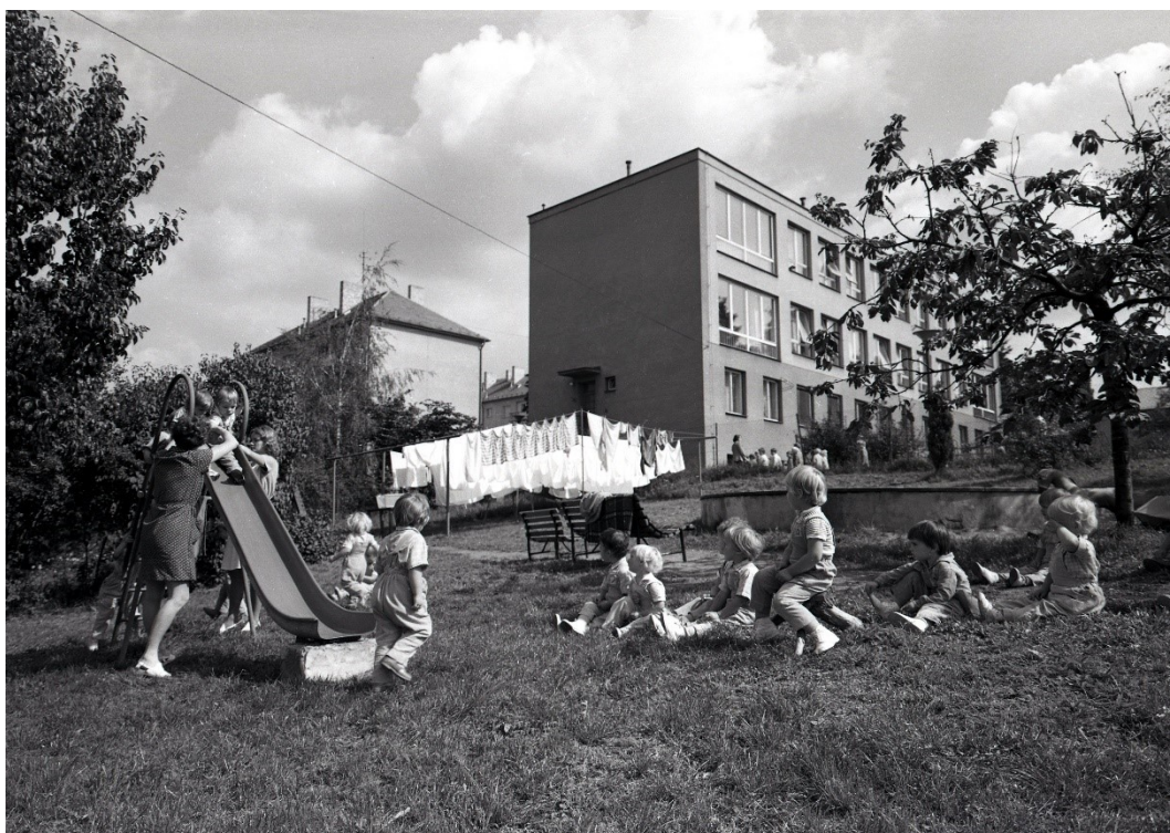
Obr. 10: Podniková mateřská škola v Zeyerově ulici (Prácheňské muzeum v Písku, podsbírka historická)