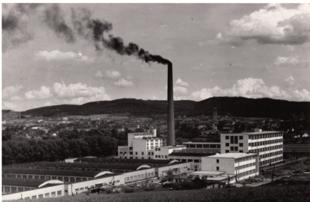
Obr. 4: Jitex jako důkaz pokroku socialistické modernity