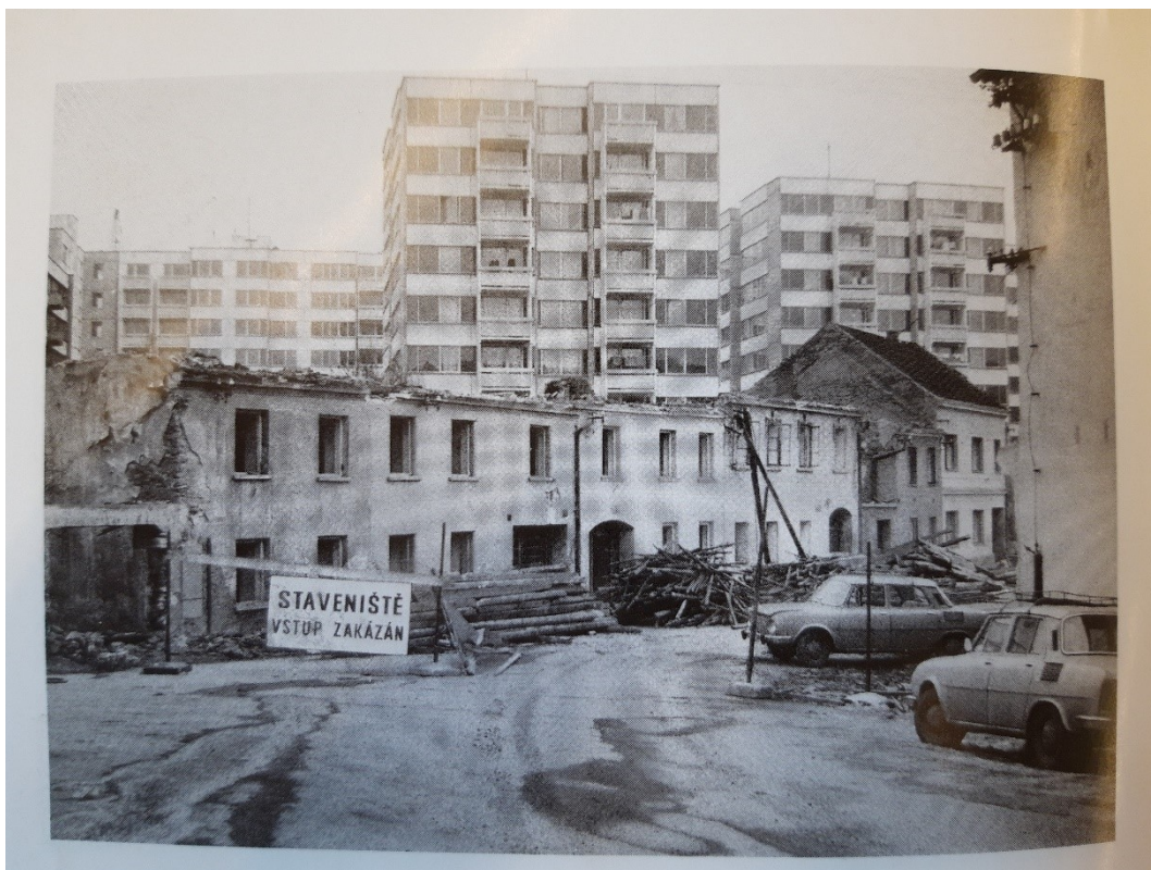
Obr. 15: Starý Písek se socialismem pomalu mizí. Kromě Rybářské ulice se staví též na Portyči (Jaroslava PIXOVÁ, Stará Portyč a Pražské předměstí, Písek 2013 , s. 150)