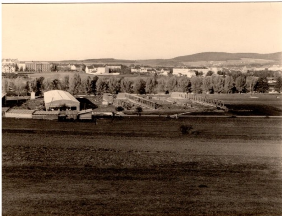
Obr. 2: Počátky stavebních prací na prvních továrních halách Jitexu (SOA Třeboň, odd. České Budějovice, f. Jitex, s. p. Písek, Fotoalbum o budování a životě n. p. Jitex)