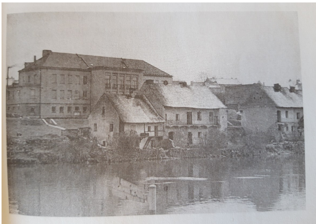
Obr. 13: Nově vznikající výstavba vytlačuje staré domy (Zdeněk MAGERSTEIN, Rybářská ulice. O ulici, která zmizela z mapy Písku , Písek 2009, s. 69)