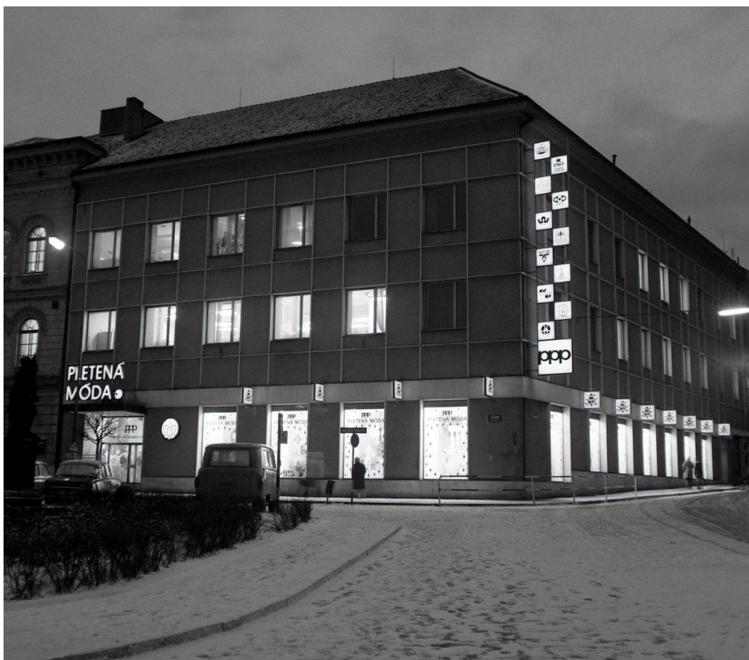
Obr. 7: Budova prodejny pletářského průmyslu PPP na Malém náměstí (Prácheňské muzeum v Písku, podsbírka historická)