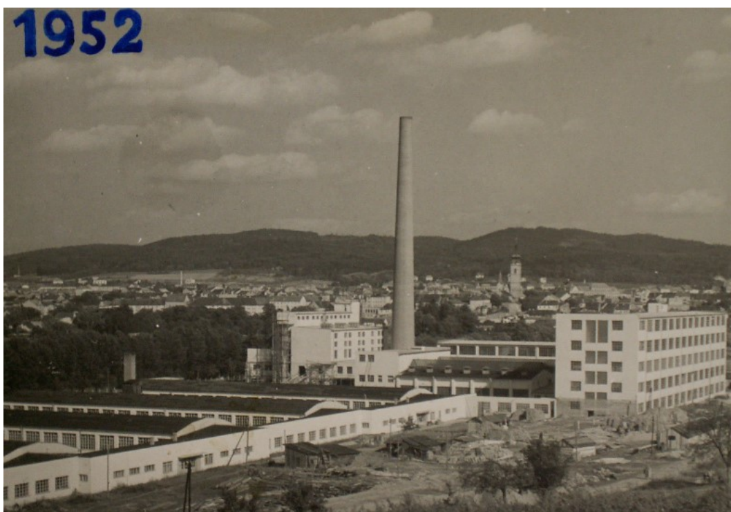
Obr. 3: Tovární komplex v roce 1952. V pozadí dominantní věž děkanského kostela