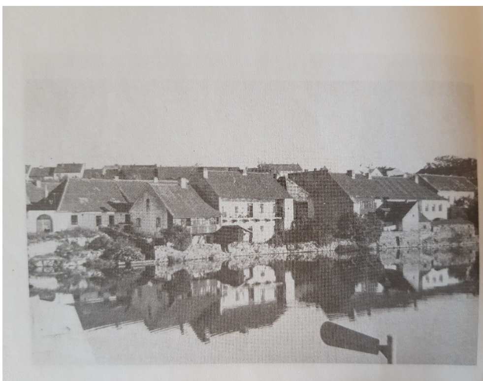
Obr. 12: Rybářská ulice (Zdeněk MAGERSTEIN, Rybářská ulice. O ulici, která zmizela z mapy Písku , Písek 2009, s. 72)