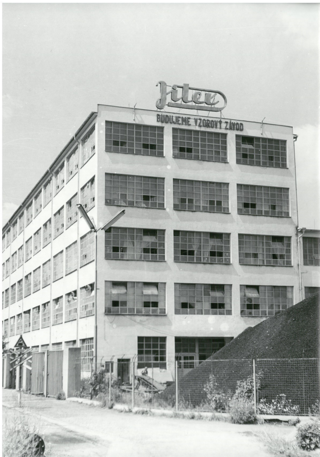
Obr. 5: Pětipatrová budova konfekce, úpravny a skladů – Jitex jako vzorový závod (Prácheňské muzeum v Písku, podsběrka historická)