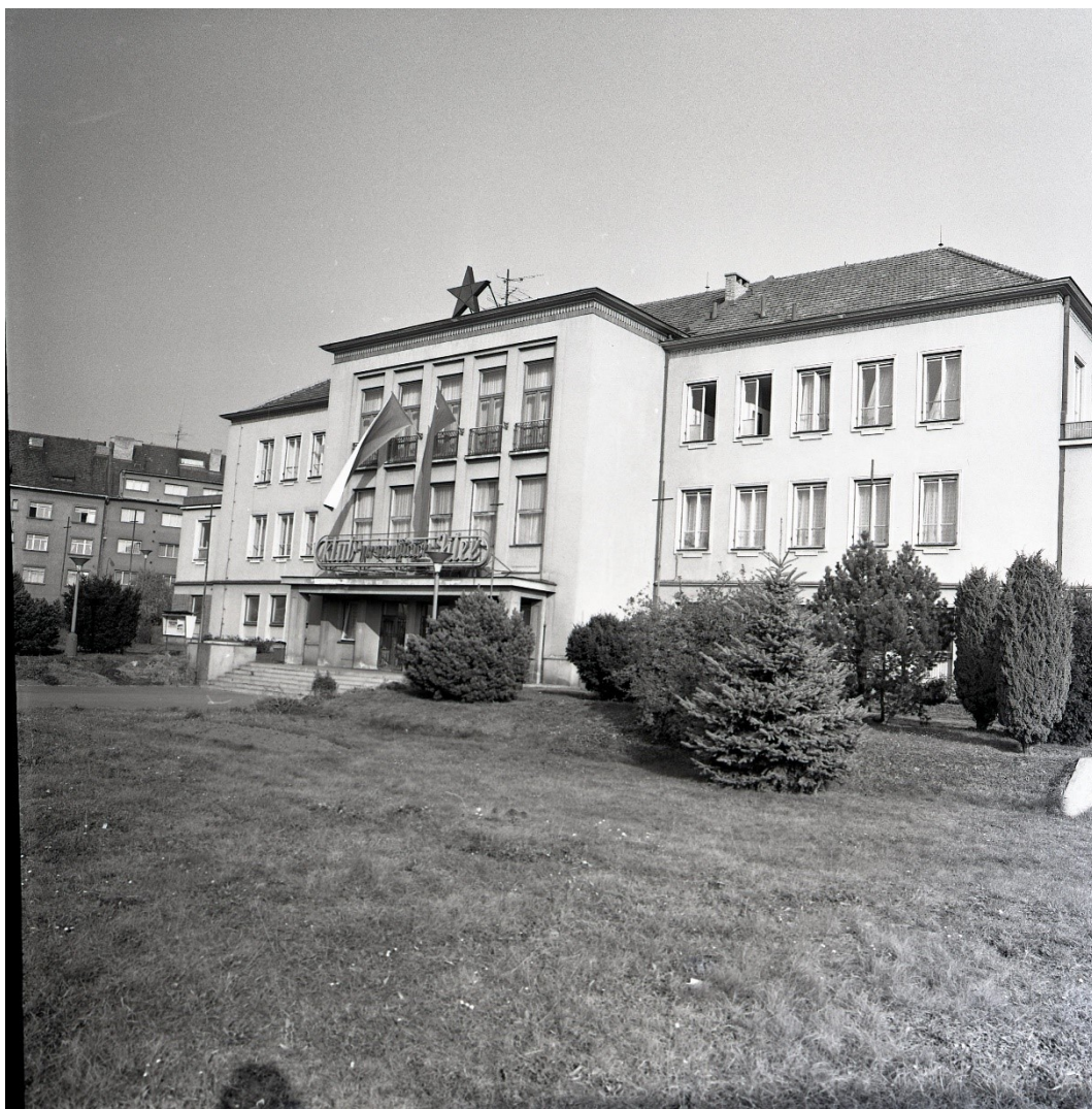
Obr. 8: Klub pracujících na Nábřeží 1. máje (Prácheňské muzeum v Písku, podsbírka historická)