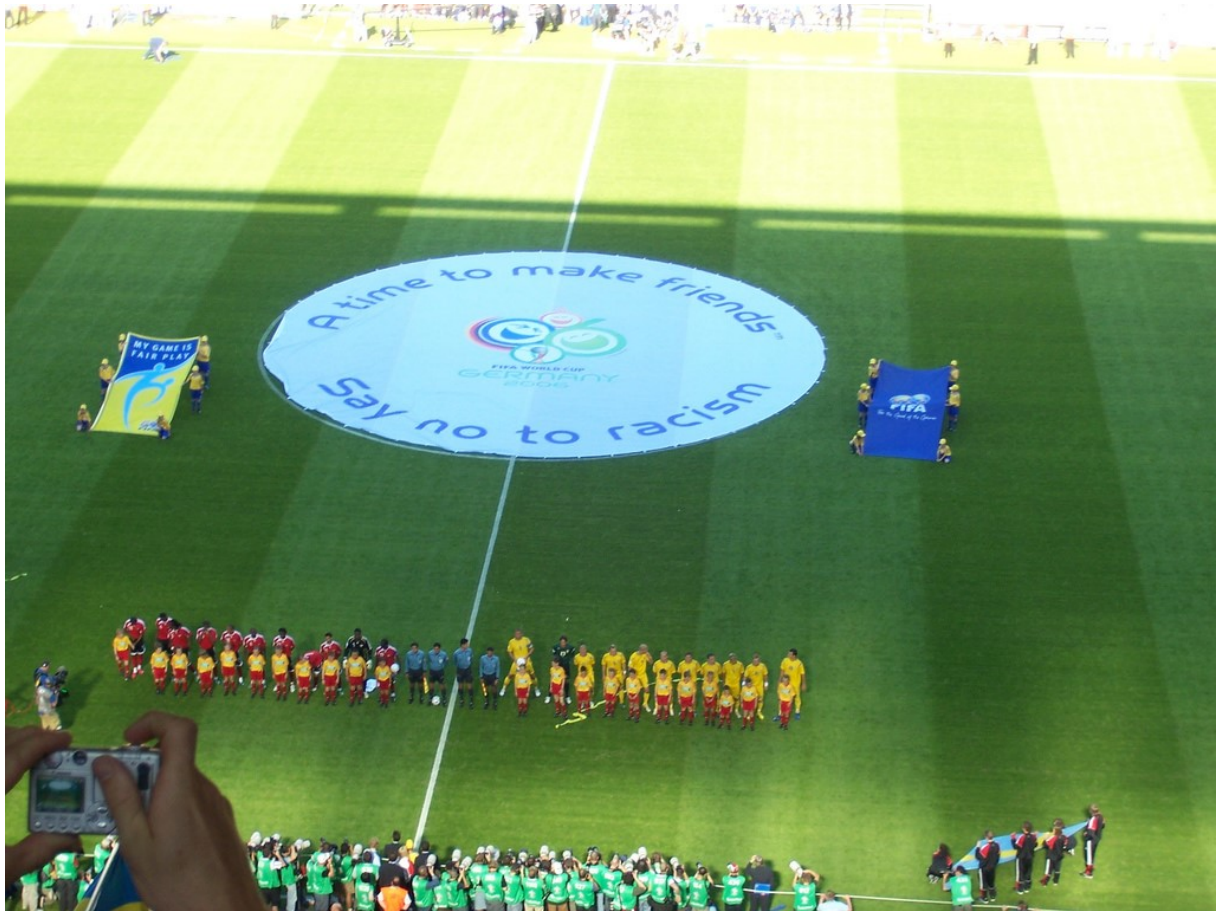
Obr. 3 Emblém se sloganem Mistrovství světa 2006 v Německu